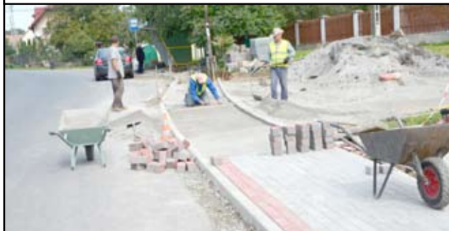
Ekipy remontowe można też spotkać w Pożarzysku. Ponad 300 metrów kwadratowych nowej kostki zostanie wyłożone na budowanym chodniku