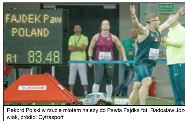
Rekord Polski w rzucie młotem należy do Pawła Fajdka

Kamila Skolimowska, złota medalistka Igrzysk Olimpijskich zmarła niespodziewanie 18 lutego 2009 roku. Miała 27 lat. Piąty