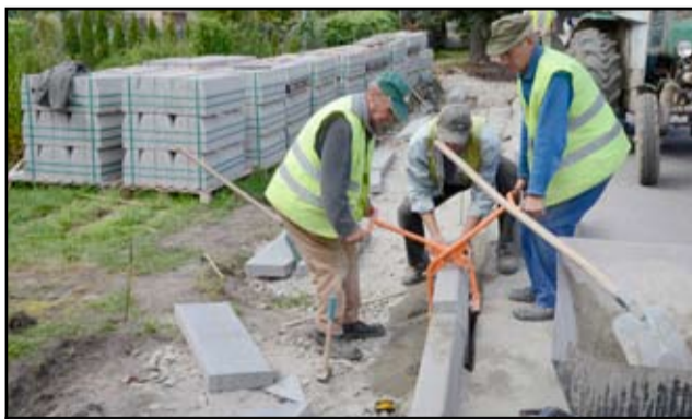
W Imbramowicach powstaje właśnie 220 metrów bieżących nowego chodnika