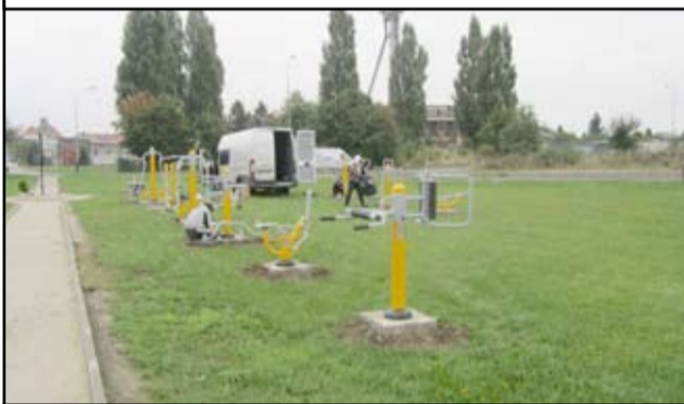
Plac siłowni „Pod Chmurką” przed remontem