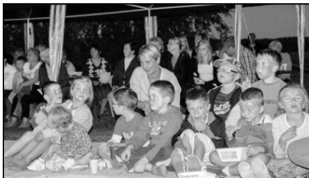
Projekt „Different Point of View” wspierała telewizja HBO Polska, Studio Munka, Stowarzyszenie Filmowców Polskich, Firma Soul Seed Media, Ogólnopolski Festiwal Filmów Animowanych O! pla, Agencja Reklamowa Geospace, Gminny Ośrodek Kultury w Mietkowie oraz firma Krzywy Kadr