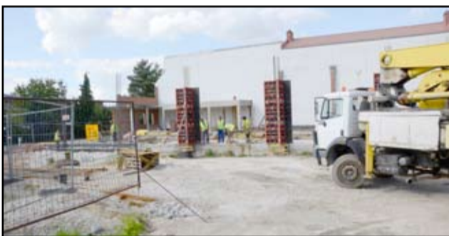
To najbardziej wyczekiwana inwestycja w Żarowie

Kompleks pływacki, który powstaje w tym miejscu będzie jednym z najnowocześniejszych obiektów. Do dyspozycji mieszkańców, obok głównej niecki będzie również brodzik, jacuzzi i wiele atrakcji dla najmłodszych. Pływalnia spełni także rolę miejsca do nauki pływania, którego tak bardzo w Żarowie brakowało. – Basen w Żarowie nie wygląda już tylko jak pobożowisko, a niektóre elementy kąpieliska nabierają nawet konkretnych kształtów. Prace idą w szybkim tempie, ale co się dziwić, skoro na placu budowy codziennie widać robotników i ciężki sprzęt. Basen podobno ma być nowoczesny. Nie możemy się doczekać jego końcowego efektu – mówią Żarowianie, którzy obserwują postęp prac przy budowie basenu. Czekali na niego wiele lat.