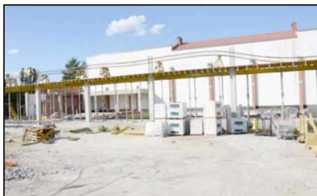
Nowe kąpielisko w Żarowie przybiera coraz to nowego kształtu