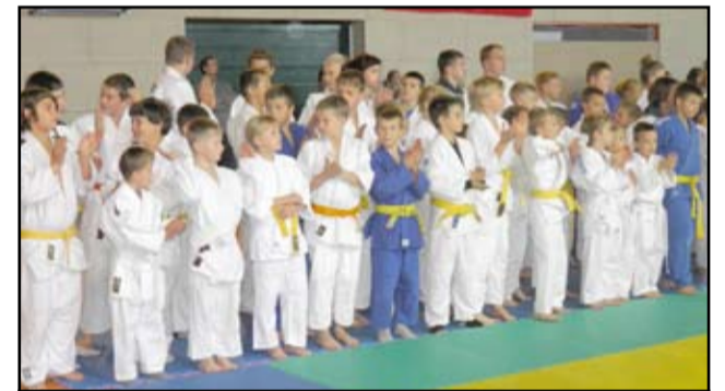
Od pięciu lat niezmiennie organizatorami turnieju judo jest gmina Żarów, UKS Judoka Imbramowice, Gminne Centrum Kultury i Sportu w Żarowie oraz Starostwo Powiatowe w Świdnicy

Sportowy turniej, podobnie jak w poprzednich latach połączony zostanie z obchodami jubileuszu XIII-lecia żarowskiej podstrefy Wałbrzyskiej Specjalnej Strefy Ekonomicznej „Invest-Park”. Tegoroczną, jubileuszową edycję Honorowym Patronatem obejmie Ambasada Japonii. – Nasza dyscyplina sportowa zyskała wielu sympatyków. A Żarów jest tego najlepszym przykładem. Tutaj trenują nawet przedszkolaki! Po cichu, liczę, że niektórym z nich uda się zrobić jeszcze wielką karierę sportową. Tak, jak Pawłowi Fajdkowi , ubiegłorocznemu mistrzowi świata, który przecież też jest Żarowianinem. W poprzedniej edycji turnieju wystartowało blisko 320 spor-