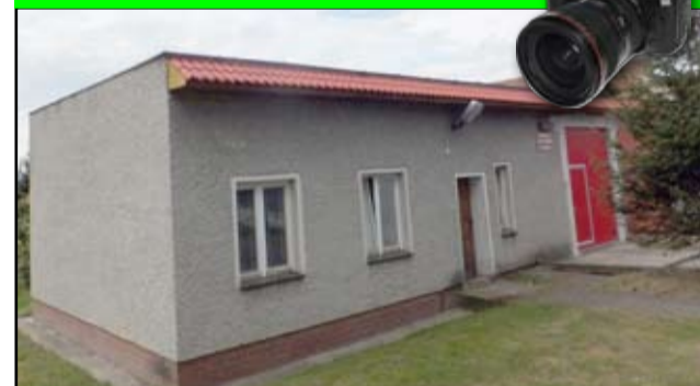
Remiza strażacka w Pożarzysku z nowym dachem. Stary i zniszczony nie nadawał się już do użytku. Dach został wyłożony nową papą. Dokonano także wymiany obróbek blacharskich. Inwestycja strażacka pochłonęła w sumie ponad 18 tysięcy złotych. Środki finansowe pochodziły z budżetu gminy Żarów.