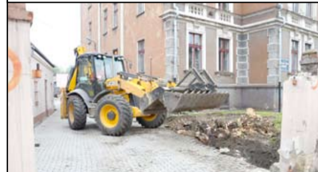
Przy żarowskiej podstawówce przy ul. Armii Krajowej powstaje nowy parking. Na przyszkolnym terenie zostanie położone 90 metrów nowej kostki betonowej. W tej chwili trwają prace przygotowawcze. Zniknęła również stara brama wjazdowa