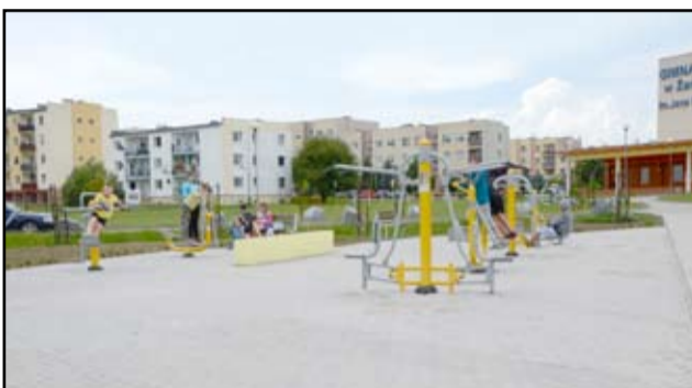
Plac przy ścieżce zdrowia w Żarowie nabral zupełnie nowego wyglądu. Gdy tylko dopisuje pogoda, mieszkańcy przychodzą tutaj niemal codziennie