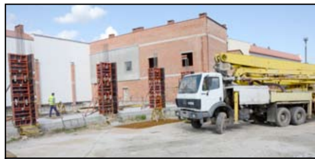
Jak zapewnia wykonawca firmy, do końca tego roku obiekt basenowy ma zostać w całości zadaszony

Zespół żarowskiego Ośrodka Pomocy Społecznej wraz z wdzięczną Podopieczną