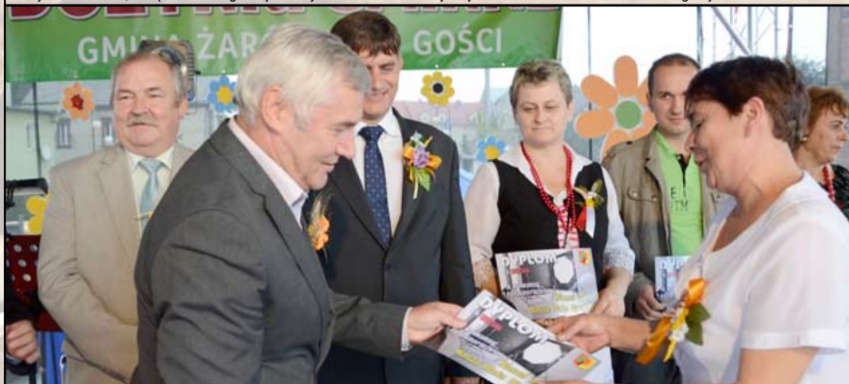
Sołectwa z gminy Żarów startowały również w konkursie fotograficznym i filmowym „Nasza wieś- nasza mała ojczyzna” organizowanym przez żarowski Urząd Miejski. Zwyciężyli mieszkańcy Siedlimowic. W konkursie filmowym pierwsze miejsce zajęli członkowie żarowskiego Związku Emerytów Rencistów i Inwalidów. Nagrody w tych konkursach ufundowali postowie na Sejm RP Katarzyna Izabela Mrzyglocka i Robert Jagła oraz senator RP Wiesław Kilian.