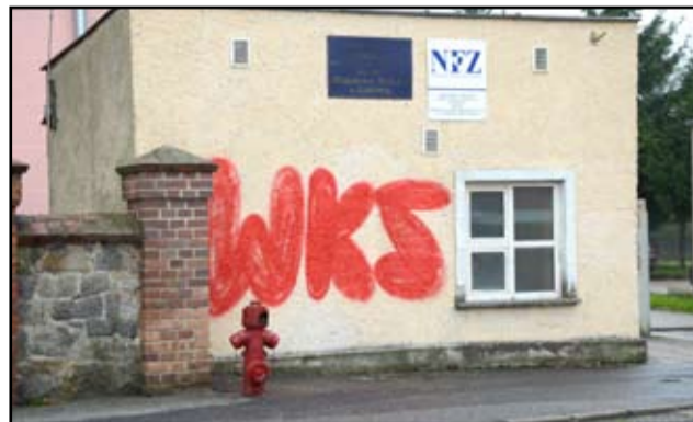
Czy jest jakiś skuteczny sposób na zahamowanie tak chuligańskiej działalności?