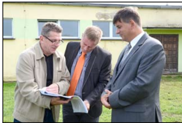
Przygotowanie terenów pod nowe inwestycje wymagało wielu uzgodnień.