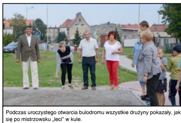
Podczas uroczystego otwarcia bulodromu wszystkie drużyny pokazały, jak się po mistrzowsku „leci” w kule.

Bule to tradycyjna francuska gra towarzyska. Należy do najliczniej reprezentowanych dyscyplin sportu na świecie. Nazywana jest również petanką, czyli grą w kule. Jest bardzo popularna we Francji, ale również w innych krajach europejskich czy regionach świata. Jej rozgrywki odbywają się zawsze na pozbawionym trawy placu, tak zwanym bulodromie. Gra polega na rzucaniu z wytyczonego okręgu metalowymi kulami w kierunku małej drewnianej lub plastikowej kulki nazywanej „świnką”. Jest to gra na punkty i trzeba ich w sumie zebrać 13. Traktuje się ją jako formę zabawy.