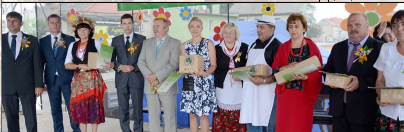
Podczas tegorocznych dożynek Lokalna Grupa Działania „Szlakiem Granitu” rozstrzygnęła konkurs na najpiękniejsze stoisko dożynekowe i najsmaczniejszy produkt regionalny. W konkursie na najładniejsze stoisko zwyciężyło sołectwo Pyszczyzna, drugie miejsce zajęli mieszkańcy Mikoszewej, trzecie natomiast Kalna. Bezkonkurencyjnym produktem regionalnym okazały się „Pierogi z bobem” z Gołaszyc, na drugim miejscu uplasowała się „Nalewka cytrynowa” oraz „Ciasto cytrynowiec” z Mrowin, na trzecim natomiast „Placki ziemniaczane” z Imbramowic.