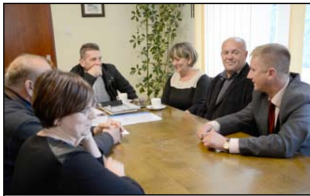
Umowa z wykonawcami budowy nowych świetlic środowiskowych została podpisana początkiem września.

To będą takie małe centra kultury. Oprócz lekcji wychowania fizycznego, w nowych świetlicach będziemy prowadzić zajęcia terapii pedagogicznej i koła zainteresowań. Dzieci nareszcie będą miały swój własny kąt i swoje miejsce do zabawy. Mrowiny to największa wieś w naszej gminie. Chcemy się rozwijać i mieszkać w zadbanej miejscowości.