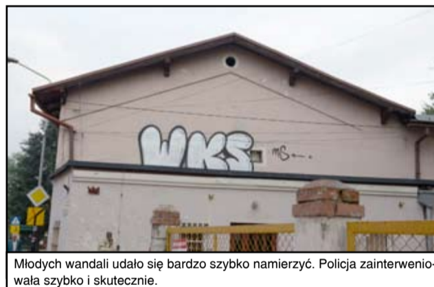
Młodych wandal udało się bardzo szybko namierzyć. Policja zainterweniowała szybko i skutecznie.

W sumie zniszczenia odnotowano na budynku sali