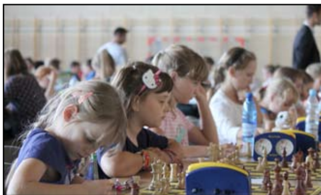
Rokrocznie żarowskie mistrzostwa województwa gromadzą przy szachownicach wielu zawodników tej dyscypliny sportu.

D o Żarowa zawitali młodzi szachiści z całego województwa, rywalizując o miano mistrza Dolnego Śląska.