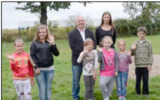
Nowa sala gimnastyczna to wspólne marzenie mieszkańców Mrowin.