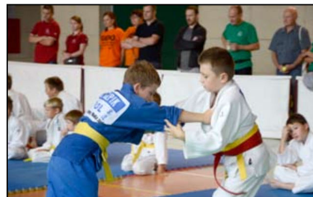
Sponsorem strategicznym żarowskiego turnieju była Wałbrzyska Specjalna Strefa Ekonomiczna „Invest Park”.

Więcej zdjęć z mistrzostw i wyniki znajdują się na stronie internetowej www.um.zarow.pl