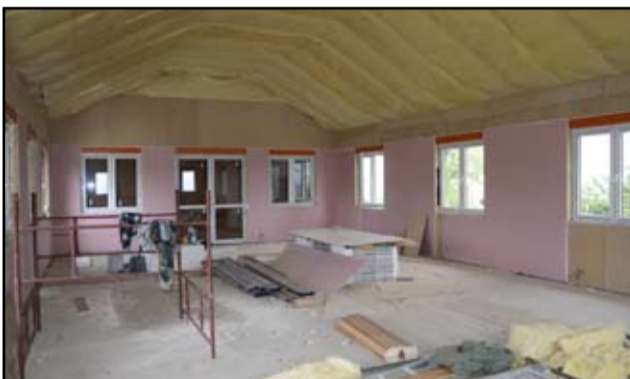
Nowa świetlica w Pyszczyńcu też prezentuje się bardzo okazale.