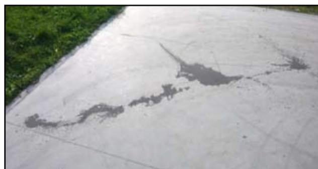
Młodzi Żarowianie dbają o „swój” skatepark. Nie tylko zainterweniowali w sprawie dewastacji, ale sami próbowali również usunąć ślady zniszczenia.

Projekt żarowskiego skateparku był konsultowany z grupą młodzieży. To właśnie w porozumieniu z nimi powstał nowoczesny obiekt, na którym młodzi mogą ćwiczyć do woli. Na zniszczonych urządzeniach trudno jest jednak trenować. Dlatego młodzi Żarowianie sami zaangażowali się w naprawę zniszczonego sprzętu. I w wolnej chwili próbują usunąć ślady po wylanym oleju silnikowym. Gorzej będzie w przypadku betonowej płyty, na której usytuowany jest skatepark. Tam zniszczenia trudno będzie całkowicie wyeliminować.