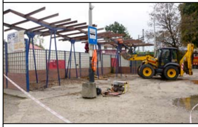
Ulica Dworcowa w Żarowie, dzięki remontowi zyska nowy wizerunek.