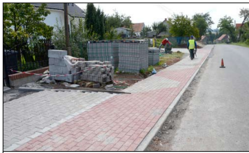
Brak chodników na wsiach to częsta bolączka mieszkańców. Corocznie, większość sołectw za pieniądze z funduszu sołeckiego buduje właśnie nowe chodniki. Na zdjęciu, powstający ciąg pieszy w Pożarzysku.