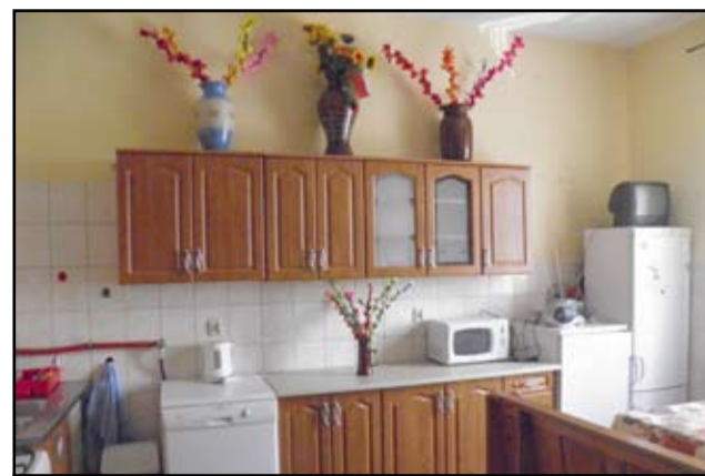
Każdego roku, w ramach funduszu sołeckiego doposażane są świetlice wiejskie. Na zdjęciu nowa kuchnia na świetlicy wiejskiej w Imbramowicach.

Fundusz sołecki to środki, które gmina oddaje do dyspozycji wsi. Ich wysokość jest ustalana corocznie i zależy od liczby mieszkańców sołectwa oraz bieżących dochodów gminy. Nie są to środki sołectwa, ale przeznaczane są dla mieszkańców wsi na poprawę warunków ich życia. - W naszej miejscowości to świetlica jest takim cen-