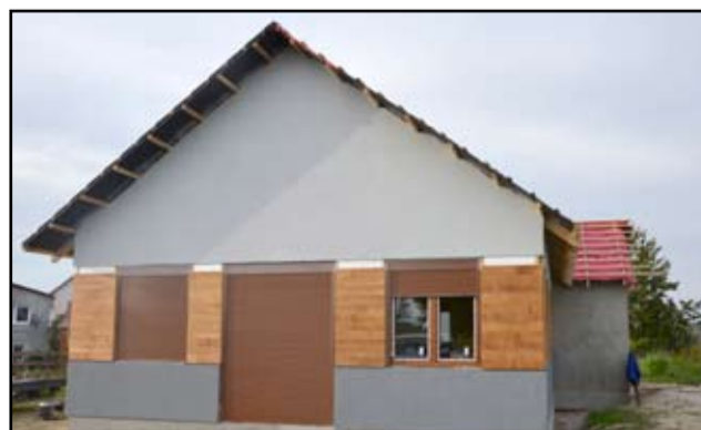
Tak prezentuje się nowa świetlica wiejska w Bożanowie. Na wszystkich odwiedzających robi duże wrażenie.