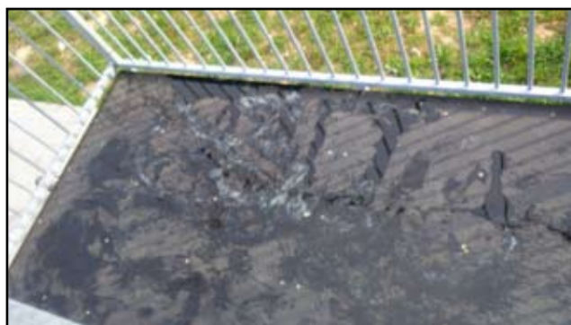
Nieco wcześniej w Żarowie młodzi ludzie malowali sprayem elewacje nowych budynków. Teraz zniszczenia odnotowano na żarowskim skateparku. Czy jest jakiś sposób na zahamowanie tak chuligańskiej działalności?