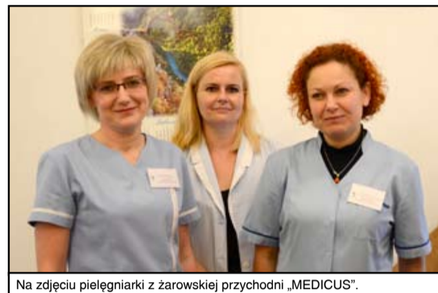
Na zdjęciu pielęgniarki z żarowskiej przychodni „MEDICUS”.