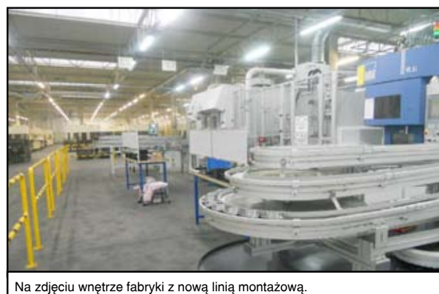
Na zdjęciu wnętrze fabryki z nową linią montażową.