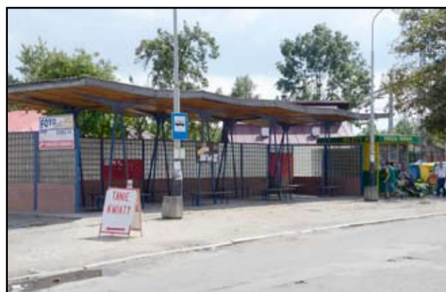
Taka wiata przystankowa w Żarowie to już przeszłość. Niebawem do dyspozycji mieszkańców oddana zostanie zupełnie nowa i dużo przestronniejsza.