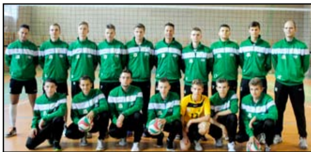
Siatkarze Volley PCO Żarów

Dość nieoczekiwanie zakończył się pierwszy mecz w ramach III Dolnośląskiej Ligi Piłki Siatkowej. Licznie zgromadzeni kibice w hali sportowej nie obejrzeni spotkania pomiędzy PCO Volley Żarów, a OPAL Kudowa-Zdrój.