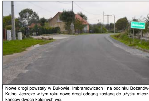
Nowe drogi powstały w Bukowie, Imbramowicach i na odcinku Bożanów-Kalno. Jeszcze w tym roku nowe drogi oddaną zostaną do użytku mieszkańców dwóch kolejnych wsi.