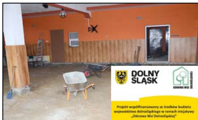
Mieszkańcy Wierzbnej czekają na odnowioną świetlicę wiejską.

Całościowy remont zamknie się w kwocie 58.777,41 tysięcy złotych, z czego kwotę 29.387,00 tysięcy złotych gmina Żarów pozyskała z Urzędu Marszałkowskiego Województwa Dolnośląskiego.