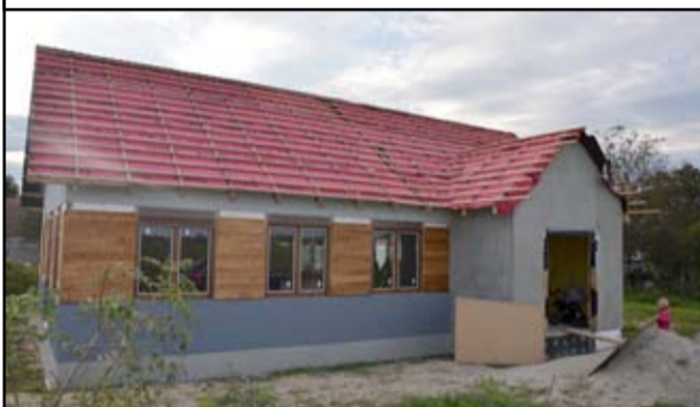
Nowe obiekty wiejskie kosztować będą 817 tysięcy złotych. Część z tych środków finansowych, 148.500 tysięcy złotych to dofinansowanie z Urzędu Marszałkowskiego Województwa Dolnośląskiego, które gmina Żarów pozyskała w ramach Programu Rozwoju Obszarów Wiejskich na lata 2007-2013 „Odnowa i rozwój wsi”.