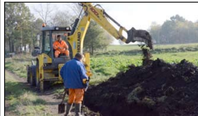
Wymiana starego rurociągu wodociągowego w Kalnie.