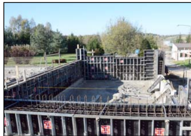
Przepisy unijne wymagają, aby osady powstałe podczas oczyszczania ścieków były powtórnie użyte, a nie jak teraz ładowały na wysypisku. Dzięki budowie nowoczesnej hali suchy materiał będzie mógł być wykorzystany w rolnictwie albo jako surowiec do spalania w piecach.

Koszt budowy słonecznej suszarni zamknie się w kwocie 3.884.322 milionów złotych. W 85 procentach są to środki, które oczyszczalnia otrzyma z Europejskiego Funduszu Rozwoju Regionalnego w ramach programu Infrastruktura i Środowisko. Będzie to pierwsza tak