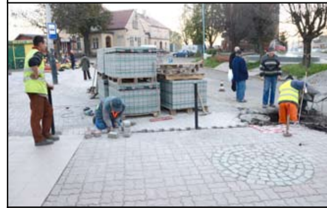
Ekipę remontową przy ulicy Dworcowej można spotkać każdego dnia.