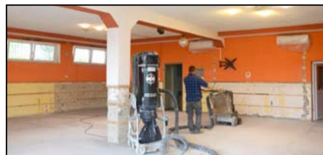
Prace remontowe przy remoncie świetlicy wiejskiej w Wierzbnej są już na finiszu. Obiekt został dostosowany do potrzeb lokalnej społeczności i dziś prezentuje się naprawdę bardziej okazale. Teraz mieszkańców Wierzbnej czekają jeszcze drobne prace malarskie i konserwatorskie.

Na remont świetlicy wiejskiej w Wierzbnej gmina pozyskała dodatkowe środki finansowe z Urzędu Marszałkowskiego Województwa Dolnośląskiego w ramach konkursu „Odnowa Dolnośląskiej Wsi”. Przy kwocie 58.777, 41 tysięcy złotych, która została przeznaczona na prace remontowe to prawie 30 tysięcy złotych dofinansowania. – Świetlice wiejskie to najważniejsze miejsca, wokół których skupiona jest aktywność społeczna mieszkańców. Takie inwestycje cieszą, bo przynoszą korzyści całej wiejskiej społeczności. Co roku