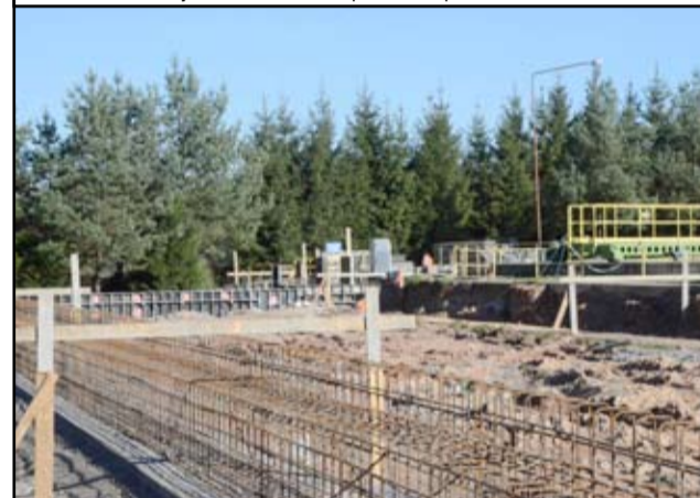
Budowa nowoczesnej suszarni osadowej to największa inwestycja, jaką do tej pory realizowała żarowska oczyszczalnia.

ogromna pula środków unijnych, która trafi na rzecz żarowskiego zakładu. I pierwsza tak nowo-