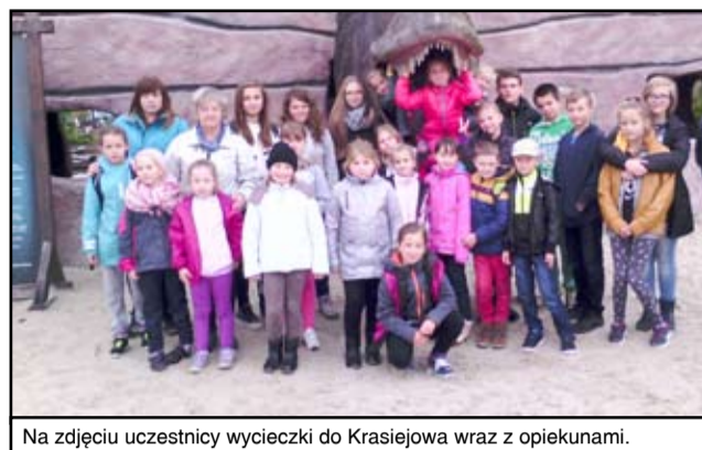
Na zdjęciu uczestnicy wycieczki do Krasiejowa wraz z opiekunami.