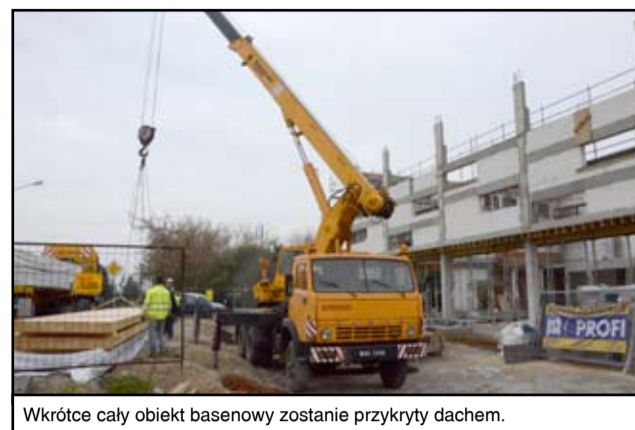
Wkrótce cały obiekt basenowy zostanie przykryty dachem.

Kompleks pływacki, który powstaje w tym miejscu będzie jednym z najnowocześniejszych obiektów. Do dyspozycji