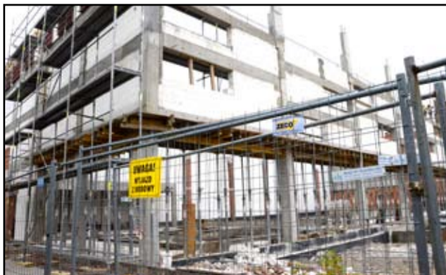
Basen dopełni sportową bazę przy ulicy Piastowskiej w Żarowie. Tuż obok nowoczesnej hali sportowej i Orlika będzie wizytówką tej części miasta.