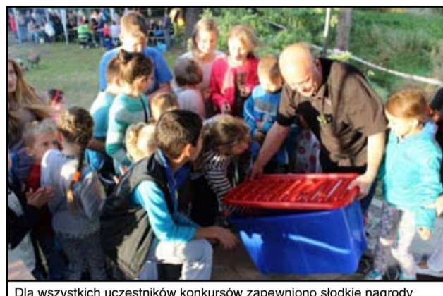
Dla wszystkich uczestników konkursów zapewniono słodkie nagrody

Piknik zgromadził wielu Mrowinian, a wybór miejsca na „Mrowińskim rynku” okazał się wyjątkowo trafny.