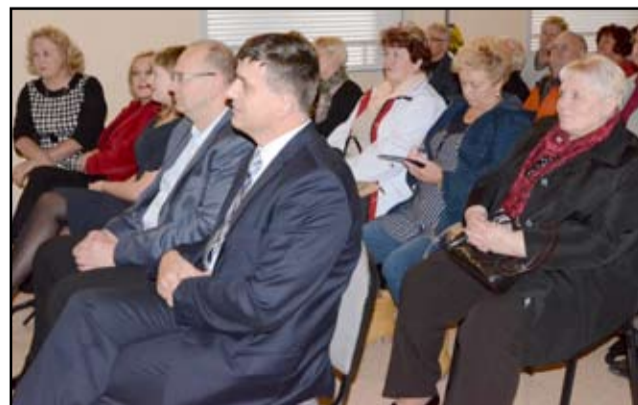
W spotkaniu z prezydentem Wałbrzycha uczestniczyli przedstawiciele stowarzyszeń wiejskich, radni, sołtysi, dyrektorzy szkół i gminnych jednostek oraz członkowie organizacji pozarządowych. Pieniądze, które w ramach Aglomeracji Wałbrzyskiej trafią do Żarowa w dużej mierze przeznaczone zostaną na projekty na rzecz wszystkich mieszkańców gminy.