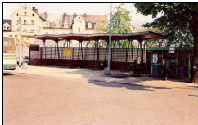
Stara wiaty przystankowa w Żarowie przeszła do historii. Była w opłakanym stanie i straszyla swoim wyglądem. Tak prezentowała się jeszcze w latach dziewięćdziesiątych. Na zdjęciu widać jeszcze stare autobusy, które zabierały pasażerów do lokalnych miejscowości.