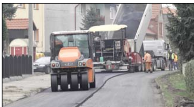
Główna droga w Wierzbnej, tuż po zakończeniu prac kanalizacyjnych wymagała całkowitego odtworzenia. Teraz nie ma już żadnego śladu po ubytkach w jezdni. Droga po remoncie jest całkowicie przejezdna.

N awierzchnia drogowa ulicy Świdnickiej w Wierzbnej od dłuższego czasu wymagała pilnego remontu.