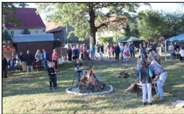
Miejsce pikniku okazało się strzałem w dziesiątkę

Zarząd Stowarzyszenia „Mrowiny na Swoim”