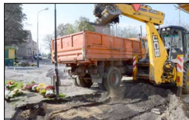
Na przebudowę tego terenu Żarowianie czekali od dawna. A w komplecie z wyremontowanym targowiskiem będzie to centrum z prawdziwego zdarzenia.