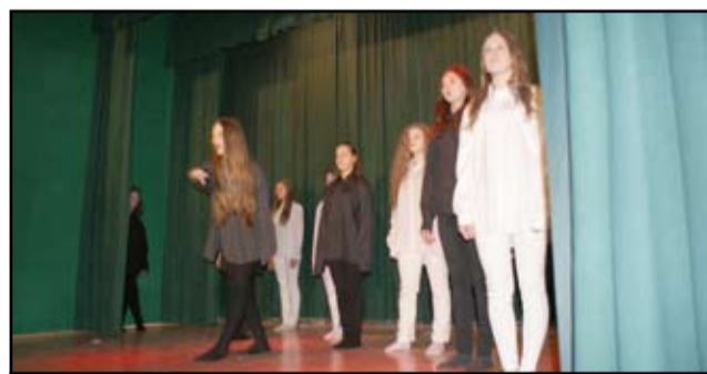
Uczniowie żarowskiego gimnazjum biorą udział w każdej edycji Przeglądu Teatrów.

Reprezentanci Żarowa: Szkoła Podstawowa im. Jana Brzechwy zajęli I miejsce za swój TEATR CIENI w kategorii szkoły podstawowe klasy I-III oraz Gimnazjum im. Jana Pawła II zdobyło wyróżnienie za przedstawienie „Człowiek