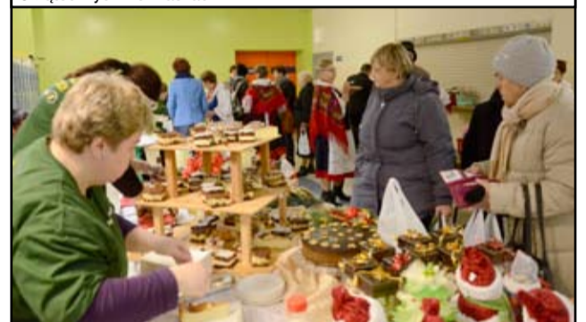
Kiermasz, mimo, że była to dopiero jego druga edycja, zdobył już swoich stałych miłośników, zarówno wśród odwiedzających, jak i wśród wystawców, którzy i tym razem nie zawiedli i z wielką chęcią przybyli do Żarowa.