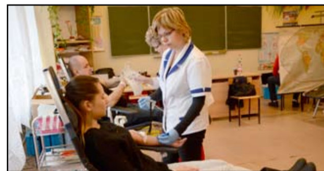
To była ostatnia tegoroczna zbiórka krwi w Żarowie. Na przyszły rok organizatorzy zaplanowali siedem takich akcji.