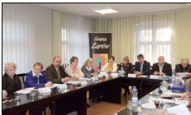
Podczas pierwszej roboczej sesji radni ustalili również wynagrodzenie burmistrza oraz wysokość swoich miesięcznych diet.