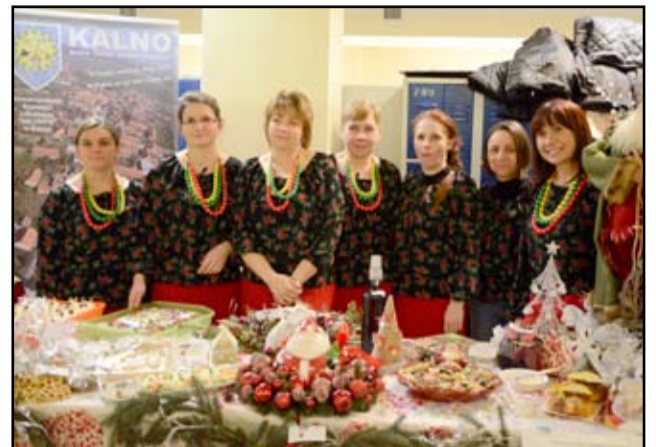
Każdego roku członkinie Koła Gospodyń Wiejskich z Kalna biorą udział w świątecznych kiermaszach.