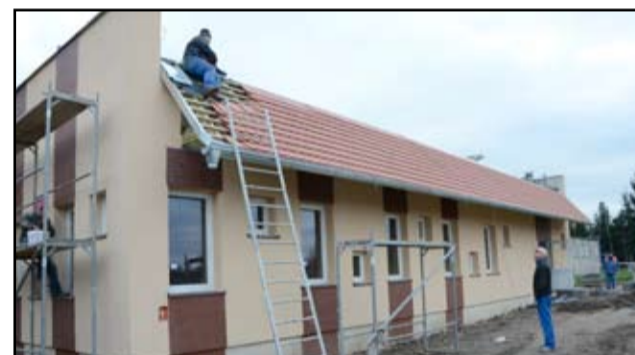
Jeszcze niedawno na placu budowy nowej świetlicy w Zastrużu wznosiły się jedynie mury. Dziś obiekt jest już prawie gotowy i robi duże wrażenie.

Dwie świetlice środowiskowe w Mrowinach i Zastrużu są już prawie gotowe. Prace potrwają tutaj jeszcze zaledwie kilka tygodni. Niebawem nowe obiekty zostaną oddane do użytku. – Zależy nam na tym, aby wszystkie wiejskie obiekty były zmodernizowane, bo to właśnie tam koncentruje się życie wszystkich mieszkańców naszych sołectw. Tam odbywają się zajęcia świetlicowe dla najmłodszych, zabawy, festyny, ale także spotkania samych mieszkańców. Mrowiny i Zastruże są już ostatnimi miejscowościami na terenie naszej gminy, w których nie było takich obiektów – mówi