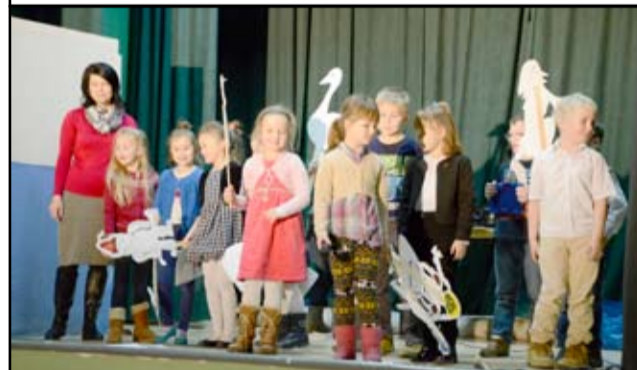
Na zdjęciu najmłodszy artyści, uczniowie żarowskiej podstawówki.