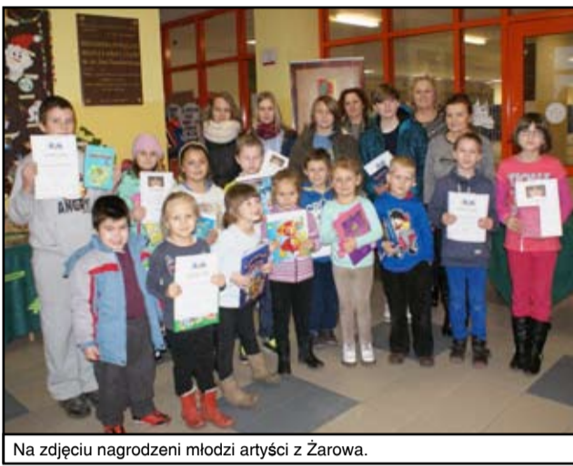
Na zdjęciu nagrodzeni młodzi artyści z Żarowa.