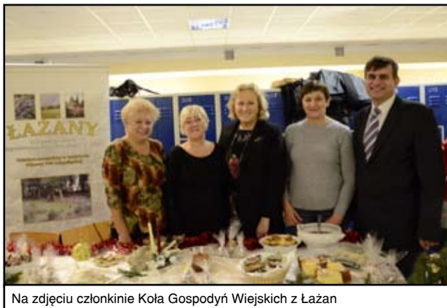
Na zdjęciu członkinie Kola Gospodyń Wiejskich z Łażan