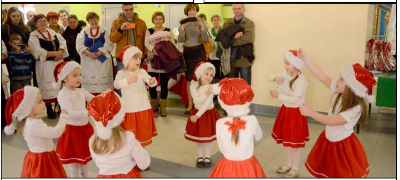
Największą niespodzianką tegorocznego kiermaszu był występ dziewczyn z Kalna.