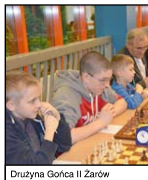
Drużyna Gońca II Żarów

Rozgrywki będą się odbywać tradycyjnie systemem turniejów dojazdowych, w trakcie których rozegrane zostaną maksymalnie 3 rundy. W stawce 13 zespołów znajdują się kluby z Żarowa, Świd-