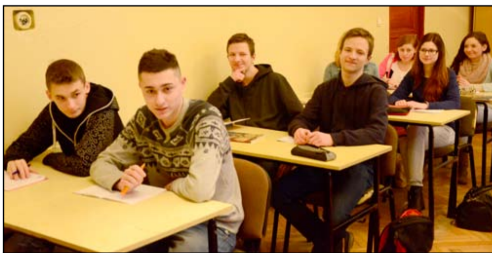
Uczniowie to wizytówka szkoły w Żarowie.

Podpisaliśmy w poniedziałek, 9 lutego list intencyjny powołujący Klaster Edukacyjny „INVEST IN EDU” Wałbrzyskiej Specjalnej Strefy Ekonomicznej, którego celem będzie współpraca z pracodawcami ze strefy w zakresie kształcenia uczniów przygotowanych do pracy w zawodach poszukiwanych na rynku, jak też praktyki uczniów i nauczycieli.