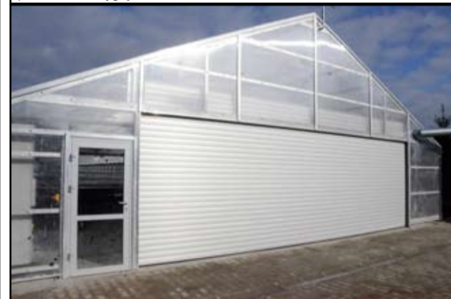
Tak dziś wygląda nowoczesna suszarnia osadów, która zlokalizowana jest na terenie żarowskiej oczyszczalni.