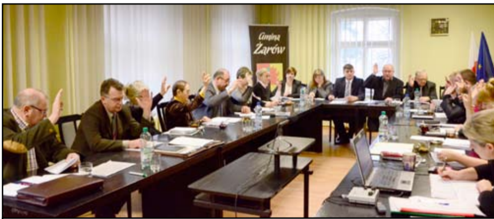
Wszystkie zadania wynikające z zawartego przez żarowskich radnych porozumienia powierzone zostaną nowej jednostce gminy Wałbrzych „Instytucji Pośredniczącej Aglomeracji Wałbrzyskiej”.

Agglomerację Wałbrzyską tworzą 23 gminy: Boguszków-