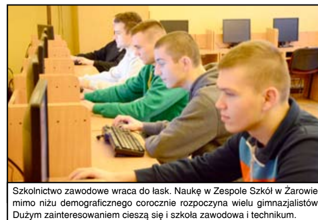
Szkolnictwo zawodowe wraca do łask. Naukę w Zespole Szkół w Żarowie, mimo niżu demograficznego corocznie rozpoczyna wielu gimnazjalistów. Dużym zainteresowaniem cieszą się i szkoła zawodowa i technikum.