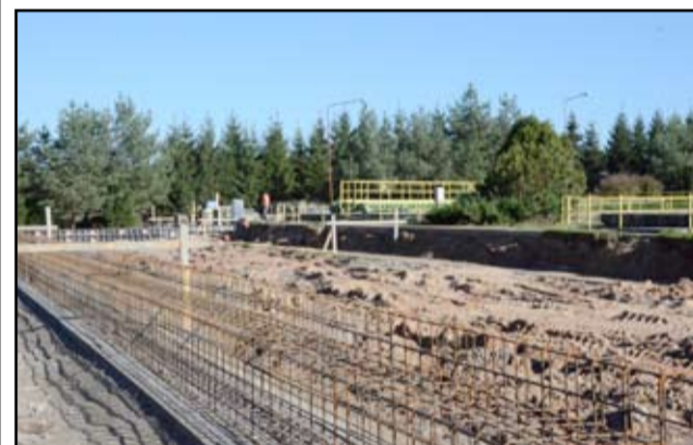
Od momentu otrzymania przez żarowskie Przedsiębiorstwo Wodno-Ściekowe promesy na dofinansowanie projektu, prace remontowe przy budowie obiektu zrealizowane zostały w błyskawicznym tempie. Tak, jeszcze w październiku wyglądała suszarnia osadów w Żarowie.