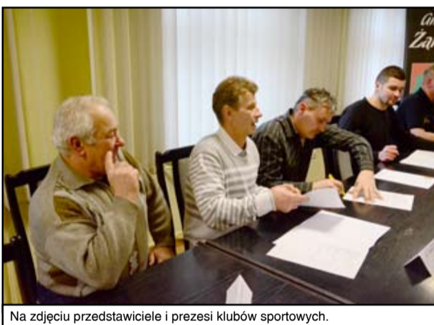
Na zdjęciu przedstawiciele i prezesi klubów sportowych.

tu przeznaczyło 40 tysięcy złotych. Nie wiadomo jeszcze, czy wsparciem ze strony powiatu zostaną objęte żarowskie kluby sportowe i organizacje, bo konkurs ogłoszony przez Starostwo Powiatowe zostanie rozstrzygnięty 11 lutego. Najwięcej, bo aż 95 tysięcy złotych tradycyjnie otrzymał Klub Sportowy „Zjednoczeni Żarów”. - Dziękujemy za tegoroczne wyróżnienie, bo rzeczywistość tych pieniędzy jest zdecydowanie więcej. Ten rok to przede wszystkim dalsza praca z młodzieżą, liczne treningi i zawody, wyjazdy oraz szkolenia. Teraz naszym nadrzędnym celem jest utrzymanie się w czwartej lidze. Jesteśmy wysoko w tabeli i tego będziemy dalej