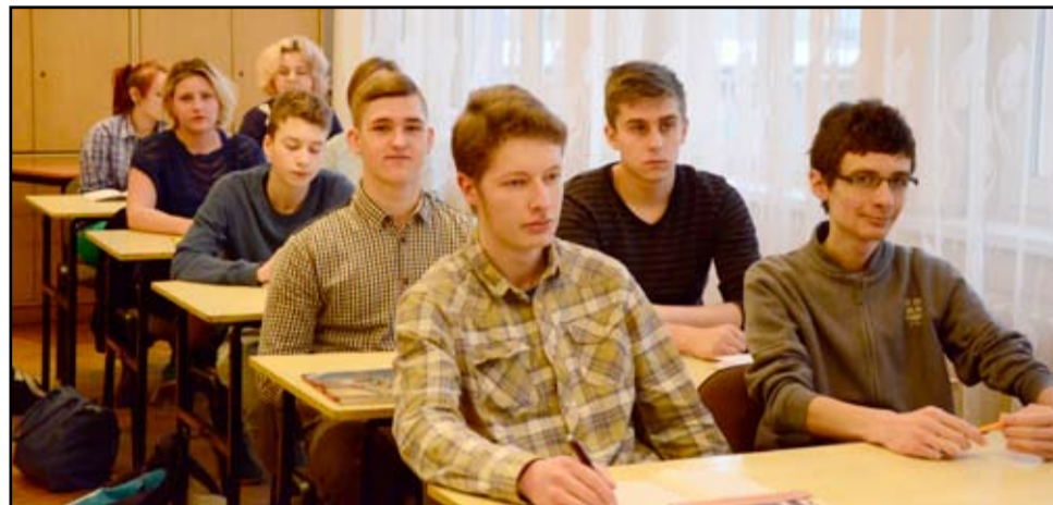
Co roku Fundacja „Perspektywy” ogłasza klasyfikację szkół ponadgimnazjalnych. W tegorocznej edycji Żarów znalazł się na wysokiej pozycji.

Obecnie kształcimy w zawodach technikum transportu kolejowego, technikum logistyki i technikum informatyki. Zawód technikum transportu kolejowego to dziś zawód bardzo poszukiwany przez szeroko rozumiane Pol-