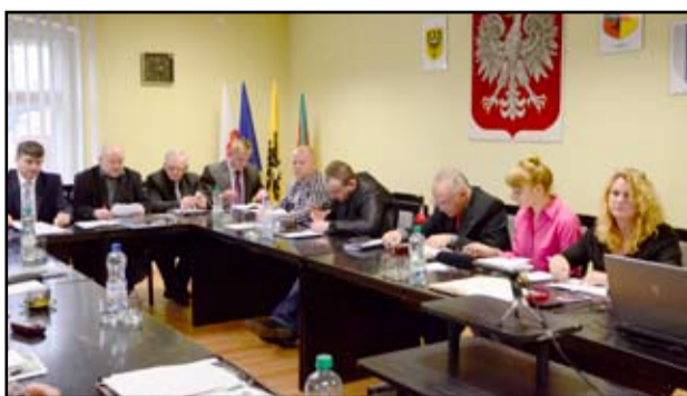
Uchwałę w sprawie zaciągnięcia pożyczki poparło 14 obecnych na sesji radnych Rady Miejskiej.

tak duże pieniądze. To bardzo dobra wiadomość dla wszystkich mieszkańców naszej gminy.