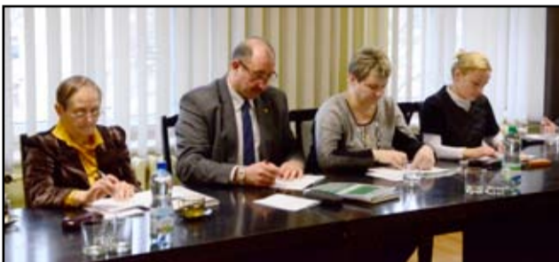
Wszystkie gminy, które przyłączyły się do Aglomeracji Wałbrzyskiej otrzymają duże dofinansowania na realizację inwestycji. Uchwałę w sprawie zawarcia porozumienia pomiędzy gminą Żarów a gminami tworzącymi Zintegrowane Inwestycje Terytorialne Aglomeracji Wałbrzyskiej poparło 14 obecnych na sesji radnych.