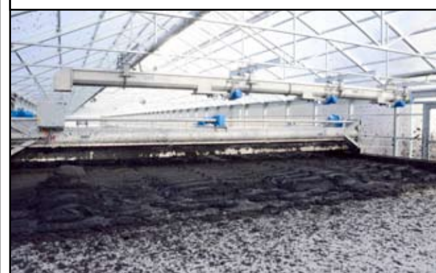
Nowoczesny obiekt liczy 1000 metrów kwadratowych.