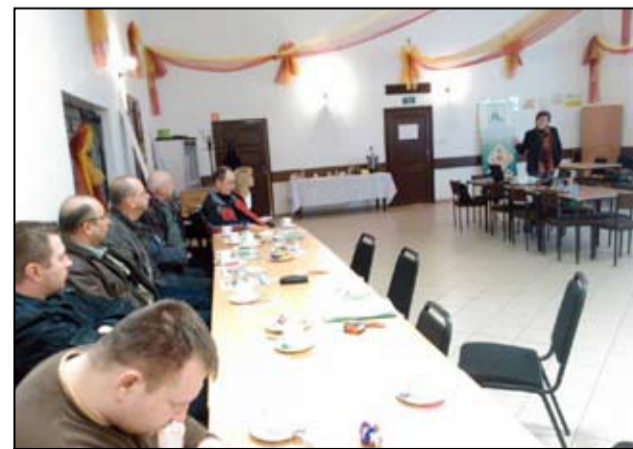
Na zdjęciu uczestnicy szkolenia dla rolników w Bukowie.