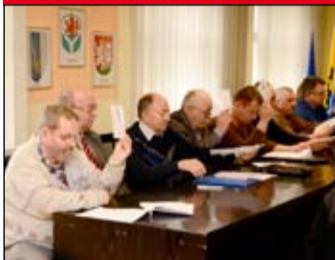
Miejsko-Gminna Spółka Wodna w Żarowie podsumowała 2015 rok.