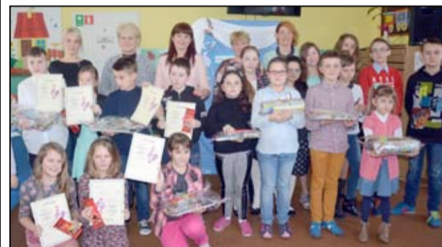
Na zdjęciu, wspólnie z nauczycielami uczestnicy konkursu wokalnego w Imbramowicach.

W Szkole Podstawowej im. UNICEF w Imbramowicach w czwartek, 25 lutego spotkali się najzdolniejsi młodzi artyści, aby zaprezentować swoje wokalne talenty.