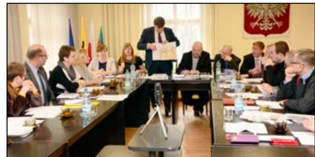
Nie będzie w tym roku podwyżki cen za wodę i ścieki. Tak zdecydowali radni Rady Miejskiej.