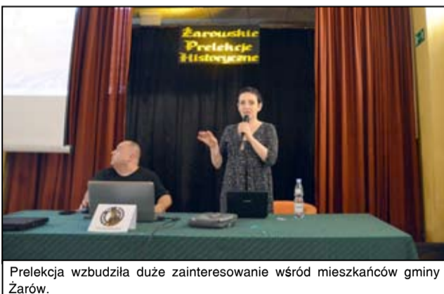
Prelekcja wzbudziła duże zainteresowanie wśród mieszkańców gminy Żarów.