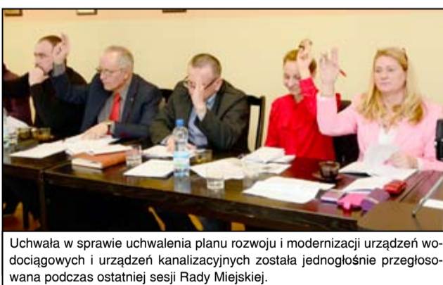
Uchwała w sprawie uchwalenia planu rozwoju i modernizacji urządzeń wodociągowych i urządzeń kanalizacyjnych została jednogłośnie przegłosowana podczas ostatniej sesji Rady Miejskiej.

Obecnie realizujemy budowę sieci wodociągowej i kanalizacyjnej przy ul. Parkowej w Żarowie. Następne będą Mrowiny i tutaj wymiana sieci azbesto-cementowej przy ul. Wojska Polskiego. W tym roku rozpocznie się także budowa studni głębinowej na ujęciu w Kalnie i Wierzbnej. Zostanie również częściowo zmodernizowana Stacja Uzdatniania Wody. Czeka nas jeszcze wykonanie dwóch niezbędnych projektów, które pozwolą przeprowadzić prace inwestycyjne dotyczące budowy kanału ulgi