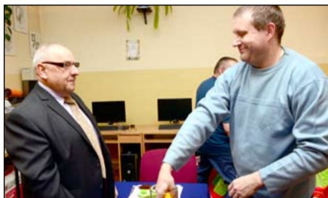
Wśród mieszkańców gminy Żarów nie brakuje chętnych krwiodawców. Ich nie trzeba do tego namawiać. Bezinteresownie pomagają tym, którzy najbardziej tego potrzebują.