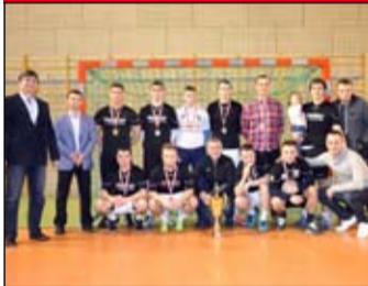
Pięć lat czekali piłkarze Wektor Świdnica, by ponownie zwyciężyć w Żarowskiej Lidze Futsalu Electrolux Cup.