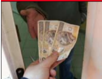
Uwaga na oszustów! Policja apeluje o zachowanie ostrożności i szczególną uwagę.