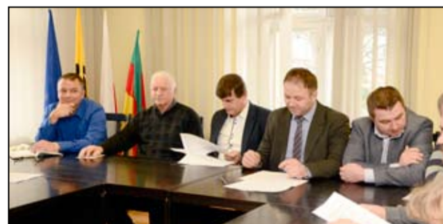
Zadaniem Miejsko-Gminnej Spółki Wodnej w Żarowie jest dbanie o prawidłowe funkcjonowanie istniejących urządzeń melioracyjnych poprzez bieżącą konserwację oraz usuwanie powstałych awarii na sieci drenarskiej.