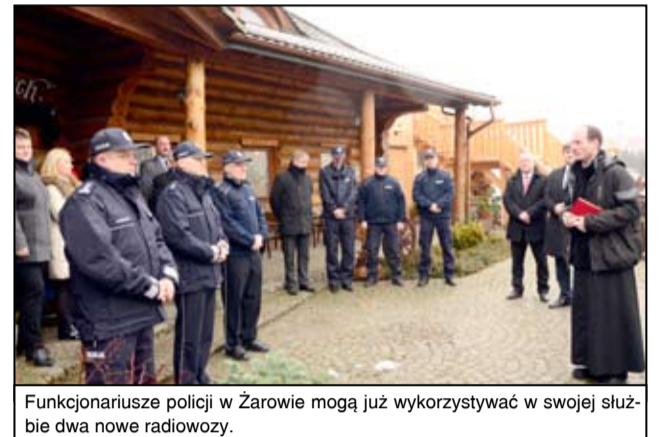
Funkcjonariusze policji w Żarowie mogą już wykorzystywać w swojej służbie dwa nowe radiowozy.

licjantów z terenu powiatu świdnickiego. Samochody zostały sfinansowane z budżetu Komendy Głównej Policji oraz budżetu gminy Żarów, Strzegomia, gminy Świdnicy, Starostwa Powiatowego i Świdnicy. Gmina Świdnica i Starostwo Powiatowe przekazały dwa samochody (nieoznakowane (Hyundai I20), gmina Żarów dwa samochody (oznakowane Opel Corsa i nieoznakowane Hyundai I20), miasto i gmina Świdnica samochód oznakowany (Kia Ceed), gmina Strzegom samochód nieoznakowany (Hyundai I20) i oznakowany (Opel Corsa).- Serdecznie dziękuję za wsparcie finansowe Policji. I kontynuując tę dobrą tendencję proszę również uwzględnić rok bieżący, zwłaszcza, że burmistrz i radni Rady Miejskiej widzą potrzebę wspierania naszej jednostki. Gmina Żarów jest przykładem gminy do