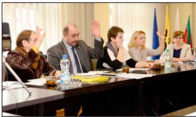
Na ostatniej sesji radni Rady Miejskiej rozpatrywali dwa projekty dotyczące działalności żarowskiego Zakładu Wodociągów i Kanalizacji. Obydwa zostały przegłosowane jednogłośnie.