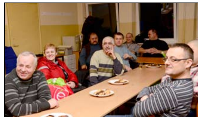
Podczas spotkania Klubu Honorowych Dawców Krwi w Żarowie rozstrzygnięty tradycyjny konkurs 4X450 i 3X350.