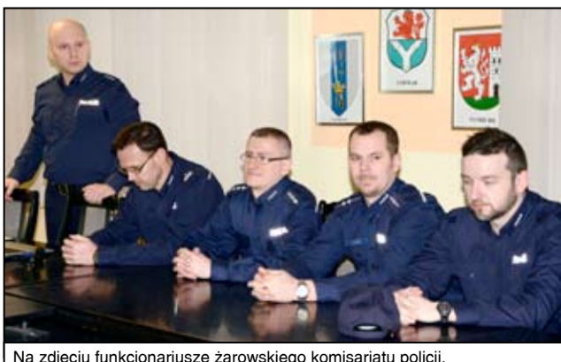
Na zdjęciu funkcjonariusze żarowskiego komisariatu policji.