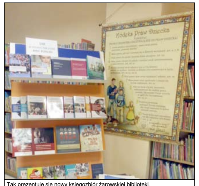
Tak prezentuje się nowy księgozbiór żarowskiej biblioteki.