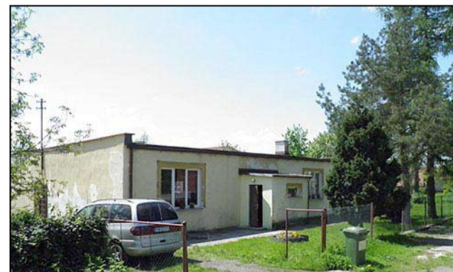
Budynek świetlicy wiejskiej w Przyłęgowie także wymaga pilnego remontu.