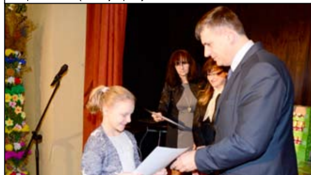
Po raz dwudziesty drugi Gminne Centrum Kultury i Sportu w Żarowie było organizatorem świątecznego konkursu „Tradycje Wielkanocne”. Na konkurs wpłynęło prawie dwieście prac.