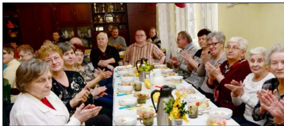
Wielkanocne śniadanie emerytów to już tradycja w gminie Żarów.