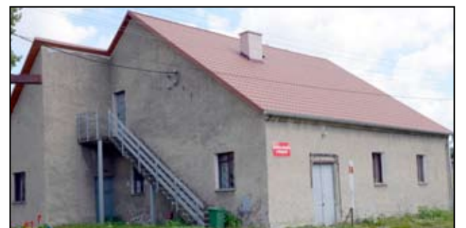
Tak dziś prezentuje się budynek świetlicy wiejskiej w Mielęcinie.