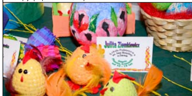
Takie wielkanocne cuda można było podziwiać w trakcie pokonkursowej wystawy „Tradycje Wielkanocne” w żarowskim Gminnym Centrum Kultury i Sportu. Lista nagrodzonych i zdjęcia z konkursu znajdują się na stronie internetowej www.um.zarow.pl i www.centrum.zarow.pl