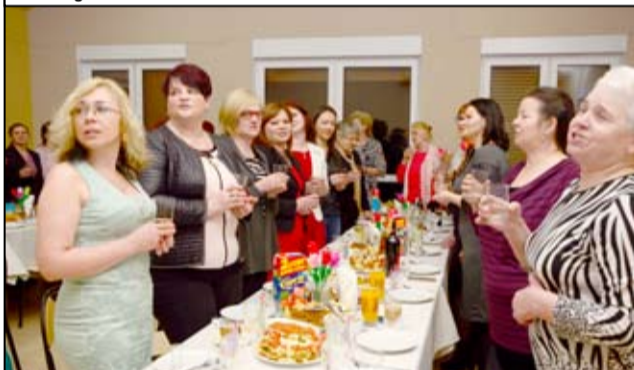
To był wyjątkowy Dzień Kobiet w Bożanowie. Po raz pierwszy panie wspólnie świętowały na nowej świetlicy wiejskiej, która jeszcze nie tak dawno została oddana do użytku. I to w jakim towarzystwie! Na zaproszenie przedstawicieli Rady Sołeckiej z Bożanowa we wspólnym świętowaniu uczestniczyły także panie z Kalna i Wierzbnej. Zamiast goździków i rajstop były tulipany, szampan i dobra wspólna zabawa. W przygotowanie uroczystości na świetlicy wiejskiej w Bożanowie zaangażowali się przedstawiciele Rady Sołeckiej Bożanowa i aktywni mieszkańcy wsi.