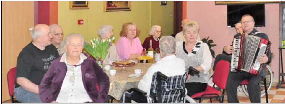
Członkinie żarowskiego Związku Emerytów Rencistów i Inwalidów tradycyjnie, jak każdego roku świętowały Dzień Kobiet. Tym razem nietypowo, bo nie w swojej żarowskiej siedzibie. Dzień Kobiet panie emerytki uczciły wspólną zabawą w hotelu Żarmed. Przy tej okazji nie zabrakło wspólnego biesiadowania i muzykowania.