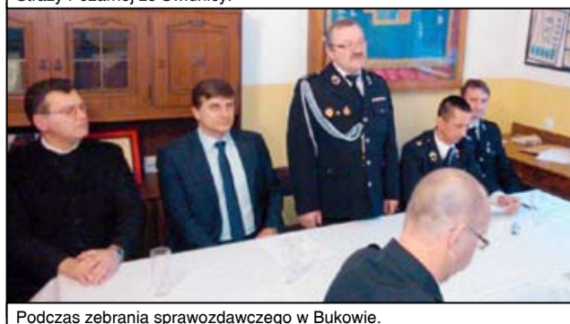
Podczas zebrania sprawozdawczego w Bukowie.