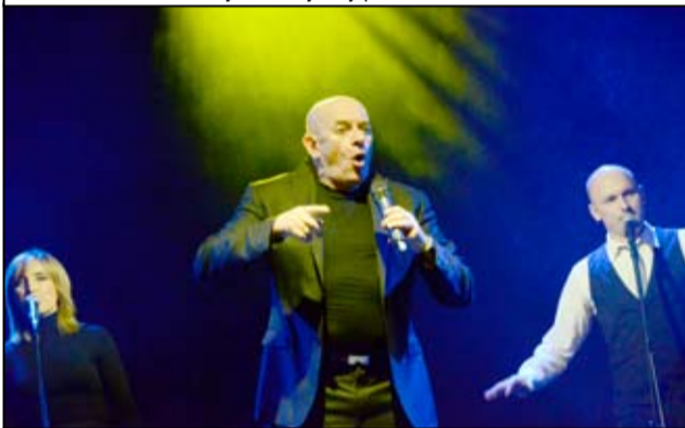
Dla wszystkich Żarowianek w Dzień Kobiet wystąpił Marcin Daniec . Znany satyryk rozbawił zgromadzoną liczną w hali sportowej Gminnego Centrum Kultury i Sportu publiczność. Swoją nietuzinkową osobowością nawiązał znakomity kontakt z widownią i wywołał salwy śmiechu. W jego programie pojawiła się tematyka głównie dotycząca polityki, choć na scenie królowały również skecze „o nas samych”. - Nie byłbym sobą, gdyby teraz nie poleciało ze sceny w Waszym kierunku trochę wazelinki - mówił do licznie zgromadzonej publiczności kabareciarz. - W tak pięknym miejscu, jak Żarów jeszcze nie miałem okazji występować. Żarów czy Żarówek, nie ważne - kontynuował Marcin Daniec .