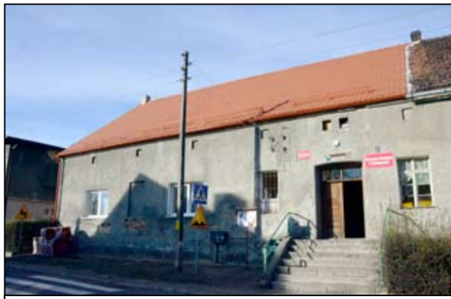
Świetlica wiejska w Mrowinach w minionym roku zyskała nowy dach. Kompleksowego remontu wymaga jednak cały budynek, łącznie z jego wewnętrzną częścią.