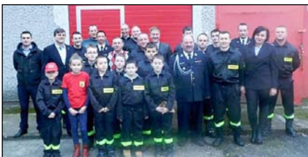
W drużynie Ochotniczej Straży Pożarnej w Pożarzysku nie brakuje najmłodszych ochotników.