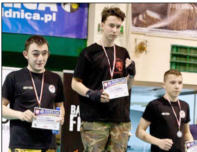
Trzecie miejsce na podium to duży sukces młodego mieszkańca Wierzbnej.