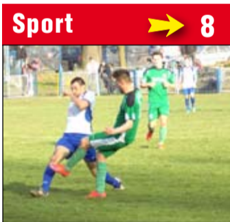
Po ponad półtorarocznej przerwie na wyremontowany stadion powrócił piłkarze AKS Strzegom.