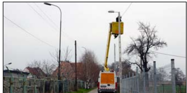
Niebawem więcej światła pojawi się na odcinku ulic Kwiatowej w Żarowie i Szkolnej w Łażanach.