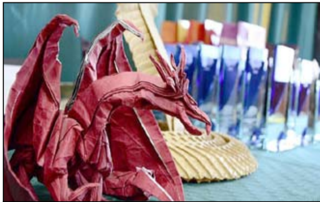
Takie „cudeńka” można było podziwiać podczas ubiegłorocznego Festiwalu Origami w Żarowie.

Smoki, kwiaty i tabędzie zdominowały poprzednią edycję Festiwalu Origami w Żarowie. Tylko w roku 2015 na konkurs nadesłano ponad dwieście prac z trzynastu miejscowości z całej Polski. Jak będzie w tym roku, przekonamy się już w kwietniu.