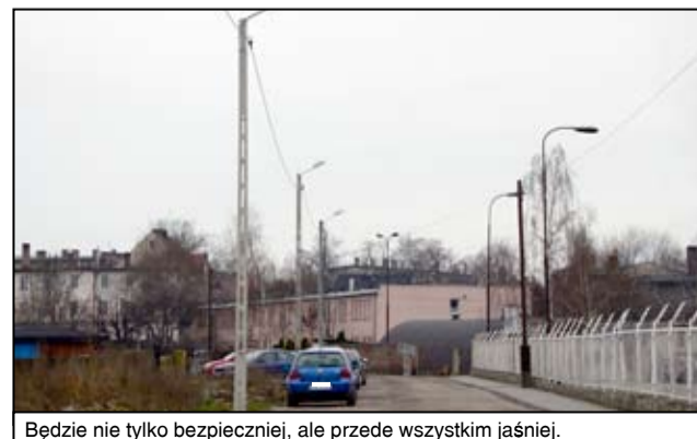
Będzie nie tylko bezpieczniej, ale przede wszystkim jaśniej.