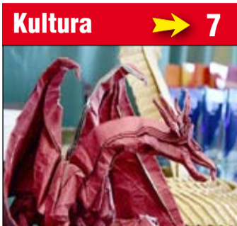
Gminne Centrum Kultury i Sportu w Żarowie zaprasza na kolejną edycję Festiwalu Origami.