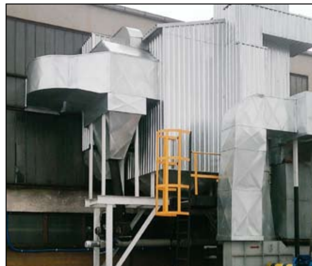
Tak wygląda nowa instalacja odpylania spalin przy żarowskiej ciepłowni. Sezon grzewczy jeszcze się nie zakończył, a nad kotłownią dziś nie widać już unoszących się kłębow dymu, tak jak to było jeszcze kilka miesięcy temu.