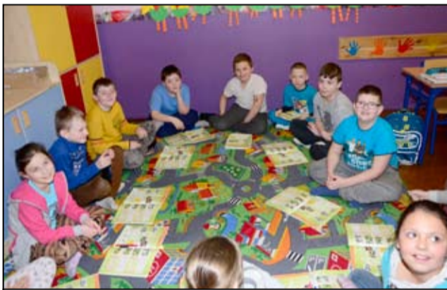
I uczniowie szkoły w Mrowinach.