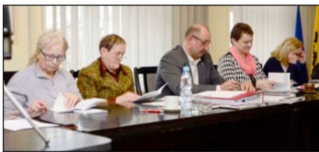
Radni Rady Miejskiej analizowali wcześniej projekt uchwały w sprawie utworzenia „Żłobka Miejskiego” w Żarowie w Komisji ds. Oświaty i Kultury oraz Budżetu i Gospodarki.