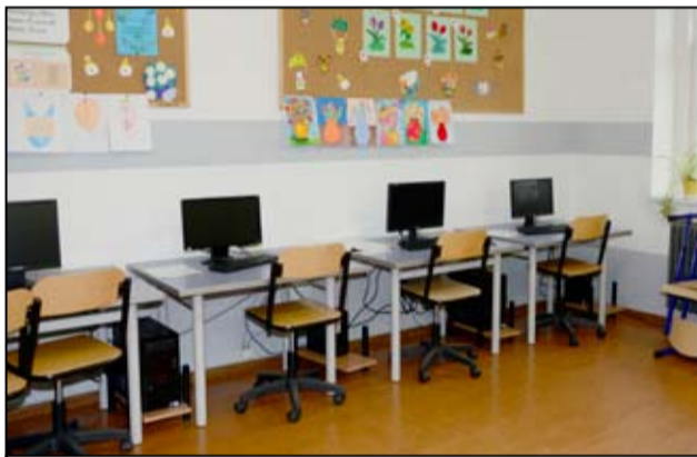
Sala lekcyjna po generalnym remoncie.