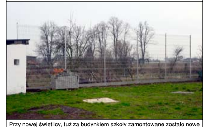
Przy nowej świetlicy, tuż za budynkiem szkoły zamontowane zostało nowe ogrodzenie.