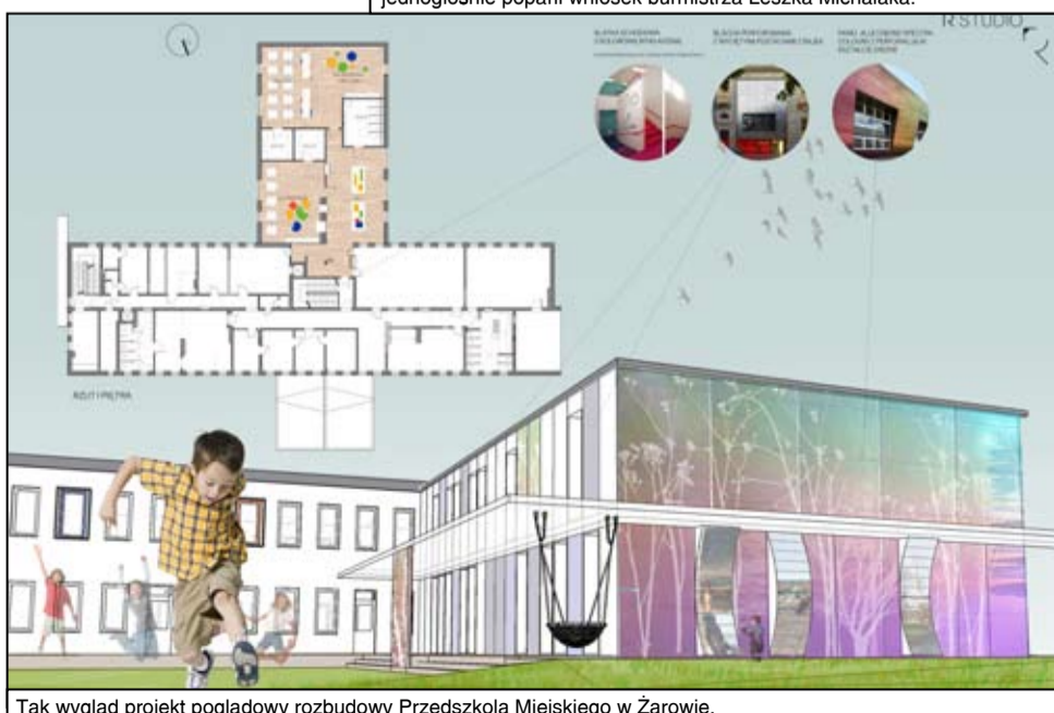
Tak wygląda projekt poglądowy rozbudowy Przedszkola Miejskiego w Żarowie.