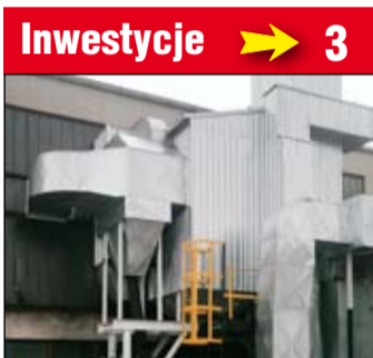
Nowa inwestycja przy żarowskiej ciepłowni.