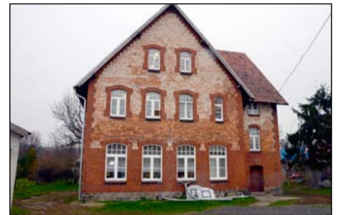
W całym budynku szkolnym zostały także wymienione wszystkie okna.