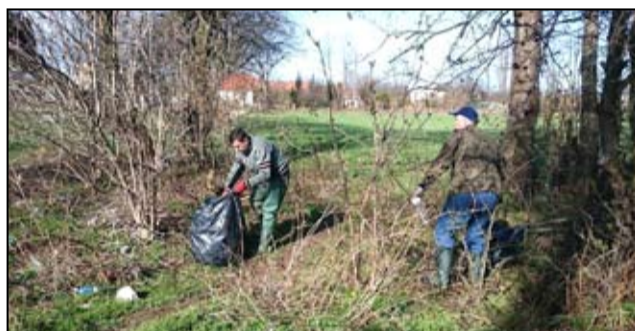
Żarowscy wędkarze chętnie włączają się we wszystkie prace społeczne, które realizowane są na terenie zbiorników wodnych.

Żarowscy wędkarze powoli zaczynają już szykować się do sezonu. Zanim jednak chwycą za wędkę, zawsze corocznie porządkują tereny wokół stawów. Dzięki takim działaniom pobliskie stawy są zadbane i odpowiednio zabezpieczone. - Celem takich akcji jest uświadomienie wędkarzom o konieczności sprzą-