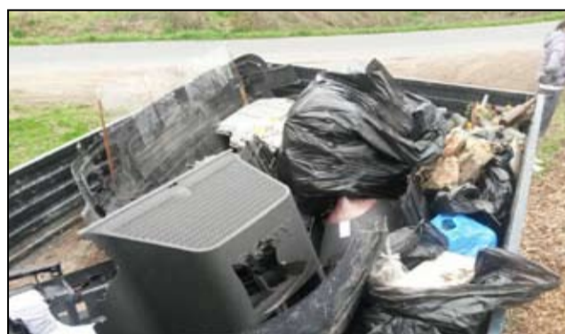
Cała przyczepa śmieci. Tak wyglądał efekt wspólnej społecznej akcji mieszkańców Wierzbnej.

prace porządkowe całej wsi. Do wspólnej akcji przyłączyli się chętni mieszkańcy sołectwa. - Czy czyn społeczny jest trendy? Okazuje się, że tak. Mieszkańcy naszej wsi skrzyknęli się i zorganizowali wspólną akcję sprzątnięcia wsi. A trzeba przyznać, że było, co porządkować. Na każdym kroku obserwujemy porzucane śmieci bądź pozostawiane różne meble, pojemniki na farby czy różne akcesoria pod kontenerami. Chyba nie wszyscy pamiętają, że takie odpady możemy bezpłatnie oddać do Punktu Selektywnej Zbiórki Odpadów, który działa w Żarowie. Pamiętajmy o tym i nie rozrzucamy śmieci wszędzie, gdzie się da. To także od nas samych w dużej mierze zależy, jak wygląda nasza wieś. Serdecznie dziękuję za pomoc