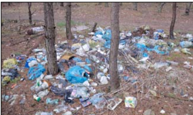
Taki widok jest coraz częstszy. W rowach, lasach, polanach i przydrożnych terenach można coraz częściej spotkać porzucane śmieci.

Śmieci, a czasem nawet różne odpady wielkogabarytowe podrzucane są również pod pojemniki na cmentarzu i w pobliżu stawu miejskiego w Żarowie. Wystawianie jakichkolwiek odpadów pod boksy, zestawy do zbiórki selektywnej lub wrzucanie do pojemników na odpady komunalne jest niedopuszczalne, podobnie, jak zostawianie w okolicy cmentarza czy stawu miejskiego. Takie działania generują dodatkowe