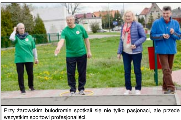
Przy żarowskim bulodromie spotkali się nie tylko pasjonaci, ale przede wszystkim sportowcy profesjonalści.