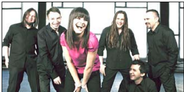
Zespół Łzy będzie gwiazdą tegorocznych Dni Żarowa