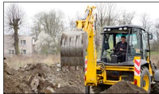
Budowa nowej sieci na tym odcinku kosztować będzie ponad 300 tysięcy złotych.