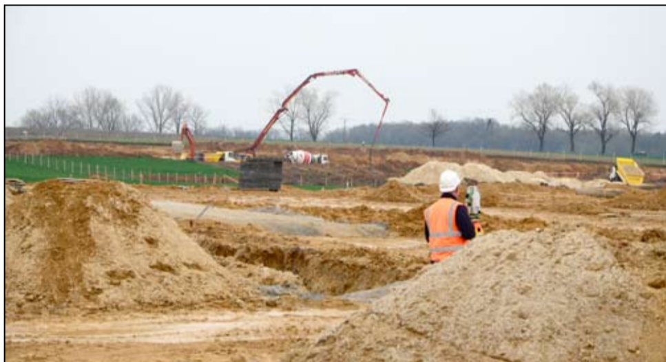
Budowa dwóch nowych zakładów ma się zakończyć jeszcze w tym roku.