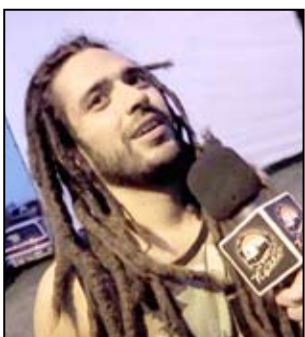
W programie tegorocznego święta miasta zaplanowany został także koncert wokalisty Mesajah

I Bieg z zamkiem w tle (Rynek Bolków, godz. 12.00, zapisy do biegu na stronie www.fenix-timing.pl do 01.05.2016r. lub w dniu zawodów do godz. 11.30)