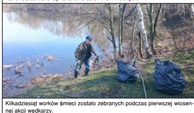
Kilkadziesiąt worków śmieci zostało zebranych podczas pierwszej wiosennej akcji wędkarzy.