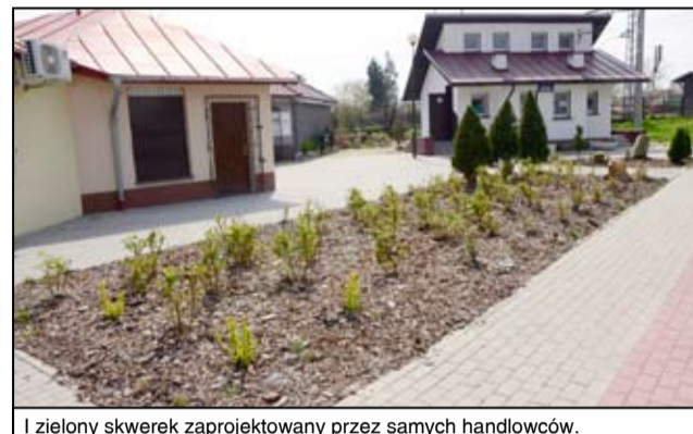
I zielony skwer zaprojektowany przez samych handlowców.

Żarowscy handlowcy udowodnili, że warto działać