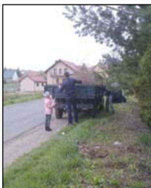
We wspólną akcję sprzątnięcia wsi zaangażowali się chętni mieszkańcy.

Mieszkańcy Wierzbnej razem dbają o swoje sołectwo. Ostatnio zaangażowali się w