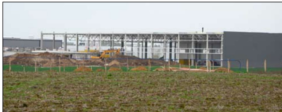
Żarowska strefa ekonomiczna znów będzie się rozbudowywać. To bardzo dobra wiadomość dla mieszkańców gminy Żarów.

Na terenie żarowskiej podstrefy ekonomicznej w tej