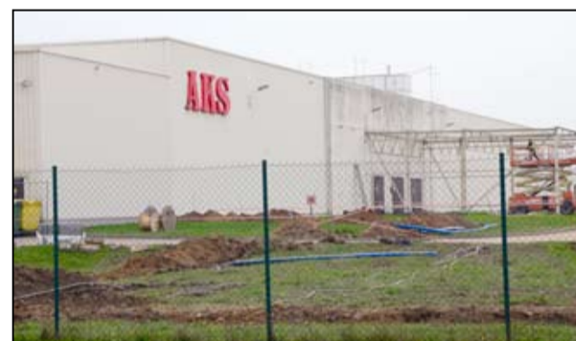
Na terenie żarowskiej podstrefy ekonomicznej rozbudowę swoich zakładów realizują AKS Precision Ball Polska oraz T&P.