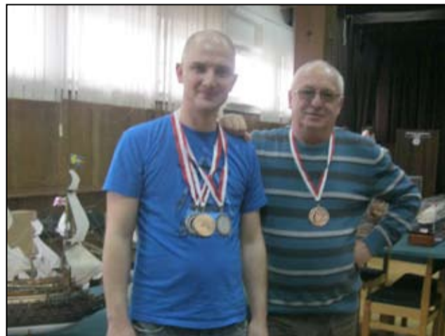
Na zdjęciu nagrodzeni medaliści.