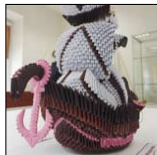
Takie cuda można było podziwiać podczas IV Ogólnopolskiego Festiwalu Origami.

Cuda z papieru można będzie podziwiać do 7 maja w Żarowskiej Izbie Historycznej.