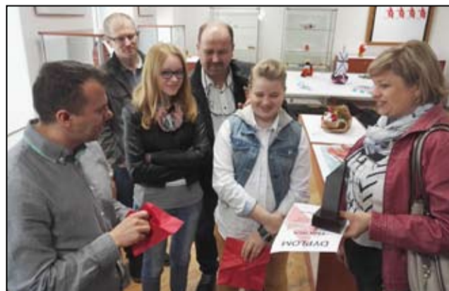
W trakcie pokonkursowej wystawy nie brakowało chętnych do spróbowania swoich sił w sztuce origami.

Wyniki IV Ogólnopolskiego Festiwalu Origami oraz więcej zdjęć znajdują się na stronie internetowej Gminnego