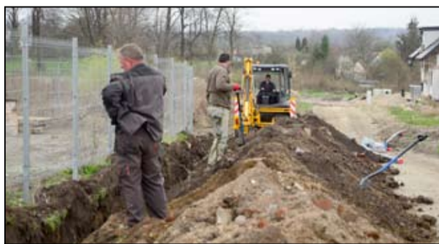
Prace przy budowie sieci wodociągowej i kanalizacyjnej przy ulicy Parkowej w Żarowie rozpoczęły się początkiem kwietnia.

Inwestycja, którą realizuje żarowski Zakład Wodociągów i Kanalizacji potrwa najprawdopodobniej do końca maja. Zgodnie z zapowiedziami i tuż po zakończeniu tego przedsięwzięcia realizowany będzie projekt przebudowy sieci wodociągowej przy ulicy Wojska Polskiego w Mrowinach. - Na tym odcinku, przy ulicy Parkowej rozpoczęliśmy budowę infrastruktury w zakresie wodociągów i kanalizacji sanitarnej. W tej chwili kończymy budowę sieci wodociągowej