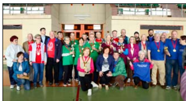
Wspólne zdjęcie nagrodzonych drużyn z Uniwersytetów Trzeciego Wieku.