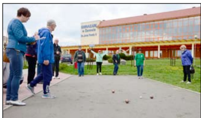
Każdy Uniwersytet Trzeciego Wieku wystawił swoją drużynę