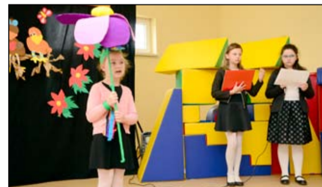
I Konkurs „Wiosna Wierszem Kwitnąca” cieszył się dużym zainteresowaniem.