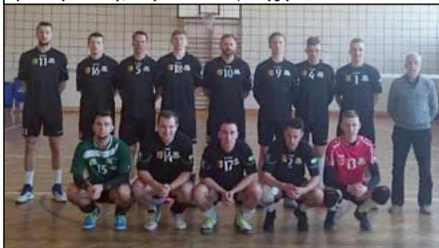
Drużynowe zdjęcie zawodników UKS Volley Żarów.