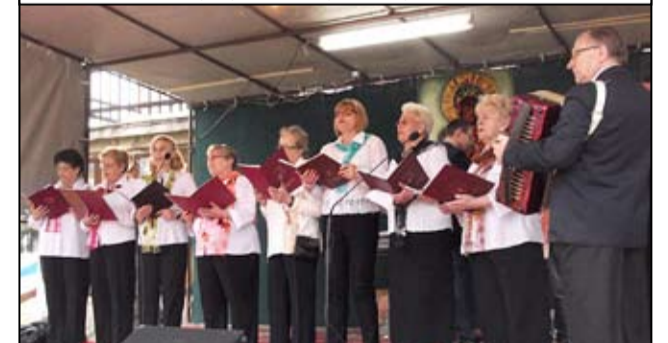
Na zdjęciu podczas charytatywnego śpiewania „Parafia Dzieciom” w Świdnicy.