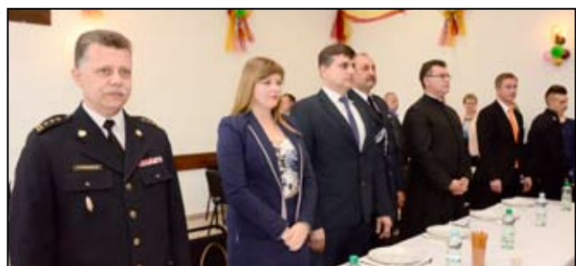
W podsumowującym pięcioletnią działalność zarządu zebraniu uczestniczyli przedstawiciele gminy Żarów, radni Rady Miejskiej, proboszcz parafii w Bukowie oraz komendant powiatowy PSP w Świdnicy.