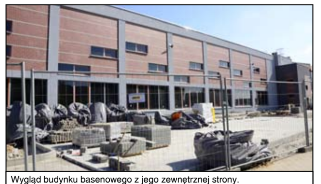
Wygląd budynku basenowego z jego zewnętrznej strony.