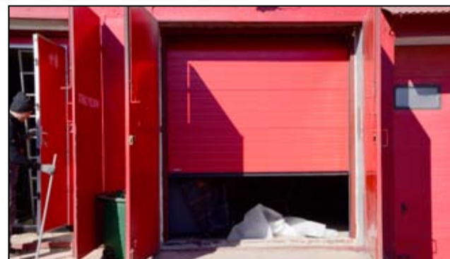
A tak prezentuje się nowy nabytek w jednostce OSP Żarów po wymianie.

Dotychczasowe stare były w złym stanie technicznym i nie nadawały się już do użytku. Nie będzie to jedyną inwestycją, która zostanie zrealizowana w żarowskiej jednostce strażackiej. Jeszcze w tym roku budynek remizy zmieni swoją elewację i rozpocznie się remont centralnego ogrzewania w obiekcie. Nowy wizerunek ma także zmienić plac przed budynkiem remizy strażackiej. - Zakończył się już montaż nowych segmentowych bram, które zastąpiły stare i zniszczone. Teraz, oprócz nowoczesnego wozu strażackiego, który w minionym roku został oddany do naszego użytku, remiza strażacka zyskała również nowoczesne bramy wjazdowe. Czekamy teraz na kolejny remont re-