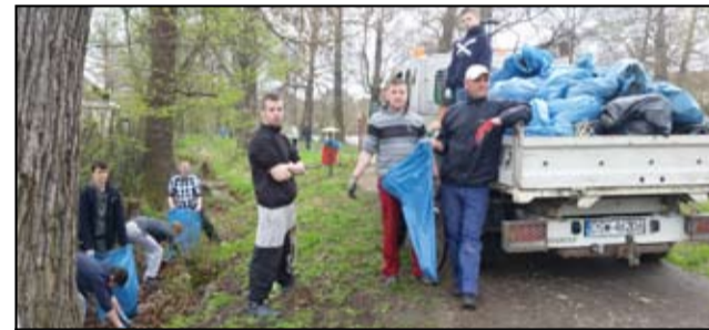
Cała przyczepa śmieci. Tak wygląda efekt wspólnej akcji mieszkańców Mrowin.