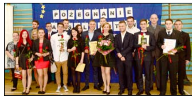
Na zdjęciu uczniowie czwartej klasy Technikum, tegoroczni maturzyści wraz z wychowawcą.