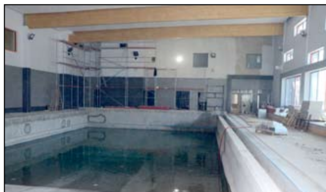
Aby sprawdzić szczelność niecki basenowej trzeba było napędnąć ją najpierw wodą.

ubiegały się o przyznanie wsparcia finansowego na budowę krytych pływalni, Żarów otrzymał najwyższe dofinansowanie. Pieniądze na budowę basenu w Żarowie pochodzą ze środków Funduszu Rozwoju Kultury, w ramach „Programu Rozwoju Bazy Sportowej Województwa Dolnośląskiego na lata 2014-2016”.