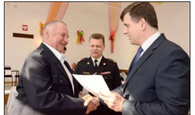
Zjazd delegatów OSP RP był także okazją do szczególnych podziękowań dla druhów z żarowskich jednostek Ochotniczej Straży Pożarnej.