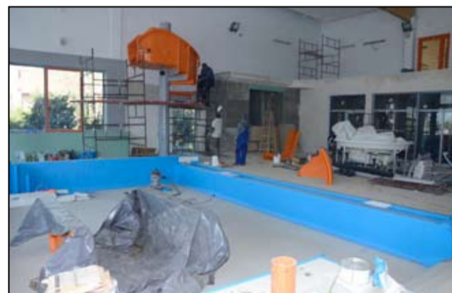
Specjalistyczne urządzenia, które montowane są na żarowskim basenie z pewnością ucieszą nie tylko najmłodszych.

Przypomnijmy, że inwestycja kosztować będzie ponad 9 milionów złotych, z czego wsparcie unijne wyniesie 2,5 miliona złotych. Spośród gmin, które