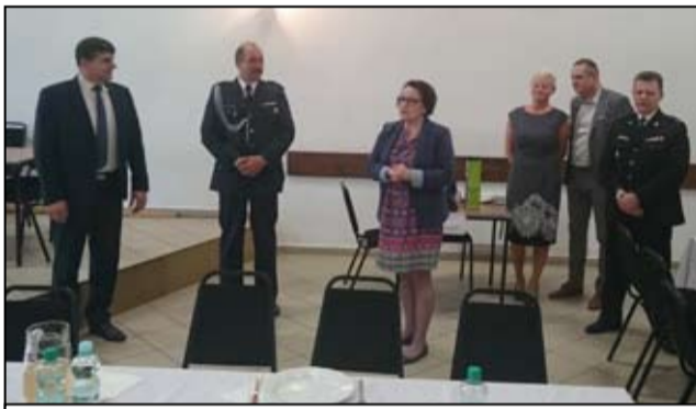
Żarowskim strażakom dziękowała także poseł na Sejm RP Anna Zalewska.