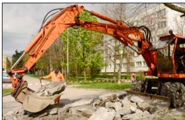
Mieszkańcy Żarowa muszą jeszcze przez chwilę uzbroić się w cierpliwość. Za kilka dni odcinek drogowy zostanie w całości udostępniony użytkownikom ruchu drogowego.