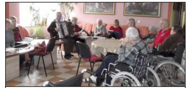
Zespół Żarowianie wystąpił dla pensjonariuszy w hotelu Żarmed.