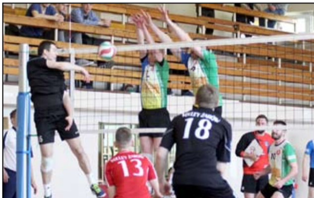
Każdy mecz w wykonaniu drużyny UKS Volley Żarów to duża dawka emocji. I nie tylko wtedy, kiedy żarowski zespół wygrywa.

Paulina Walczewska/op. red. Magdalena Pawlik