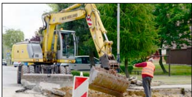
Zniszczony odcinek drogi przy ul. Kazimierza Wielkiego w Żarowie był od dłuższego czasu wielką bolączką kierowców. Zwłaszcza, że jest to droga, na której panuje duży ruch.