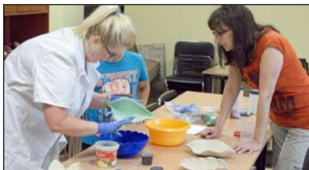
Podczas zajęć w pracowni ceramicznej w żarowskim Gminnym Centrum Kultury i Sportu.

tor generalny Colorobbia Polska, który wspólnie z młodzieżą zasiądzie do pracy. To dopiero początek dobrej współpracy Colorobbii Polska z pracownią ceramiczną Gminnego Centrum Kultury i Sportu w Żarowie.