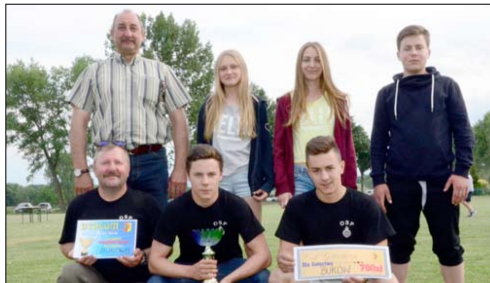
Na zdjęciu tegoroczni zwycięzcy Turnieju Wsi – mieszkańcy Bukowa.