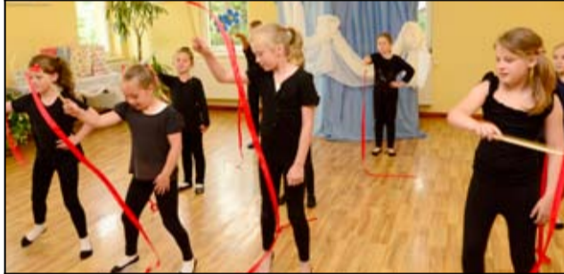
Uczniowie szkoły podczas występu artystycznego.