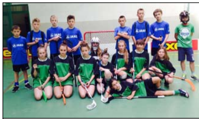
Na zdjęciu drużyna uczniów z SP Imbramowice.