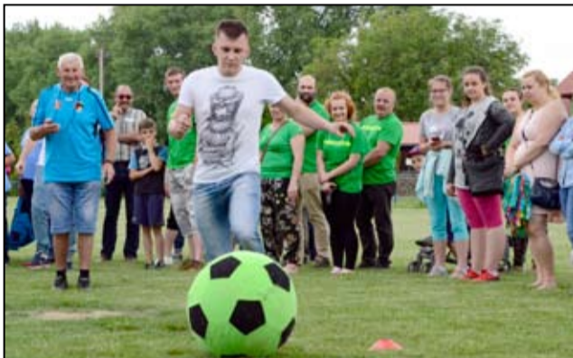
Zawodnicy rywalizowali w sześciu konkurencjach. Były to kręciola i strzał na bramkę, bicie piany, slalom z taczka, rzut beretem z antenką, narty i rzut jajkiem do partnera.