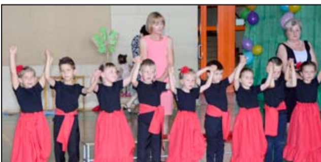
Wspólnym tańcom i zabawom nie było końca. Ostatni raz w takim gronie...