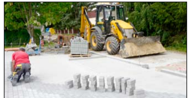
Koszt wykonania remontu parkingu wraz z odwodnieniem zamknie się kwotą w wysokości 65 tysięcy złotych.