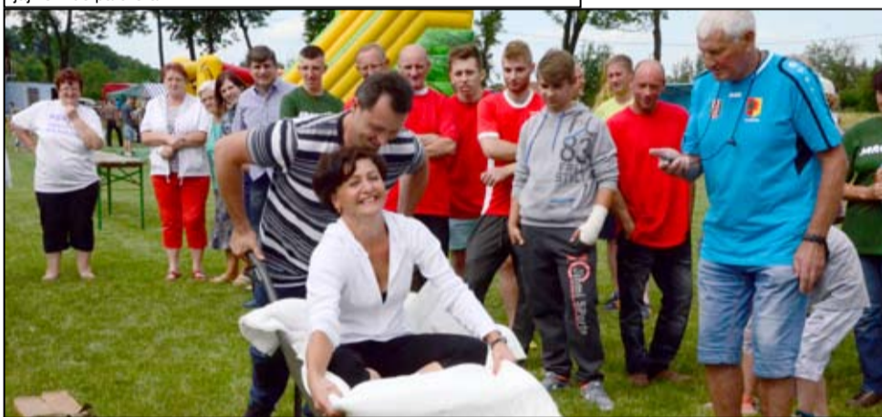
W tej konkurencji trzeba było nie tylko wykazać się precyzją. Najważniejszy był czas pokonania trasy.