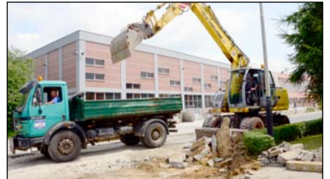
Droga przy ul. Kazimierza Wielkiego wreszcie doczekała się przebudowy.

Zniszczony odcinek drogi przy skrzyżowaniu ulicy Piastowskiej i Kazimierza Wielkiego w Żarowie doczekał się remontu.