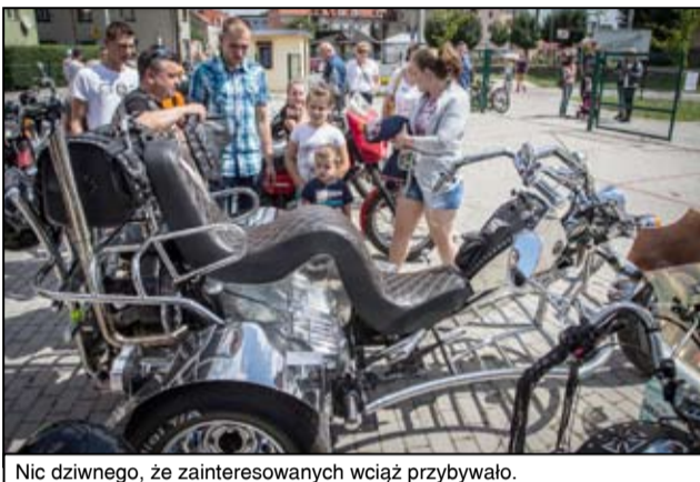
Nic dziwnego, że zainteresowanych wciąż przybywało.

naszej wschodniej granicy były m.in. wspaniała czarna Wołga-Gaz 24 oraz Zaporoziec 968M. - Wielkim zainteresowaniem publiczności cieszył się amerykański krążownik Buick Riviera, skrywający pod maską potężny ponad 7 litrowy silnik benzynowy o mocy 350 KM. Najstarszym pojazdem I Żarowskiego Spotkania Miłośników Motoryzacji był VW typ 82 Kübelwagen, rocznik 1943 z oryginalnym silnikiem, zdobywca tytułu: Show&Shine - pojazd wzbudzający największy zachwyt - mówił Bogdan Mucha z Gminnego Centrum Kultury i Sportu w Żarowie.