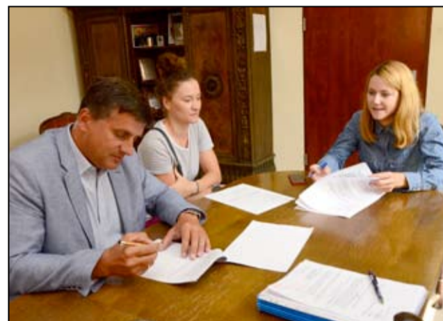
Moment podpisania umowy na realizację inwestycji.