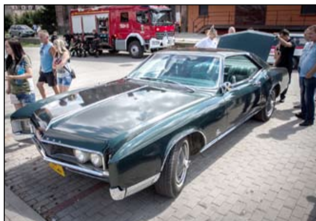
Tego jeszcze w Żarowie nie było. W jednym miejscu Żarowianie mogli podziwiać prawdziwe samochodowe „cacuszka”.

Miłośników Motoryzacji uświetnił pokaz Straży Pożarnej w wykonaniu strażaków z OSP Żarów, którzy w pocie czoła zaprezentowali techniki cięcia pojazdu w celu wydobycia poszkodowanych pasażerów. Na zakończenie specjalnie dla żarowian przygotowano wspaniałą i huczną paradę ulicami miasta. Kolejne spotkanie miłośników motoryzacji w przyszłym roku.