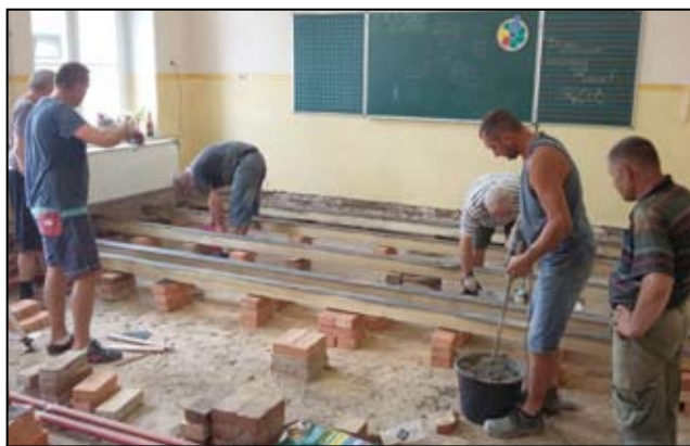
Remont sali lekcyjnej w SP Mrowiny.