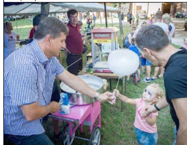
Do udzielenia pomocy chorej dziewczynce nikogo nie trzeba było namawiać. Żarowianie chętnie wspomogli charytatywną zbiórkę.