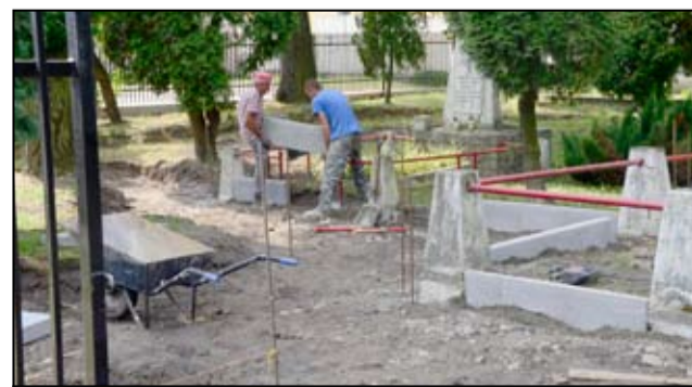
Prace remontowe na żarowskim cmentarzu radzieckim potrwają najprawdopodobniej do połowy września.