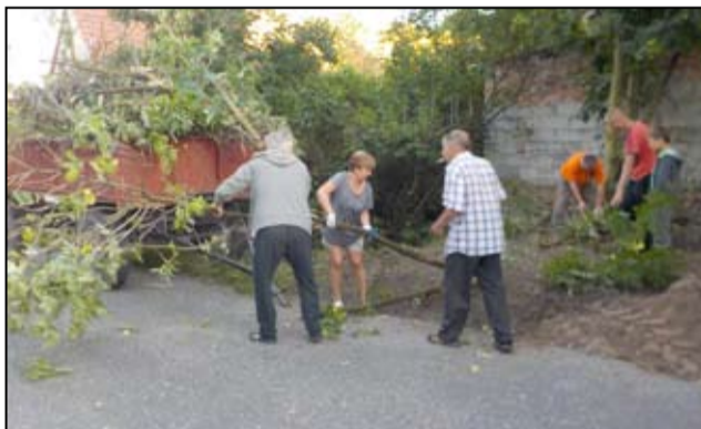
Wspólne prace porządkowe na terenie wsi.