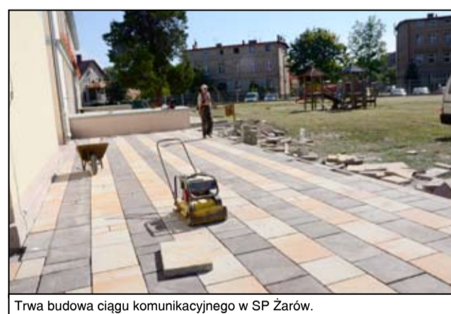
Trwa budowa ciągu komunikacyjnego w SP Żarów.

W placówkach przedszkolnych wakacje były również czasem intensywnych przygotowań do nowego roku szkolnego. - W Bajkowym Przedszkolu przeprowadzony został remont gabinetu do prowadzenia zajęć rewalidacyjnych wraz z łazienką, zdemontowano drewnianą boazerię na drogach ewakuacyjnych w przedszkolu wraz z montażem płyt regipsowych, wymieniliśmy instalację ciepłej wody i cyrkulacji. W ramach prac remontowych