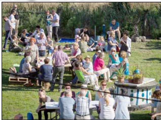
Muzyka Bacha tym razem zabrzmiała w siedlimowickim młynie.

W zabytku, wśród unoszącego się zapachu zboża, wy-