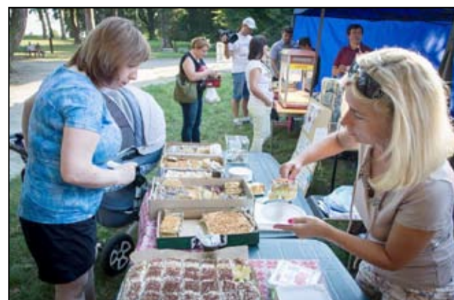
Wśród licznych atrakcji przygotowanych dla mieszkańców nie zabrakło słodkich pyszności, które serwowali członkowie Żarowskiej Wspólnoty Samorządowej.