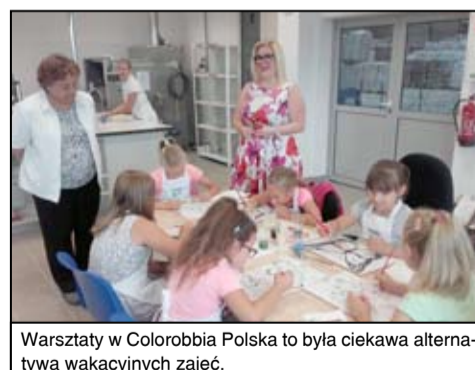
Warsztaty w Colorobbia Polska to była ciekawa alternatywa wakacyjnych zajęć.

Podczas warsztatów młodzi artyści mieli okazję zobaczyć z bliska jak powstają najpiękniejsze płytki, przygotowywane przez Colorobbię. W zachwyt wprawiały te z domieszką złota, ale również te, które imitowały drewno lub granit. Wycieczka po fabryce była tylko wstępem do tego,