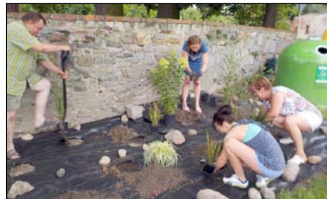
Na końcowy efekt aż miło popatrzeć.