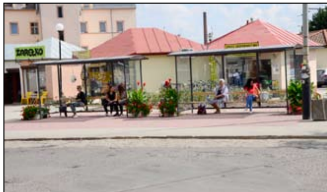
Przy nowych wiatkach przystankowych postawione są donice z pięknymi rabatami.

Na efekty nie trzeba było długo czekać. A dziś podzi-