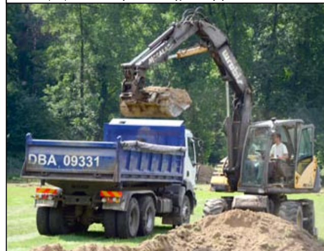
To będzie piękny obiekt. Trzeba tylko jeszcze trochę poczekać...