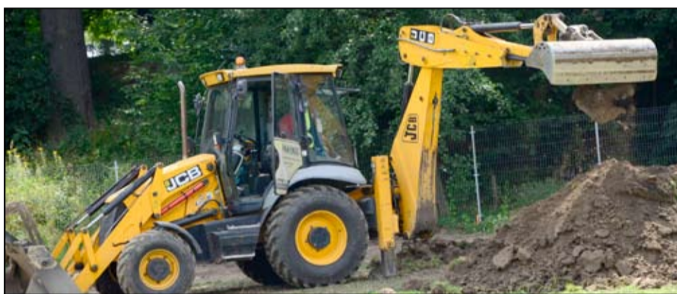
Pierwsze prace remontowe przy modernizacji boiska treningowego przy ul. Zamkowej w Żarowie rozpoczęły się w połowie sierpnia.