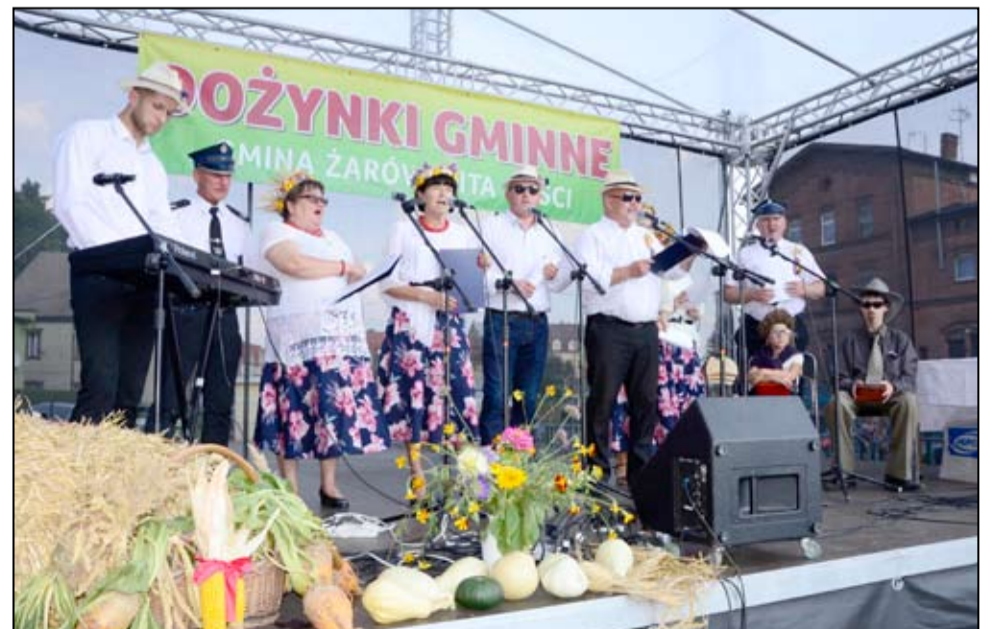
Dobrą zabawę zapewnili mieszkańcy Mrowin przedstawiając wiejską wersję przeboju Boys „Jesteś szalona”.