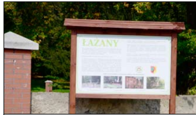
Nowa tablica informacyjna na terenie Łażan.