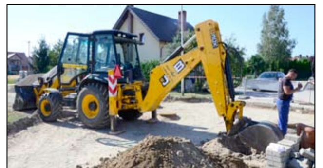
Powoli kończą się prace remontowe przy ul. Dębowej w Żarowie.