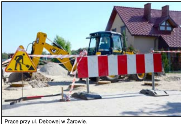
Prace przy ul. Dębowej w Żarowie.

Prace rozpoczęły się już przy ul. Spokojnej w Żarowie, gdzie w tej chwili trwa przebudowa pierwszego odcinka drogowego. Nie jest to jedyna droga, która doczeka się modernizacji. Zgodnie z podpisaną umową, także ulica Boczna w Krukowie zyska nową nawierzchnię drogową. Nowe drogi kosztować będą dokładnie 247.157,25 złotych i zostaną sfinansowane z budżetu gminy Żarów i pozyskanej dotacji z Funduszu Ochrony Gruntów Rolnych Województwa Dolnośląskiego w wysokości blisko 130 tysięcy złotych. - Po wielu latach oczekiwania droga przy żarowskim cmentarzu komunalnym, razem z łącznikiem i miejscami parkingowymi zostanie wyremontowana. Prace powinny zakończyć się w połowie października, tak żeby nie utrudniać ruchu tuż przed świętem 1 listopada. Każdego roku, w naszej gminie modernizowane są drogi dojazdowe do pól, na których remont pozyskujemy dodatkowe środki finansowe. Staramy się także, z dodatkowego rozdziału o pozyskanie dofinansowania na remont ulicy Spokojnej