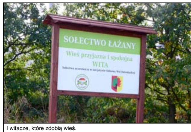
Witacze, które zdobią wieś.