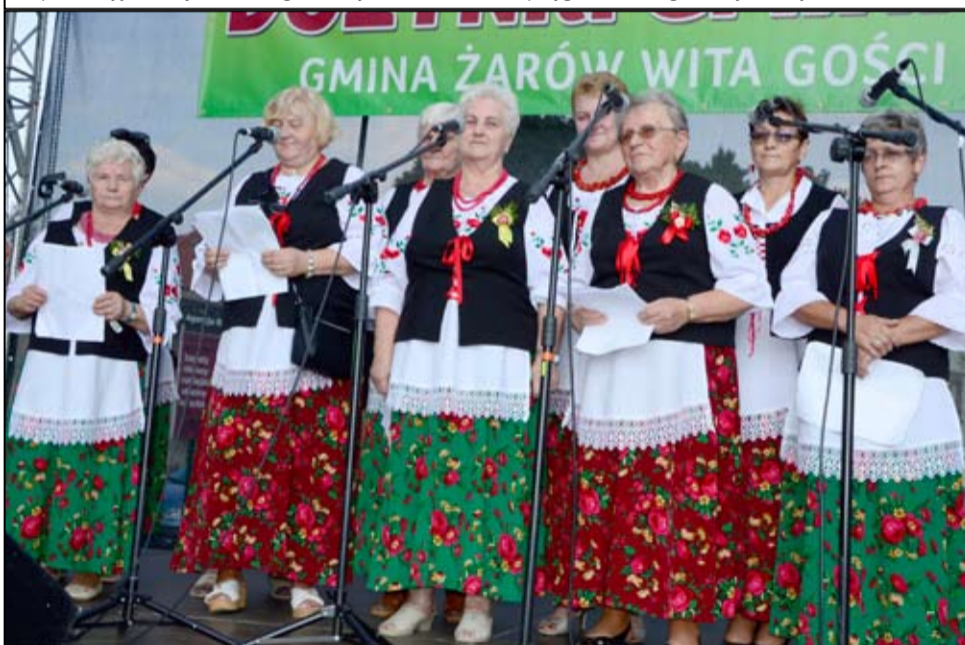
Na zdjęciu rozśpiewane panie z Koła Gospodyń Wiejskich z Imbramowic.