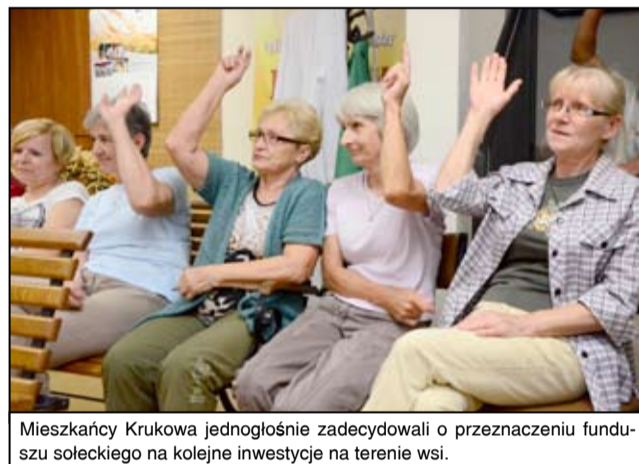
Mieszkańcy Krukowa jednogłośnie zdecydowali o przeznaczeniu funduszu sołeckiego na kolejne inwestycje na terenie wsi.

Fundusz sołecki to środki, które gmina oddaje do dyspozycji wsi. Są to środki z budżetu gminy Żarów. Ich wysokość jest ustalana corocznie i zależy od liczby mieszkańców sołectwa oraz bieżących dochodów gminy. Nie są to środki sołectwa, ale przeznaczane są dla mieszkańców wsi na poprawę warunków ich życia. - Podzieliłiśmy pieniądze na potrzeby naszej wsi. Będzie to zakup traktorka do koszenia trawy, telewizora na świetlicę wiejską, strojów dla młodzieżowego zespo-