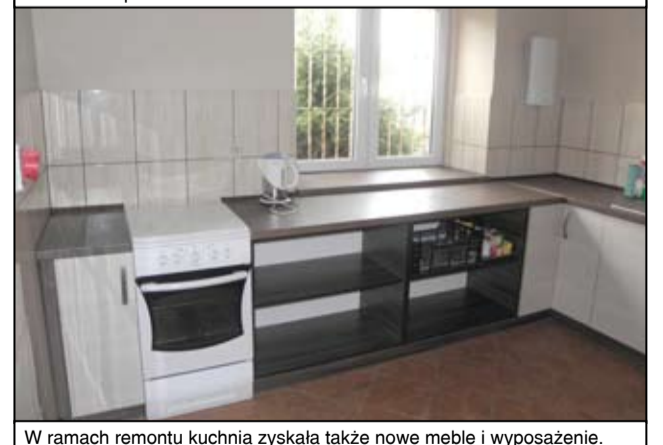
W ramach remontu kuchnia zyskała także nowe meble i wyposażenie.