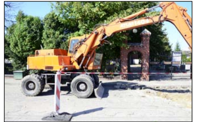
Droga przy żarowskim cmentarzu komunalnym nareszcie zostanie wyremontowana. To dobra wiadomość dla wszystkich mieszkańców.

Prace trwają również przy ulicy Dębowej w Żarowie. To dokończenie kolejnego etapu remontu. - W ramach inwestycji wykonana zostanie nowa podbudowa z kruszyw drogowych, obrzeża na ławie betonowej, krawężniki, przepust z rur wzmacnianych oraz dwie studzienki deszczowe wraz z wpustami ulicznymi. Prace, które pochłoną dokładnie 64.882,50