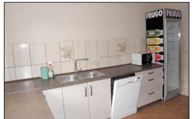
Odnowione pomieszczenie robi duże wrażenie.