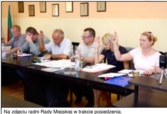
Na zdjęciu radni Rady Miejskiej w trakcie posiedzenia.