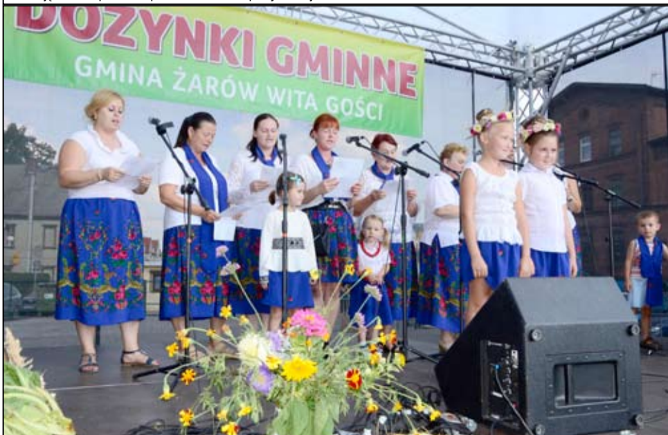
W kolorowych strojach, na scenie prezentowali się mieszkańcy wsi. Dożynkowe przyspiewki to tradycyjna część wspólnej wiejskiej zabawy. Na zdjęciu mieszkańcy Bożanowa w trakcie swojego występu.