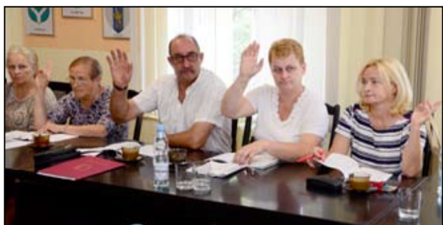
Uchwałę w sprawie określenia zasad gospodarowania nieruchomościami stanowiącymi własność Gminy Żarów radni przegłosowali jednogłośnie.