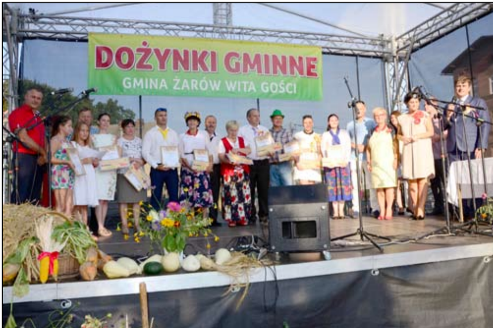
Wspólne zdjęcie sołtysów i zaangażowanych mieszkańców w przygotowanie tegorocznych dożynek.