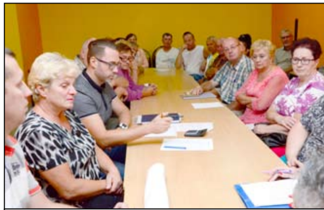
Dzięki dodatkowym środkom finansowym mieszkańcy Łażan zrealizują wiele zadań inwestycyjnych.