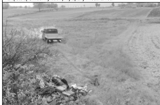
Moment uchwycenia przez fotopułapkę ...

Wszyscy mieszkańcy mogą korzystać z Punktu Selektywnej Zbiórki Odpadów, który zlokalizowany jest przy ul. Armii Krajowej 34 w Żarowie, a czynny w poniedziałki w godz. 16.00-18.00, środy w godz. 14.00-18.00 i soboty w godz. 10.00-12.00. Dodatkowo, raz w miesiącu, po wcześniejszym zgłoszeniu telefonicznym można uzyskać odbiór odpadów wielkogabarytowych (meble, AGD, RTV i inne). Przypominamy także, że każda firma działająca na terenie gminy Żarów, zgodnie z wymogami powinna mieć podpisaną umowę na odbiór odpadów, a każde większe ilości śmieci należy utylizować zgodnie z przepisami.