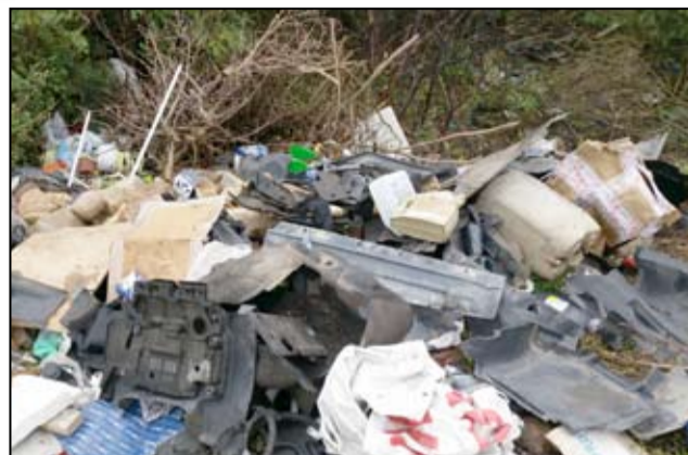
Taką stertę śmieci wyrzucił przyłapany mieszkaniec.