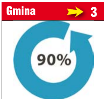
Gmina → 3 Skorzystaj z 90-procentowej bonifikaty i wykup mieszkanie na własność.