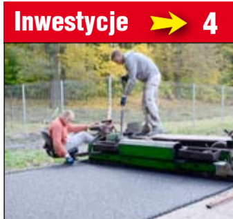
Investycje → 4 Dobiega końca przebudowa stadionu sportowego w Żarowie.