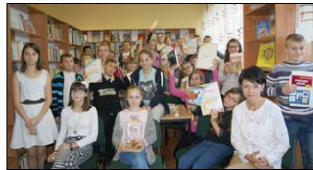
Na zdjęciu uczestnicy Konkursu Pięknego Czytania w SP Żarów.