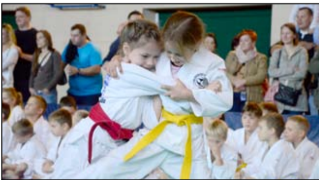
Determinacji i zaangażowania. Tego zawodnikom judo nie sposób odmówić.