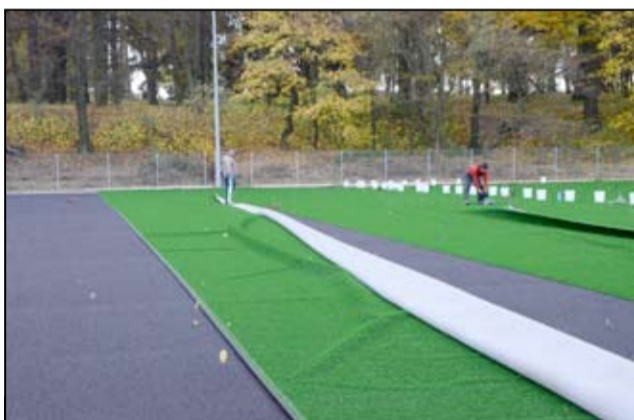
Moment rozkładania trawy syntetycznej.