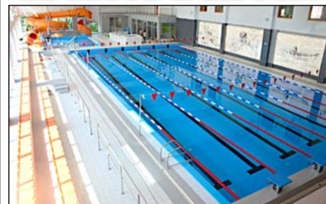
Na basen w Żarowie można się wybrać każdego dnia i skorzystać z wodnych atrakcji, których tutaj nie brakuje.

Od dnia 10 września w Żarowie przy ul. Piastowskiej 10A funkcjonuje kryta pływalnia. Zapraszamy wszystkich miłośników pływania, sauny i masażów wodnych do skorzystania z jej usług.