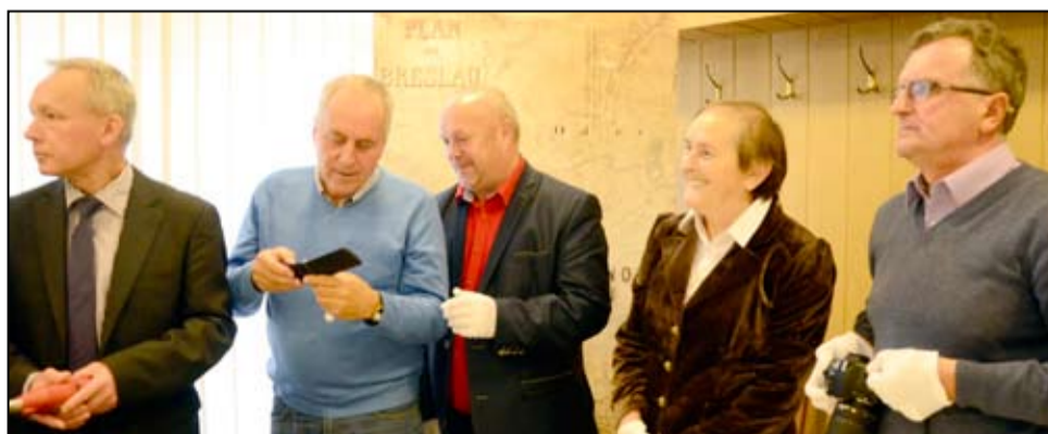
Przy otwarciu Kapsuły Czasu we Wrocławiu obecni byli także radni Rady Miejskiej Żarowa.