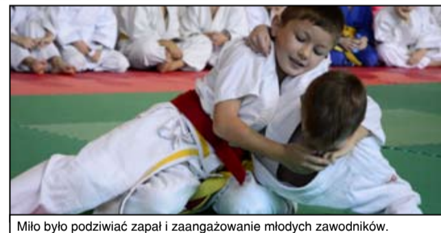
Miło było podziwiać zapał i zaangażowanie młodych zawodników.