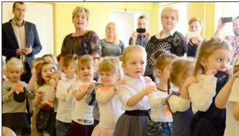
Nie zabrakło występów artystycznych, piosenek i wierszyków. Dzieci przed zgromadzoną publicznością zaprezentowały wszystko, czego do tej pory nauczyły się już w przedszkolu.