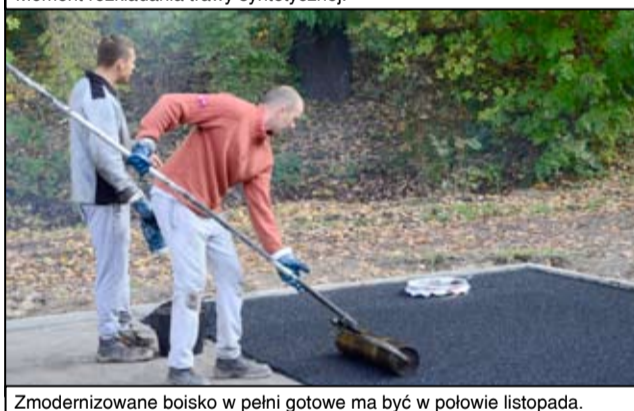
Zmodernizowane boisko w pełni gotowe ma być w połowie listopada.