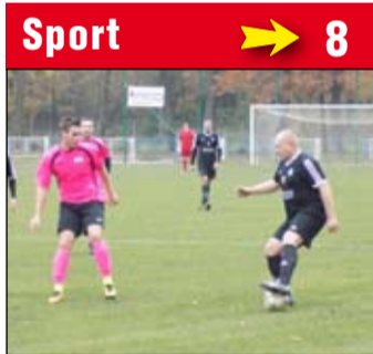
Sport → 8 Górnik dość niespodziewanie przegrał w Jaskowej Dolnej i stracił pozycję lidera na rzecz Nysy Kłodzko.