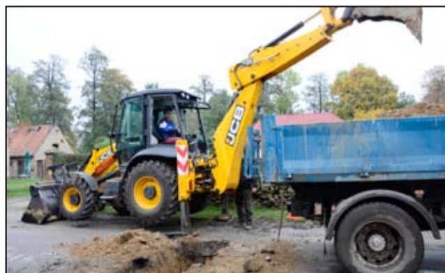
Mieszkańcy ul. Wojska Polskiego w Mrowinach mogą odetchnąć z ulgą. Awaryjna sieć wodociągowa nareszcie zastąpiona została nową siecią rozdzielczą.