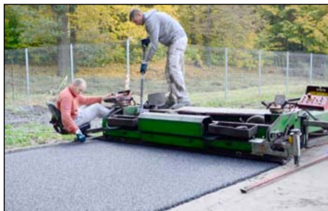
Boisko treningowe zostało już prawie zmodernizowane. Kończy się powoli ostatni etap prac na tym obiekcie.