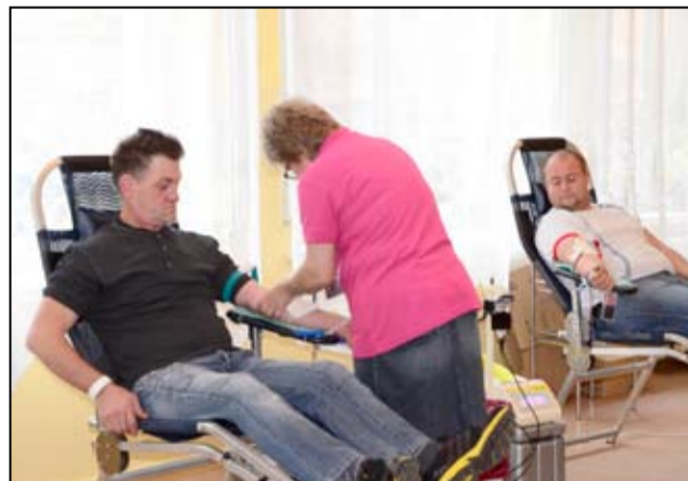
Mieszkańców gminy Żarów nie trzeba było zachęcać do udziału w szczytnej akcji.