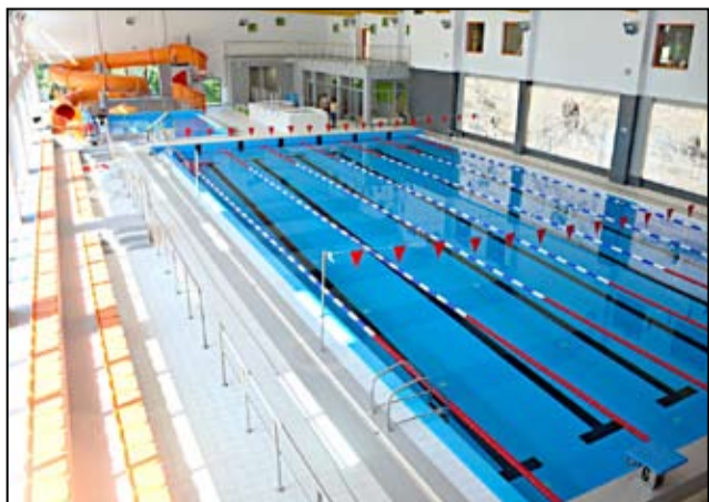
Na basen w Żarowie można się wybrać każdego dnia i skorzystać z wodnych atrakcji, których tutaj nie brakuje.