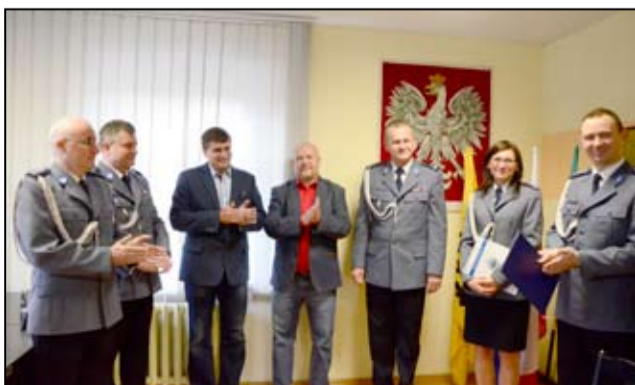
Uroczystość nominacji była okazją do złożenia gratulacji dla nowej komendantki policji w Żarowie.