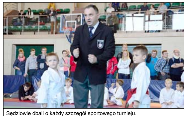
Sędziowie dbali o każdy szczegół sportowego turnieju.