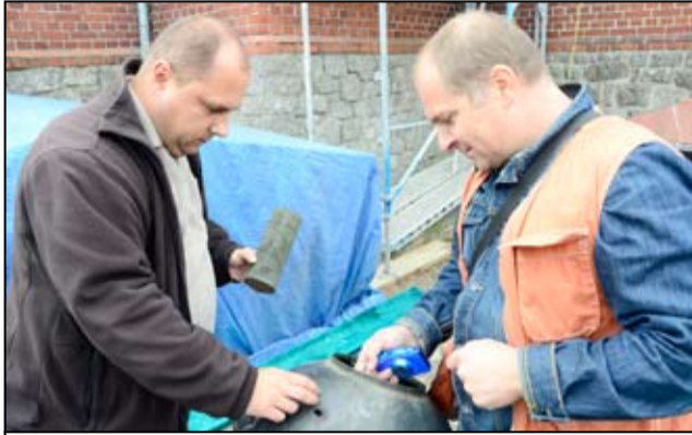
Moment wydobycia Kapsuły Czasu.

Tegoroczny remont dachu zabytkowej kaplicy na cmentarzu komunalnym w Żarowie odsłonił skrywaną przez lata tajemnicę. Dziś wiemy już, co skrywała kapsuła czasu, odnaleziona na dachu cmentarnej kaplicy. Przypomnijmy, że to popularne określenie puszki, w której zamykano dokumenty z okresu, w którym prowadzono w budynkach roboty budowlane.