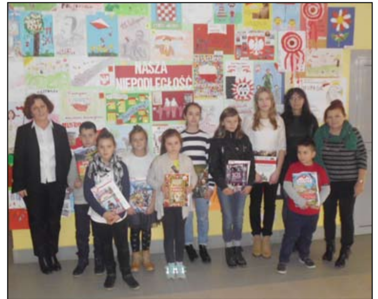
Na zdjęciu laureaci konkursu „Nasza Niepodległość” wraz z organizatorami konkursu.