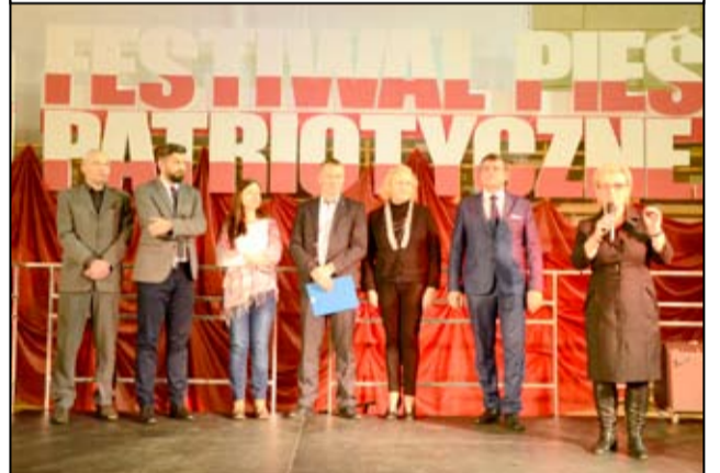
Jury, tuż przed ogłoszeniem wyników festiwalu.