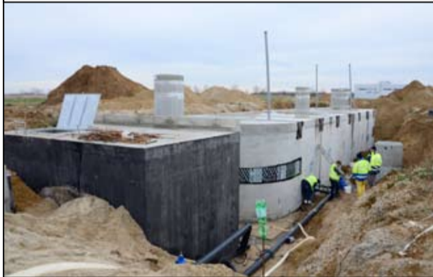
Budowa nowego zbiornika retencyjnego.