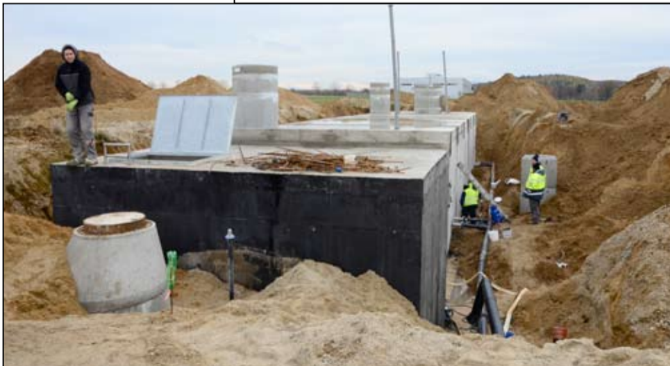
Inwestycja ma zakończyć się jeszcze w 2016 roku.