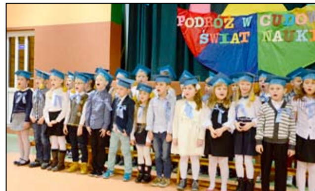
Nie tylko dla pierwszoklasistów i ich rodziców, ale również dla nauczycieli była to wyjątkowa chwila.