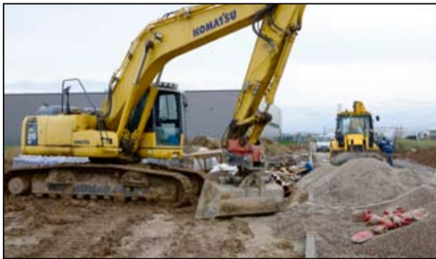
Nowi inwestorzy chętnie lokują swoje inwestycje na terenie żarowskiej podstrefy ekonomicznej.