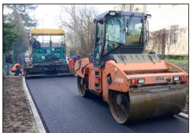
Rolnicy i mieszkańcy mają do dyspozycji kolejny odcinek nowej drogi dojazdowej do gruntów rolnych w Imbramowicach.