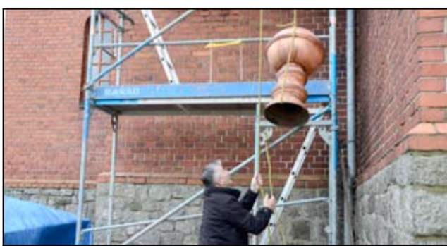
Odnowiona kopuła, a w niej ukryta Kapsuła Czasu z powrotem zostały ulokowane na dachu kaplicy cmentarnej w Żarowie.