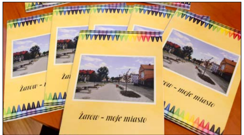
Nowe kolorowe opracowanie o Żarowie „Żarów moje miasto”.