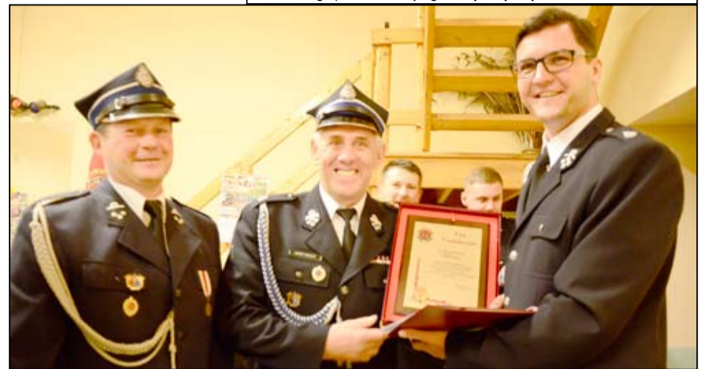
Druhowie otrzymali specjalny list gratulacyjny od strażaków z jednostki Nowice.