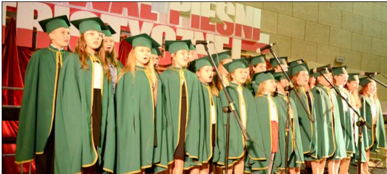
Pierwsze miejsce w kategorii Zespoły i Kapele zajął zespół „Dominanta” ze Szkoły Podstawowej im. Jana Brzechwy w Żarowie.