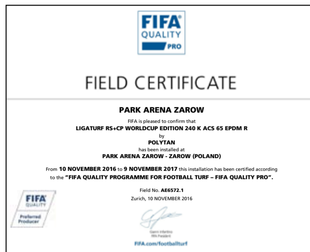
Tak wygląda nadany certyfikat FIFA Quality PRO.