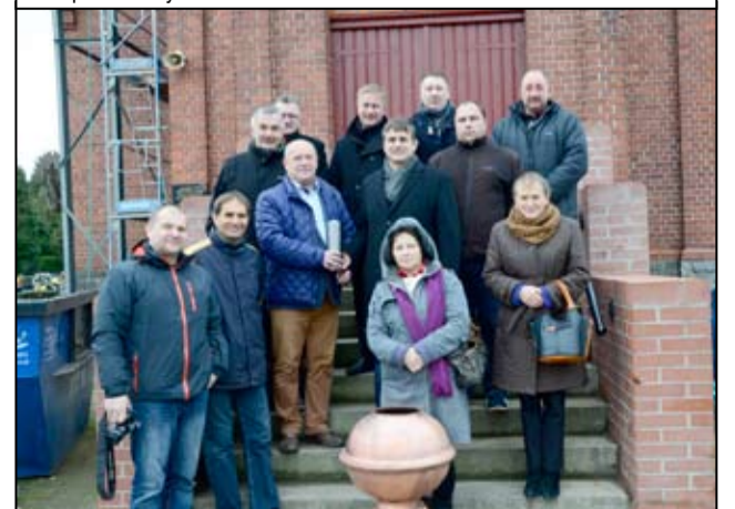
Wspólne zdjęcie przed umieszczeniem Kapsuły Czasu na dachu kaplicy.