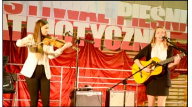
Podczas festiwalu nie zabrakło także rozśpiewanej młodzieży.