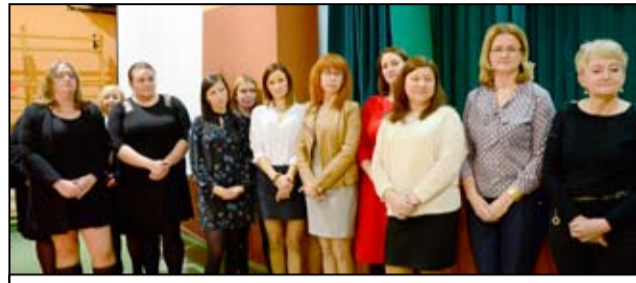
Na zdjęciu pracownicy żarowskiego Ośrodka Pomocy Społecznej.

Z okazji swojego święta żarowscy pracownicy socjalni wręczyli podziękowania również tym, którzy na co dzień wspierają działalność Ośrodka Pomocy Społecznej. Ciepłe słowa i upominki powędrowały do wolontariuszy, pracowników świetlic