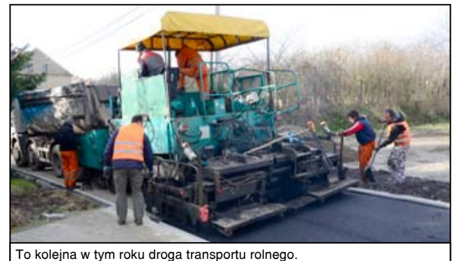
To kolejna w tym roku droga transportu rolnego.