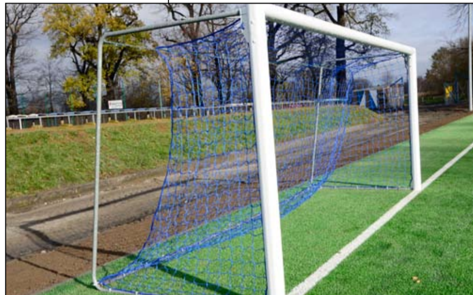
Obiekt zyskał sztuczną nawierzchnię z trawy syntetycznej, zamontowane zostały także piłkochwyty, nowe bramki i wiaty mobilne dla zawodników