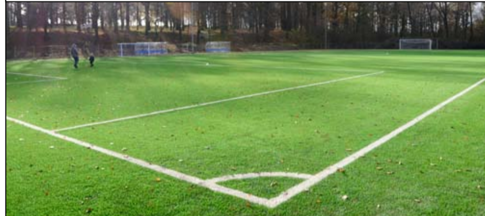
Tak po modernizacji wygląda dziś boisko treningowe w Żarowie.