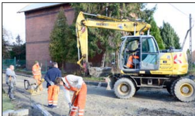
Szybko i sprawnie wykonano roboty przygotowawcze, a już kilka dni później kładziono nawierzchnię asfaltową.