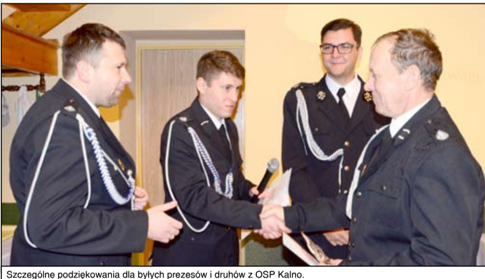
Szczególne podziękowania dla byłych prezesów i druhow z OSP Kalno.