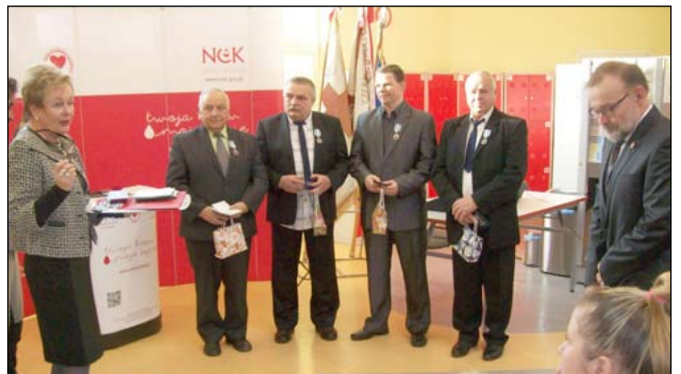
Na zdjęciu odnaczeni odznaką „Honorowy Dawca Krwi – Zasłużony dla Zdrowia Narodu” żarowscy krwiodawcy.