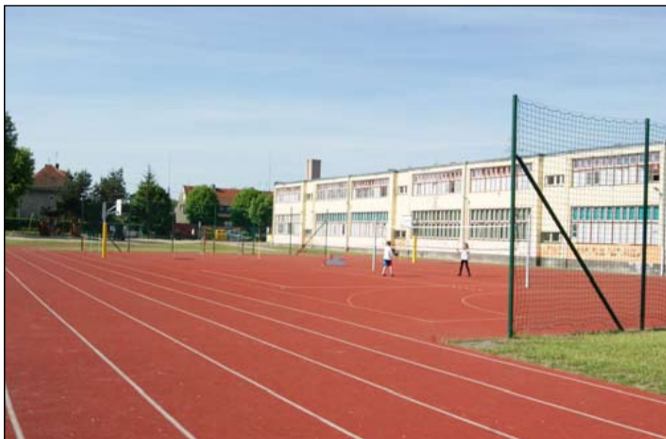
Na generalny remont czeka także budynek Szkoły Podstawowej im. Jana Brzechwy w Żarowie.

10. Przebudowa oraz doposażenie obiektów instytucji kultury w gminie Żarów – przebudowa świetlic wiejskich w miejscowości Mielęcino, Mrowiny i Przyłęgów (Pieniądze na to zadanie są już przyznane. Całkowita wartość projektu: 833 032,99 zł , kwota dofinansowania: 699 734,03 zł .)