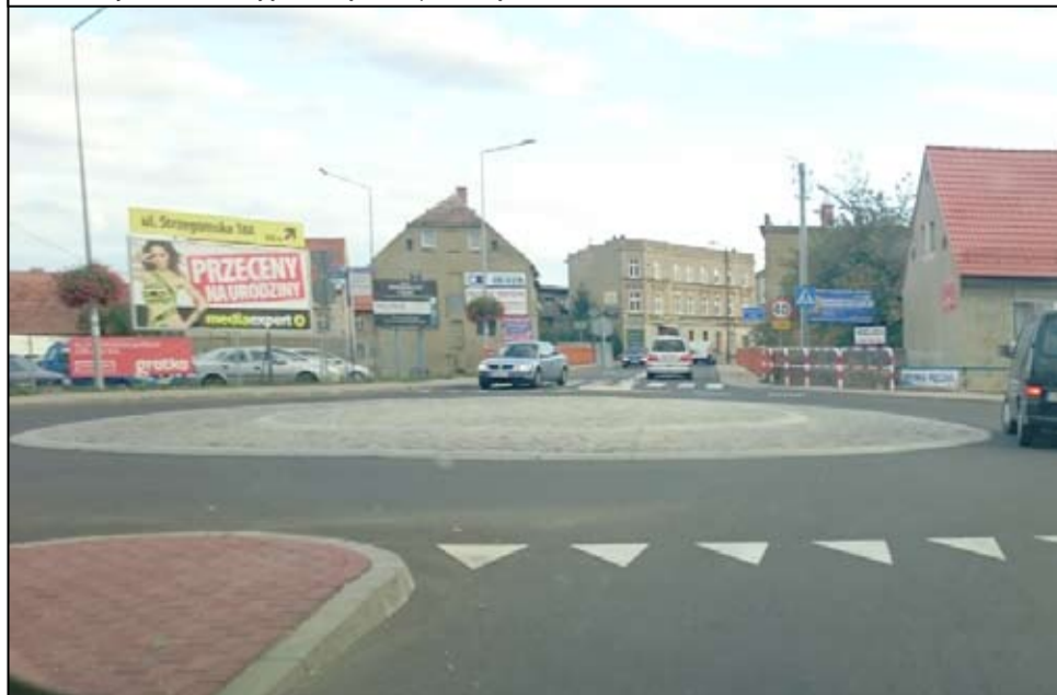
O tym, kiedy na terenie naszej gminy rozpocznie się realizacja strategicznych inwestycji dowiemy się w 2017 roku.