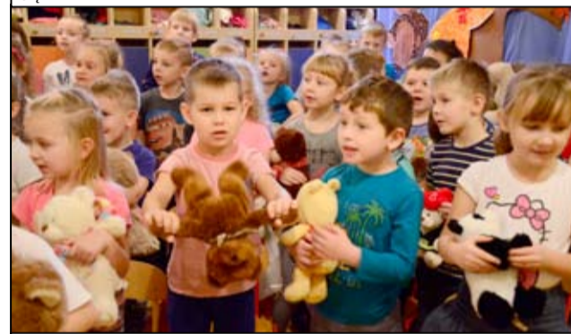
Pluszowe misie opanowały także Bajkowe Przedszkole w Żarowie.