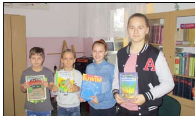
Na zdjęciu uczniowie SP Imbramowice w trakcie realizacji projektu „Czytanie na powitanie”.