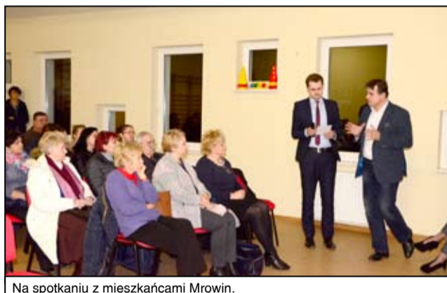
Na spotkaniu z mieszkańcami Mrowin.