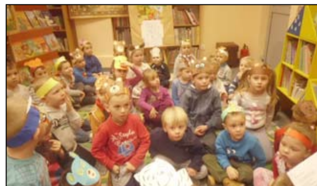
Oddział dziecięcy żarowskiej biblioteki zamienił się w prawdziwą misiolandię.