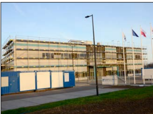
Druga nowa fabryka ILP sp z o.o. zajmie się produkcją elementów aluminiowych na potrzeby przemysłu samochodowego.

Na terenie żarowskiej podstrefy ekonomicznej trwa również rozbudowa innych