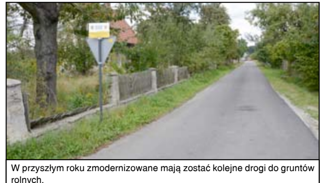
W przyszłym roku zmodernizowane mają zostać kolejne drogi do gruntów rolnych.