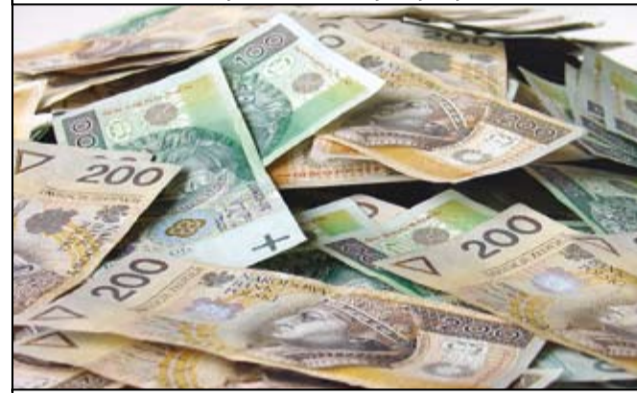
To kolejna dobra wiadomość dla mieszkańców gminy Żarów.