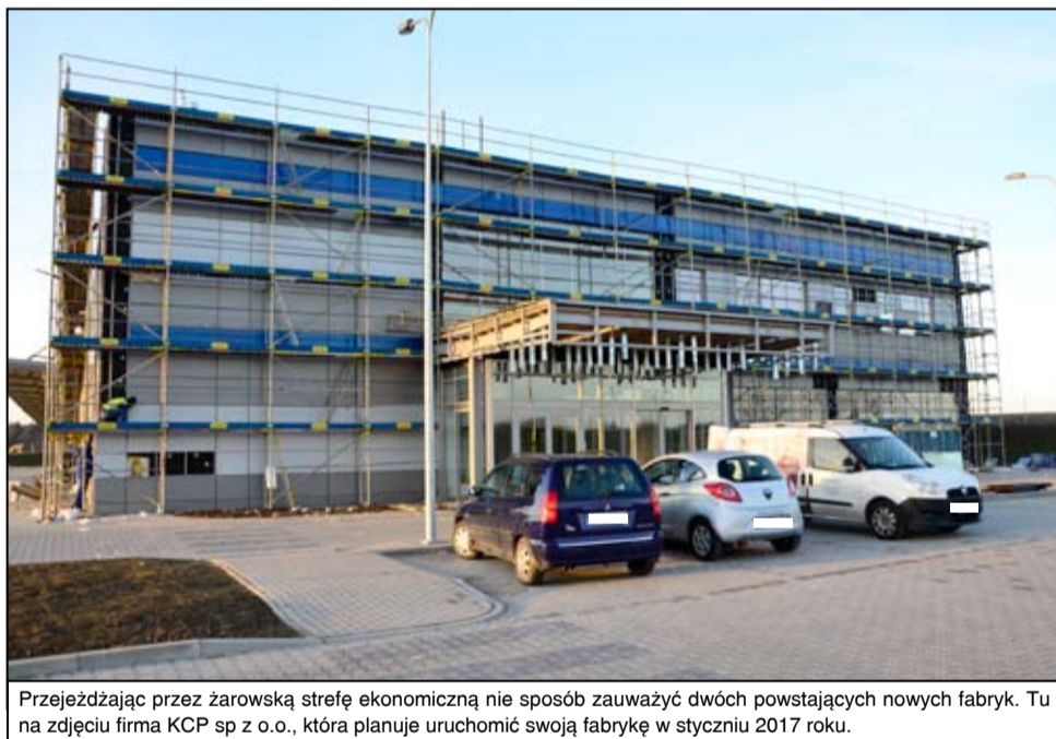
Przejeżdżając przez żarowską strefę ekonomiczną nie sposób zauważyć dwóch powstających nowych fabryk. Tu na zdjęciu firma KCP sp z o.o., która planuje uruchomić swoją fabrykę w styczniu 2017 roku.