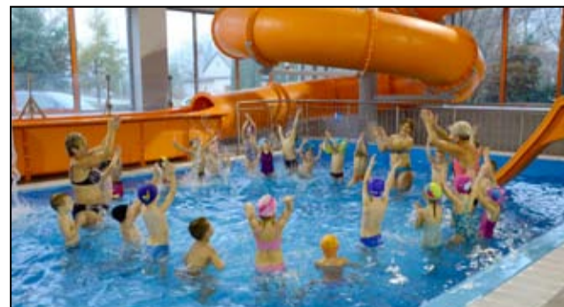
Wspólna zabawa na żarowskim basenie.