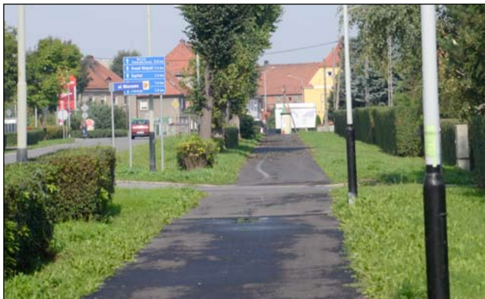
Budowa ścieżek rowerowych, zintegrowanego centrum przesiadkowego i nowych ciągów pieszych. Na te zadania mieszkańcy Żarowa czekają z wielką niecierpliwością.