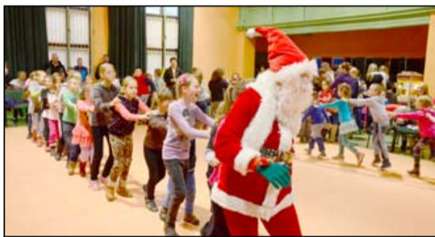
Święty Mikołaj 6 grudnia nie zapomniał o prezentach i wszystkim obecnym na sali dzieciom wręczył świąteczne paczki.