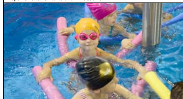
Dla przedszkolaków to wielka frajda.