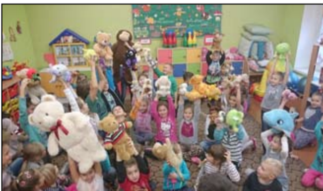
Na zdjęciu uczniowie Szkoły Podstawowej im. Anny Jenke w Mrowinach ze swoimi przytulankami.