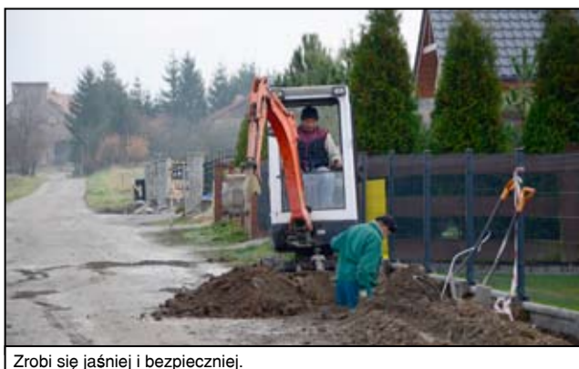
Zrobi się jaśniej i bezpieczniej.

mieszkańcy Mrowin. W przypadku Imbramowic inwestycja ta wyniesie 16.300,89 złotych, swój wkład w to zadanie wniosą także mieszkańcy wsi, którzy z funduszu sołeckiego dołożyli 10 tysięcy złotych. W każdym przypadku, na inwestycje składają się nie tylko same roboty budowlane, ale także wcześniej przygotowana dokumentacja projektowa, sporządzona mapa oraz zakupiony dziennik budowy.