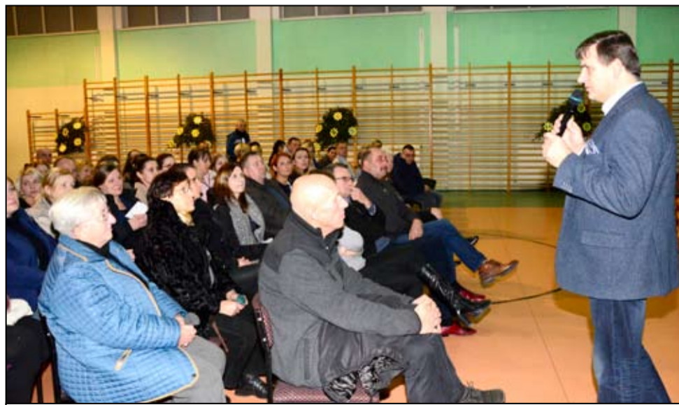
Konsultacje społeczne dotyczyły także funkcjonowania od nowego roku szkolnego Szkoły Podstawowej im. UNICEF w Imbramowicach.

Wyniki ankiet zostaną omówione na obradach Komisji ds. Oświaty i Kultury Rady Miejskiej.