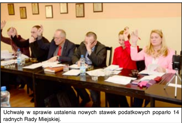
Uchwałę w sprawie ustalenia nowych stawek podatkowych poparło 14 radnych Rady Miejskiej.