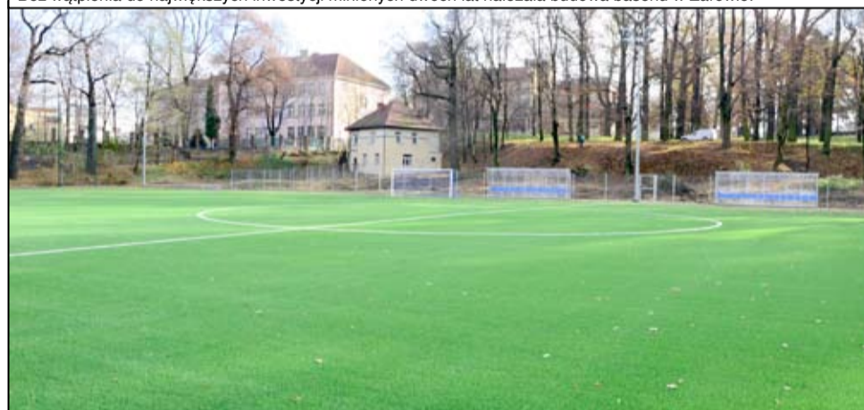
Rok 2016 to także kolejna duża inwestycja sportowa – modernizacja boiska treningowego w Żarowie.