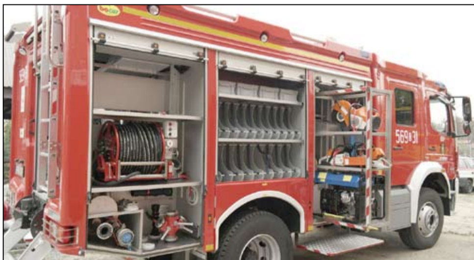
Nowy Mercedes Atego w 2015 roku trafił do OSP w Żarowie. W tym roku także nowy wóz strażacki zostanie zakupiony dla drużyn z Pożarzyska.