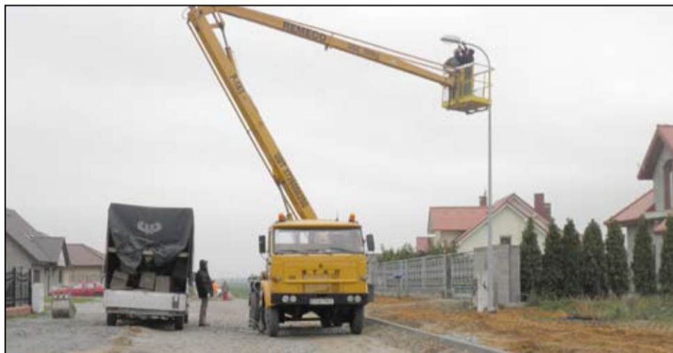
Oświetlenie uliczne: ul. Wierzbowa, Kasztanowa, Dworcowa, Buków, Jodłowa, Wierzbna, ul. Kwiatowa, Kruków ul. Spółdzielcza, Mielęcin, Tarnawa, Imbramowice, Kalno. Koszt zadania to 273.000 zł, fundusz sołecki – 6472,98 zł, dotacja z Ministerstwa Rolnictwa – 1941, 89 zł