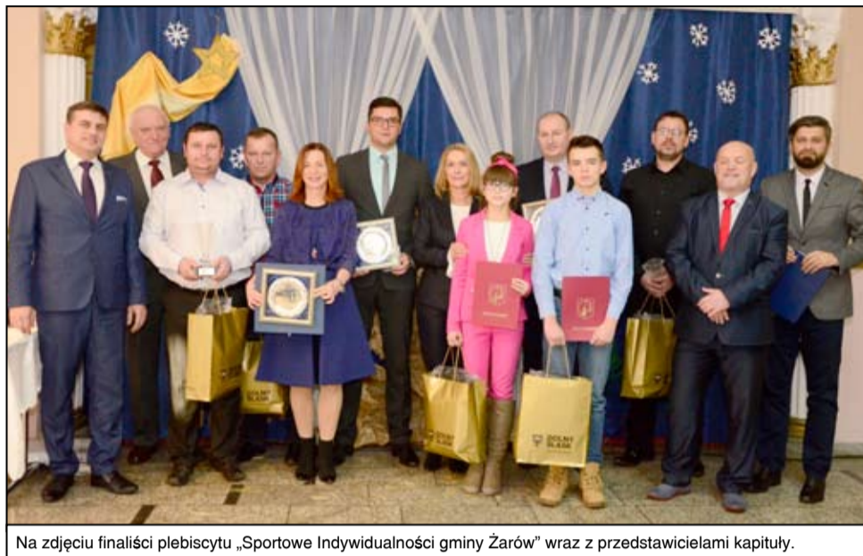
Na zdjęciu finaliści plebiscytu „Sportowe Indywidualności gminy Żarów” wraz z przedstawicielami kapituły.