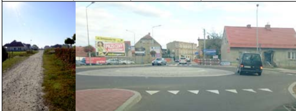
Budowa zintegrowanego centrum przesiadkowego oraz budowa dróg rowerowych, ciągów pieszych wraz z oświetleniem w Żarowie. Koszt zadania to 5.114.351,77 zł, dofinansowanie wyniesie 4.347.199,01 zł