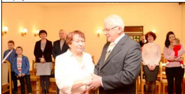
W dniu tak ważnego jubileuszu nie mogło zabraknąć rodziny, która towarzyszyła dostojnym jubilatom.