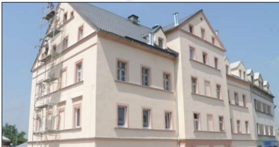
Rewitalizacja budynków wspólnot mieszkaniowych w Żarowie: 29 budynków. Koszt zadania to 3.271.979,28 zł, dofinansowanie wyniesie 1.600.000,00 zł

Wśród zaplanowanych inwestycji na 2017 rok nie zapomnieliśmy także o naszych wsiach. Będzie to przebudowa i doposażenie świetlic wiejskich w Mielęcinie, Mrowinach, Przyłęgowie, budowa świetlic i remiz strażackich w Bukowie i Mrowinach oraz przebudowa świetlicy w Łażanach i Wierzbnej, zakup nowego samochodu dla OSP Pożarzysko, projekt budowy obwodnicy Pożarzyska, wykonanie nawierzchni dróg w miejscowościach Buków, Kruków, Mrowiny, Pożarzysko, Pyszczyń, Imbramowice, Wierzbna i Żarów, modernizacja drogi Mikoszowa-Przyłęgów, wykonanie chodników w Bukowie, Wierzbnej, Pożarzysku, Imbramowicach, Zastrużu, Mrowinach i Marcinowiczkach, kolejny etap przebudowy odwodnienia drogi w Siedlimowicach, budowa kanalizacji w Łażanach i Kalnie z przesyłem do systemu kanalizacji sanitarnej w Żarowie, rewitalizacja centrum wsi Mrowiny, dotacje na prace konserwatorskie w kościołach oraz budowa nowych alejek na cmentarzu komunalnym w Wierzbnej.