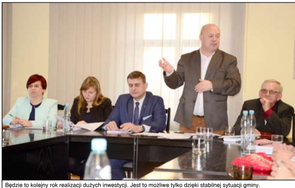
Będzie to kolejny rok realizacji dużych inwestycji. Jest to możliwe tylko dzięki stabilnej sytuacji gminy.

Pozytywnie należy ocenić wielkość dochodów ujętych w przyszlucowym budżecie i w latach następnych, w tym planowanych do pozyskania środków zewnętrznych, które stanowią kwotę blisko 9,3 mln zł i które są przeznaczone w szczególności na zadania realizowane w ramach Aglomeracji Wałbrzyskiej.