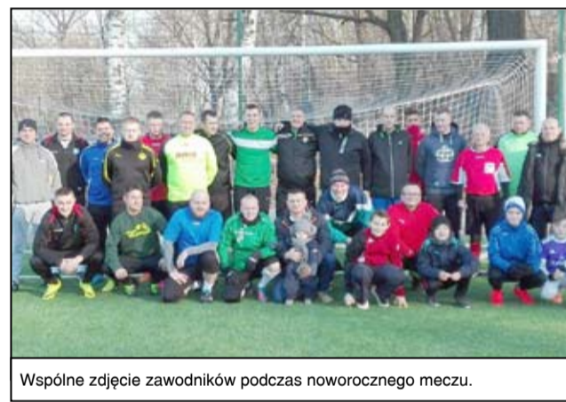
Wspólne zdjęcie zawodników podczas noworocznego meczu.

Nowe boisko treningowe, które do użytku oddane zostało w 2016 roku otwarte jest dla wszystkich sportowców.