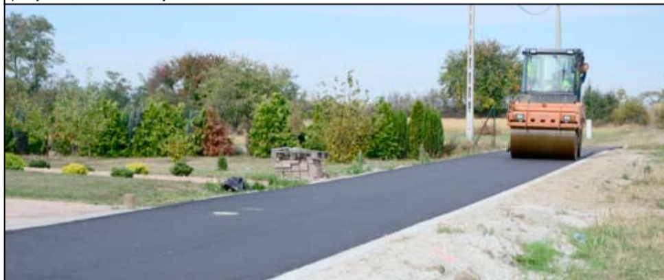
W przeciągu dwóch lat nowe nawierzchnie asfaltowe zyskały drogi w Mrowinach, Pożarzysku, Krukowie, Pyszczyńcu, Żarowie oraz Imbramowicach. W 2017 roku wyremontowane zostaną kolejne odcinki drogowy.