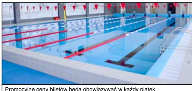
Promocyjne ceny biletów będą obowiązywać w każdy piątek.

Klienci żarowskiej pływalni do dyspozycji mają basen sportowy z sześcioma torami o długości 25 metrów, basen rekreacyjny dla dzieci, zjeżdżalnię, dwie sauny, biczki szkockie, dwie wanny jacuzzi, strefę aromaterapii, a to wszystko w cenie biletu. Basen w Żarowie czynny jest od poniedziałku do piątku w godz. 6:30-22:00 oraz w soboty, niedziele i święta w godz. 8:00-22:00.