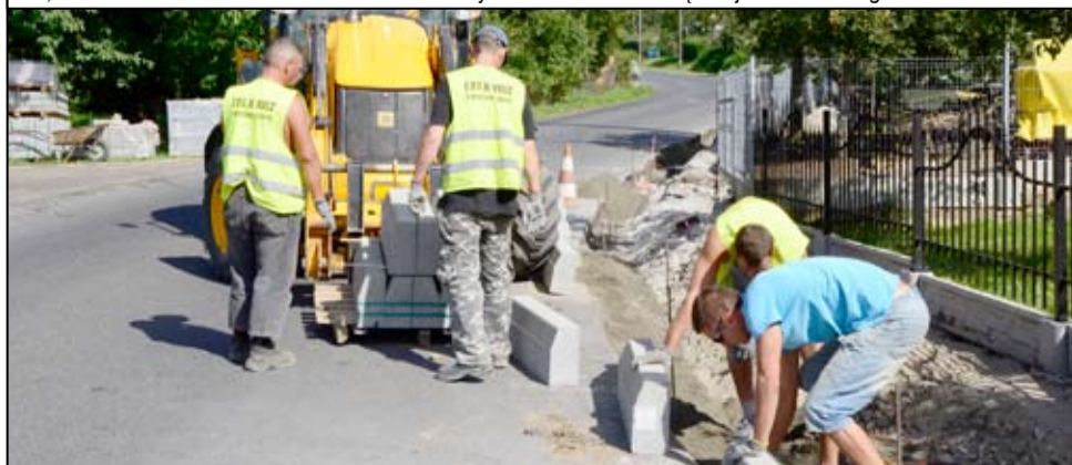
Z nowych chodników korzystają mieszkańcy Pożarzyska, Zastruża, Bukowa, Wierzbnicy, Imbramowic, Żarowa. W następnych latach znów przybędzie wyremontowanych ciągów pieszych.

nowego wozu strażackiego, przebudowane parkingi, inwestycje na terenie cmentarza komunalnego w Żarowie, remonty placówek oświatowych, inwestycje wodno-kanalizacyjne na terenie podstrefy żarowskiej czy budowę nowych zakładów i rozbudowę kolejnych na strefie w Żarowie. Półmetek kadencji to także wyzwanie na kolejne dwa lata, bo tuż obok zadań infrastrukturalnych stoją przed nami również zadania społeczne. Do takich zadań z pewnością będzie należała reorganizacja funkcjonowania szkół, w związku z nową reformą oświaty. Mogę powiedzieć również, że jest to kadencja, w której