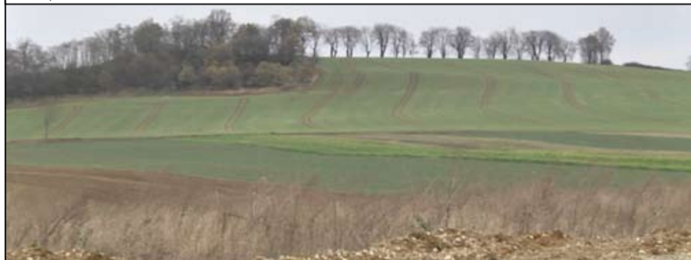
Przygotowanie terenów WSSE podstrefy w Żarowie pod działalność gospodarczą (kompleksowe uzbrojenie terenów – budowa zbiorników rezerwowych wody pitnej, budowa obiektu wieżowego na Górze Krukowskiej i przebudowa skrzyżowania ulicy Strefowej i ul. Tarnawskiej w Żarowie wraz z ul. Wojska Polskiego w Mrowinach). Koszt zadania to 8.803.476,97 zł, dofinansowanie wyniesie 5.941.757,45 zł, zwrot VAT – 1.334.000,00 zł