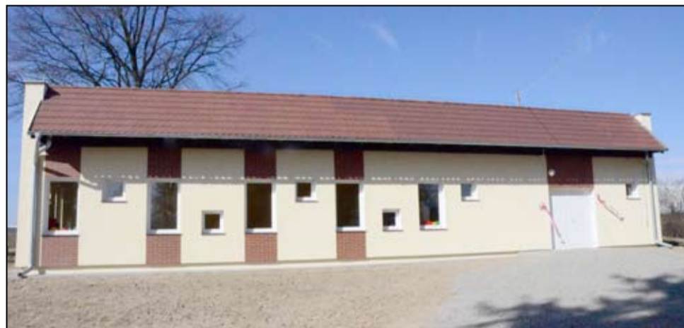
W 2015 roku do użytku mieszkańców zostały oddane dwie nowe świetlice środowiskowe w Mrowinach i Zastrużu.

Leszek Michalak: Od strony realizacyjnej i wykonania inwestycji bardzo dużo się działo. Wśród najważniejszych i strategicznych inwestycji minionych dwóch lat trzeba wymienić budowę basenu i nowoczesnego boiska w Żarowie, nowe drogi i chodniki w mieście i na terenach wiejskich, modernizację świetlic wiejskich, budowę nowych obiektów wiejskich w Mrowinach i Zastrużu, zakup