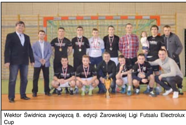
Wektor Świdnica zwycięzca 8. edycji Żarowskiej Ligi Futsalu Electrolux Cup

Choć nie wrócili do szkoły z medalami i pucharami odnieśli wielkie zwycięstwo. Uczniowie Szkoły Podstawowej w