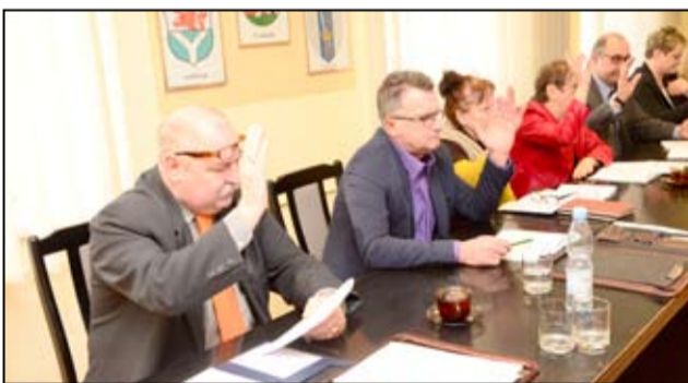
Zrównoważony, stabilny, gwarantujący dalszy rozwój i utrzymanie tempa inwestycyjnego. Taki jest budżet gminy Żarów na 2017 rok.