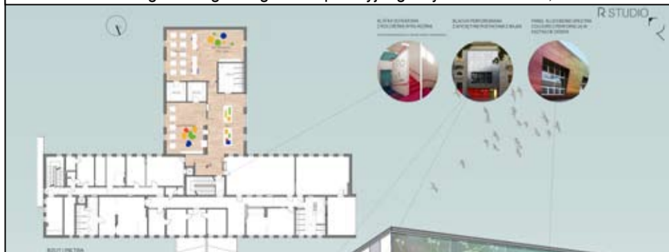
Rozbudowa Przedszkola Miejskiego „Bajkowe Przedszkole” w Żarowie. Koszt zadania to 2.154.960,00 zł, dofinansowanie wyniesie 1.831.716,00 zł