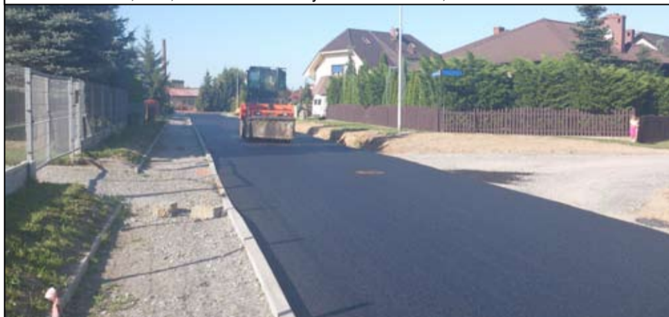
Przebudowa dróg w Żarowie: ul. Kopernika, Kwiatowa, Mickiewicza, Plac Wolności, Puszkina, Słowackiego, Sportowa, Zamkowa, Wojska Polskiego. Koszt zadania to 2.500.000,00 zł, dofinansowanie wyniesie do 85% wydatków kwalifikowanych.