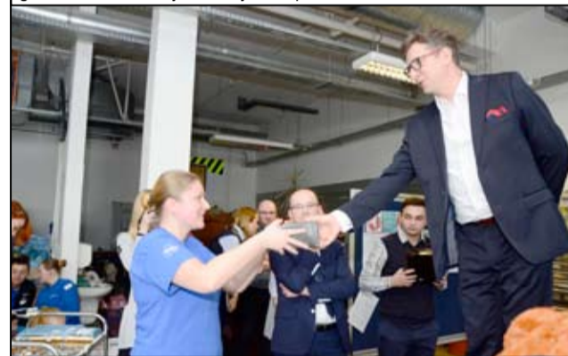
Zwycięzcy konkursów otrzymali sprzęty AGD oraz inne drobne upominki.

środowiska oczami dziecka” oraz „Początek BHP i ochrony środowiska”. Nie zapomniiano również o poczęstunku dla całej załogi fabryki. - Staramy się działać proaktywnie i włączać w te działania naszych pracowników. Nagroda, którą otrzymała dziś firma Electrolux w Żarowie to nagroda za najlepszy postęp zakładu w Europie. Jesteśmy najbardziej bezpiecznym zakładem, jeżeli chodzi o produkcję AGD w Polsce. Po raz siódmy już celebруем „Safety Day”, czyli Światowy Dzień Bezpieczeństwa w naszej firmie i po raz drugi otrzyma-