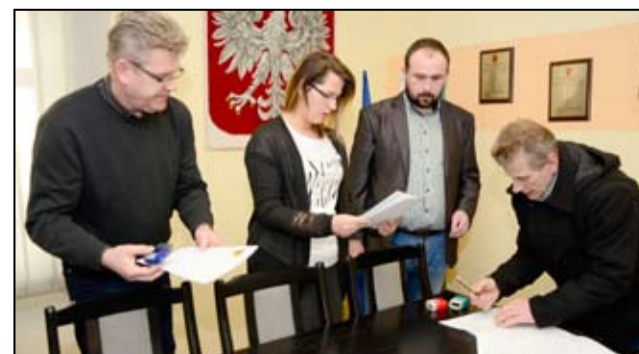
Każdego roku kluby sportowe otrzymują pieniądze z budżetu gminy Żarów na realizację zadań sportowych.