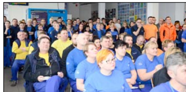
Podczas świętowania Safety Day – Światowego Dnia Bezpieczeństwa zorganizowano konkursy dla wszystkich pracowników zakładu.

Światowy Dzień Bezpieczeństwa w żarowskim Electroluxie, jak co roku obchodzony był z udziałem wszystkich pracowników. Nie zabrakło konkursów, pokazów czy testów wiedzy o BHP, w których nagrodami były sprzęty AGD marki Electrolux. Nagrody powędrowały także do dzieci pracowników za udział w konkursie plastycznym „Bezpieczeństwo i ochrona