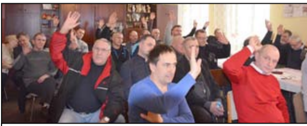
Jak co roku, w zebraniu podsumowującym stary rok uczestniczyli nie tylko żarowscy wędkarze, ale również sympatycy tej dyscypliny sportowej.