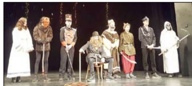
Podczas Świdnickiego Przeglądu Kolędniczego wystąpiło 40 zespołów. Duży sukces osiągnęli kolędnicy z Kalna.