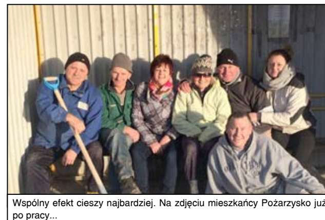
Wspólny efekt cieszy najbardziej. Na zdjęciu mieszkańcy Pożarzyska już po pracy...