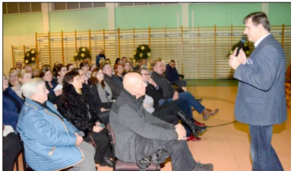
Jeszcze pod koniec 2016 roku zostały przeprowadzone konsultacje z mieszkańcami wsi w sprawie funkcjonowania szkół podstawowych na terenie gminy Żarów.

- Czy w związku z reformą oświaty dojdzie do zwol-