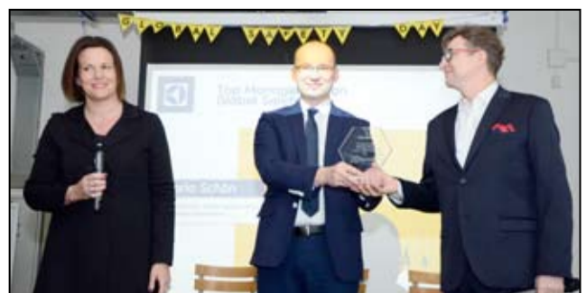
Nagroda, która trafiła do żarowskiego zakładu przyznawana jest najbezpieczniejszym zakładom. Otrzymał ją zakład Electrolux Poland z żarowskiej podstrefy ekonomicznej.