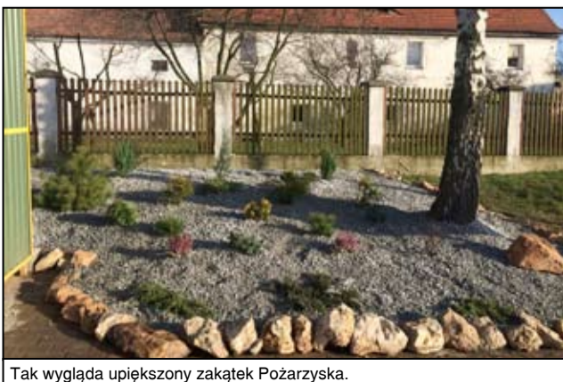
Tak wygląda upiększony zakątek Pożarzyska.