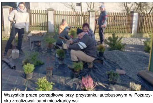
Wszystkie prace porządkowe przy przystanku autobusowym w Pożarzysku zrealizowali sami mieszkańcy wsi.