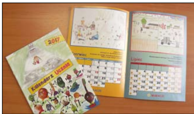
Wszyscy uczniowie szkół otrzymali profilaktyczne kalendarze ucznia.

Powstaje on w ramach Międzyszkolnego Turnieju Wiedzy o Zagrożeniach i Bezpieczeństwie, w którym