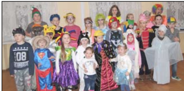
Na zdjęciu najmłodszy mieszkańcy Imbramowic.

D obra zabawa, tańce, gry, konkursy i występy artystyczne.