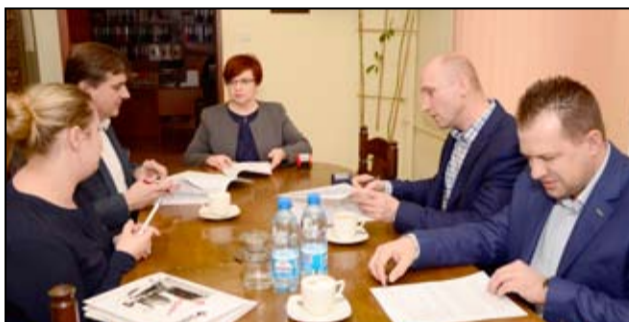
Na zdjęciu moment podpisania umowy z wykonawcą inwestycji – firmą SIBUD z Wrocławia.