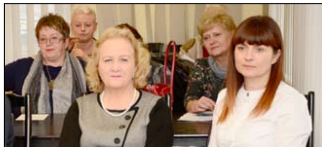
W obradach sesji Rady Miejskiej uczestniczyli dyrektorzy wszystkich szkół podstawowych oraz gimnazjum.