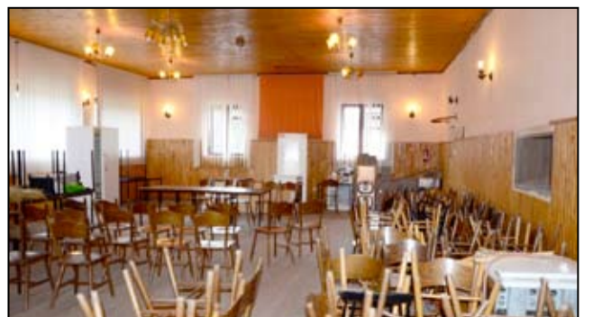
Świetlica wiejska w Mielęcinie jeszcze przed remontem.