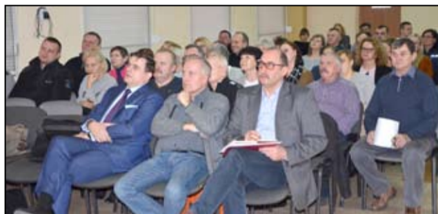
Spotkanie w sprawie groźnych wirusów wśród zwierząt wzbudziło duże zainteresowanie mieszkańców.

umyj ręce wodą z mydłem - W przypadku wykonywania czynności związanych z obsługą drobiu stosuj odzież i obuwie ochronne przeznaczone wyłącznie do tego celu - Stosuj maty dezynfekcyjne w wejściach i wyjściach z budynków, w których utrzymywany jest drób oraz przy wjazdach i wyjazdach z gospodarstw - Zabezpiecz budynki, w których utrzymywany jest drób oraz pasza przed dostępem zwierząt dzikich, w tym ptaków