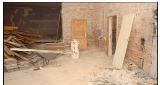
Budynek świetlicy wiejskiej w Mrowinach w totalnej demolce.