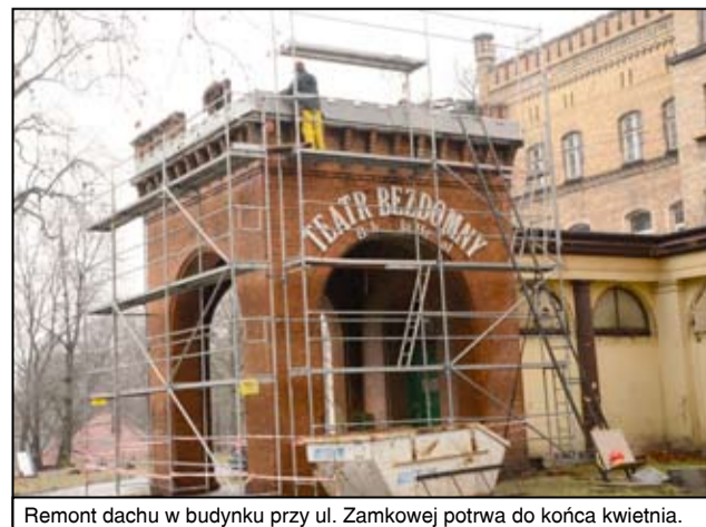
Remont dachu w budynku przy ul. Zamkowej potrwa do końca kwietnia.