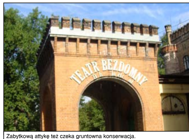
Zabytkową attykę też czeka gruntowna konserwacja.

Prace remontowe, które polegać będą na wymianie pokrycia dachowego właśnie się rozpoczęły. Dach był już w bardzo złym stanie technicznym i wymagał gruntownej modernizacji. Wraz z wymianą całego pokrycia dachowego przeprowadzony zostanie także remont zabytkowej attyki. - W tej chwili trwają roboty rozbiórkowe, w trakcie których pracownicy firmy wykonawczej rozbiorą