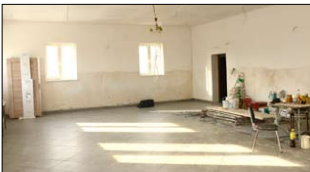
Pierwsze zrealizowane prace zmieniły już wygląd świetlicy w Mielęcinie.