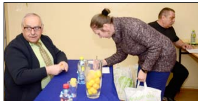
Każdego roku zarząd żarowskiego Klubu Honorowych Dawców Krwi nagradza wyróżnionych krwiodawców. W konkursie 4X450 zostało odznaczonych 22 zasłużonych mieszkańców.