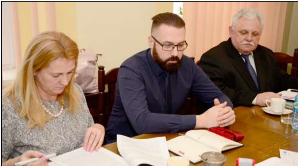
Budowa kanalizacji w Łażanach to kolejny wniosek, który doczekał się pozytywnej weryfikacji i uzyskał unijne dofinansowanie.