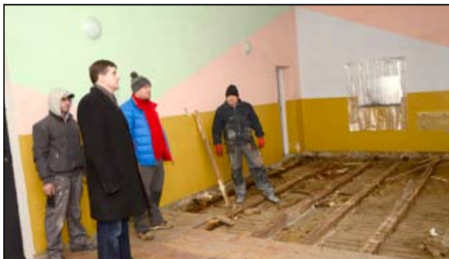
Stara drewniana podłoga na świetlicy wiejskiej w Przyłęgowie zostanie w końcu wymieniona.

wiele planów dotyczących wykorzystania świetlicy wiejskiej, dlatego przychodzimy, doglądamy remontu i czekamy na szybkie zakończenie inwestycji. Budynek był już w złym stanie technicznym, przeciekał dach, a ogrzewanie elektryczne nie spełniało w ogóle swojej roli. Wspólnie w mieszkańcami naszej wsi wyremontowaliśmy kuchnię, choć prace w tym pomieszczeniu trzeba jeszcze dokończyć. Teraz czekamy na zakończenie kolejnego etapu remontu świetlicy - mówi