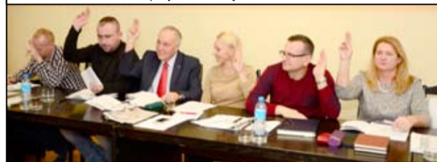
Jeżeli projekt uchwały podjęty na sesji Rady Miejskiej w Żarowie uzyska pozytywną opinię Kuratora Oświaty, Rada Miejska do końca marca podejmie właściwą uchwałę w sprawie dostosowania sieci szkół do nowego ustroju.