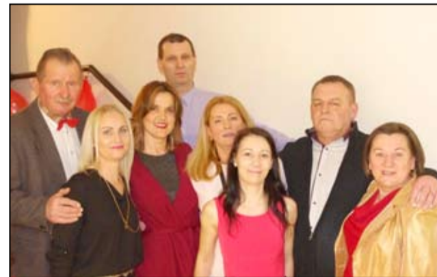
Na zdjęciu uczestnicy zabawy karnawałowej w Krukowie.

Leszek Bendlewski Stowarzyszenie „Nasz Kruków”