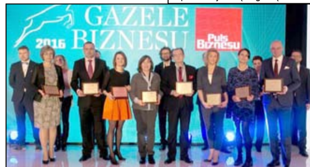
Wspólne zdjęcie nagrodzonych laureatów plebiscytu „Gazela Biznesu 2016”.