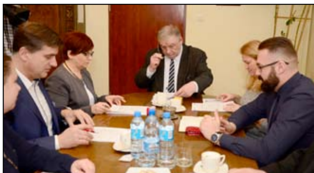
Moment podpisania umowy z wykonawcą inwestycji Przedsiębiorstwem Budownictwa Specjalistycznego i Melioracji z Legnicy.