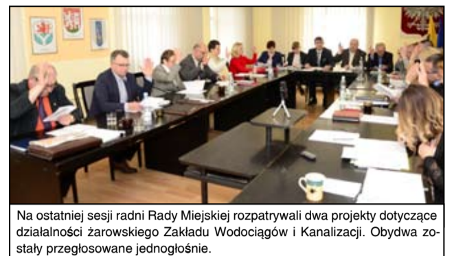
Na ostatniej sesji radni Rady Miejskiej rozpatrywali dwa projekty dotyczące działalności żarowskiego Zakładu Wodociągów i Kanalizacji. Obydwa zostały przegłosowane jednogłośnie.

metr sześcienny wody 5,48 złotych płacą mieszkańcy Świebodzic. W Jaworzynie Śląskiej stawka ta wynosi 3,86 złotych, w Świdnicy 3,68 złotych, a w gminie Świdnica 4,30 złotych. - Dla nas najważniejsze było, aby mieszkańcy nie odczuli żadnych zmian, a dzięki dopłacie