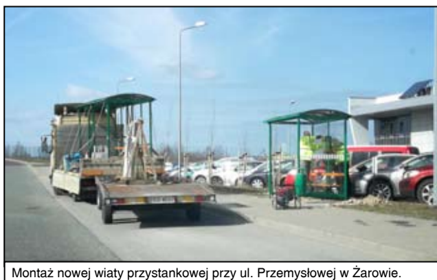
Montaż nowej wiaty przystankowej przy ul. Przemysłowej w Żarowie.