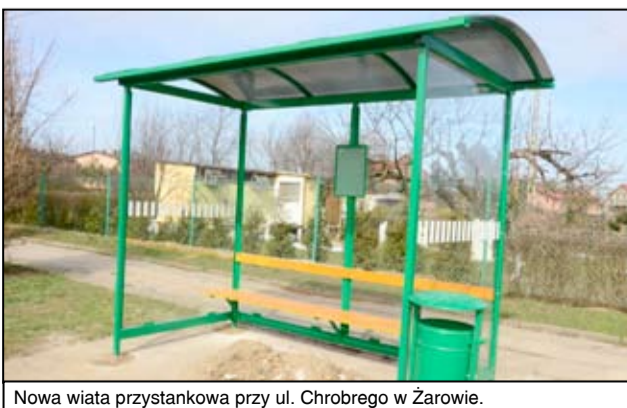
Nowa wiat przystankowa przy ul. Chrobrego w Żarowie.