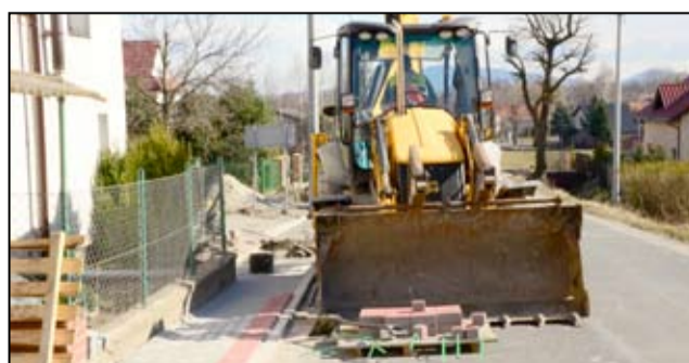
Budowa nowego chodnika w Wierzbnej zakończy się w połowie kwietnia.