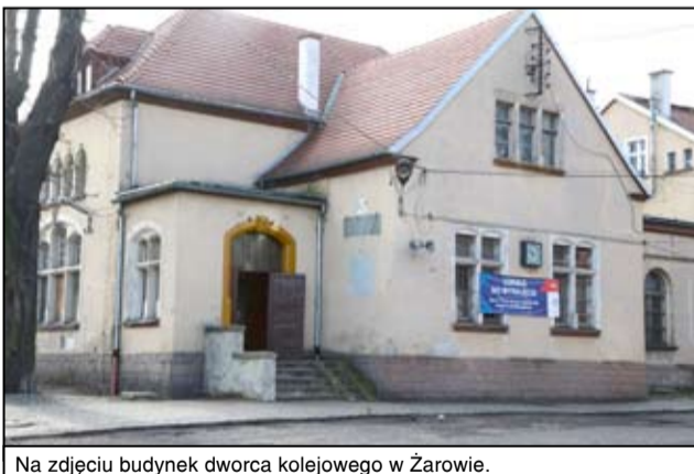
Na zdjęciu budynek dworca kolejowego w Żarowie.