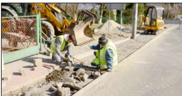
Wraz z początkiem wiosny ruszyły pierwsze prace drogowe.