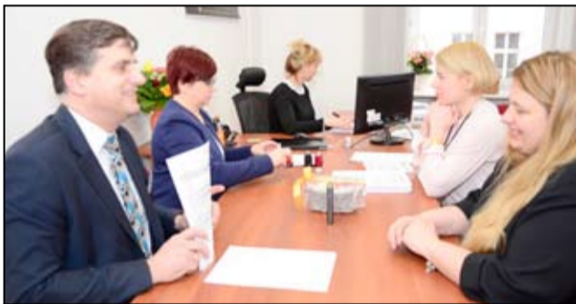
Projekt budowy nowego żłobka w Żarowie to kolejny, który otrzymał dofinansowanie ze środków Aglomeracji Wałbrzyskiej.