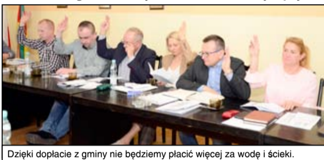
Dzięki dopłacie z gminy nie będziemy płacić więcej za wodę i ścieki.