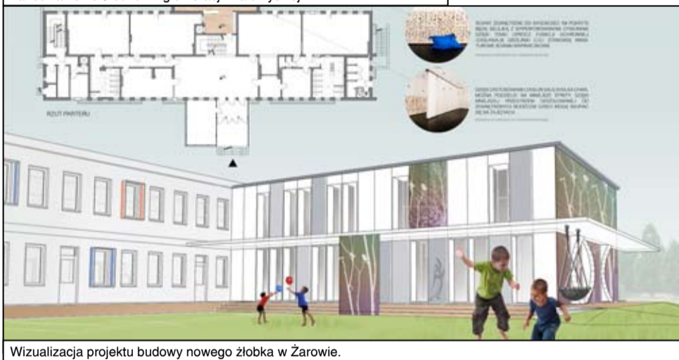
Wizualizacja projektu budowy nowego żłobka w Żarowie.