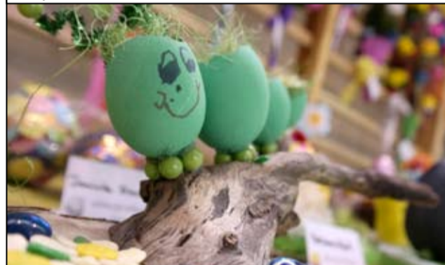
Każda ozdoba była profesjonalnie wykonana.

Lista laureatów nagrodzonych w konkursie „Pisanka, Palma Wielkanocna, Tradycje Wielkanocne” dostępna jest na stronie internetowej www.um.zarow.pl i www.centrum.zarow.pl