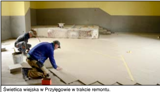
Świetlica wiejska w Przyłęgowie w trakcie remontu.

Nowy wygląd zyskuje także budynek świetlicy wiejskiej w Przyłęgowie. Zniknęła stara drewniana podłoga, a w tej chwili trwają tam prace przy wymianie instalacji elektrycznej i hydraulicznej. - Ruszyliśmy z remontem budynku świetlicy wiejskiej w Przyłęgowie. Kładziemy płytki, ściany są wstępnie przygotowane pod okładziny, ale na więcej efektów trzeba poczekać jeszcze kilka tygodni. Będą kładzione tynki mozaikowe, wykończymy ściany, zafugujemy płytki. A w końcowym etapie czeka nas jeszcze remont elewacji i montaż nowego ogrodzenia wokół budynku świetlicy – wyjaśnia Kamil Zdziebło z firmy BU-