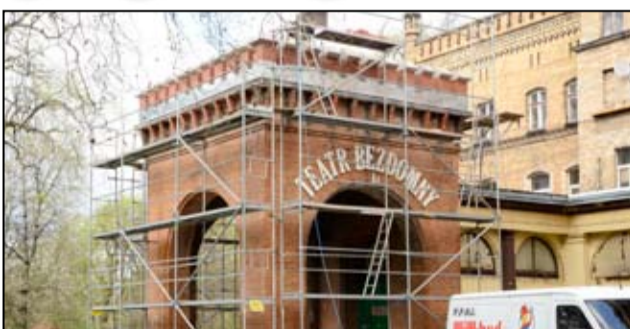
Prace remontowe przy remoncie dachu budynku przy ul. Zamkowej rozpoczęły się pod koniec lutego. I choć trochę przyczynią się do poprawy estetyki żarowskiego parku.