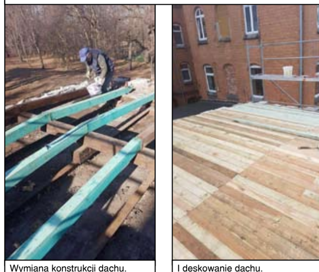
Wymiana konstrukcji dachu.