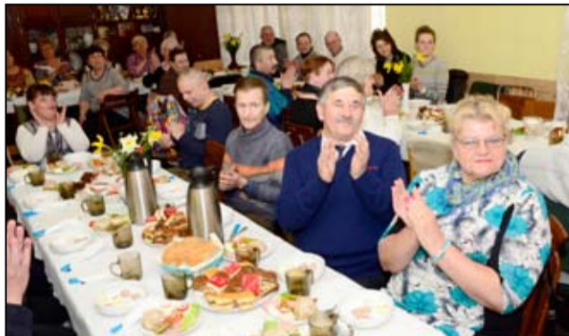
Nadziewane jajka, żurek, wielkanocne pasztety, babki, serniki, mazurki i inne smakołyki. Takie przysmaki królowały na wielkanocnym stole żarowskiego Związku Emerytów Rencistów i Inwalidów. Tuż przed Świątami Wielkanocnymi żarowscy seniorzy spotkali się na wspólnym wielkanocnym śniadaniu.

Tradycyjnie, tuż przed Świątami Wielkanocnymi mieszkańcy spotykają się na wspólnym wielkanocnym śniadaniu. Składają sobie życzenia i dzielą się jajkiem. Ale to nie jedyne wielkanocne tradycje w naszej gminie. Od wielu lat Gminne Centrum Kultury i Sportu organizuje wielkanocny konkurs „Pisanka, Palma Wielkanocna, Tradycje Wielkanocne”.