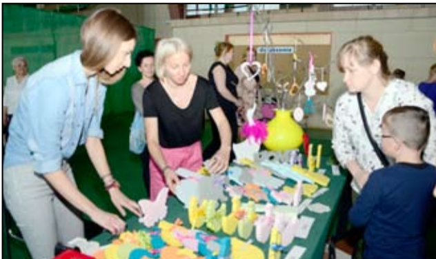
Pisanki, palmy wielkanocne, kartki świąteczne, ozdoby z drewna, wyszywane serwetki, ręcznie zdobione pudełka, butelki można było znaleźć podczas kiermaszu wielkanocnego w Gminnym Centrum Kultury i Sportu w Żarowie.