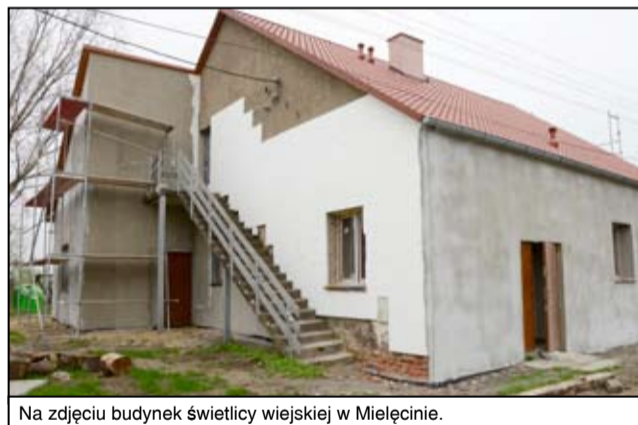
Na zdjęciu budynek świetlicy wiejskiej w Mielęcinie.