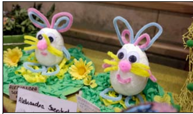
Takie ozdoby, własnoręcznie wykonane można było podziwiać na wielkanocnym kiermaszu.