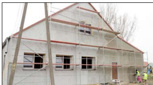
Przy budynku świetlicy wiejskiej w Mielęcinie pojawiły się już rusztowania. Niebawem budynek zyska nową elewację.