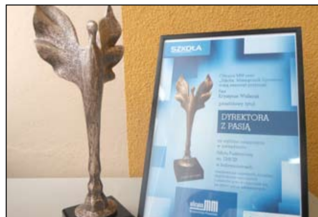
Niedawno za swoją dotychczasową pracę otrzymała tytuł „Dyrektora z Pasją”.

→ Debaty, akcje charytatywne, konkursy, imprezy ... Tego wszystkiego nie brakuje w Szkole Podsta-