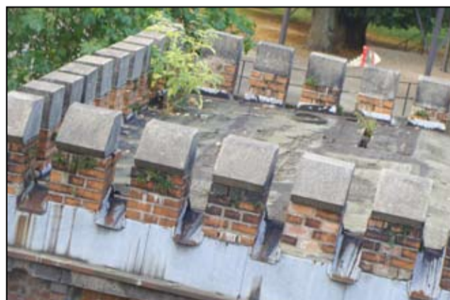
Stan pierwotny dachu przed remontem.