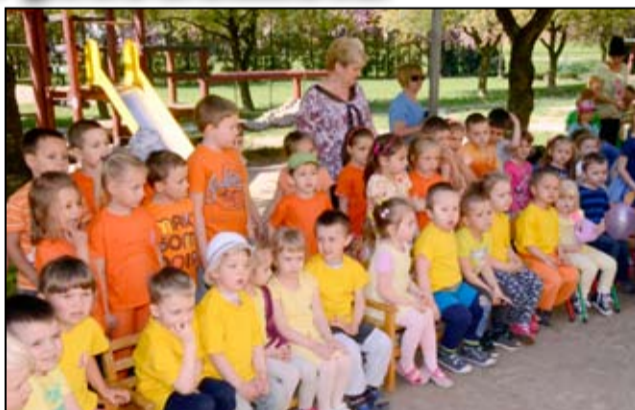
Ze względu na ograniczoną liczbę miejsc nie wszystkie dzieci zostały przyjęte do Bajkowego Przedszkola w Żarowie.

Z uwagi na dużą liczbę wniosków, ograniczoną liczbę miejsc w przedszkolu i nie spełnienie wszystkich kryteriów naboru nie wszystkie dzieci zostały przyjęte do placówki. - W naborze dzieci do przedszkola sugerowaliśmy się kryteriami ściśle określonymi w przepisach oświatowych. Przyjęte zostały przede wszystkim dzieci zamieszkałe na terenie gminy Żarów, przedszkolaki, które już uczęszczały do naszej placówki, dzieci samotnych matek, wychowujące się w rodzinie wielodzietnej, niepełnosprawne, mające rodziców niepełnosprawnych, objęte pieczą zastępczą i rodziców pracujących. Odbyły się dwa posiedzenia komisji rekrutacyjnej 23 i 28 marca. Analizowaliśmy wszystkie podania, biorąc pod uwagę kryteria określone w przepisach oświatowych, dlatego nie wszystkie dzieci zostały przyjęte. Ze względu na ograniczoną liczbę miejsc, na