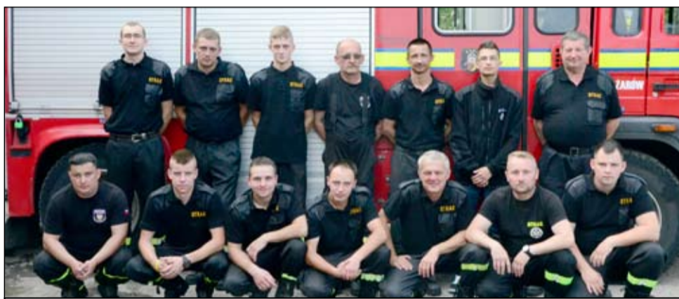
Na zdjęciu strażacy z jednostki OSP Żarów, którzy uczestniczyli w akcji poszukiwawczo-ratowniczej w Świebodzicach.