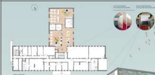
Dzięki budowie nowego budynku żłobka Bajkowe Przedszkole w Żarowie będzie mogło przyjąć więcej dzieci.