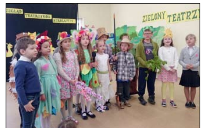
Uczniowie szkół podstawowych podczas występu artystycznego.