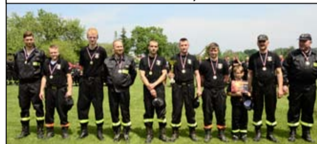
Jednostka OSP Mrowiny także wspomagała zastępy strażaków w Świebodzicach.

Wciąż można wspierać poszkodowanych w katastrofie budowlanej w Świebodzicach. Podajemy numer konta, na który można wpłacać darowizny: