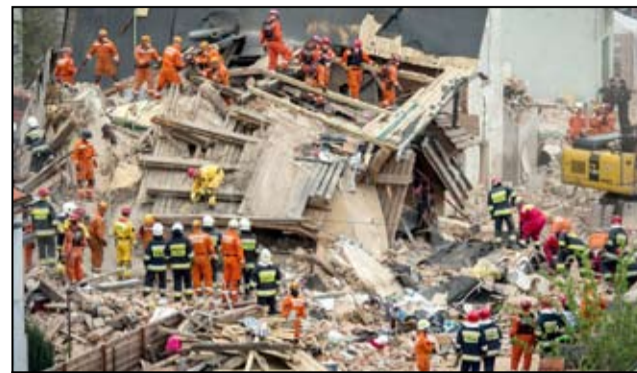
Tak wyglądało miejsce po zawaleniu się kamienicy w Świebodzicach. Zdjęcie ze strony: http://www.polskieradio.pl/130/3993/Artykul/1750017,Katastrofa-budowlana-w-Swiebodzicach-Sa-ofiary