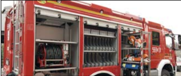
Kolejny nowy wóz w tym roku trafi do strażaków. Tym razem zasilił on jednostkę OSP w Pożarzysku.