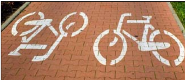
Centrum przesiadkowe, ścieżki rowerowe i montaż nowego oświetlenia na terenie Żarowa – mieszkańcy czekają na tę inwestycję z niecierpliwością.