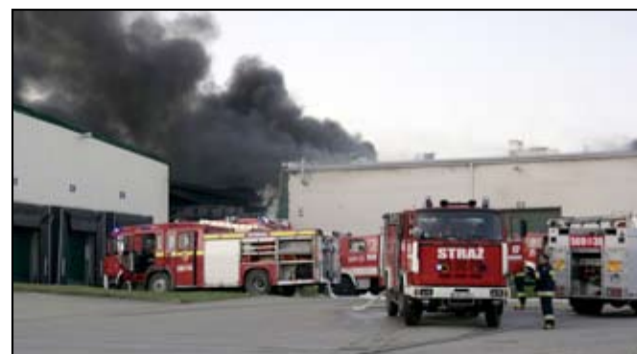
Nie wiadomo jeszcze, co było przyczyną wybuchu pożaru w żarowskim Thermaflexie.