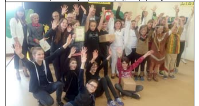
Wspólne zdjęcie jury i uczestników przeglądu teatralnego.