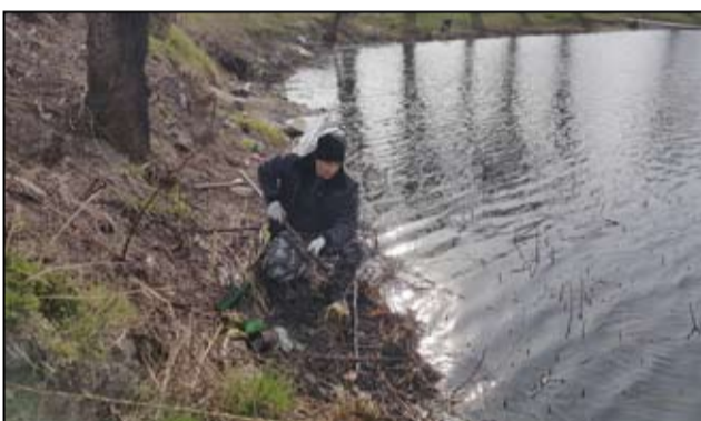
Kilkadziesiąt worków śmieci zostało zebranych podczas pierwszych wiosennych akcji wędkarzy.