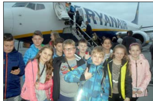
Uczniowie Szkoły Podstawowej im. UNICEF w Imbramowicach tuż po wyjściu z samolotu.

D la niektórych z nich była to pierwsza taka podróż w życiu. I pierwsza wizyta w stolicy.