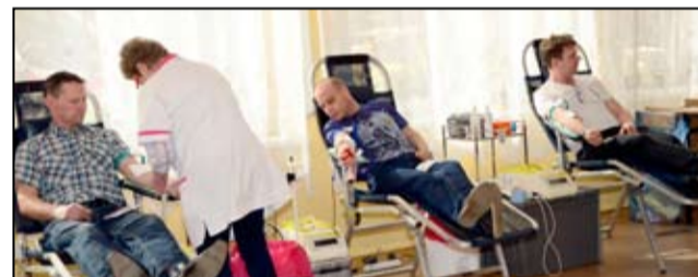
Mieszkańcy z dużym zainteresowaniem odpowiedzieli na apel żarowskiego Klubu Honorowych Dawców Krwi.