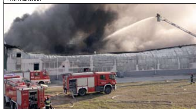
Dzięki szybkiej interwencji strażaków ogień został opanowany.