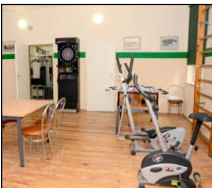
Tak po remoncie wygląda mini siłownia w Mrowinach.

wolny czas. To bardzo dobra alternatywa, nie tylko dla dzieci i młodzieży.