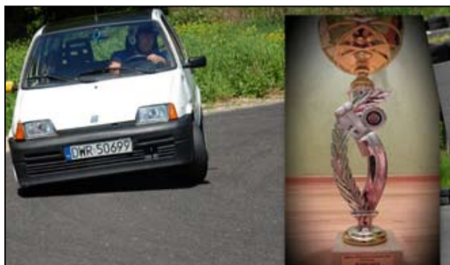
Z przygodami, ale udało się wywalczyć drugie miejsce w 3. rundzie Rajdowych Mistrzostw Wrocławia.