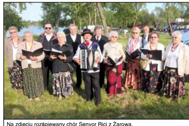
Na zdjęciu rozśpiewany chór Senior Rici z Żarowa.

roku zorganizował Gminny Ośrodek Kultury w Mietkowie. - Nasz zespół zaprezentował się w wieczornym recitalu, prezentując na początku pieśń związaną z Żarowem „Strzegomka”. W repertuarze Senior Rici znalazły się także inne hity „Furman”, „Baju Baj”, „Tokaj”, „Adela”. W niedzielnych występach wszystkie zespoły wzięły udział w bicu rekordu w jednoczesnym śpiewaniu piosenki „Wiła wianki”. Atmosfera wspaniała, pogoda