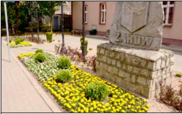
Tak wygląda skwer obsadzony kolorowymi roślinami.

Teraz to taki estetyczny zakątek w mieście. To nie jedne zmiany, jakie od niedawna zauważyć mogą mieszkańcy Żarowa. Nad stawem miejskim oraz w mini parku od strony ulicy Szkolnej wymienione zostały ławki. W mieście zamontowano także nowe kosze uliczne. - Mam nadzieję, że mieszkańcy zauważą zmiany, jakie ostatnio zaszyły w naszym mieście. Zakończyły się już prace związane z wiosennymi nasadzeniami kwiatów. Skwer przy żarowskim Ośrodku Pomocy Społecznej wypełnił się ozdobnymi krzewami i kolorowymi kwiatami. Zamontowaliśmy również nowe ławki nad stawem miejskim i małym parku, od strony ulicy Szkolnej w Żarowie. Poprzednie, stare i zniszczone nie nadawały się już do użytku. Nad stawem