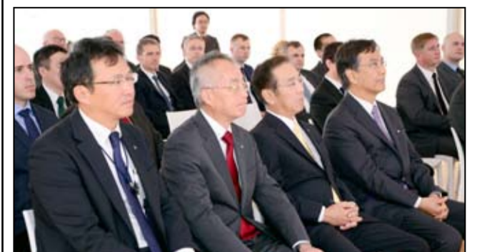
W uroczystości otwarcia nowej hali AKS Precision Ball Polska wzięło udział wielu zaproszonych gości.