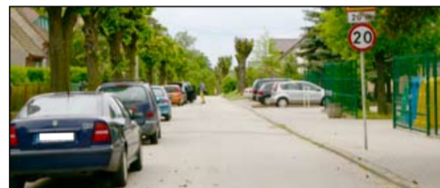
Przypominamy o ograniczeniu prędkości na ulicy 1 Maja w Żarowie.