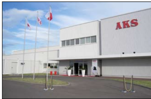
AKS Precision Ball Polska to japońska firma, która jest producentem kulek do łożysk tocznych.