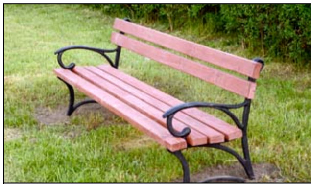
Nowe ławki zamontowano nad stawem miejskim i małym parku w Żarowie.