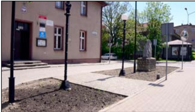
Tak wyglądał plac przed budynkiem Ośrodka Pomocy Społecznej zanim przystąpiliśmy do prac.

Na skwerze przy budynku żarowskiego Ośrodka Pomocy Społecznej zrobiło się bardziej kolorowo. To efekt prac, jakie zrealizowane zostały kilka dni temu. Cały skwer obsadzony zostały ozdobnymi krzewami i roślinami.