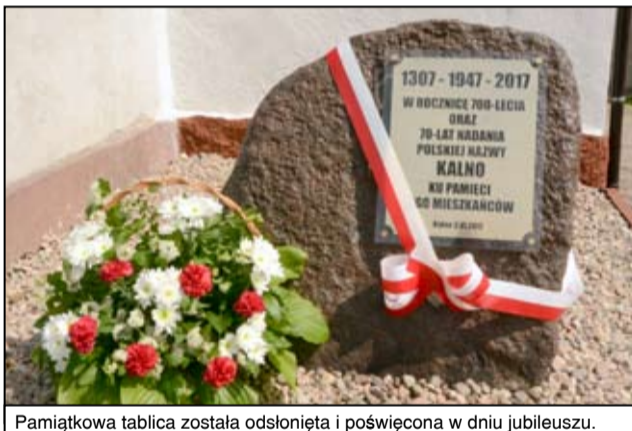
Pamiątkowa tablica została odsłonięta i poświęcona w dniu jubileuszu.