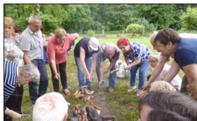
Po całorocznej pracy, licznych zajęciach i wykładach przyszedł czas na wakacyjny odpoczynek. Studenci UTW przywitani wakacje tradycyjnie w Bagieńcu. Były zajęcia sportowe, wspólne zabawy i ognisko z kiełbaskami.

I z radością na twarzy, że udało im się być w gronie tych najlepszych. Studenci z żarowskiego Uniwersytetu Trzeciego Wieku podczas VII Uniwersjady „Od aktywności fizycznej do zdrowia” rozgrywanej 9 czerwca w Świdnicy pokazali, że energii i wytrwałości im nie brakuje. W zawodach wystartowało 10 zawodników z Żarowa, rywalizując w różnych konkurencjach. Wśród nich był rzut lotkami do tarczy, sadzenie ziemniaków, rzut beretem, bieg kelnerski, slalom hokejowy i rzut krążkami do celu. - Wakacyj-