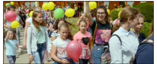
Co roku Żarowski Dzień Godności rozpoczyna się paradą radości, w której wspólnie z niepełnosprawnymi uczestniczą również mieszkańcy gminy Żarów.