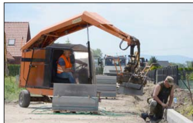
Będzie to pierwsza droga rowerowa, która powstanie w Żarowie.

Budowa nowej ścieżki rowerowej przy ul. Cembrowskiego i chodnika wraz z oświetleniem w Żarowie, zgodnie z podpisaną umową, kosztować będzie 235.026,85 złotych. Projekt realizowany jest w ramach zadania „Wdrażanie Strategii Niskoemisyjnych - budowa zintegrowanego centrum przesiadkowego w Żarowie oraz budowa dróg rowerowych, ciągów pieszych wraz z oświetleniem na terenie miasta Żarów”. Jego całkowita wartość wynosi 5 114 351,75 złotych, przyznane dofinansowanie ze środków Europejskiego Funduszu Rozwoju Regionalnego w ramach Regionalnego Programu Operacyjnego Województwa Dolnośląskiego 2014-2020 to kwota 4 347 198,99 złotych.