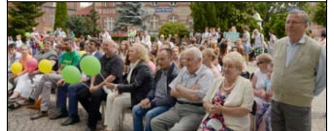
Ten dzień to jedna z okazji, aby mówić i przypominać o istnieniu niepełnosprawności. Ma pokazać, że ludzie niepełnosprawni są wśród nas i mają pełne prawo zarówno do godności, radości i zabawy

S ą wśród nas, pragną kochać i być kochanymi. Mają pasje i marzenia. Mimo swej choroby promieniają i obdarzają innych miłością, życzliwością i uśmiechem.