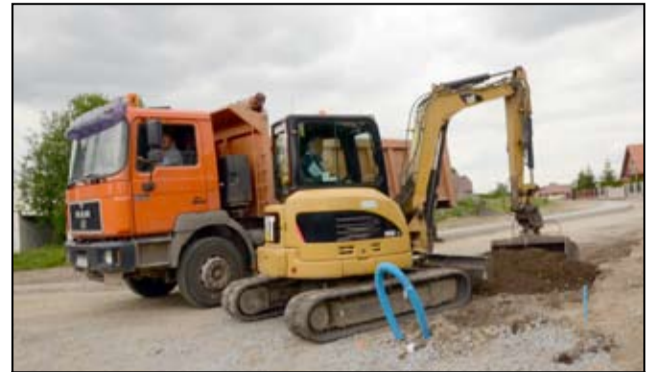
Przy ul. Cembrowskiego trwają prace związane z budową ścieżki rowerowej.

W ramach projektu „Wdrażanie Strategii Niskoemisyjnych – budowa zintegrowanego centrum przesiadkowego w Żarowie oraz budowa dróg rowerowych, ciągów pieszych wraz z oświetleniem na terenie miasta Żarów”, na który gmina Żarów otrzymała ponad 4 miliony złotych dofinansowania, do użytku mieszkańców oddane zostaną również chodniki i nowe rondo. Inwestycja obejmuje swoim zakresem także budowę ciągów pieszych wraz z oświetleniem oraz centrum przesiadkowego. - Ruszyliśmy z budową ścieżki rowerowej, prace przebiegają zgodnie z opracowanym harmonogramem. Przy ul. Cembrowskiego w Żarowie powstanie nowa ścieżka rowerowa wraz z chodnikiem i oświetleniem. Inwestycja powinna zakończyć się początkiem lipca. Po prawej stronie jezdni powstanie chodnik, a po lewej zostanie wykonane oświetlenie i ścieżka rowerowa. Chodnik będzie zrealizowany w technologii kostki brukowej, a ścieżka rowerowa pokryje