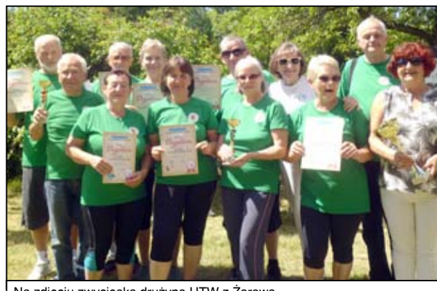
Na zdjęciu zwycięska drużyna UTW z Żarowa.

Przed studentami żarowskiej uczelni teraz zasłużone wakacje. Tuż po letniej przerwie Uniwersytet Trzeciego Wieku znów wznowi swoją działalność w naszym mieście.