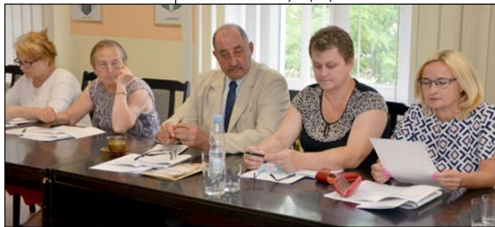
Piętnastu radnych zgłosowało za udzieleniem burmistrzowi absolutorium z tytułu wykonania budżetu.