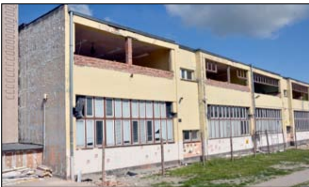
W budynku szkoły wymieniana jest w tej chwili stolarka okienna i drzwiowa.

mi dostosowanymi do potrzeb dzieci, jak i osób dorosłych. Pozostali uczniowie, począwszy od piątej klasy, zostaną ulokowani w placówce gimnazjum, przy ul. Piastowskiej w Żarowie.