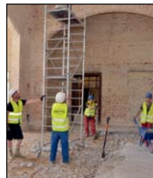
Intensywne prace rozbiórkowe trwają w tej chwili wewnątrz budynku dworca.