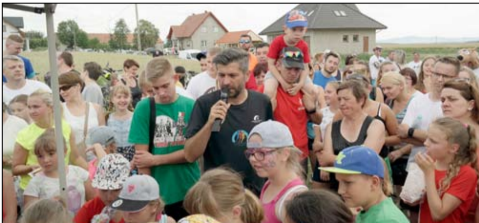
Nikt nie spodziewał się, że wspólna akcja mieszkańców wsi i innych współorganizatorów zakończy się takim sukcesem.