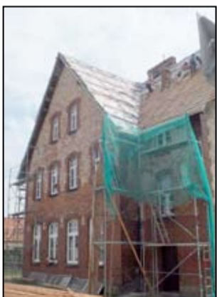
Wakacje dopiero co się rozpoczęły, a w szkołach już pojawiły się ekipy remontowe.