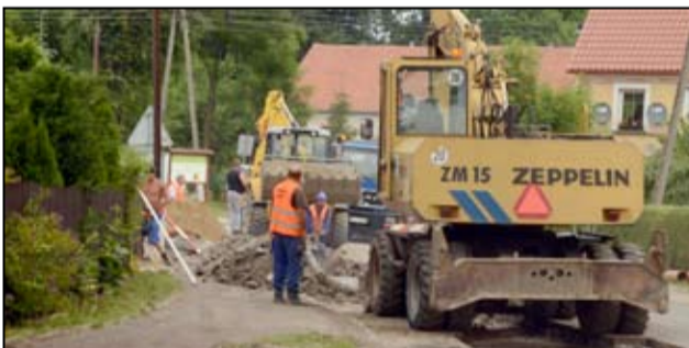
Budowa kanalizacji to jedna z priorytetowych inwestycji, która realizowana jest w tym roku.