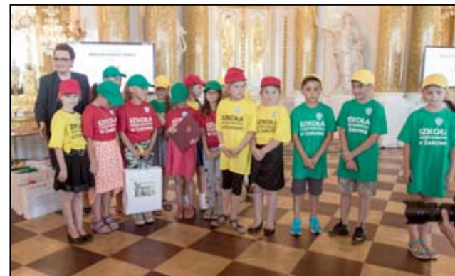
Uczniowie ze Szkoły Podstawowej im. Jana Brzechwy w Żarowie na zdjęciu z Anną Zalewską Minister Edukacji Narodowej.

Film „Wolontariusz Roku – Małym Wolontariusz Bądź” można zobaczyć na stronie internetowej Szkoły Podstawowej im. Jana Brzechwy w Żarowie: www.sparow.edupage.org Magdalena Pawlik