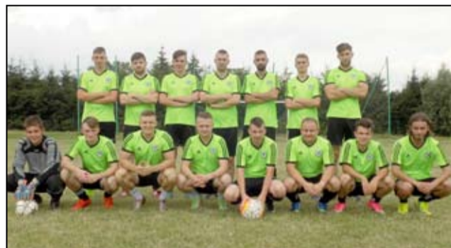
Gospodarz turnieju – Zieloni Mrowiny