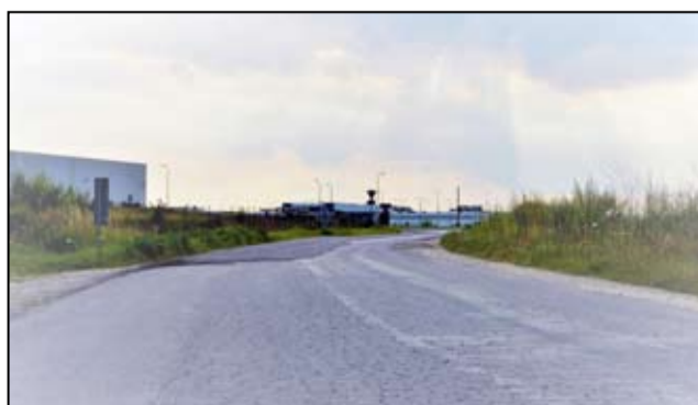
Ulica Strefowa w Żarowie doczeka się w końcu przebudowy.