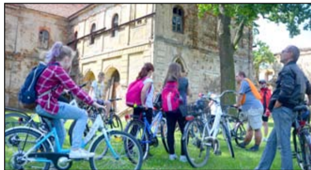
Rowerzyści na terenie poklasztornym w Wierzbnej.

ca. Zbiórka o godz. 9:30 pod żarowskim Centrum Kultury i Sportu.