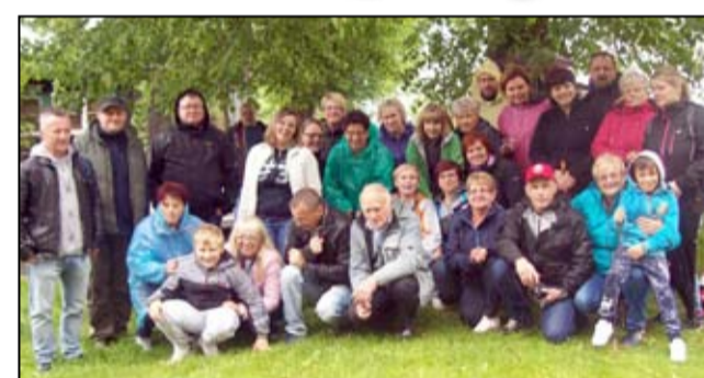
W nagrodę za swoją pomoc żarowscy krwiodawcy każdego roku wyjeżdżają na wspólną integracyjną wycieczkę.

naszej wycieczki czekało mnóstwo atrakcji. Odwiedziliśmy Muzeum Papiernictwa i Park Zdrojowy. Nasza wyprawa zakończyła się wspólnym integracyjnym ogniskiem. I choć pogoda nie dopisała, nasi krwiodawcy chętnie skorzystali z takiej formy wspólnego wypoczynku. To była nagroda nie tylko za aktywne włączenie się w działalność żarowskiego klubu krwiodawców, ale przede wszystkim pomoc drugiemu człowiekowi. Dziękujemy burmistrzowi