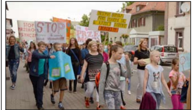
Specjalnie z tej okazji uczniowie przygotowali transparenty z hasłami nawiązującymi do przerywania każdego rodzaju przemocy.

odpowiada jedynie sprawca - niezależnie od tego, co robiła, lub jak się zachowuje osoba doświadczająca przemocy. Zachęcali do przerywania milczenia i podjęcia działań zmierzających do powstrzymania sprawcy przemocy. Uświadamiali, że przemoc w rodzinie nie jest sprawą prywatną, jest przestępstwem i istotnym problemem społecznym. Wygłaszali „Im wcześniejsze reagowanie, tym większa szansa na zatrzymanie przemocy i zapobiegnięcie tragedii”. Apelowali do mieszkańców Żarowa o reagowanie na zachowania przemocowe – wzywaniu Policji, nie zgadzanie się na poniżanie i obrażanie w swoim towarzystwie, okazywanie dezaprobaty osobom, które upokarzają swoich bliskich. Happening, wzbudził