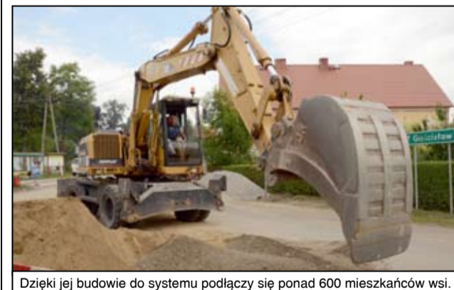
Dzięki jej budowie do systemu podłączy się ponad 600 mieszkańców wsi.