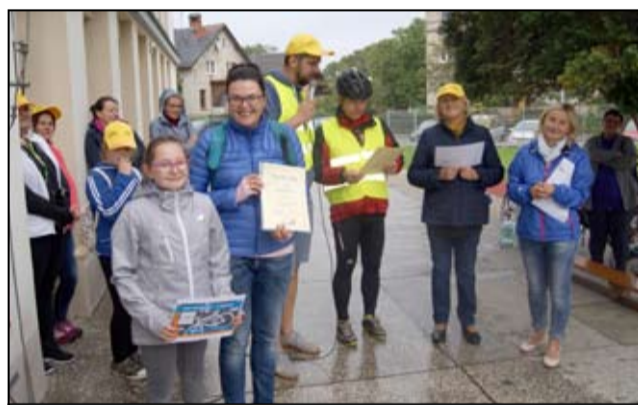
Rozdanie nagród i dyplomów zwycięskim rodzinom.