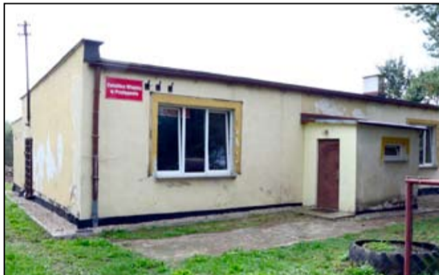
Zniszczony obiekt nie był dumą mieszkańców Przyłęgowa.

W związku z rozpoczynającymi się pracami związanymi z przebudową skrzyżowania ulic Armii Krajowej, Mickiewicza, Dworcowej, Krasińskiego na skrzyżowanie typu rondo (budowa centrum przesiadkowego w Żarowie) i remontem dworca PKP zachodzi konieczność zmiany lokalizacji przystanku autobusowego przy ul. Dworcowej (pętla).