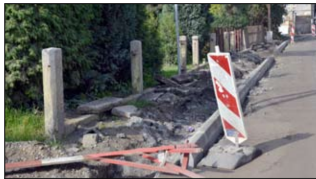
Mieszkańcy czekają teraz na ułożenie nowych chodników i naprawę drogowych nawierzchni.