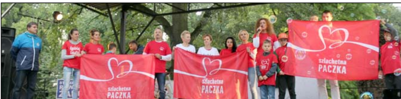
Żarowanie o akcji „Szlachetna Paczka” po raz pierwszy usłyszeli podczas pikniku charytatywnego „Kręcimy dla Julki”, który odbył się w Parku Miejskim w Żarowie.

Ma swojego szefa – lidera, a także współpracowników – innych wolontariuszy, razem z którymi tworzy rejon. Dobra atmosfera i wzajemne wsparcie budowane są m.in. poprzez obecność na spotkaniach zespołu, zaangażowanie w działania promocyjne itd. Spotkania z rodzinami Wolontariusz podejmuje decyzję o włączeniu rodziny do Paczki – o przekazaniu pomocy materialnej i/lub specjalistycznej. Po spotkaniach wprowadza dane do systemu