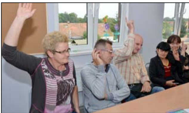
Mieszkańcy Gołaszyc jednogłośnie zdecydowali o przeznaczeniu funduszu sołeckiego na kolejne inwestycje na terenie wsi.