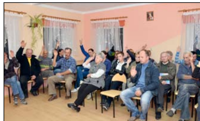
Dzięki dodatkowym środkom finansowym mieszkańcy Siedlimowic zrealizują wiele zadań inwestycyjnych.

Podczas spotkań, które odbyły się w 17 sołectwach gminy Żarów, mieszkańcy zdecydowali na jakie przedsięwzięcia przeznaczą powyższe środki w 2018 roku. Z uwagi na zróżnicowane po-