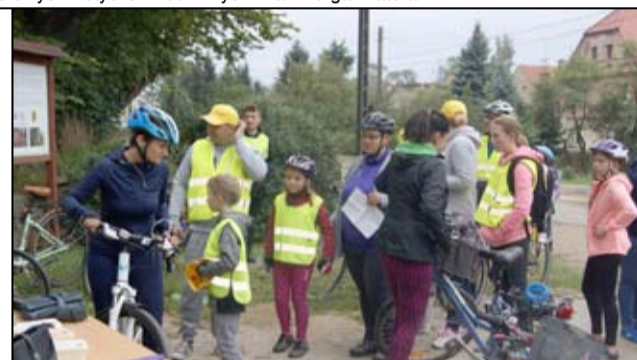
W każdej wymienionej miejscowości uczestnicy mieli okazję wykazać się wiedzą z zakresu pierwszej pomocy medycznej, zasad ruchu drogowego i historii gminy Żarów.