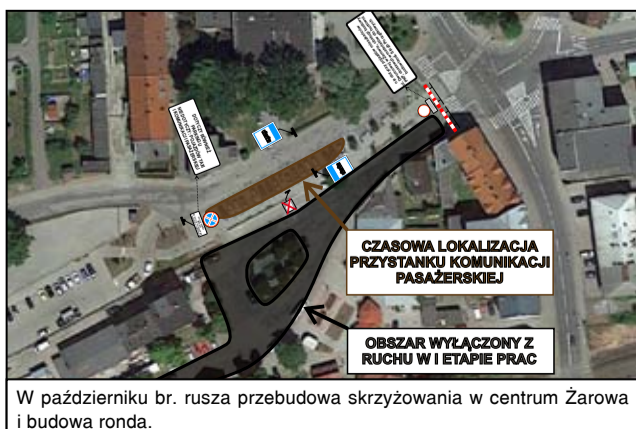
W październiku br. rusza przebudowa skrzyżowania w centrum Żarowa i budowa ronda.