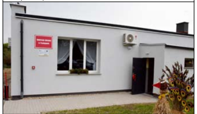
Dziś to zupełnie inne miejsce. Świetlica wiejska w Przyłęgowie odzyskała utracony blask.