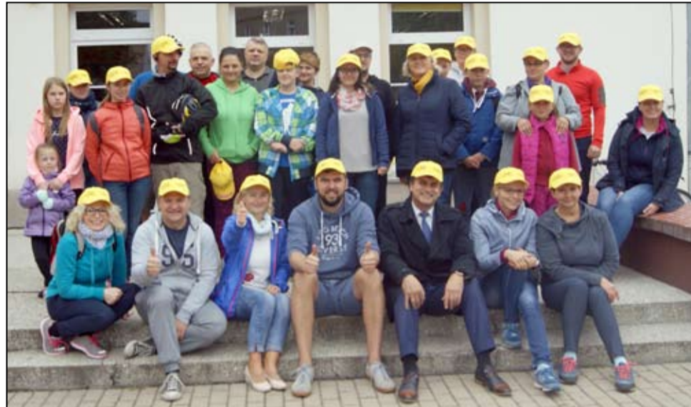
Wspólne zdjęcie uczestników III Rowerowych Potyczek Rodzinnych wraz z organizatorami.

Była to już kolejna taka inicjatywa, zorganizowana przez miłośników rowerów. Nie tak dawno, Żarowskie Stowarzyszenie „Rowerowy Żarów” było także organizatorem rajdu rowerowego, który odbył się podczas pikniku charytatywnego „Kręcimy