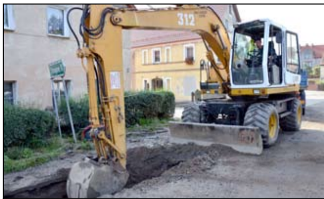
To już ostatni etap budowy kanalizacji w Łażanach. Inwestycja ma potrwać do końca października.

To bardzo dobra informacja dla mieszkańców naszej wsi. Dzięki pozyskanym środkom finansowym przez gminę, na terenie Łażan zrealizowana została kolejna ważna inwestycja. Prace rzeczywiście zrealizowane zostały w szybkim czasie i w sposób jak najmniej uciążliwy dla wszystkich mieszkańców. Teraz czekamy jeszcze na naprawę uszkodzonych przy robotach nawierzchni dróg i ułożenie nowych chodników.