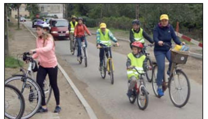
Trasa przejazdu tym razem przebiegała z Żarowa przez Mikoszewą, Przyłęgowo, Łażany do Żarowa.