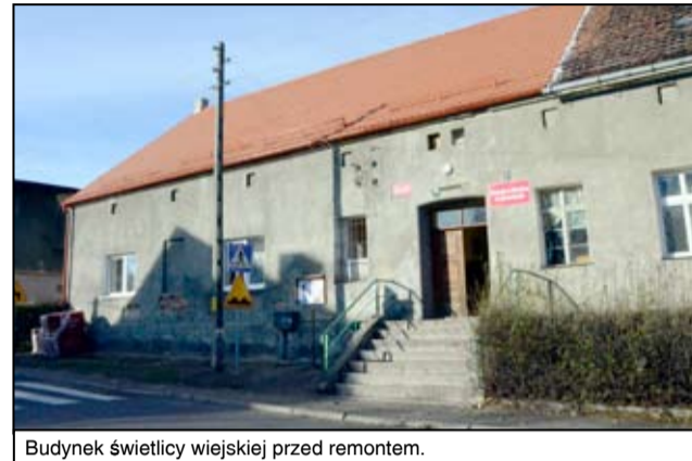
Budynek świetlicy wiejskiej przed remontem.