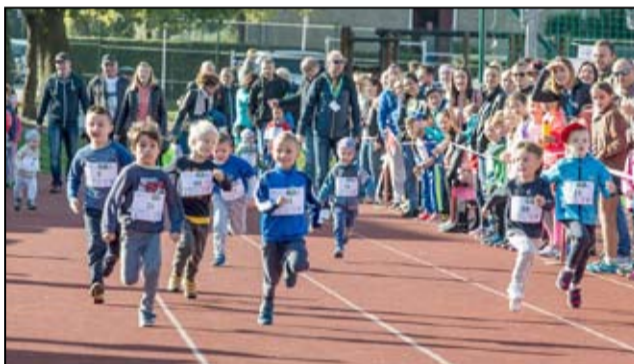
Szukamy sportowych talentów. W biegach dzieci emocji nie brakowało

Organizator zawodów Gminne Centrum Kultury i Sportu w Żarowie pragnie serdecznie podziękować tym wszystkim, którzy wsparli 2. Żarowskie Biegi Strefowe. Słowa uznania należą się przede wszystkim Wałbrzyskiej Specjalnej Strefie Ekonomicznej Invest-Park, Gminie Żarów, Electrolux Żarów, AKS, Daicel Safety Systems Europe, YAGI Factory Poland, Polskiej Ceramice Ogniotrwałej, Dekoria.pl, Franc-Textil, Bridgestone, Uzdrawisko Szczawno-Jedlina, Thermaflex, Funduszowi Regionu Wałbrzyskiego, dyrekcji, nauczycielom wychowania fizycznego i pracownikom Szkoły Podstawowej im. Jana Brzechwy w Żarowie, strażakom z Ochotniczych Straży Pożarnych działających na terenie gminy Żarów, członkom grupy Żarów Biega, Pracowni Styliu Zuzanny Urbanik, Marzena Maziak – Zumba Team Żarów, IzoToniki.com.pl. oraz JAKO. Dziękujemy!