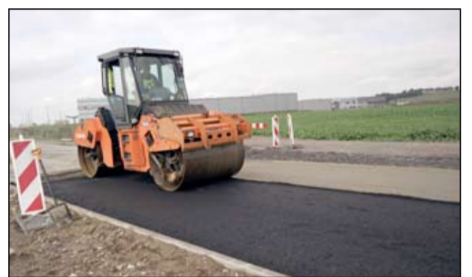
Drugi etap inwestycji zostanie zrealizowany w pierwszym kwartale 2018 roku.