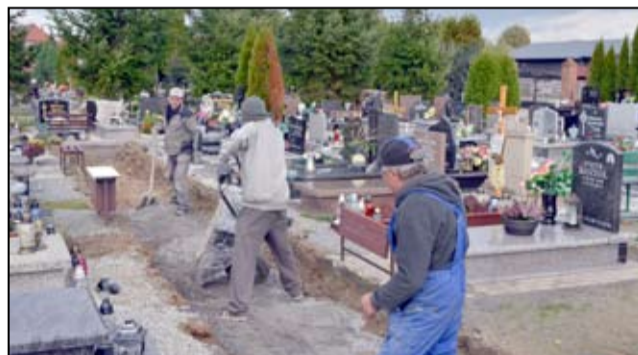
W tym roku nowej alejki powstały na terenie cmentarza komunalnych w Żarowie i Wierzbnej. Koszt inwestycji to kwota 120 tysięcy złotych.