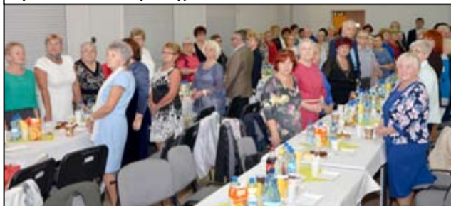
Na studentów z żarowskiej uczelni czekają nie tylko interesujące lekcje. To także integracja z innymi mieszkańcami.