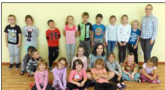
Wspólne zdjęcie dzieci z Gromady Zuchowej „Dzielne Smoki” wraz z drużynową i opiekunem.