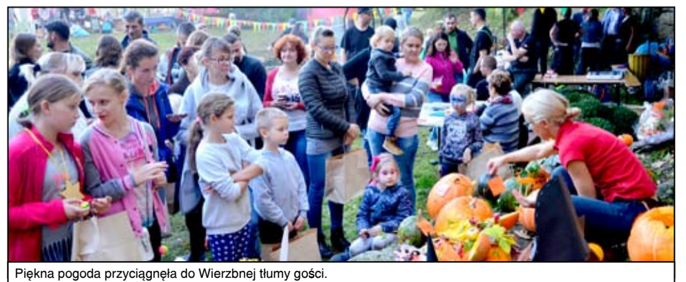
Piękna pogoda przyciągnęła do Wierzbnej tłumy gości.