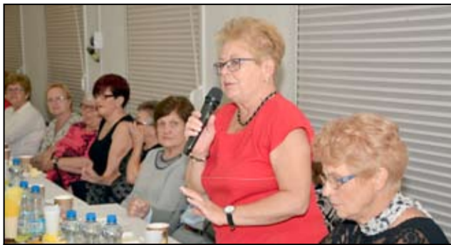
Tutaj każdy znajdzie coś dla siebie. Wspaniała atmosfera, doborowe towarzystwo i dużo ciekawych zajęć.

Co roku seniorzy z żarowskiej uczelni mają okazję