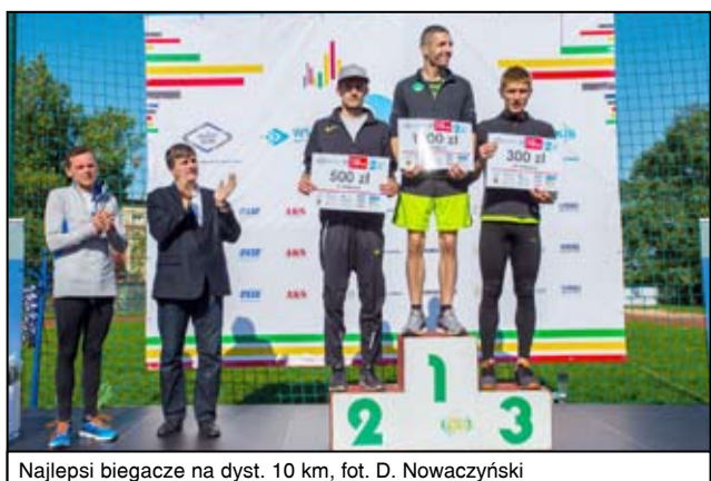
Najlepsi biegacze na dyst. 10 km