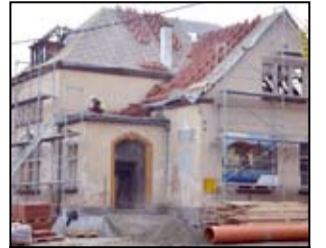
Trwa kapitalny remont budynku dworca kolejowego. Inwestycja, którą realizuje PKP S.A. potrwa do końca marca 2018 roku. Jej koszt to 6.184.440 złotych.