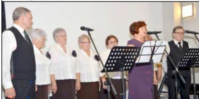
To już dziewiąty rok funkcjonowania żarowskiej uczelni, do której co roku przystępuje coraz więcej studentów seniorów. Wszystkich uczestników przywitał chór Senyor Rici.

uczestniczyć w zajęciach poszerzających ich wiedzę, umiejętności i pozwalające spędzać aktywnie swój wolny czas. - Życzę Wam, aby Uniwersytet Trzeciego Wieku działał jeszcze przez długie lata i dalej tak prężnie się rozwijał, bo to Wy go tworzyście. Mam też ogromną nadzieję,