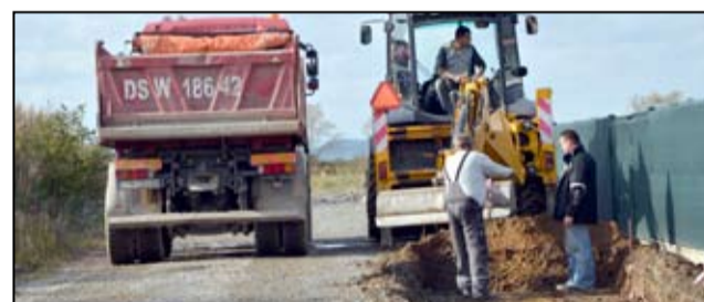
W tym roku, na terenie Bukowa zostanie wyremontowany chodnik przy ul. Kwiatowej. W kolejce czeka jeszcze ulica Lipowa.