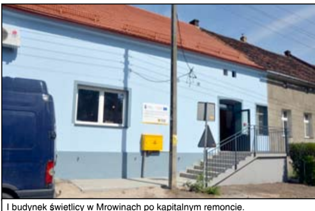
I budynek świetlicy w Mrowinach po kapitalnym remoncie.

O tym, w jaki sposób świetlica wiejska będzie wykorzystywana zadecydują już sami mieszkańcy Mrowin. W pla-