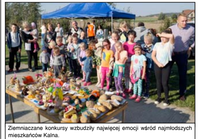
Ziemniaczane konkursy wzbudziły najwięcej emocji wśród najmłodszych mieszkańców Kalna.