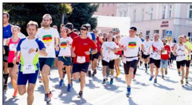
Trasa prowadziła m.in. ulicami żarowskiej strefy ekonomicznej