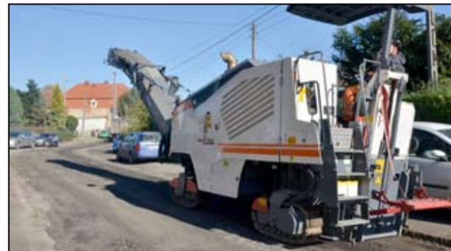
W związku z budową kanalizacji, zerwana została stara nawierzchnia drogowa.

dziemy do Mrowin niezbędny sprzęt, tak aby dobrze przygotować się do rozpoczęcia prac. Inwestycja na pewnym odcinku już się rozpoczęła i wiązać się będzie z utrudnieniami w ruchu drogowym. Trzeba się liczyć z tym, że pewne frag-