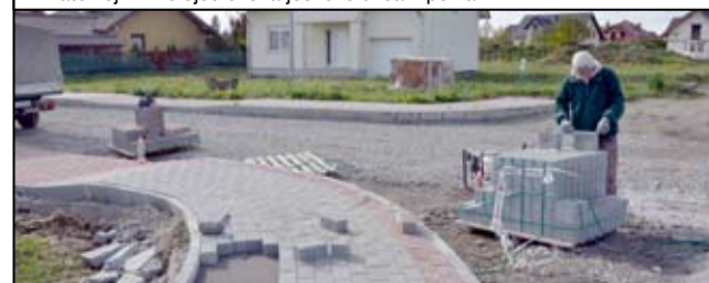
Brak chodnika w tym miejscu był już od dawna bolączką mieszkańców, którzy mieszkają przy ulicy Ks. Jadwigi i H. Pobożnego. Mieszkańcy czekają jeszcze tylko na drogę.