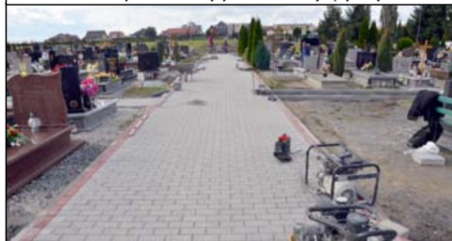
Dzięki corocznym remontom żarowski cmentarz komunalny nabiera zupełnie innego wyglądu. Odwiedzający groby swoich bliskich już nie skarżą się na błotniste dróżki, które pojawiały się, gdy tylko popadał deszcz.

R uszyła budowa kolejnych nowych alejek na żarowskim cmentarzu komunalnym.