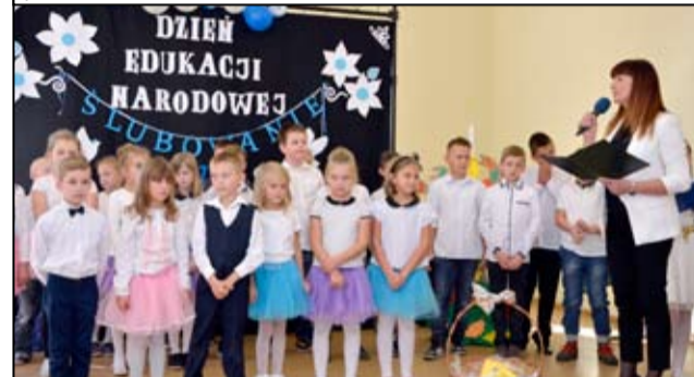
Pierwszoklasiści ze SP w Mrowinach ślubowali dbać o dobre imię szkoły.