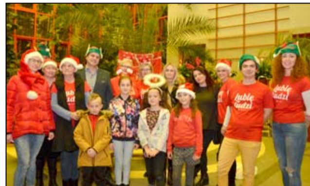
To był rzeczywiście weekend cudów. Dzięki wsparciu darczyńców, zaangażowaniu wolontariuszy i pomocy życzliwych osób potrzebujące rodziny otrzymały świąteczne podarunki.