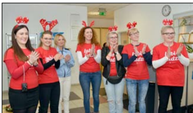
Inicjatorzy projektu „Szlachetnej Paczki” w Żarowie – pracownicy firmy Daicel Safety Systems Europe.