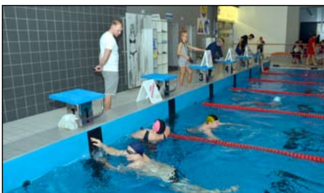
Charytatywne nocne pływanie na żarowskim basenie cieszyło się dużym zainteresowaniem miłośników pływania.