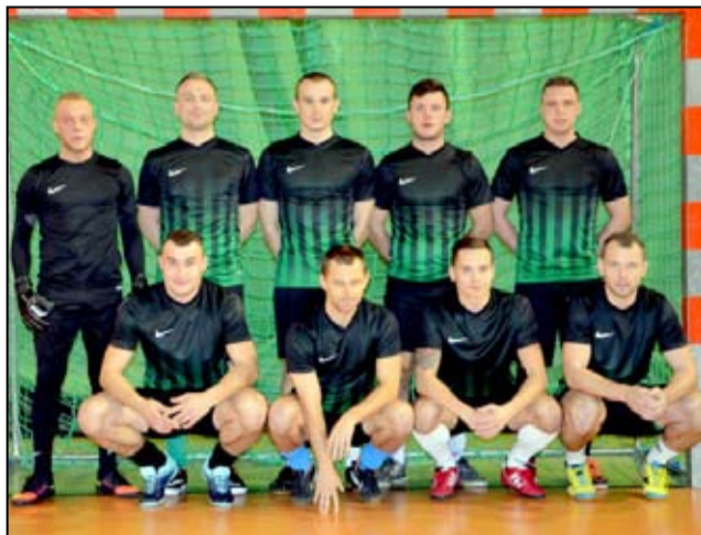
Drużyna Serie A

Cannabis oraz KKZ Zaskoczeni Żarów jako jedyni posiadają komplet punktów w Żarowskiej Lidze Fut-salu Electrolux Cup.