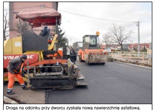
Droga na odcinku przy dworcu zyskała nową nawierzchnię asfaltową.

Równocześnie trwają prace drogowe w obrębie skrzyżowania, gdzie powstanie rondo. więcej na str. 3