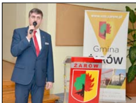
Wśród zaplanowanych inwestycji na 2018 rok nie zapomnieliśmy również o naszych wsiach. Będzie to budowa oświetlenia ulicznego w Łażanach, Wierzbnej, Siedlimowicach i Mrowinach, budowa kanalizacji w Mrowinach i nowych chodników, budowa obwodnicy Pożarzyska, dróg dojazdowych do gruntów rolnych (drogi w Pyszczyńcu, Mielęcinie, Mikoszowa-Przyłęgów, Mrowinach, Bukowie, Pożarzysku, Gołaszycach, Wierzbnej, Łażanach i Żarowie – ul. Księżnej Jadwigi), zakup nowego wozu strażackiego dla OSP Imbramowice, adaptacja poddasza budynku Szkoły Podstawowej w Mrowinach, budowa boiska przy Szkole Podstawowej w Imbramowicach, powstanie otwartych stref aktywności w Pyszczyńcu, Przyłęgowie, Krukowie, Mielęcinie i Imbramowicach, rozbudowa świetlic wiejskich w Łażanach, Bukowie, Mrowinach i Wierzbnej, renowacja zabytków oraz scalenie gruntów.