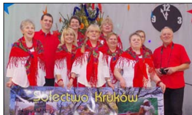
Występ zespołu Krukowianie podczas IV Przeglądu Kolęd i Pastorałek „Hej Kolęda” w Gęsińcu pod Strzelinem.