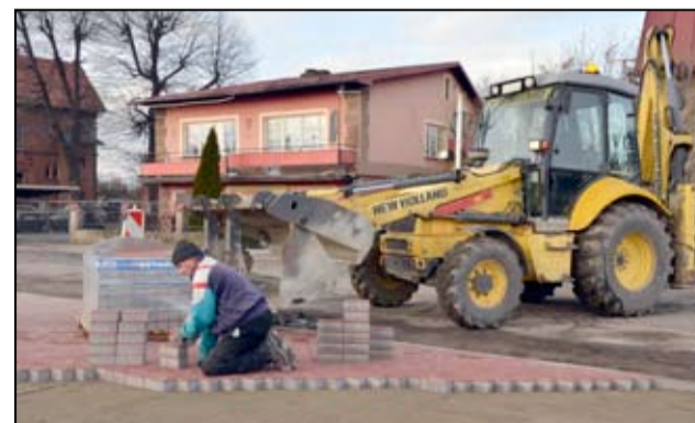
Przygotowywane są także kolejne miejsca parkingowe.