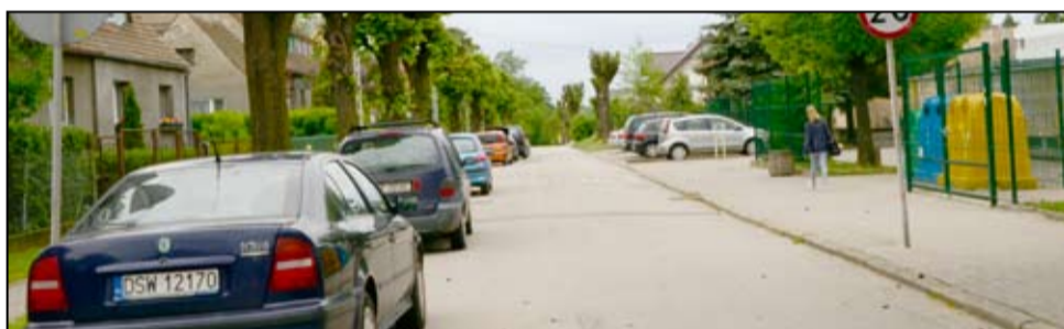
Rewitalizacja zdegradowanych obszarów (w ramach tego zadania zrewitalizowany ma zostać teren Placu Wolności w Żarowie: przebudowa ścieżek pieszych, montaż urządzeń rekreacji – place zabaw, siłownia zewnętrzna, strefa seniora wraz z montażem ławek, altanek i stołu do gier oraz ulica 1 Maja – tutaj zagospodarowany będzie teren przy Szkole Podstawowej, wykonamy nowe trawniki i nasadzenia, powstanie nowy plac zabaw oraz siłownia zewnętrzna)