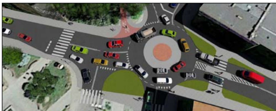
Budowa Centrum Przesiadkowego w Żarowie (szacunkowy koszt zadań: 6.012.684,00 zł, w tym dofinansowanie 4.347.199,01 zł. Planowany termin zakończenia II kwartał 2018 roku)