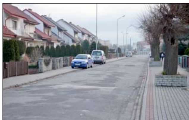
Rewitalizacja miasta i przebudowa dróg w Żarowie oraz zagospodarowanie terenów przestrzeni w mieście (dotyczy ulic: Dworcowa, Kopernika, Kwiatowa, Mickiewicza, Plac Wolności, Puszkina, Słowackiego, Sportowa, Wojska Polskiego, Zamkowa. Koszt zadania to kwota 2.625.616,00 zł, w tym dofinansowanie 1.816.168,00 zł)