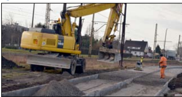
Na placu tuż za targowiskiem miejskim powstaje nowa ścieżka rowerowa wraz z chodnikiem.