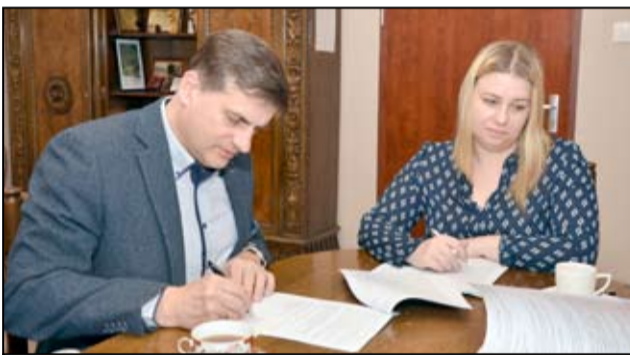
Podpisanie umowy na realizację drugiego etapu budowy kanalizacji w Mrowinach.