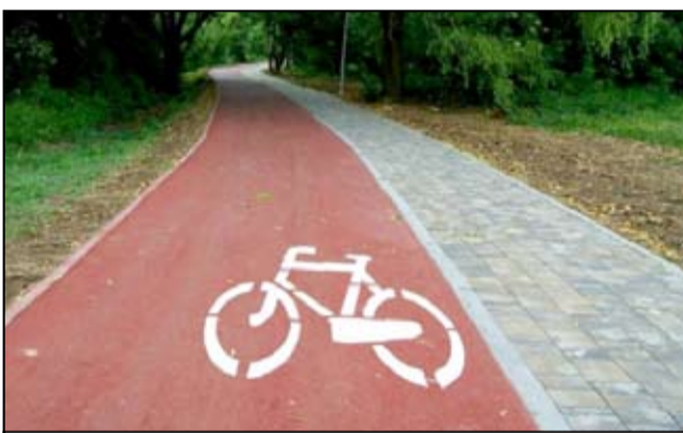
Wykonanie dróg rowerowych, ciągów pieszych wraz z oświetleniem w Żarowie (termin zakończenia to koniec sierpnia 2018 roku, do użytku mieszkańców oddane zostaną ponad 8 km ścieżek rowerowych, ponad 4 km chodników i 76 sztuk słupów oświetleniowych ledowych)