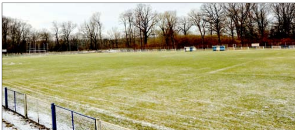
Rewitalizacja Parku Miejskiego z boiskiem sportowym (koszt zadania to kwota 1.562.947,00 zł, w tym planowane dofinansowanie 841.331, 00 zł. W ramach zadania powstaną nowe trybuny i szatnie dla sportowców)