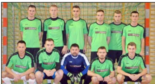
Dużą szansę na udział w finale mają debiutujący w rozgrywkach piłkarze PERLAŻE Rakserwis

17:00 Electrolux Żarów – Kuźnia Talentów 17:40 Darbor Bolesławice – AUTO-SHOP Żarów 18:20 Cannabis – KKZ Zaskoczeni Żarów