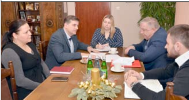
Zakres prac realizowanej inwestycji jest bardzo duży, dlatego zadanie podzielone zostało na trzy etapy.