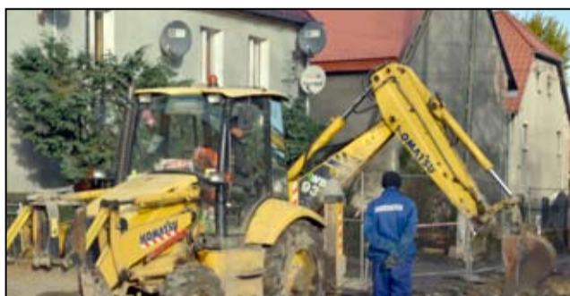
Budowa kanalizacji w Mrowinach (II etap ma potrwać do końca sierpnia 2018r., szacunkowy koszt zadania to kwota 4.500.000, 00 zł, planowane dofinansowanie to kwota 3.109.131,72 zł, w tym etapie zostanie skanalizowana pozostała część ulicy Wojska Polskiego aż do Żarowa)