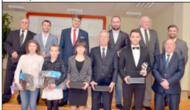
Wspólne zdjęcie nagrodzonych laureatów w konkursie „Sportowe Indywidualności Gminy Żarów” wraz z organizatorami.