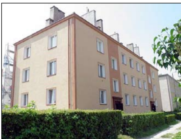
Rewitalizacja budynków wspólnot mieszkaniowych – 29 budynków (koszt zadania to kwota 3.271.979, 28 zł, w tym dofinansowanie 1.600.000,00 zł)