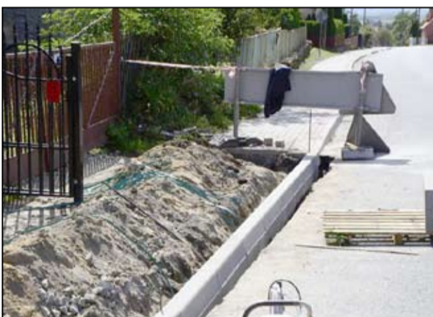
Budowa chodników przy drogach gminnych i powiatowych (chodniki w Żarowie, Wierzbnej, Zastrużu, Bukowie, Imbramowicach, Łażanach, Pożarzysku. Koszt zadania to kwota 877.315,83 zł, w tym dofinansowanie 30.000,00zł).