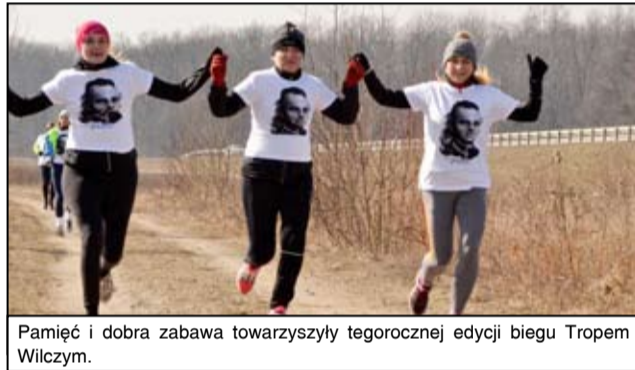
Pamięć i dobra zabawa towarzyszyły tegorocznej edycji biegu Tropem Wilczym.