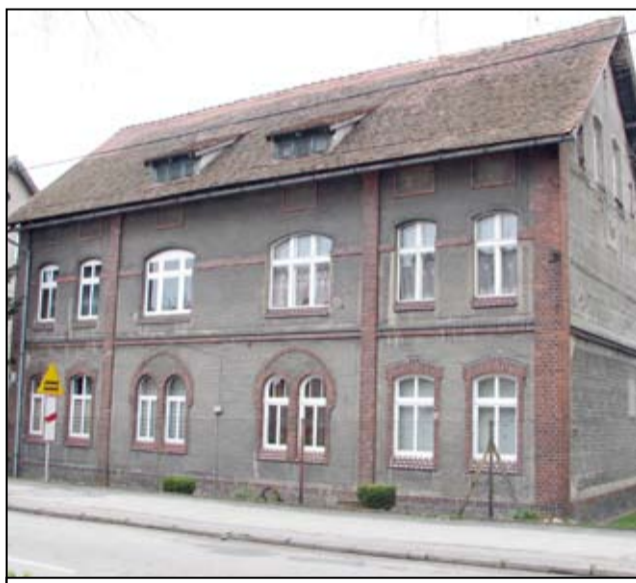
W ramach projektu wykonane będą remonty dachów, elewacje, roboty demontażowe, ocieplenia budynków, dobudowy przewodów kominowych, wymiany instalacji elektrycznych oraz przemurowywania kominów.

przy ul. Armii Krajowej 12 A,B,C w Żarowie przy ul. Armii Krajowej 16 w Żarowie przy ul. Armii Krajowej 18-20 w Żarowie przy ul. Armii Krajowej 21 w Żarowie przy ul. Armii Krajowej 25 w Żarowie przy ul. Armii Krajowej 27 w Żarowie przy ul. Armii Krajowej 28-30 w Żarowie przy ul. Armii Krajowej 32 w Żarowie przy ul. Armii Krajowej 39 w Żarowie przy ul. Armii Krajowej 40 A w Żarowie przy ul. Armii Krajowej 45 w Żarowie przy ul. Armii Krajowej 50 w Żarowie przy ul. Armii Krajowej 65 A,B,C w Żarowie przy ul. Mickiewicza 1 w Żarowie przy ul. Mickiewicza 3 w Żarowie przy ul. Mickiewicza 5 w Żarowie przy ul. Mickiewicza 10 w Żarowie przy ul. Mickiewicza 11 w Żarowie przy ul. Mickiewicza 12 w Żarowie przy ul. Mickiewicza 23 w Żarowie przy ul. Piastowskiej 2 w Żarowie przy ul. Piastowskiej 4 w Żarowie przy Pl. Wolności 1 w Żarowie przy ul. Sikorskiego 5-7 w Żarowie przy ul. Sportowej 3 w Żarowie przy ul. Zamkowej 5 w Żarowie przy ul. Zamkowej 7-15 w Żarowie przy ul. Mickiewicza 21 i Sikorskiego 2.