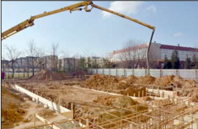
W nowym budynku znajdzie się miejsce dla 50 maluchów.