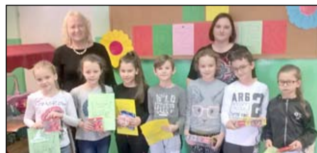
Na zdjęciu wyróżnieni laureaci konkursu wraz z organizatorami.