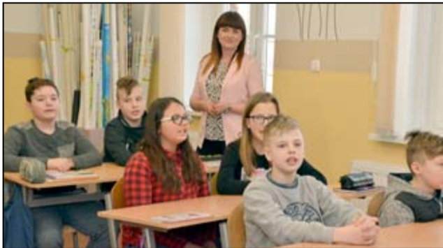
Szkoła nie musi być duża. Najważniejsze, żeby miała konkretny pomysł na edukację. W Mrowinach szkoła to serce wsi.

W tym roku szkolnym udało nam się wykonać wiele prac remontowych. Dzięki temu szkoła staje się piękniejsza i przyjazna dzieciom. Na zewnątrz dokończyliśmy kolejny odcinek ogrodzenia, wyłożyliśmy kostką brukową plac za szkołą, który jest przeznaczony dla uczniów, aby aktywnie spędzali przerwy. Odnowione zostało również wejście do budynku szkoły. W środku budynku wyremontowaliśmy podłogi w dwóch salach, gdzie zostały także pomalowane ściany. Ponadto remontu doczekały się drzwi do piwnicy i pomieszczenie gospodarcze. Zaadaptowaliśmy strych z przeznaczeniem na bibliotekę oraz sekretariat. W najbliższym czasie planujemy zorganizować parking dla rodziców, którzy dowożą swoje dzieci do szkoły samochodami. A w okresie wakacyjnym wyremontować dwie sale dla uczniów klasy 7 i 8. W naszej szkole realizujemy dwa projekty unijne „Aktywny uczeń” i „Interaktywna tablica”. Dzięki temu pozyskaliśmy kolejne tablice multimedialne, które są wykorzystywane nie tylko na obowiązkowych zajęciach, ale także na rozwijających. Zapraszamy uczniów, aby swoją edukację rozpoczęli w naszej szkole.