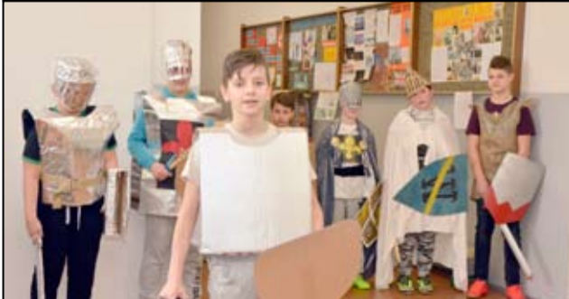
Szkoła realizuje wiele atrakcyjnych projektów, w których biorą udział uczniowie.