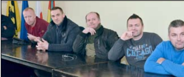
W tym roku w rejonie domków jednorodzinnych powstaną ścieżki rowerowe i nowe chodniki.