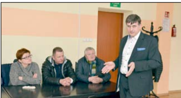
Tematem spotkania burmistrza z mieszkańcami była budowa ścieżek rowerowych i nowych chodników w rejonie osiedla domków jednorodzinnych.