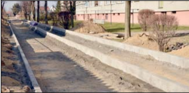
Ścieżki rowerowe sukcesywnie powstaną w różnych częściach naszego miasta.