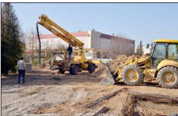
Na placu przy Bajkowym Przedszkolu pracują koparki i ciężki sprzęt.