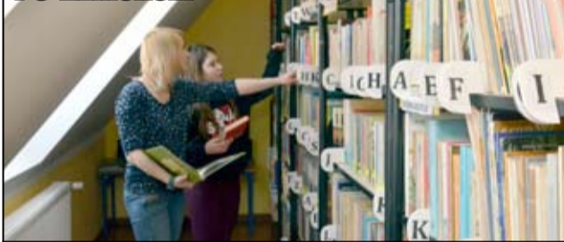
Dzisiaj mieści się tam mała nowoczesna biblioteka.