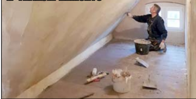
Tak w trakcie remontu wyglądała sala na poddaszu.