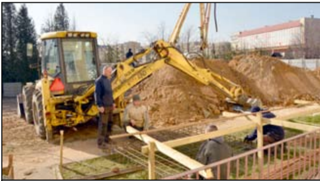
Obiekt będzie gotowy na jesień tego roku.