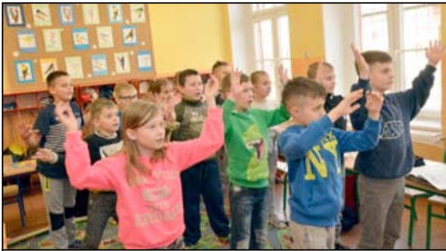
Dzięki systematycznym remontom uczniowie kształcą się w bardzo dobrych warunkach. Jedną z ważniejszych inwestycji, które zostały tutaj zrealizowane w 2017r. był remont dachu i kominów, który pochłonął 110 tysięcy złotych.