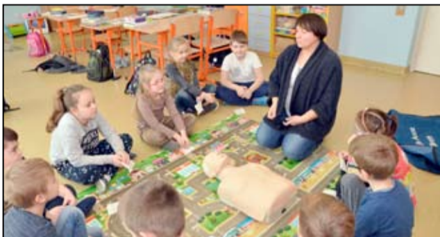
Salę lekcyjną są każdego roku odnawiane, tak aby uczniowie mogli kształcić się w komfortowych warunkach.

Jesteśmy placówką, która skupia uczniów z kilku miejscowości z gminy Żarów, ale przychodzą do nas także uczniowie z innych ościennych gmin. Zachęcamy, bo nasza szkoła, choć wiejska, jest duża i rozwojowa, ciągle coś nowego się tutaj dzieje. Staramy się uczestniczyć w ciekawych, atrakcyjnych dla uczniów, rodziców i środowiska projektach edukacyjnych i programach. Jednym z nich jest projekt edukacyjny „Aktywny Uczeń”, w którym uczestniczy 6 grup. Są to zajęcia rozwijające, utrwalające lub wyrównujące szanse edukacyjne. Zajęcia lekcyjne także prowadzone są nowatorskimi metodami. Uczniowie uczestniczą w projektach „Pochwal się swoim talentem”, „Szkoła to nasz drugi dom”, „Maraton matematyczny”. Realizujemy również projekty dla środowiska, rodziców, dziadków i wszystkich mieszkańców wsi. Szkoła się ciągle rozwija, są prowadzone remonty i modernizacje. Doposażamy placówkę w nowoczesne meble, sprzęt i środki dydaktyczne. Funkcjonuje u nas biblioteka, pracownia komputerowa i staramy się pozyskiwać kolejne środki na doposażenie, tak aby nasza placówka rozwijała się jak najlepiej. Zachęcamy i zapraszamy dzieci do naszej szkoły. Mamy wspaniałą kadrę pedagogiczną, która się wciąż doskonali i prowadzi zajęcia nowatorskimi metodami.