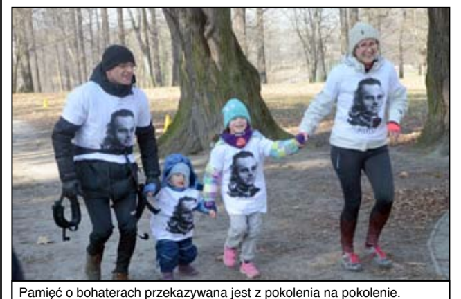
Pamięć o bohaterach przekazywana jest z pokolenia na pokolenie.