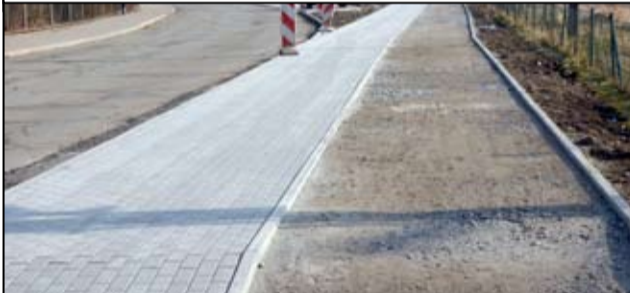
Budowa ścieżek jest elementem dużego projektu realizowanego w Żarowie, związanego z ograniczaniem skutków tzw. niskiej emisji.