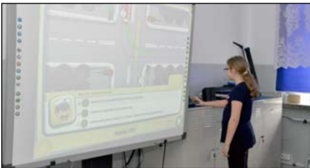
Do dyspozycji uczniów są nowoczesne sprzęty multimedialne wykorzystywane na zajęciach.