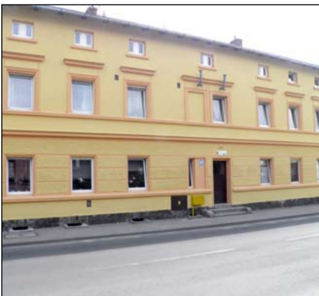
Tak po kompleksowym remoncie wygląda budynek wspólnoty mieszkaniowej przy ul. Armii Krajowej 24.