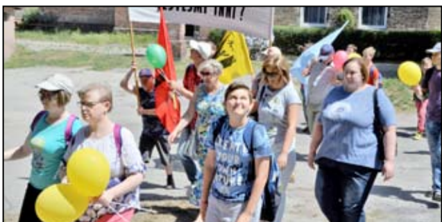
Niepełnosprawni wspólnie z mieszkańcami naszej gminy przemarszerowali ulicami miasta.