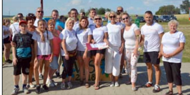
Zwycięzcy tegorocznej edycji Turnieju Wsi – mieszkańcy Pożarzyska.