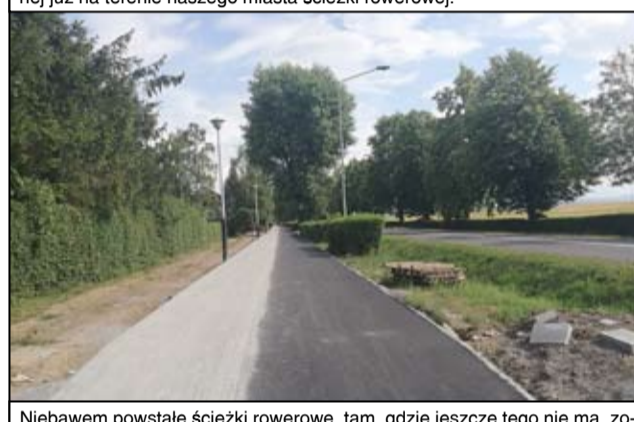
Niebawem powstałe ścieżki rowerowe, tam, gdzie jeszcze tego nie ma, zostaną odpowiednio oznakowane.