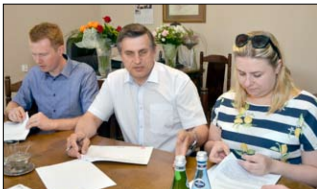
Czas na remonty w kolejnej części naszego miasta. Kolejne drogi będą miały nowe i bezpieczne nawierzchnie.