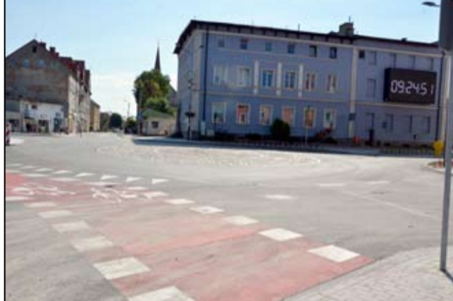
A tak wygląda centrum Żarowie po remoncie.

Kolejna część ulicy Dworcowej jest obecnie w trakcie remontu, a w kolejce czekają następne ulice w mieście, które także zostaną zmodernizowane. W centrum miasta pojawiają się nowe nasadzenia. Zrobiło się bardziej zielono i kolorowo. Trwa oznakowanie nowej wybudowanej infrastruktury. Czekamy jeszcze na dokończenie budowy wszystkich ścieżek rowerowych w mieście. Bez wątplenia jednak, wszystkie te przedsięwzięcia wpłynęły na nowy wygląd naszego miasta. - Nasi mieszkańcy już zapewne zdołali się przyzwyczaić do nowych elementów wybudowanej infrastruktury drogowej. Czytam także wszystkie komentarze, które pojawiają, w związku z realizowanymi inwestycjami w Żarowie, na facebooku i dziękuję za wszystkie spostrzeżenia, które są dla nas ważne.