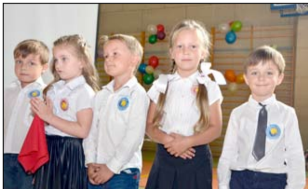
Wszystkie występy artystyczne przedszkolaków były gromko oklaskiwane przez zgromadzoną publiczność, zwłaszcza dumnych rodziców i dziadków.