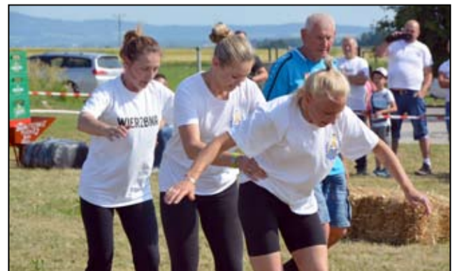
Bieg na nartach. Na zdjęciu reprezentacja Wierzbnej podczas zmagania w tej konkurencji.