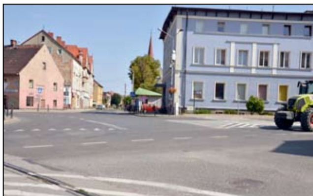
Tak przed przebudową głównego skrzyżowania wyglądało centrum miasta.