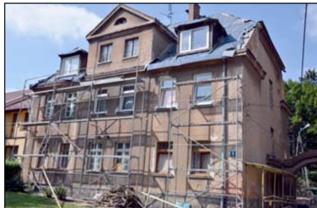
Kilka dni temu rozpoczął się remont budynku przy ul. Zamkowej 5 w Żarowie.

den budynek gminny zostały kompleksowo wyremontowane. Niebawem kolejne budynki zmienią swój wygląd i staną się wizytówką miasta.