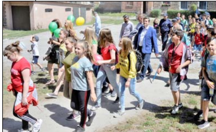
Tak co roku rozpoczyna się Żarowski Dzień Godności.