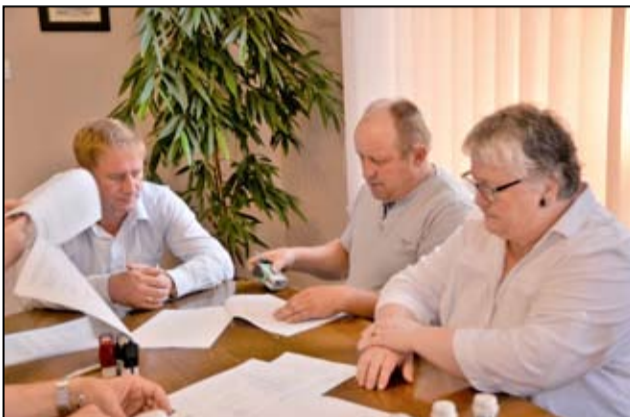
Podczas podpisania umowy z wykonawcą inwestycji nie mogło zabraknąć również zarządców wspólnot mieszkaniowych.

Program rewitalizacji budynków mieszkalnych to