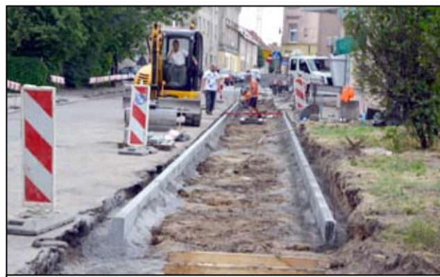
Przy ul. Sikorskiego w Żarowie kilka dni temu rozpoczęła się budowa kolejnej już na terenie naszego miasta ścieżki rowerowej.