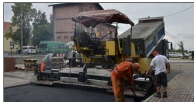
Prace przy ul. Dworcowej przebiegają sprawnie, a wykonawca inwestycji zapewnia, że droga już niebawem zostanie udostępniona mieszkańcom.

K ończą się powoli prace związane z modernizacją ulicy Dworcowej w Żarowie. Niebawem droga zyska nową nawierzchnię asfaltową, dzięki której poprawi się komfort jazdy na tym odcinku drogowym.