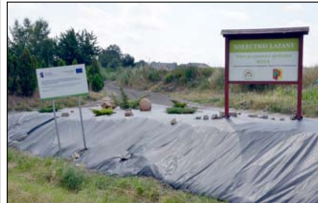
Tak wygląda uporządkowany skwer przy ul. Szkolnej w Łażanach, dzięki wspólnej społecznej pracy mieszkańców.