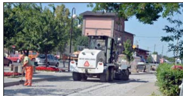
Dzięki realizacji projektu, na który gmina Żarów pozyskała unijne dofinansowanie, kilkanaście dróg na terenie miasta zyska nowe nawierzchnie drogowe.