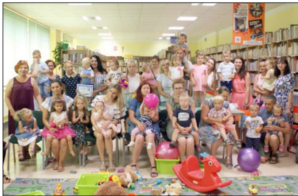
Wspólne zdjęcie najmłodszych uczestników zajęć w Akademii Malucha wraz z rodzicami, opiekunami i organizatorami.