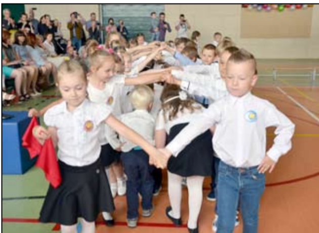
Polonez na pożegnaniu. To już tradycja w Bajkowym Przedszkolu. Najstarsze przedszkolaki zatańczyły po mistrzowsku.