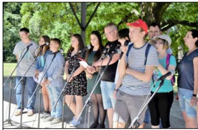
Podczas świętowania nie zabrakło również występów artystycznych, także w wykonaniu osób niepełnosprawnych.