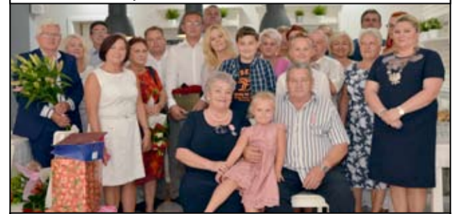
Wspólne zdjęcie rodziny, przyjaciół i zaproszonych gości z jubilatami.