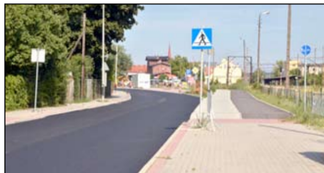
Wyremontowana droga, powstała ścieżka rowerowa i nowy parking – dzięki nowej infrastrukturze ulica Dworcowa zmieniła swój wizerunek.

Wartość całego zadania opiewa na kwotę 5.866.510,15 złotych . - Realizujemy kolejne inwestycje drogowe na terenie naszego miasta. Cała ulica Dworcowa, dzięki wykonanym już pracom zyskała nowy wizerunek. W tej chwili prace drogowe koncentrują się przy ulicach Wojska Polskiego i Kopernika. Otrzymaliśmy także zawiadomienie, że za kilka dni ruszy również przebudowa ulicy Słowackiego, co wiązać się będzie z utrudnieniami w ruchu drogowym. Remonty dróg z pewnością poprawią komfort jazdy. Zrobi się