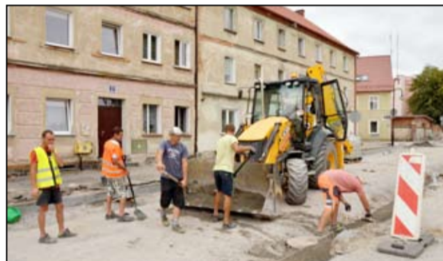
Drogowcy pracują teraz przy przebudowie drogi na ulicy Wojska Polskiego w Żarowie.