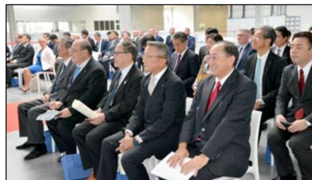
W uroczystości rozbudowy fabryki uczestniło wielu gości.