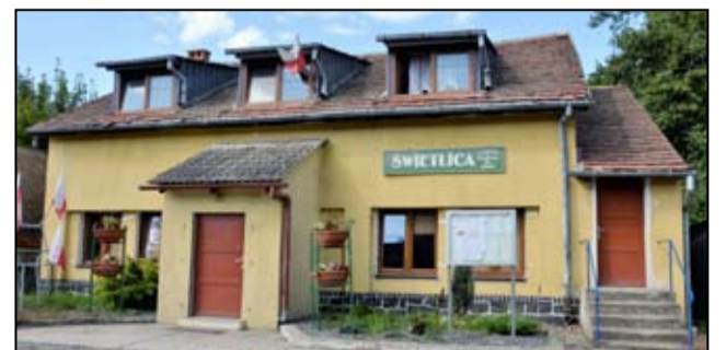
Świetlica wiejska w Łażanach już niebawem zyska nowy wygląd.