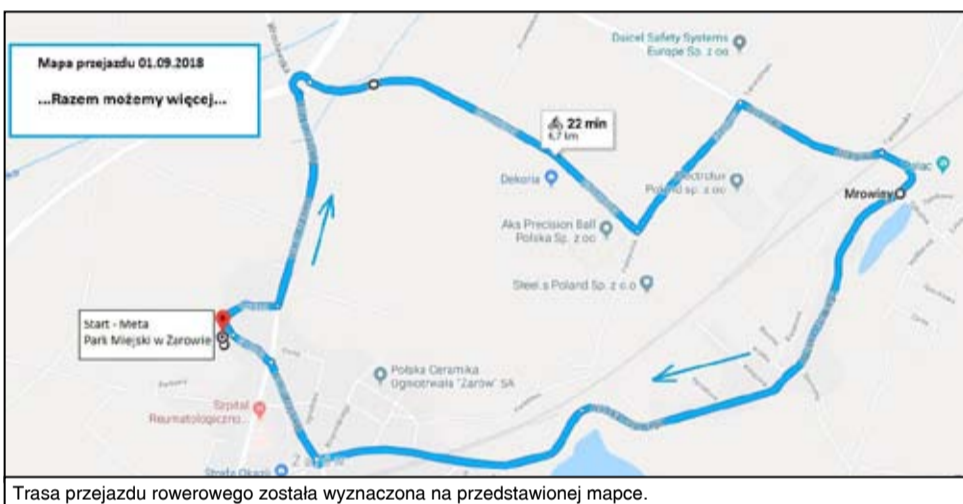
Trasa przejazdu rowerowego została wyznaczona na przedstawionej mapce.