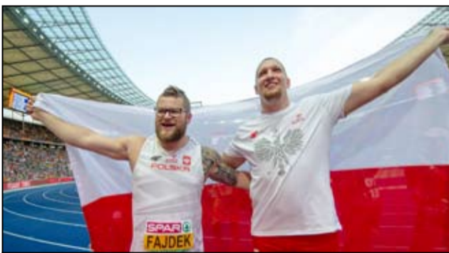
Paweł Fajdek i Wojciech Nowicki potwierdzili dominację w sezonie, zdobywając dwa pierwsze miejsca ME

i Nowicki będą wciąż tak wyraźnie lepsi od całej reszty świata? W tym sezonie z dziesięciu najlepszych wyników, aż dziewięć należy do nich. Brązowy medalista Mistrzostw Europy od Nowickiego był gorszy o prawie trzy metry, a od Fajdka o półtora metra.