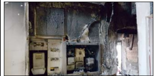
Wyposażenie pomieszczeń objętych pożarem uległo całkowitemu zniszczeniu.

Wszystkich, którzy są w stanie pomóc ofiarom pożaru w Żarowie prosimy o dokonanie dobrowolnych wpłat na rachunek bankowy Żarowskiego Stowarzyszenia „Edukacja”: