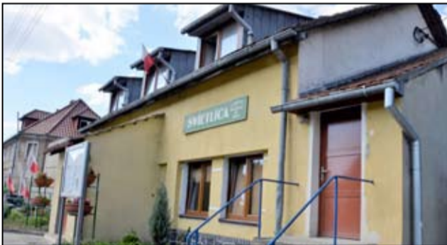
Pierwsze prace remontowe ruszą tuż po podpisaniu umowy z wyłonioną wykonawcą inwestycji.