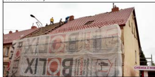
Prace przy wymianie pokrycia dachowego realizowane są teraz na budynku przy ul. Armii Krajowej 28-30

teraz na podpisanie umów z wykonawcami - wyjaśnia burmistrz Leszek Michalak .