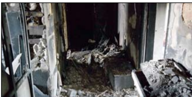
Przyczyny pożaru nie są jeszcze znane, ale najprawdopodobniej ogień wybuchł wskutek zwarcia instalacji elektrycznej.