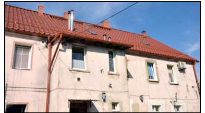
Budynek przy ul. Armii Krajowej 28-30 w Żarowie jest już po rewitalizacji.

Zakończył się remont dachu budynku przy ul. Armii Krajowej 28-30 w Żarowie.