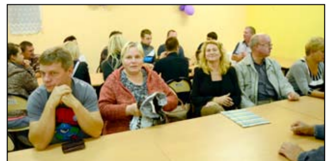
Na zebraniach wiejskich mieszkańcy wsi będą decydować o kolejnych zadaniach z funduszu sołeckiego.