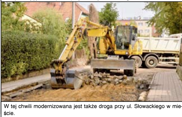
W tej chwili modernizowana jest także droga przy ul. Słowackiego w mieście.