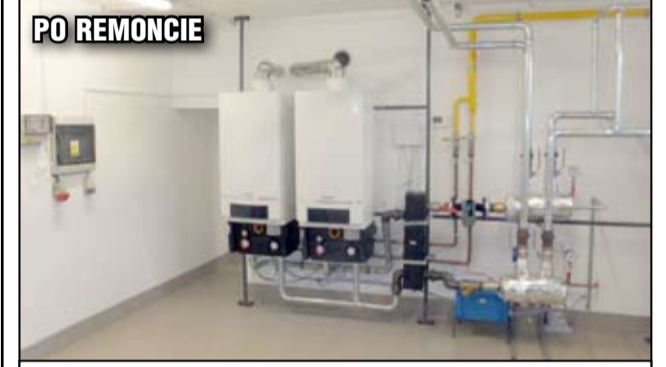
Po zrealizowanych pracach jest czysto i estetycznie. Szkoła zyskała także nowy piec.