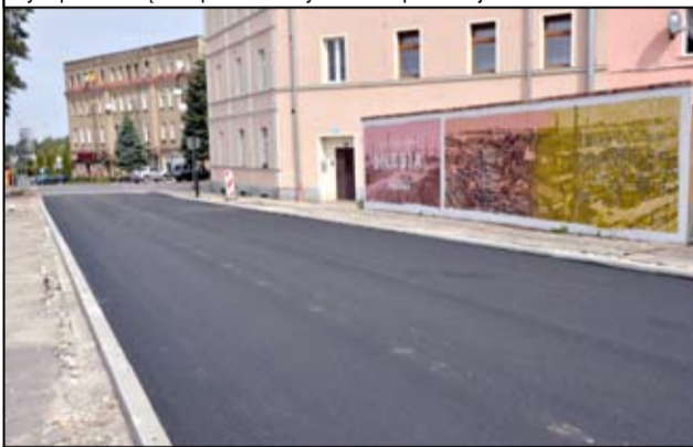
Wciąż trwają jeszcze prace przy ul. Wojska Polskiego w Żarowie.