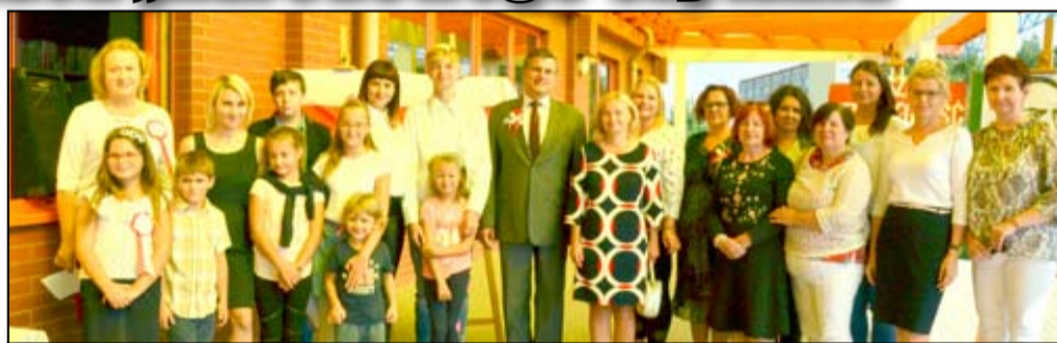
Uczestnicy „Narodowego Czytania” w Żarowie.