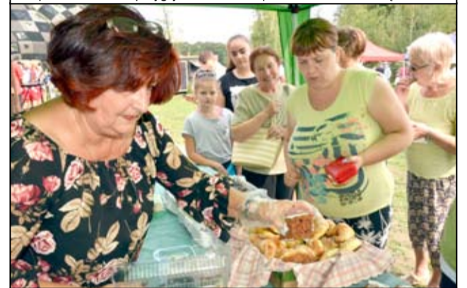
Ciasta wypieczone z siedlimowickiej mąki znikają ze stoiska w ekspresowym tempie.