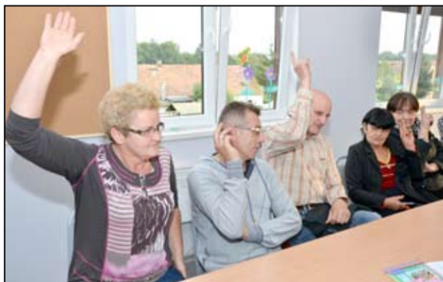
Zebrania odbędą się we wszystkich sołectwach na terenie gminy Żarów.