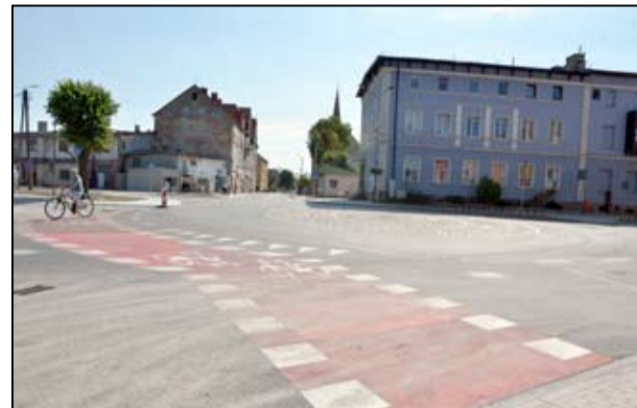
Powstałe rondo przy głównym skrzyżowaniu w Żarowie początkowo budziło wiele kontrowersji. Dziś, po kilku miesiącach od jego powstania widać, że nowe rondo usprawniło ruch w tym miejscu na terenie naszego miasta.

• Kierunkowskazy na rondzie - przy wjeżdżaniu na rondo nie używamy kierunkowskazu (chyba, że chcemy od razu skręcić w prawo). Istnieje natomiast prawny obowiązek włączenia prawego kierunkowskazu przy