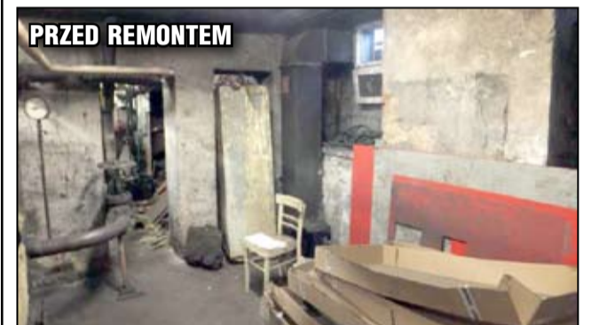
Tak wyglądało pomieszczenie kotłowni przy SP Żarów przed remontem.