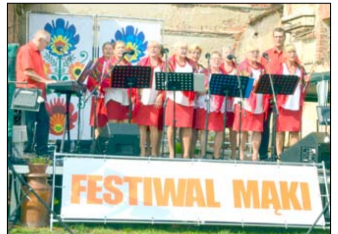
Zespół Krukowanie przygrywał na scenie podczas Festiwalu Mąki.