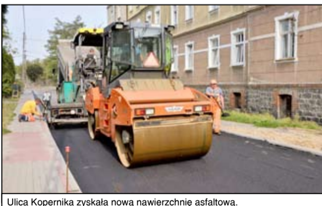
Ulica Kopernika zyskała nową nawierzchnię asfaltową.