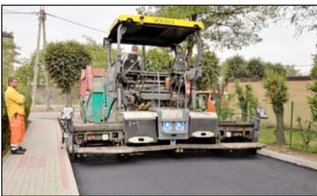
Dotychczasowa droga była zniszczona i dziurawa. Dzięki przeprowadzonym pracom będzie przede wszystkim bezpieczniej.