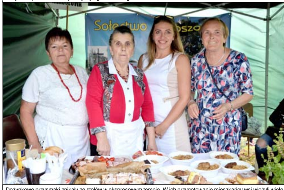
Dożynkowe przysmaki znikały ze stołów w ekspresowym tempie. W ich przygotowanie mieszkańcy wsi włożyli wiele serca.