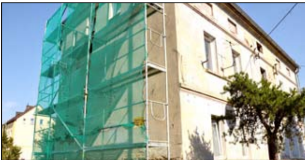
Ruszył remont kolejnego budynku na terenie naszego miasta.