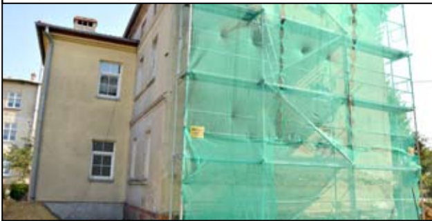
Budynek przy ul. Mickiewicza 21 w Żarowie już niebawem zyska nową elewację.