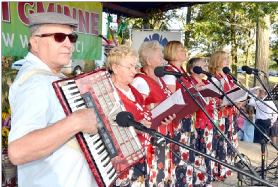
Wśród występujących na scenie nie zabrakło także zespołu Zarowanie.