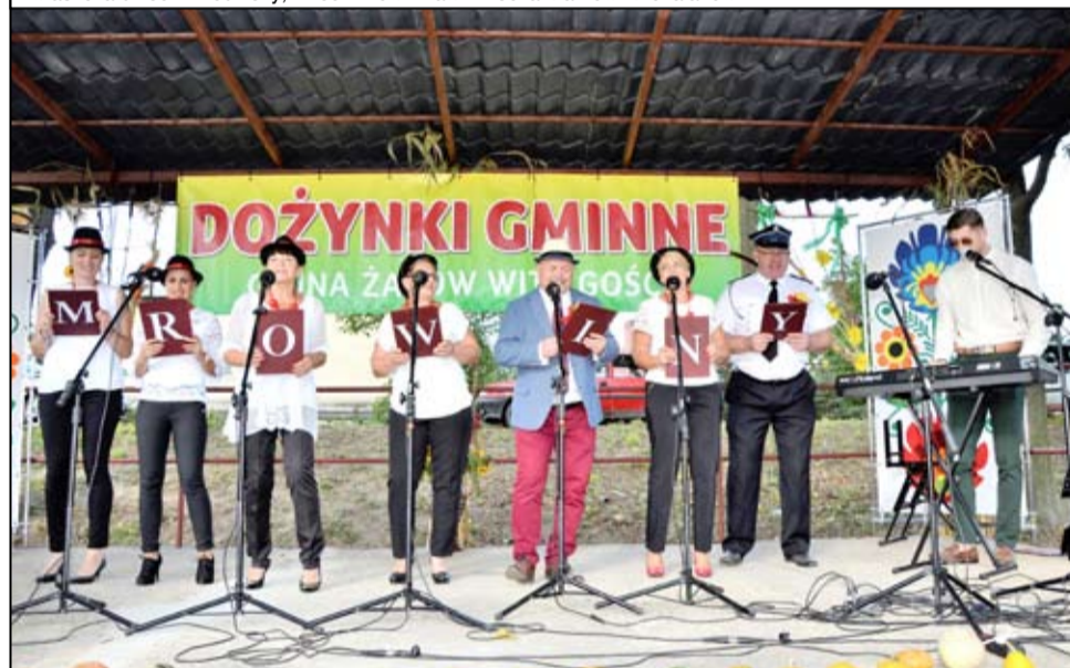
Na zdjęciu mieszkańcy Mrowin podczas występu artystycznego. Przygotowali wiązanekę dożynkowych hitów, przy których wspólnie bawili się wszyscy zgromadzeni goście.