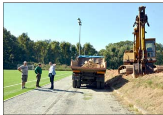
Pierwsze inwestycje rozpoczęły się tutaj od zerwania starych trybun.

łoniony. Będzie to bieżnia nie tartanowa, jaką mamy przy Szkole Podstawowej im. Jana Brzechwy na ul. 1 Maja. To będzie bieżnia twarda, z przeznaczeniem dla rolkarzy czy biegaczy. Jesteśmy również w trakcie ogłoszenia przetargu na przebudowę ulicy Sportowej od strony ul. Zamkowej i ul. Armii Krajowej do bramy naszego stadionu. Droga ta niebawem zyska więc nową nawierzchnię asfaltową. Płyty, które tutaj na razie jeszcze się znajdują chcemy wykorzystać do stworzenia dodatkowego dojazdu do stadionu od strony ulicy Rzemieślniczej, która jest w tej chwili zaprojektowana i przygotowana od strony projektu wykonawczego. Wszystkie inwestycje umożliwiające funkcjonowanie samego stadionu zostały uzgodnione z zarządem klubu. Zgodnie z podpisaną umową mają potrwać