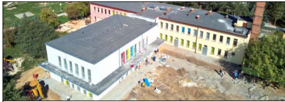
Nowy budynek będzie przestronny, nowoczesny i co najważniejsze przyjazny dla maluchów.

Placówka będzie posiadała piękną, nowoczesną bazę. Będą w niej dwie sale zabaw, jadalnie, sypialnie, szatnie, łazienki dla dzieci oraz sala widowiskowa z przeznaczeniem na wspólne zabawy i uroczystości. Powstanie także zaplecze kuchenne oraz szatnia i toalety dla personelu. - Prace postępują bardzo szybko, codziennie się coś dzieje i na zewnątrz i w środku. Nawet nasze przedszkolaki zaglądają w okna i obserwują, jak zmienia się powstający budynek. Ogłosiliśmy konkurs na logo żłobka miejskiego w Żarowie, wybraliśmy nazwę placówki – Bajkowa Kraina. Rekrutację do przedszkola i żłobka mieliśmy w miesiącu lutym i wszystkie dzieci, które