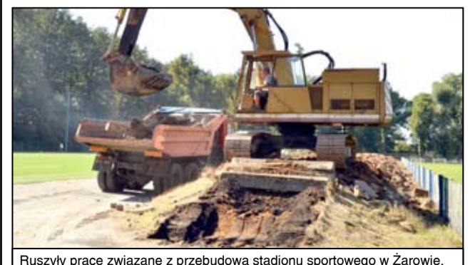
Ruszyły prace związane z przebudową stadionu sportowego w Żarowie.