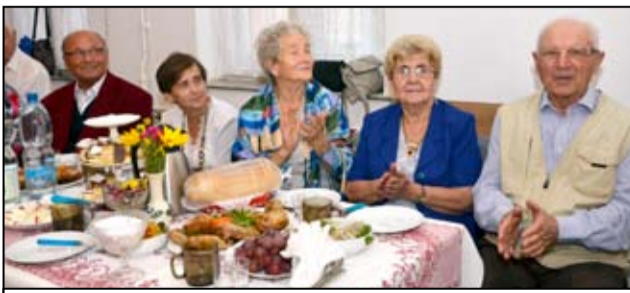
Żarowscy seniorzy pokazują nie tylko, że potrafią dobrze się bawić, ale udowadniają również, że są wciąż młodzi duchem.