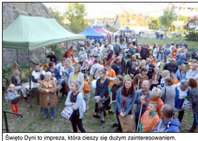
Święto Dyni to impreza, która cieszy się dużym zainteresowaniem.