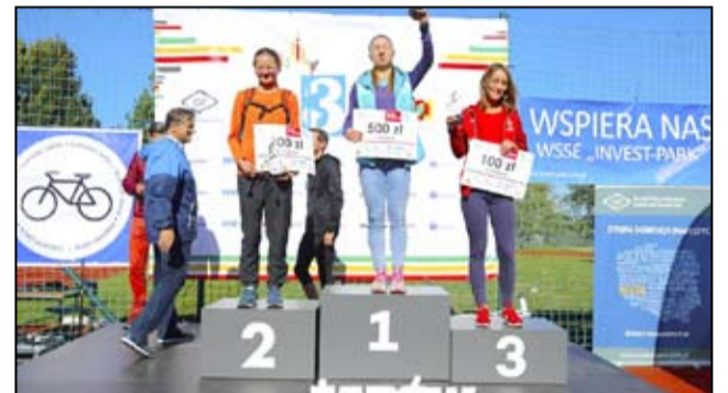
Dekoracja najlepszych pań na dystansie 10 km