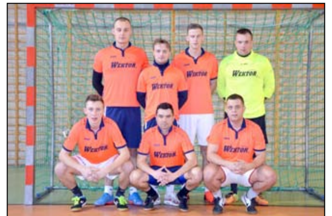
Wętkor Świdnica zwycięzca poprzedniej edycji Electrolux Cup

Wszystkie mecze rozgrywane będą w hali sportowej GCKiS w Żarowie przy ul. Piastowskiej 10A. Start 1. kolejki - 24 listopada. Zakończenie rozgrywek zapla-