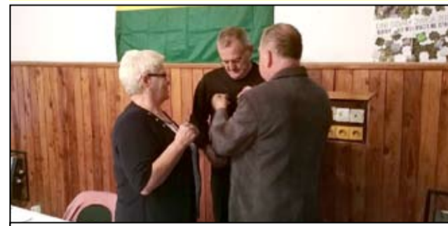
Podczas zebrania działkowcy z Żarowa zostali odznaczeni brązową odznaką „Zasłużonego Działkowca”.