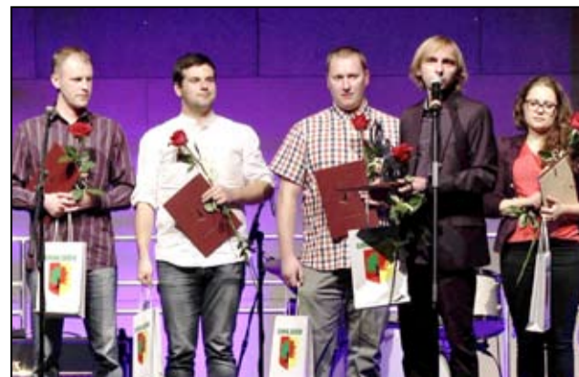
Na zdjęciu nagrodzeni muzycy z Żarowskiej Orkiestry Dętej.