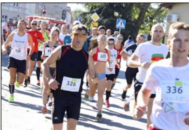
Łącznie do mety dotarło 290 biegaczy