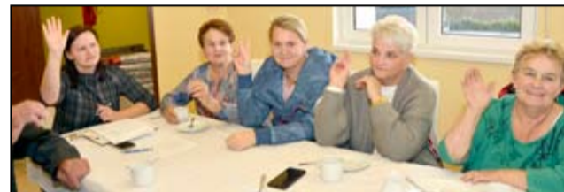
Nikt nie zna potrzeb swoich wsi, jak ich mieszkańcy. Dzięki zgodnym decyzjom corocznie na terenach wiejskich w naszej gminie realizowane są zadania z funduszu sołeckiego.

Realizacja zadań, jakie mieszkańcy wsi wyznaczyli w ramach funduszu sołeckiego rozpocznie się w przyszłym roku. W każdej miejscowości mieszkańcy postawili na realizację zadań inwestycyjnych, co pozwoli