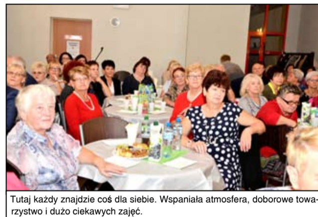
Tutaj każdy znajdzie coś dla siebie. Wspaniała atmosfera, doborowe towarzystwo i dużo ciekawych zajęć.

Uniwersytet jest prężnie działającą grupą, która oprócz regularnych zajęć angażuje się również w wiele imprez kulturalnych oraz sportowych. Wspólnym spotkaniem słuchaczy zawsze towarzyszy