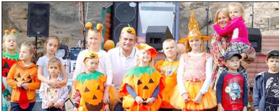
Podczas 3. Święta Dyni najmłodszy, ale również dorośli rywalizowali w konkursie na najlepsze dyniowe przebranie.

Prawdziwa Żłota Polska Jesień w kolorach pomarańcza zawładnęła Wierzbną w minioną sobotę. W ciepłych promieniach październikowego słońca ogrzewały się tłumy przybyłych na tą imprezę. Dorośli delektowali się dyniowymi smakołykami przy muzyce zespołu „Ślad”. Było smacznie, radośnie i bardzo kolorowo.