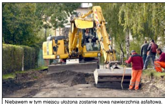
Niebawem w tym miejscu ułożona zostanie nowa nawierzchnia asfaltowa.