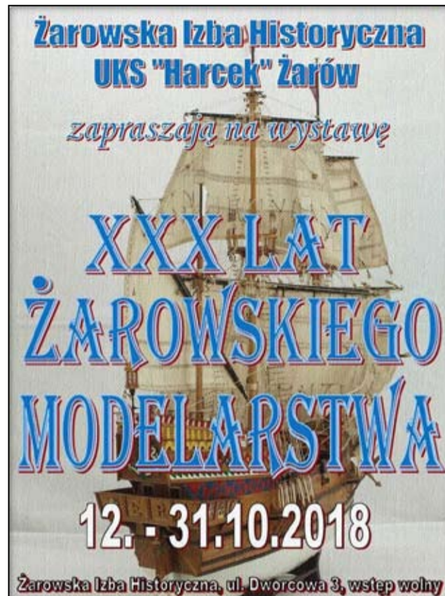
Żarowska Izba Historyczna, ul. Dworcowa 3, wstęp wolny

Wspaniałe osiągnięcia modelarzy z Żarowa podziwiać będzie można na wystawie w Żarowskiej Izbie Historycznej już od 12 października 2018 roku. Żarowska Izba Historyczna oraz Klub UKS „Harcek” Żarów serdecznie zapraszają na wystawę „XXX lat Żarowskiego Modelarstwa”. Wystawa dostępna bezpłatnie dla wszystkich zainteresowanych w Żarowskiej Izbie Historycznej przy ul. Dworcowej 3 w dniach od 12 do 31 października 2018r. ZAPRASZAMY !!!