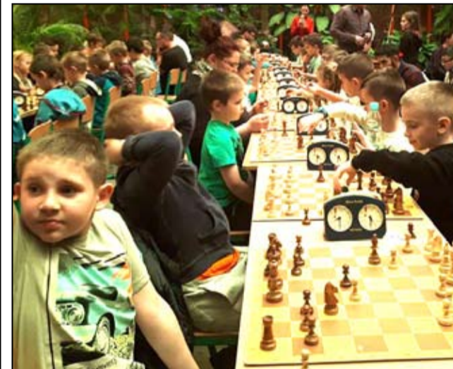
Najliczniejszą grupę szachistów stanowili najmłodsi adepci tej dyscypliny sportu, fot. FB/gonieczarow.

Tradycyjnie biblioteka oraz Uniwersytet Trzeciego Wieku w Żarowie zorganizowali wieczór andrzejkowy dla seniorów.