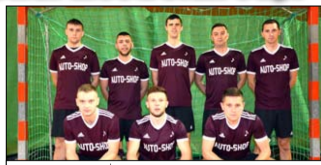
Drużyna AUTO-SHOP Żarów

Tegoroczna edycja podzielona jest na dwie ligi. Wśród drużyn występujących w I Lidze Electrolux Cup, komplet punktów zachował tylko Wektor Świdnica, który broni mistrzowskiego tytułu. Jedno zwycięstwo na koncie posiadają piłkarze Cannabis, AUTO-SHOP Żarów, KKZ Zaskoczeni Żarów oraz Perłaże Rakserwis. Wciąż