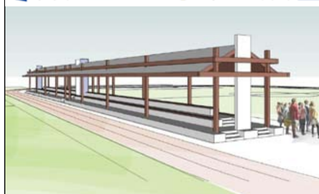
Tak na wizualizacji wyglądają nowe trybuny wraz zadaszeniem.

Przebudowa stadionu sportowego w Żarowie została także wcześniej omówiona z zarządem klubu sportowego „Zjednoczeni Żarów”, dlatego mecze drużyn senior-