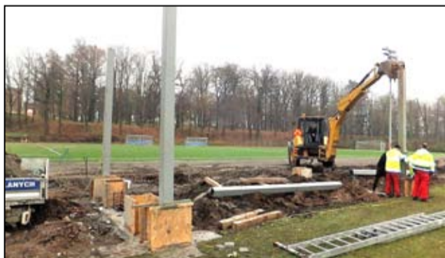
Trwa montaż stalowych słupów stanowiących konstrukcję dachu przy nowych trybunach.