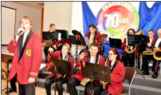
Muzycy z Żarowskiej Orkiestry Dętej to grupa ludzi z pasją, którzy poświęcają swój wolny czas, żeby grać. Koncertują nie tylko na terenie gminy Żarów podczas lokalnych uroczystości, ale także na terenie innych miast i gmin. Wciąż się rozwijają, pracują nad nowym repertuarem, a ich muzyka wzbudza duże zainteresowanie.