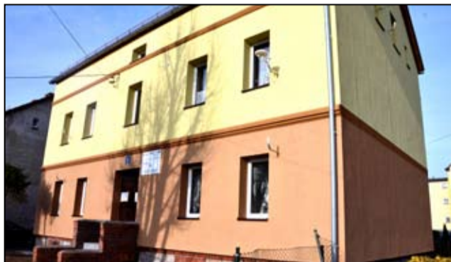
Dzięki zrealizowanym pracom dziś budynek ten stał się kolejną wizytówką naszego miasta.

Zakończył się remont kolejnych budynków na terenie Żarowa. Jak do tej pory, w ramach projektu „Odnowa wielorodzinnych budynków mieszkalnych w ramach rewitalizacji miasta Żarów na lata 2014-2020” remontu doczekały się kamienice przy ul. Zamkowej 5, Armii Krajowej 28-30, Mickiewicza 21 oraz Piastowskiej 2 i 4.