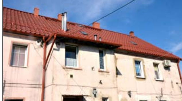
Dach został również wyremontowany na budynku przy ul. Armii Krajowej 28-30 w Żarowie.

Remont budynku przy ul. Mickiewicza 21 kosztował 206.231,77 złotych , a budynku przy ul. Piastowskiej 4 to koszt 51.590,73 złotych . Całkowita wartość projektu, w