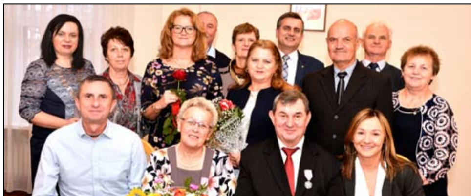
Wspólne zdjęcie jubilatów oraz zaproszonych gości.