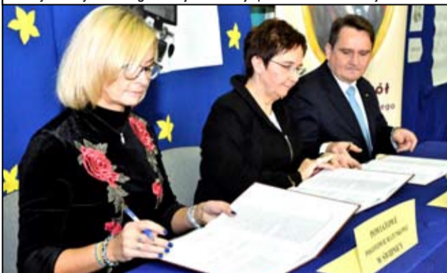
Moment podpisania deklaracji o współpracy z PKP Intercity oraz Pogotowiem Świdnickim.