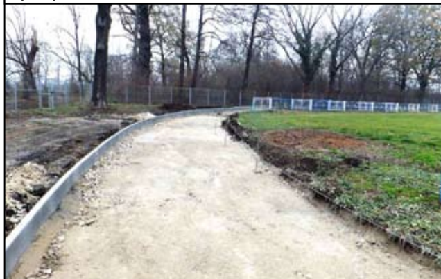
Cały czas trwają także intensywne prace przy budowie nowej bieżni na stadionie.