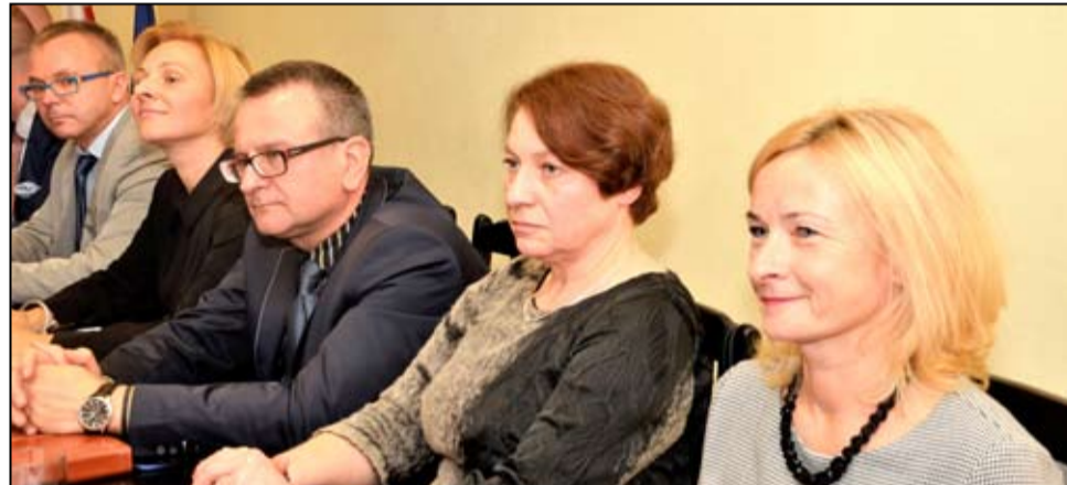
To była pierwsza sesja Rady Miejskiej VIII kadencji.

Jest radną kilku kadencji, pełniła funkcję przewodniczącej Komisji ds. Oświaty i Kultury, dobrze zna pracę w Radzie Miejskiej. To także oddana nauczycielka, od ponad trzydziestu lat pracuje w Szkole Podstawowej im. Jana Brzechwy w Żarowie jako nauczyciel edukacji wczesnoszkolnej. Praca z dziećmi to dla niej powołanie i pasja. Zaangażowana w życie społeczne mieszkańców naszej gminy, inicjatorka wielu przedsięwzięć, współorganizatorka imprez lokalnych i charytatywnych. Współpracuje ze stowarzyszeniami i fundacjami.