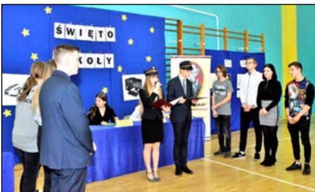
Na zdjęciu uczniowie w trakcie konkursu ze znajomości specyficznego słownictwa kolejowego i informatycznego.

Zespół Szkół w Żarowie realizuje obecnie kilka ciekawych projektów. Są to: „Rynek pracy coraz bliżej – dla uczniów szkół kształcenia zawodowego powiatu świdnickiego”, „Zawodowy Dolny Śląsk”, „Czas na zawodowców” oraz projekt twardego „Wyposażenie w nowoczesny sprzęt i materiały dydaktyczne pracowni i warsztatów zawodowych”.