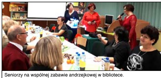
Seniorzy na wspólnej zabawie andrzejkowej w bibliotece.

Impreza została zorganizowana wspólnie ze słuchaczami Uniwersytetu Trzeciego Wieku, a sprzęt użyczyło na potrzeby seniorów Gminne Centrum Kultury i Sportu w Żarowie.