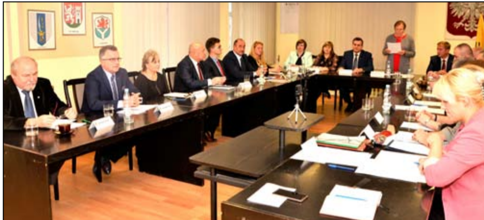
Zgodnie z nowymi przepisami kadencja Rady Miejskiej trwać będzie pięć lat.

Niespełna miesiąc po wyborach samorządowych, po raz pierwszy w nowym składzie żarowscy radni spotkali się na pierwszej sesji Rady Miejskiej w Żarowie. Odebrali od przewodniczącej Miejskiej Komisji Wyborczej zaświadczenia o zdobyciu mandatów, złożyli uroczyste ślubowanie i wybrali spośród swojego grona przewodniczącego i wiceprzewodniczącego Rady Miejskiej. Oficjalnie w czwartek, 22 listopada rozpoczęła się kolejna kadencja Rady Miejskiej, która zgodnie z nowymi przepisami trwać będzie pięć lat – w latach 2018-2023.