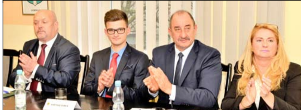
Pierwszą najważniejszą decyzją nowych radnych był wybór przewodniczącego i wiceprzewodniczącego Rady Miejskiej.