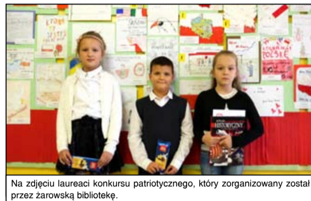
Na zdjęciu laureaci konkursu patriotycznego, który zorganizowany został przez żarowską bibliotekę.