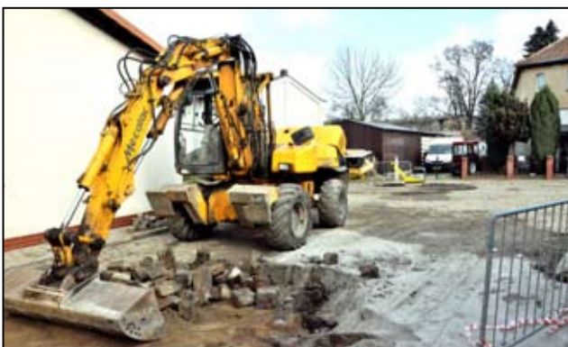
Stara kostka, którą pokryta jest nawierzchnia przy ul. Sportowej nareszcie zostanie zerwana.