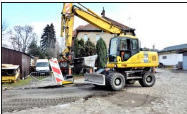
Droga przy ul. Sportowej w Żarowie była w złym stanie technicznym i wymagała kompleksowej przebudowy.