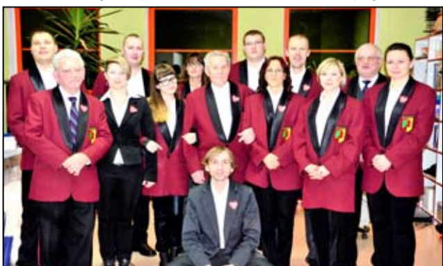
Na zdjęciu muzycy z Żarowskiej Orkiestry Dętej w pełnym składzie.