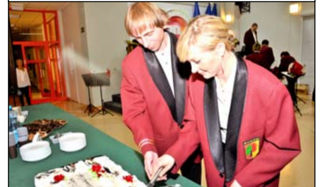
Tego dnia nie mogło zabraknąć również jubileuszowego tortu.