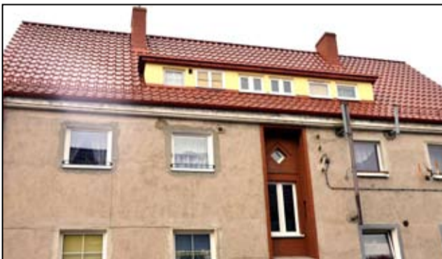
Budynki przy ul. Piastowskiej 2 i 4 zyskały nowe pokrycie dachowe.

z założonym harmonogramem. Efekt końcowy cieszy oko, zachowany został piękny kamienny cokół wraz z cegłą i dziś budynek ten stał się kolejną wizytówką Żarowa. Dużą rolę w tym zasługą władz miasta, którzy dbają o elementy architektury na terenie miasta, co przekłada się na efekt wizualny. Wyremontowanych budynków przybywa, a być może będzie to także dodatkowy impuls dla mieszkańców budynków wspólnot mieszkaniowych, aby pielęgnować swoje miejsca zamieszkania