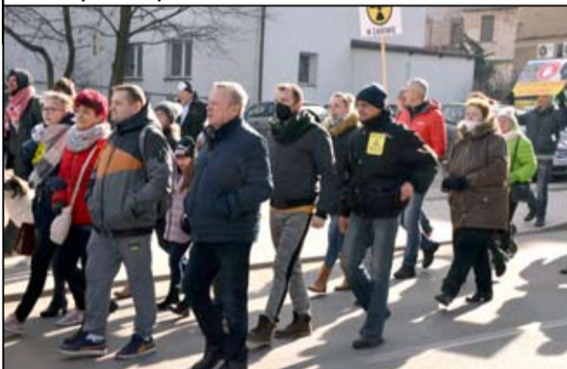
Marsz protestacyjny w naszym mieście był kolejnym ważnym elementem trwającego protestu mieszkańców.