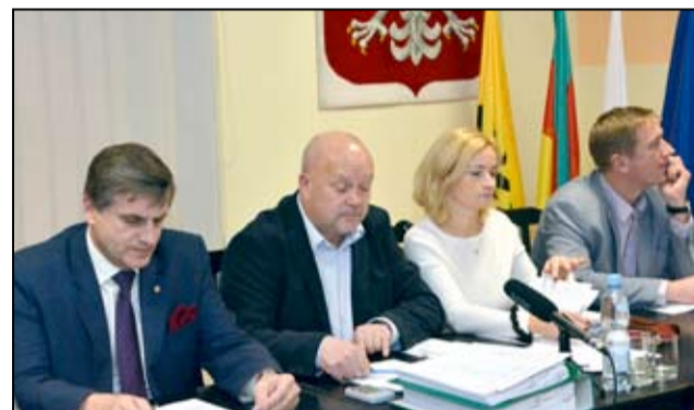
Na sesji Rady Miejskiej 16 stycznia 2019r. radni uchwaliли wysokość oraz warunki udzielania bonifikat.

Zaświadczenie jest dokumentem potwierdzającym przekształcenie prawa do gruntu, więc dopiero wydanie