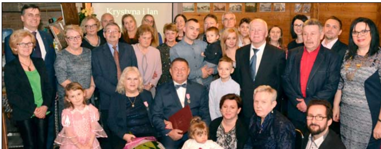
Wspólne zdjęcie jubilatów oraz zaproszonych gości.