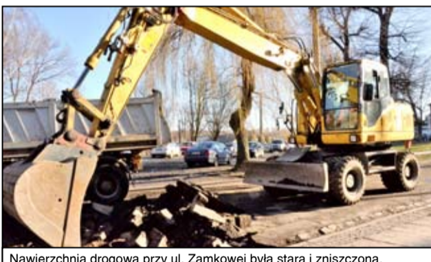
Nawierzchnia drogowa przy ul. Zamkowej była stara i zniszczona.