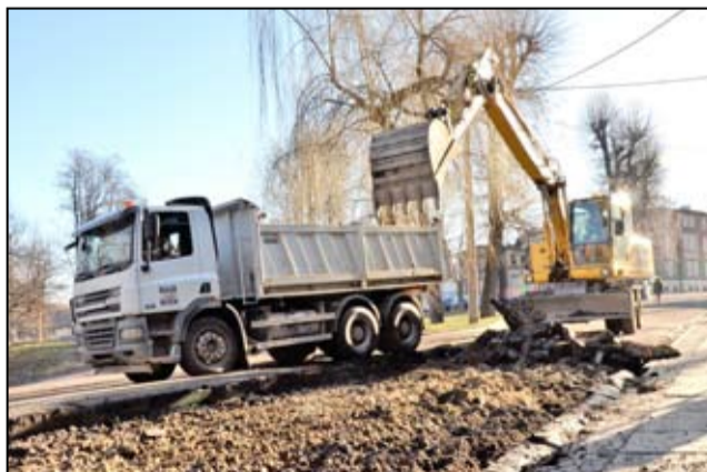
Drogi w tej części miasta zyskają niebawem nowe nawierzchnie asfaltowe.