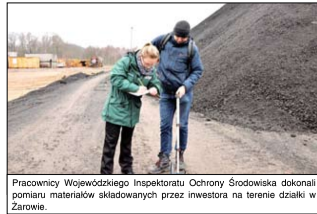
Pracownicy Wojewódzkiego Inspektoratu Ochrony Środowiska dokonali pomiaru materiałów składowanych przez inwestora na terenie działki w Żarowie.