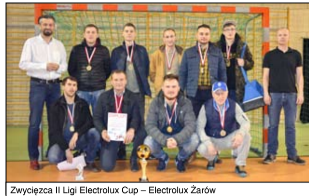
Zwycięzca II Ligi Electrolux Cup – Electrolux Żarów

- Gratuluję wszystkim bez wyjątku. Po wspaniałej walce finał zwycięża Cannabis, wiel-