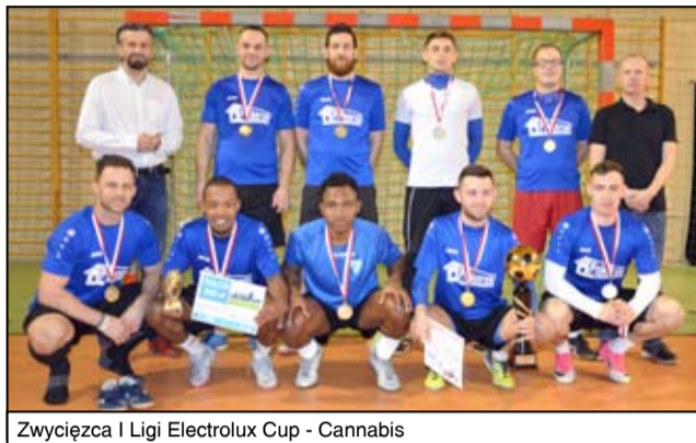
Zwycięzca I Ligi Electrolux Cup - Cannabis

Piłkarze Cannabis zwycięzcami Żarowskiej Ligi Futsal Electrolux Cup. W wielkim finale I Ligi pewnie pokonali ubiegłorocznego triumfatora rozgrywek Wektor Świdnica.