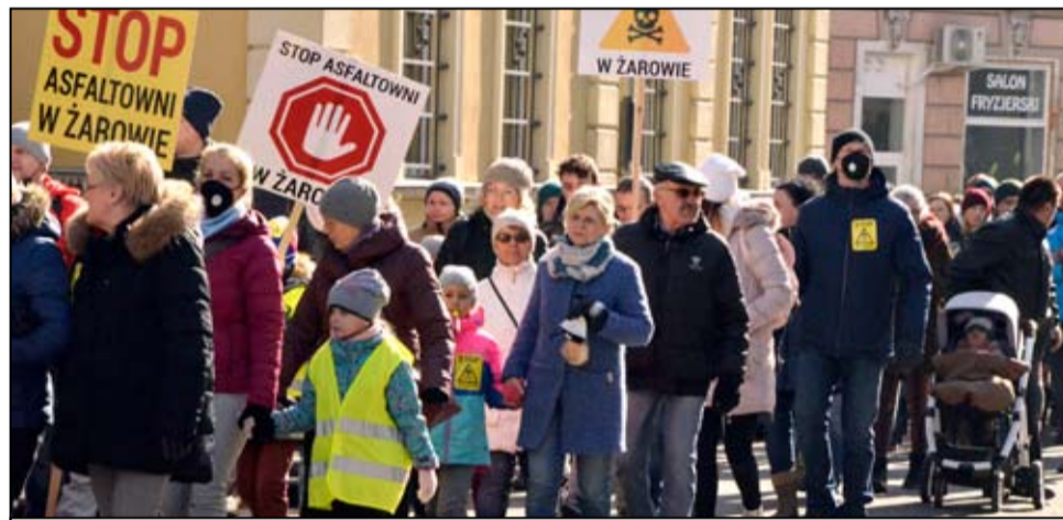
W marszu protestacyjnym zorganizowanym przez Komitet Społeczny Mieszkańców uczestniczyły tłumy.

W marszu protestacyjnym uczestniczyły tłumy mieszkańców. Wszyscy przyszli tutaj w jednym celu, aby pokazać, że są przeciwni realizacji na terenie miasta tej inwestycji. Obawiają się o zdrowie swoje i swoich naj-