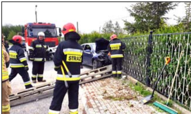
W ostatnich dniach doszło do dwóch kolizji drogowych, a przyczyną było niedostosowanie prędkości do warunków na drodze. Nikt na szczęście nie ucierpiał.

Do drugiego wypadku doprowadził 21-letni kierowca, mieszkaniec Mrowin. Do kolizji doszło w czwartek, 16 maja na zakręcie przy ul. Wojska Polskiego 1 w Mrowinach. Kierowca Opla Astra również nie dostosował prędkości do warunków panujących na drodze. Wypadł na zakręcie z drogi, uszkadzając słup oświetleniowy i ogrodzenie prywatnej posesji. W związku z tym zdarzeniem przez kilka dni mogą wystąpić na tym odcinku problemy