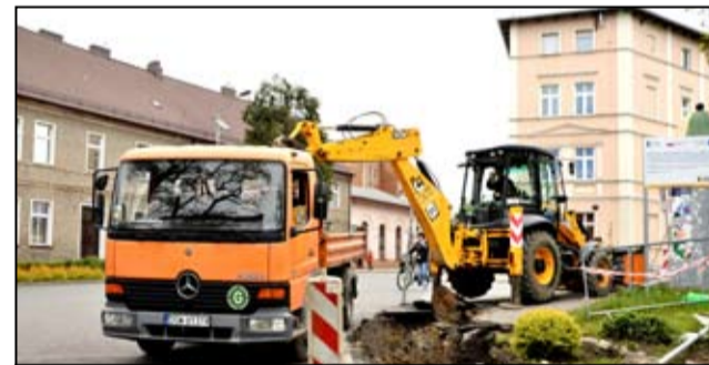
Mieszkańcy ulicy Zamkowej i Sportowej w Żarowie czekali na remont tej części miasta.