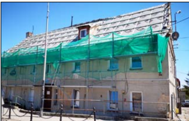
Dach wyremontowany zostanie także w budynku przy ul. Armii Krajowej 12 abc.

Prace remontowe w kolejnych budynkach na terenie naszego miasta wciąż jeszcze trwają. W jednych są wymieniane dachy, przemurowywane kominy, wymieniane wadliwe instalacje, a inne kamienice zyskują nową elewację. Dzięki przeprowadzonym pracom budynki nie straszą już swoim wyglądem. Są estetyczne i