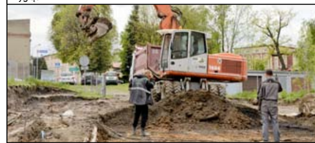
Prace trwają także przy budynku Ochotniczej Straży Pożarnej. Tutaj również zagospodarowany zostanie cały ten teren.