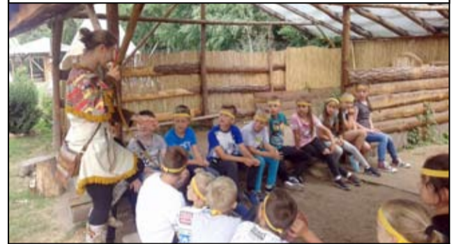
Letnie półkolonie organizowane przez Żarowskie Stowarzyszenie „Edukacja” cieszą się dużym zainteresowaniem dzieci oraz młodzieży.