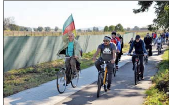
Wycieczki i rajdy rowerowe są organizowane przez stowarzyszenie „Rowerowy Żarów”.