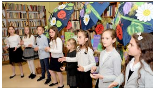
Przed zaproszonymi gośćmi wystąpili uczniowie Szkoły Podstawowej im. Jana Brzechwy w Żarowie.