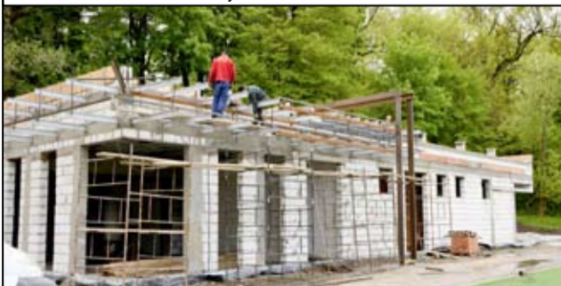
Za kilka miesięcy sportowcy będą mogli użytkować także budynek nowej szatni sportowej.