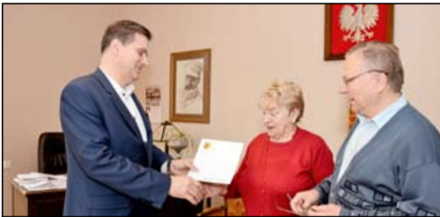
Każdego roku seniorzy z żarowskiego Związku Emerytów Rencistów i Inwalidów otrzymują na swoją działalność wsparcie finansowe.

spotkania oraz imprezy dla naszych mieszkańców, upowszechniając turystykę rowerową. Z kolei Żarowskie Stowarzyszenie „Edukacja” jest organizatorem letniego wypoczynku dla dzieci i młodzieży. Swoim wsparciem obejmuje także mieszkańców gminy Żarów, zajmując się współorganizacją zabiegów rehabilitacyjnych. Prowadzi również świetlicę wsparcia dziennego dla dzieci „Cztery Pory Roku”.