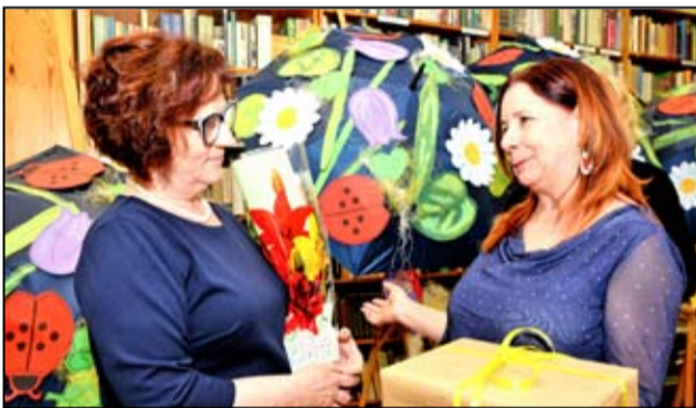
Oprócz jubileuszu 10-lecia nadania imienia pracownicy biblioteki obchodzili także Dzień Bibliotekarza.