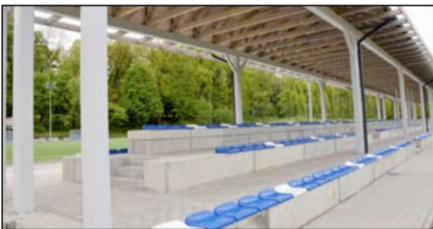
Teraz, również przy niesprzyjających warunkach atmosferycznych będzie można kibicować swoim drużynom.

nia wynosi 3 867 257,09 złotych . Inwestycje realizowane są w ramach dużego projektu unijnego „Rewitalizacja zdegradowanych obszarów – rewitalizacja parku miejskiego wraz z boiskiem sportowym”, którego całkowita wartość wynosi 5 866 510,15 złotych .