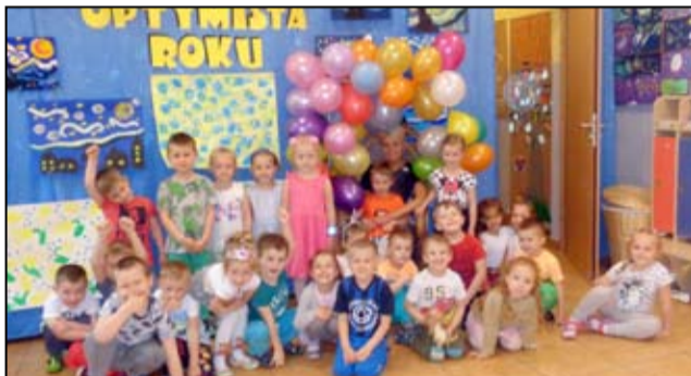
Dzięki zajęciom i wspólnym zabawom przedszkolaki uczą się, jak być prawdziwymi optymistami.

Przedszkolaki poświęcili wiele czasu, aby przygotować się do obchodów tego święta. – Ten szczególny dzień w naszym przedszkolu przepełniony był radością i optymizmem. Dzieci wykonały piękne obrazy Van Gogha „Słoneczniki” oraz „Gwieździstą noc”. Mali artyści poznając życiorys sławnego malarza bardzo poważnie podeszli do malowania, które sprawiło im wielką radość i zadowolenie. W koszulkach białych, niebieskich i żółtych (dominujące kolory na obrazach Van Gogha) dzieci dumnie przeszły przez „optymistyczną bramę” z balonów. Biletem wstępu do wspólnej zabawy był uśmiech każdego przed-