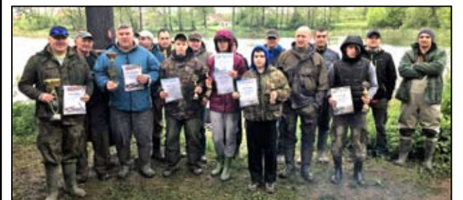
Na zdjęciu uczestnicy wędkarskich zawodów w Imbramowicach.