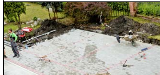
Teren parkingu przy Urzędzie Miejskim w Żarowie powoli zyskuje nowy wygląd.