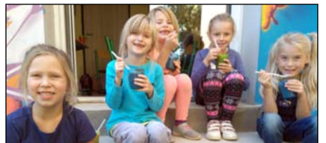
Przedszkolaki ze Szkoły Podstawowej im. Astrid Lindgren w Zastrużu rozwijają swoje zdolności poprzez udział w dodatkowych zajęciach, które oferuje im szkoła.

Dzięki udziałowi szkoły w projekcie dofinansowanym z Regionalnego Programu Operacyjnego Województwa Dolnośląskiego na lata 2014-2020 dzieci mają szansę zdobyć kolejne nowe umiejętności. - Jest to projekt realizowany od września 2018r., w ramach poddziałania 10.1.4 Zapewnienie równego dostępu do wysokiej jakości edukacji przedszkolnej w oddziałach przedszkolnych w naszej szkole. Jego głównym celem jest zmniejszenie nierówności w dostępie do edukacji przedszkolnej i do wysokiej ja-