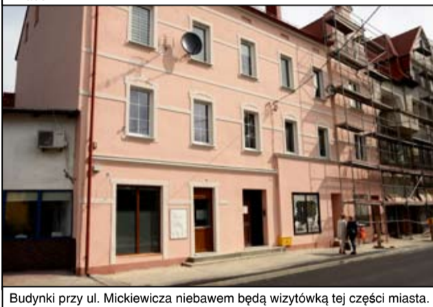
Budynki przy ul. Mickiewicza niebawem będą wizytówką tej części miasta.

schludne. Łącznie w ramach projektu „Odnowa wielorodzinnnych budynków mieszkalnych w ramach rewitalizacji miasta Żarów na lata 2014-2020” wyremontowanych zostanie 27 budynków wspólnot mieszkaniowych i dwa budynki komunalne przy ul. Mickiewicza 21 i