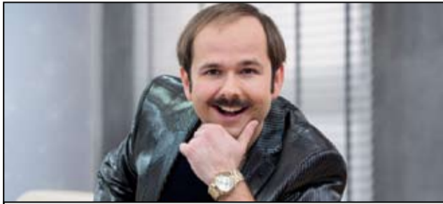
Tegoroczną gwiazdą Dni Żarowa będzie Sławomir