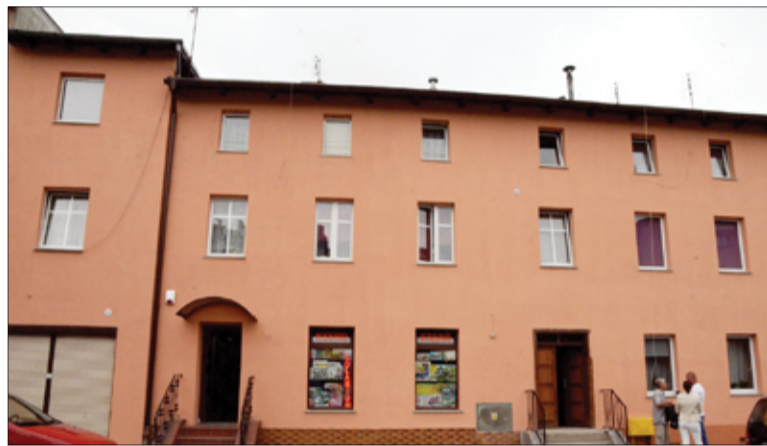
W ramach programu rewitalizacji wyremontowana została także kamienica przy ul. Armii Krajowej 50 w Żarowie.

ków na terenie Żarowa jest jeszcze bardzo dużo. Jednak dzięki realizacji programu rewitalizacji miasta kolejne budynki nie straszą