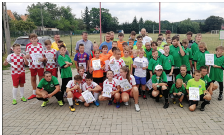
Młodzi zawodnicy rywalizowali w Mrowinach o puchar Burmistrza Miasta Żarów.