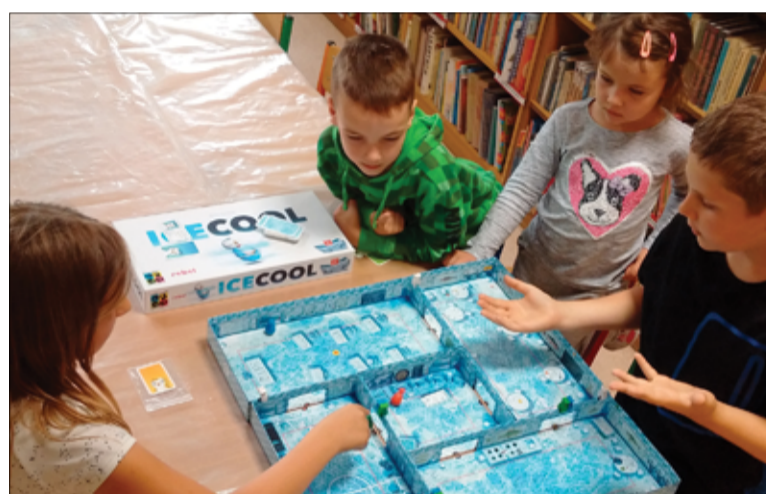
Wakacyjne zajęcia w bibliotece