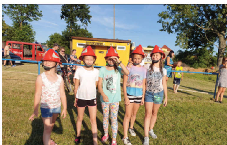
Piknik „Powitanie lata” w Kalnie