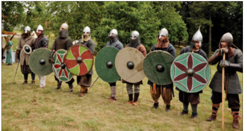
Imprezę urozmaicały pokazy walk rycerskich.

W czasie trwania jarmarku dla spragnionych i głodnych przygotowano słowiańską kuchnię w któ-