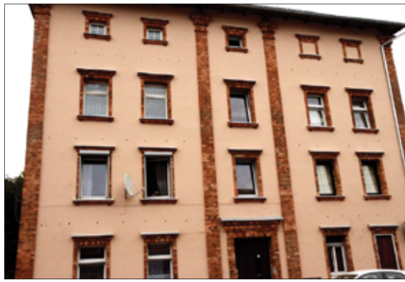
Budynek przy ul. Armii Krajowej 45 w Żarowie przed remontem (foto z lewej) i po remoncie (foto z prawej).

Dzięki realizowanym pracom budynki w Żarowie nie straszą już swoim wyglądem. W ramach realizowanego przez Gminę Żarów programu „Odnowa wielorodzinnych budynków mieszkalnych w ramach rewitalizacji miasta Żarów na lata 2014-2020” wyremontowanych zostanie 27 budynków wspólnot mieszkaniowych oraz 2 budynki komunalne. Większość z tych prac została już zrealizowana i budynki po remoncie zostały przekazane do użytku mieszkańców.