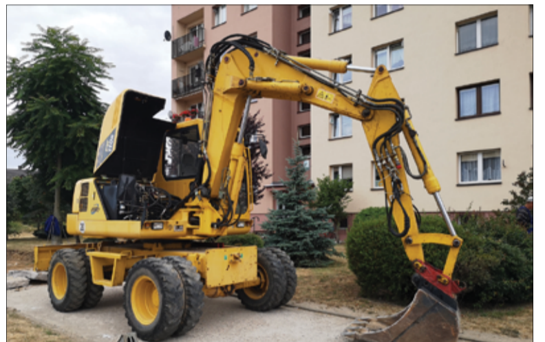
Przy ul. Krzywoustego w Żarowie chodnik wymagał pilnego remontu.

Budowa chodników jest kontynuowana także na terenie wsi. Nowe chodniki w Mrowinach, Wierzbnej oraz Zastruzu zostały już oddane do użytku mieszkańców. Kilka dni temu zakończył się remont