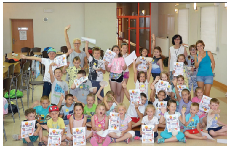
Letnie warsztaty w GCKiS

Jedną z wakacyjnych atrakcji przygotowanych