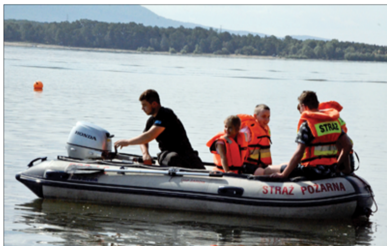
Letnie pływanie w Borzogniewie

Gminne Centrum Kultury i Sportu oraz biblioteka w Żarowie zapraszają na wakacyjne zajęcia. Kolejne letnie warsztaty w GCKiS odbędą się w dniach 29.07 – 02.08.2019r. Regulamin oraz karta zgłoszeniowa dostępne są na stronie internetowej Gminnego Centrum Kultury i Sportu ( http://www.centrum.zarow.pl/ ). Zapisy w sekretariacie GCKiS (8.00 – 16.00) lub pod nr tel. 74 85 80 753. Od poniedziałku do piątku, w godz. 10.00-13.00 odbywają się także wakacyjne zajęcia w Bibliotece im. ks Jana Twardowskiego w Żarowie. W programie warsztaty, zajęcia plastyczne, konkursy muzyczne, seanse filmowe i wiele innych atrakcji. Zapraszamy wszystkie dzieci.