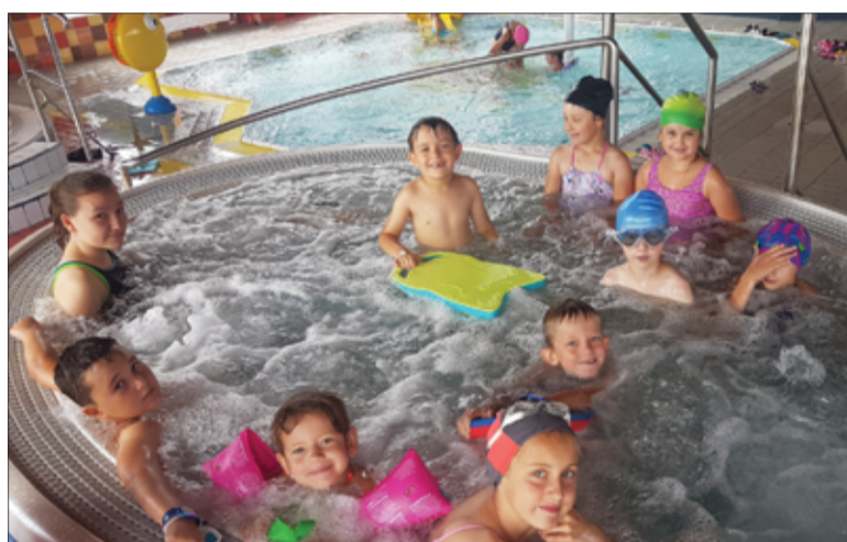
Półkolonie w Zastrużu