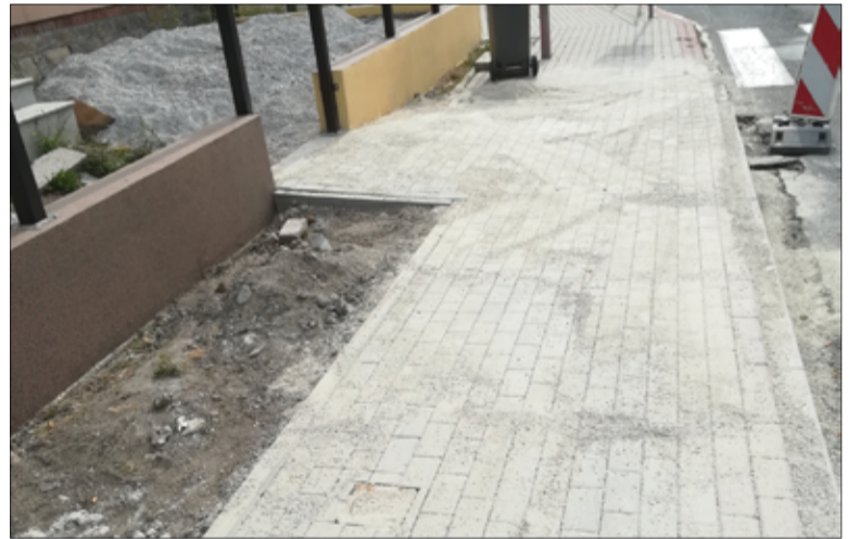
Do użytku mieszkańców oddane zostały chodniki przy ul. Żarowskiej oraz Mostowej w Imbramowicach.

chodnika przy ul. Żarowskiej oraz Mostowej w Imbramowicach, a w następnej kolejności nowe ciągi piesze powstaną również w Pożarzysku, Bukowie, Mielęcinie oraz Łażanach. Budowa chodników w tych miejscowościach