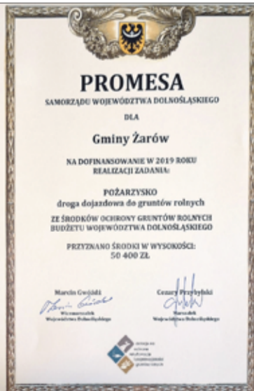
Drogi do gruntów rolnych w Pożarzysku oraz Gołaszycach zostaną wyremontowane.

dróg dojazdowych do gruntów rolnych trafiają do gminy Żarów