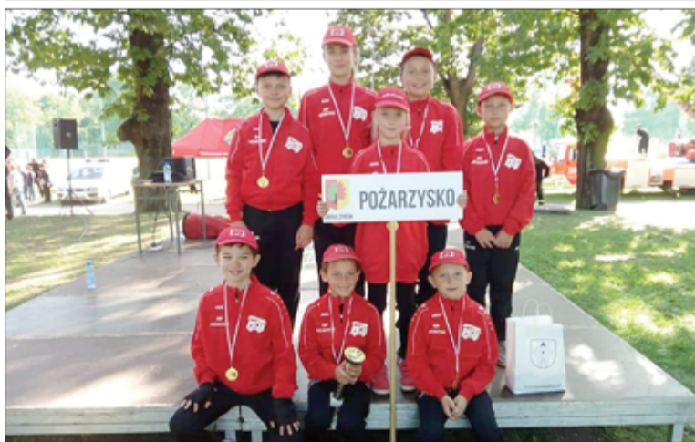
Młodzi strażacy z Pożarzyska to drużyna na medal.

Młodzieżowa Drużyna Pożarnicza z Pożarzyska znakomicie spisała się na Powiatowych Zawodach Sportowo-Pożarniczych, które rozegrane zostały w sobotę, 21 września na terenie Ośrodka Sportu i Rekreacji w Świdnicy.