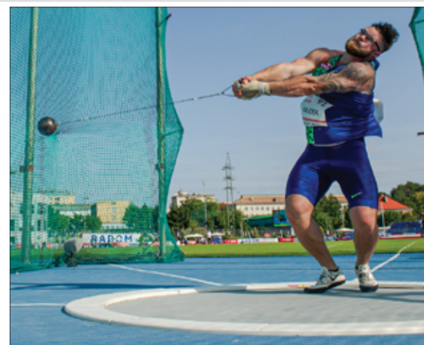
Paweł Fajdek po raz czwarty może zostać Mistrzem Świata.

– Niech sobie gonią. Poza tym dalekie rzuty trzeba oddawać na zawodach ze wszystkimi, a nie samemu. Hiszpan rzeczywiście wyglą-