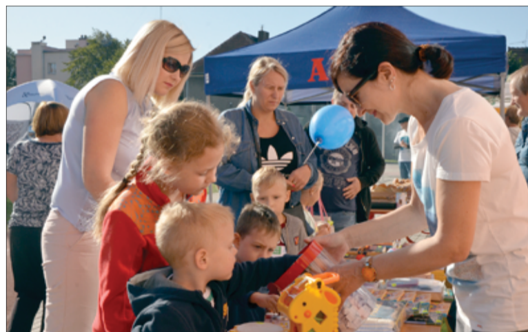
Na mieszkańców czekała także loteria fantowa, do której ustawiała się długa kolejka.