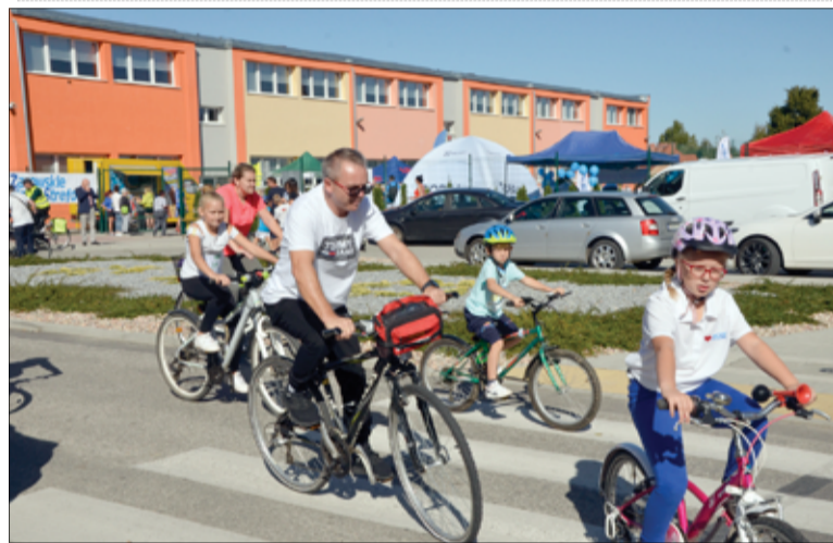
Ulicami miasta i gminy przejechał rajd rowerowy. Wszystko w szczytnym celu, aby wykręcić kilometry dobra dla potrzebujących dzieci.