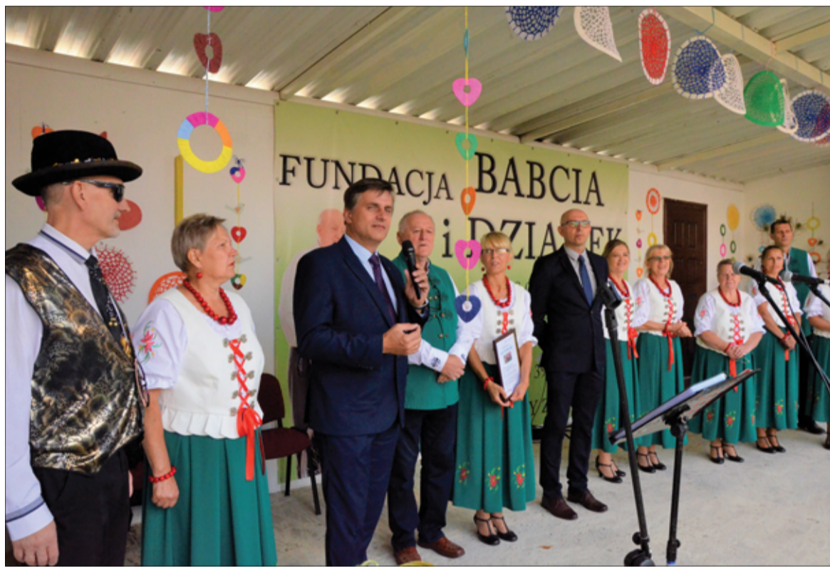
Założony w 2014 roku zespół Krukowanie w tym roku świętuje 5-lecie swojej działalności.