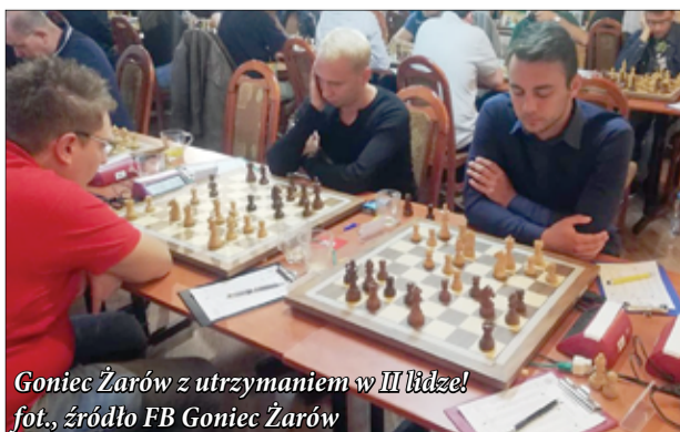
Goniec Żarów z utrzymaniem w III lidze!