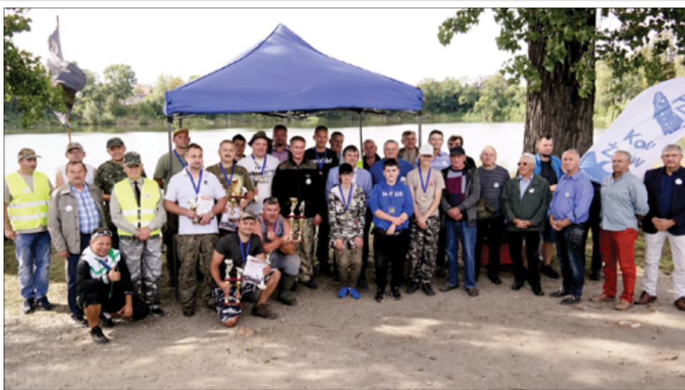
Koło PZW Żarów funkcjonuje już 40 lat. To piękny i wspólny jubileusz.

– Z okazji 40-lecia Polskiego Związku Wędkarskiego Koło w Żarowie składam na ręce całego Zarządu oraz członków Koła wyrazy uznania oraz serdeczne gratulacje. Jestem dumny, że stanowiące grono ludzi podtrzymujących tradycje wędkarstwa. Życzę rado-