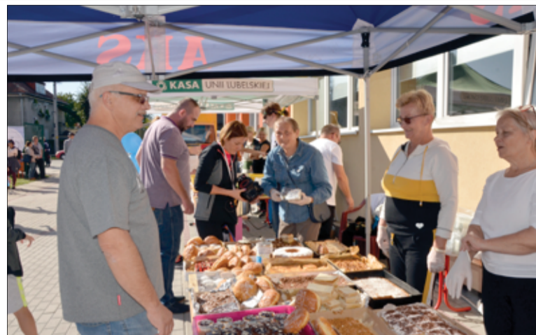
Z pomocą dla najmłodszych przyszli także nasi radni Rady Miejskiej, pomagając przy stanowiskach z kielbaskami, watą cukrową, popcornem oraz ciastami i innymi smakołykami.