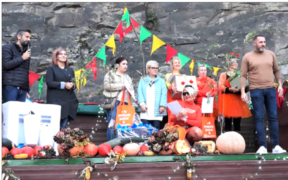
Wspólne zdjęcie nagrodzonych wraz z organizatorami Święta Dyni.