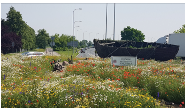
Łąka kwietna w Grudziądzu

go lub tworząc konto na stronie. Konsultacje przeprowadzane są do 31 października na nowej platformie, która powstała w ramach projektu e-urząd