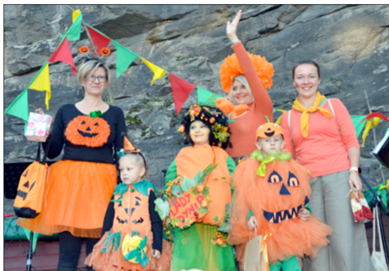
Jak zawsze dopisali nasi mieszkańcy, ci młodzi i ci starsi, przebierając się w najbardziej pomarańczowy i pomysłowy strój.

– Dziękujemy naszym sponsorom: Electrolux, Smart Work Sp z o. o., dekoria.pl, Leroy Merlin oraz AMS Świdnica. Przypominamy również, że wydarzenie zostało sfinansowane z programu Tesco „Decydujesz, Pomagamy”. Podziękowania składamy także wszystkim, którzy