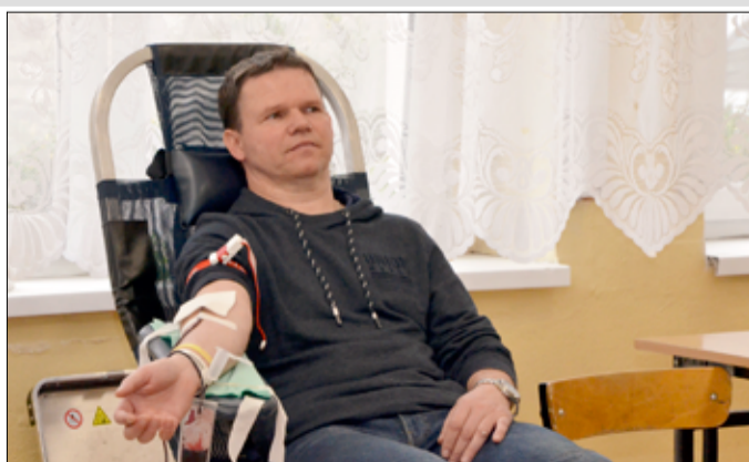
Mieszkańcy naszej gminy chętnie biorą udział w akcjach organizowanych przez żarowski Klub Honorowych Dawców Krwi.

Ostatnia zbiórka krwi w tym roku zaplanowana została na 17 grudnia. Będzie to świąteczna akcja. Krew będzie można oddawać w żarowskim Zespole Szkół.