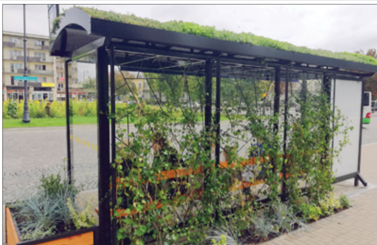
Zielony przystanek w Białymstoku

Warunkiem uczestnictwa w konsultacjach jest zalogowanie się do panelu. Można to zrobić na trzy sposoby: korzystając z profilu na FB, Profilu Zaufane-