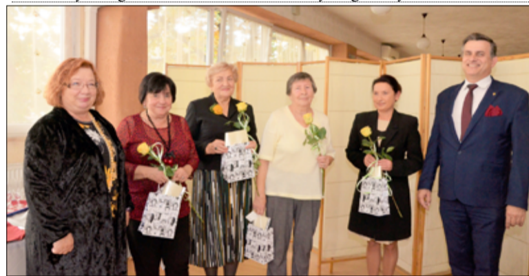
Nauczyciele emeryci (na zdjęciu) w tym roku obchodzą okrągłą rocznicę swoich urodzin.