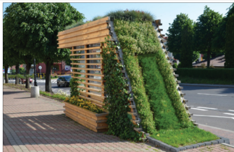
Zielony przystanek w Siemiatyczach