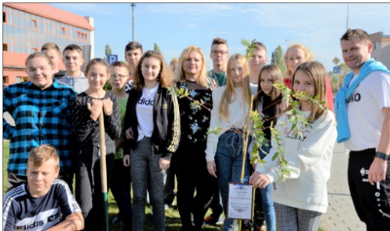
We wspólnej akcji sadzenia drzewek uczestniczyli także uczniowie SP w Żarowie.

w Wierzbnej przez przedstawicieli Electroluxu, Urzędu Miejskiego w Żarowie, radnych Rady Miejskiej, strażaków Ochotniczej Straży Pożarnej, a także mieszkańców wsi. Razem z pracownikami żarowskiej firmy Electrolux Poland we