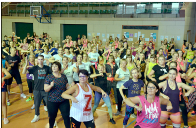
Charytatywny Maraton Zumbi cieszył się dużym zainteresowaniem nie tylko osób, które kochają sport i fitness. Zumba to bowiem nie tylko spalane kalorie, ale i niesamowita energia, która dodaje sił do działania.