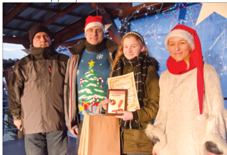
Nagrody podczas Miasteczka Świętego Mikołaja otrzymali uczestnicy konkursu „Co ty wiesz o Żarowie?”.

żarowskiego chóru Senyor Ricci i Orkiestry Nienadętej, Miejskiej Orkiestry Dętej oraz chóru Cantate Domino. Nie zawiódł także Święty Mikołaj, który choć w tym gorącym przedświątecznym czasie jest bardzo zapracowany, przybył na Miasteczko do Żarowa i obdarował dzieci słodkościami i smakołykami.