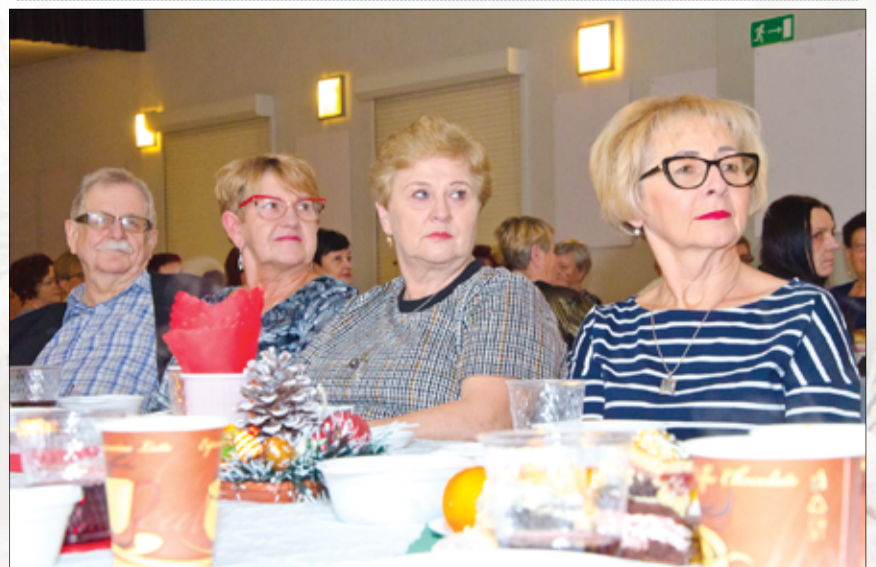
Na stołach nie zabrakło świątecznych smakołyków, a dla wszystkich przygrywał chór Senior-Rici.