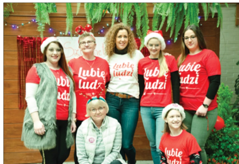
W „Szlachetnej Paczce” nikt nie działa sam. Tworzy ją zespół ludzi, którzy mogą na siebie liczyć i wzajemnie się inspirować.