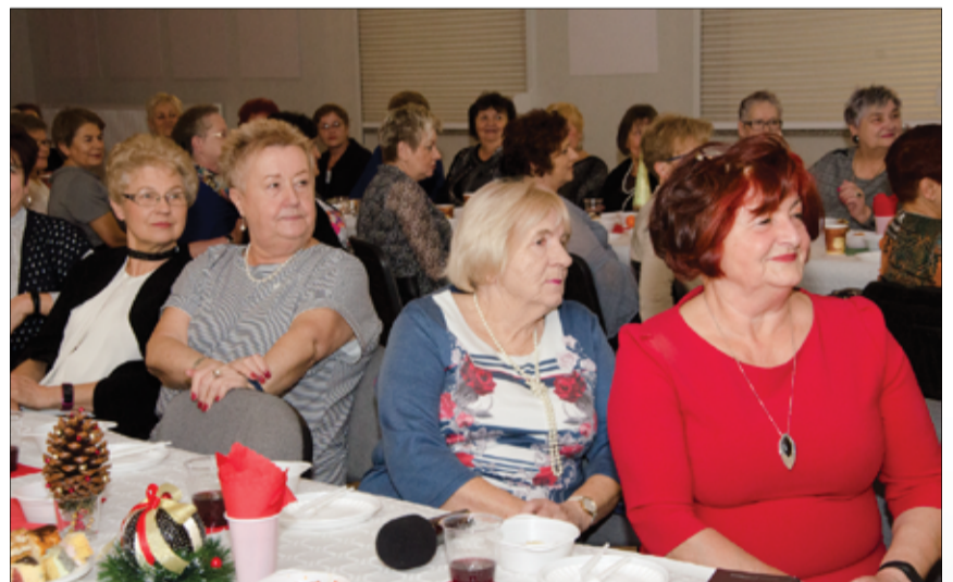
Spotkanie oplatkowe studentów żarowskiego Uniwersytetu Trzeciego Wieku, jak co roku zgromadziło liczne grono sympatyków, przyjaciół i zaproszonych gości.