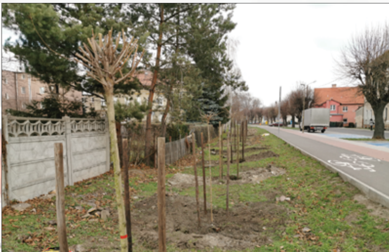
Kilka dni temu nowe drzewa posadzone zostały przy ul. Krasińskiego oraz Armii Krajowej w Żarowie.

jowej na wyjeździe w kierunku Bożanowa. Nowe drzewa i rośliny upiększają nasze miasto i gminę.