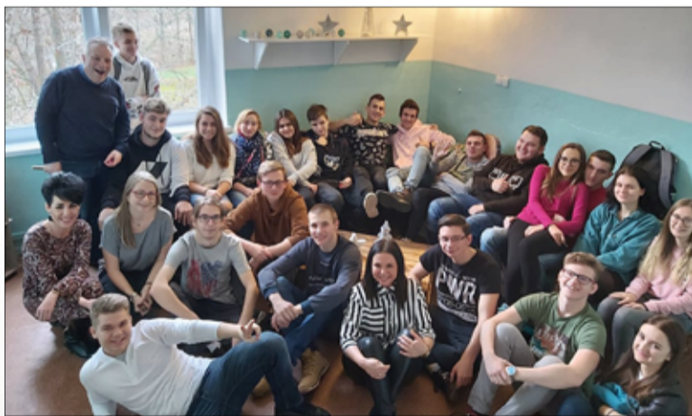
Wspólne zdjęcie uczniów wraz z nauczycielami w klubie uczniowskim „Tropic”.

rodzice uczniów naszej szkoły pomogli znaleźć firmę, która po bardzo niskich kosztach sprzedała nam nowe okno, a obróbką końcową zajął się rodzic naszego kolegi. Jedną z mam zaoferowała i uszyła pokrycia na materace. Ze środków, które otrzymaliśmy jako laureaci konkursu dokonywaliśmy szeregu zakupów, które miały pozwolić na samodzielne wykonanie drobnych prac remontowo-budowlanych w pomieszczeniu oraz udekorowanie naszego klubu.