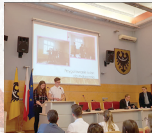
Za udział w konkursie uczniowie otrzymali środki finansowe na wyposażenie nowego klubu oraz certyfikaty.