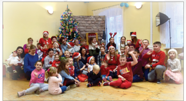
Wspólne zdjęcie uczestników mikołajkowej zabawy w Imbramowicach.

– Zabawa była naprawdę udana. Dzieci wysłuchały krótkiego opowiadania o Św. Mikołaju, ubierały choinkę, przyozdabiając ją łańcuchami i bombkami. Nie zabrakło także tańców, oczywiście w świątecznej atmosferze. Były konkursy: jedzenie pierniczek zawieszonych na nitce, zgadywanki i kalambury zimowe, taniec z czapką mikołajkową, zabawy w kole polegające na naśladowaniu ruchów prowadzącego oraz zabawy z chustą animacyjną i kulkami. Sporą uwagą dzieci skupił teatrzyk cieni, w którym Panie Mikołajki pokazywały odpowiedzi udzielane przez maluchów do jednego z konkursów. Za udział w nich dzieci otrzymały wspaniałe nagrody. Podczas zabawy można było również posilić się słodkim i owocowym poczęstunkiem.