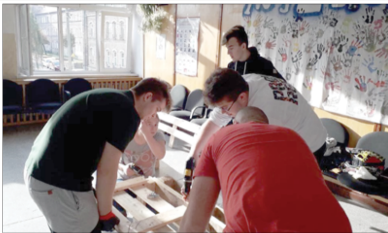
Uczniowie samodzielnie pracowali nad stworzeniem w szkole klubu uczniowskiego.

– Nie byliśmy pewni, że zostaniemy laureatami konkursu, ale stwierdziliśmy, że warto spróbować i powalczyć. Kiedy otrzymaliśmy informację, że udało nam się zostać laureatami konkursu, wówczas jakbyśmy dostali skrzydeł. Kolejne etapy tworzenia klubu okazały się nieco trudniejsze niż udział w konkursie. Najpierw rozmowa z nauczycielami i rodzicami, podczas której poprosiliśmy o możliwie wsparcie ze strony grona pedagogicznego i rodziców. Kolejnym etapem było spotkanie z Burmistrzem Miasta oraz rozmowa z przedstawicielem Starostwa Powiatowego ze Świdnicy w celu uzyskania środków finansowych na wymianę okna w pomieszczeniu powstania klubu, które było niezbędnym elementem do jego powstania. Spotkanie okazało się owocne i udało się nam otrzymać pieniądze na zakup i wymianę okna. Jedną z nauczycielek zaproponowała zorganizowanie palet, z których stworzyliśmy meble do klubu,