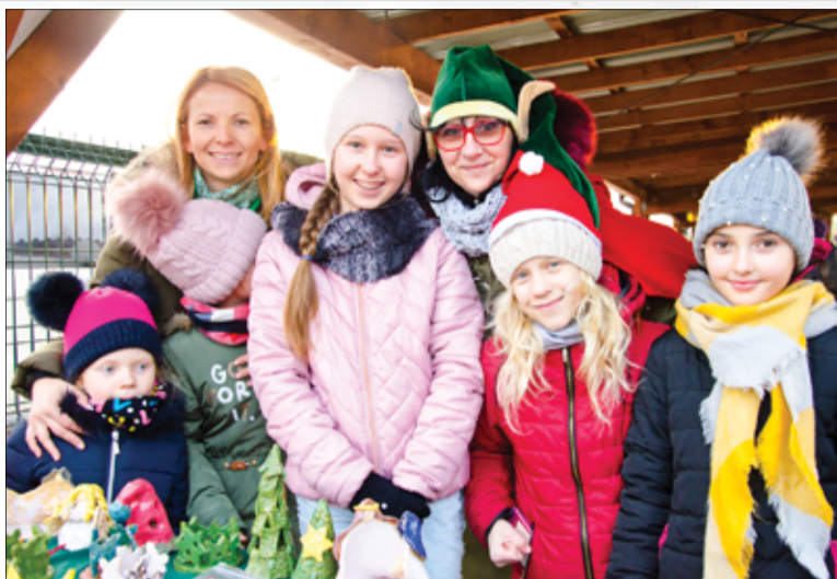
Swoje prace zaprezentowały dzieci z pracowni ceramicznej funkcjonującej przy GCKiS w Żarowie.

W świąteczny nastrój wszystkich uczestników wprowadziły również występy artystyczne Kids Dance oraz kolędy w wykonaniu