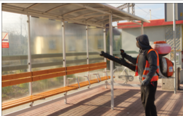
Pracownicy Spółdzielni Socjalnej ubrani w kombinezony ochronne oczyszczają przystanki autobusowe.