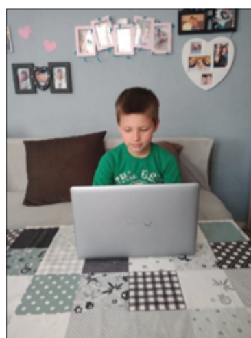
Dzięki sprzętowi uczniowie mogą spokojnie kontynuować naukę.

nych przez Fundację Impact od 24 gmin w całej Polsce (w tym tych najbardziej potrzebujących) wynika, że nadal brakuje ok. 700 komputerów dla dzieci do nauki online. Brak komputera z dostępem do Internetu jest barierą nie pozwalającą na uczestnictwo w zajęciach e-learningowych przygotowywanych przez szkoły. Problem wy-