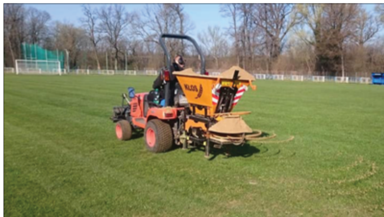
Na stadionie trwają prace pielęgnacyjne, tak aby nawierzchnia boiska była w jak najlepszym stanie.