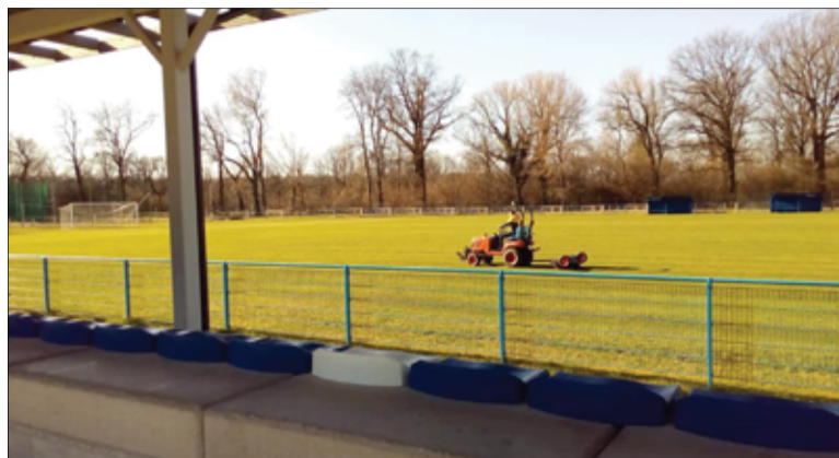
Nie wiadomo, kiedy piłkarze wrócą na stadion. Ważne, że wspólnie z gminą Żarów dbają o sportowy obiekt.