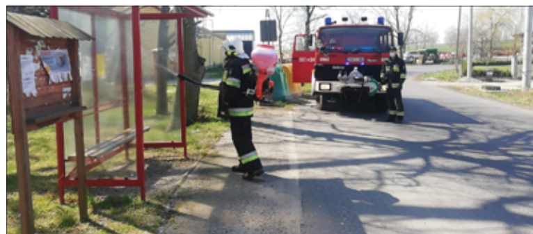
W obecnym czasie zagrożenia koronawirusem, w sposób szczególnie pamiętamy o tego typu miejscach. Takie działania mają pomóc w zahamowaniu rozprzestrzeniania się koronawirusa. Wzmocniona akcja trwa do odwołania.