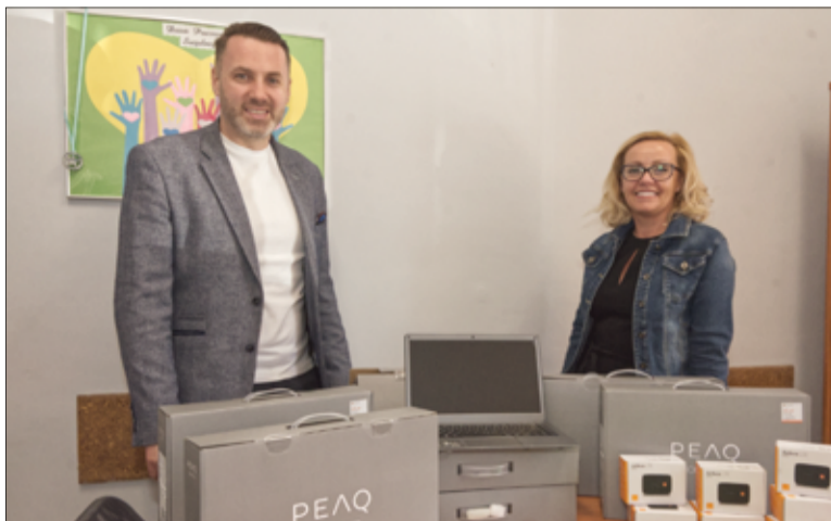
Zakupiony przez Fundację Impact sprzęt komputerowy trafił już do uczniów szkół funkcjonujących na terenie gminy Żarów.

Fundacja Impact w ramach akcji #KomputerDlaUcznia przekazała komputery wraz dostępem do Internetu, aby wesprzeć najbardziej potrzebujące dzieci w gminie Żarów.