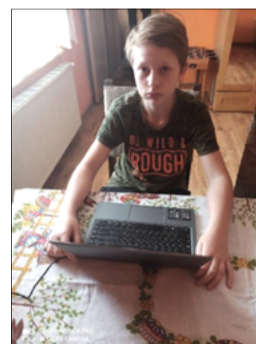
Nie wiadomo jeszcze, jak długo uczniowie będą uczyć się zdalnie. Dlatego ważne, aby każdy uczeń mógł korzystać z profesjonalnego sprzętu.

nych przez Fundację Impact od 24 gmin w całej Polsce (w tym tych najbardziej potrzebujących) wynika, że nadal brakuje ok. 700 komputerów dla dzieci do nauki online. Brak komputera z dostępem do Internetu jest barierą nie pozwalającą na uczestnictwo w zajęciach e-learningowych przygotowywanych przez szkoły. Problem wy-