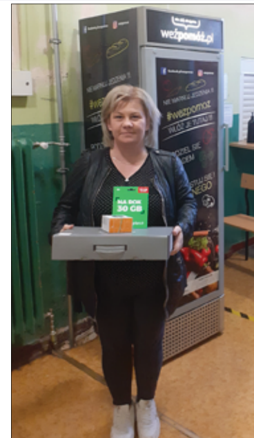
W imieniu swoich pociech nowy sprzęt komputerowy odebrali rodzice i opiekunowie.