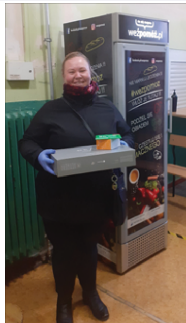
Nowe komputery to dla dzieci duża pomoc w nauce online.

tystycznego wynika, że w 2019r. 83,1% gospodarstw domowych posiadało w domu przynajmniej jeden komputer. Wskaźnik ten z roku na rok systematycznie zwiększa się, jednak w coraz wolniejszym tempie. W porównaniu z rokiem 2018 wzrósł on o 0,4%. Oznacza to, że nadal 17 proc. takiego komputera nie posiada. Jednocześnie z danych uzyska-