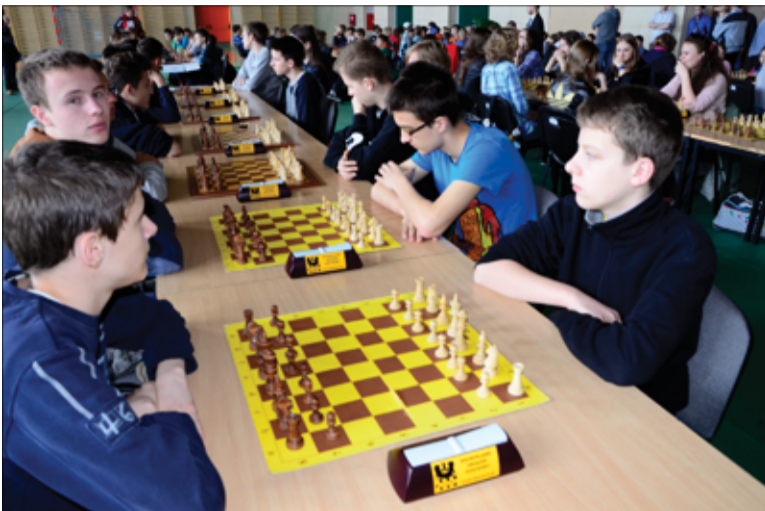
KS Goniec Żarów otrzymał wsparcie finansowe z Ministerstwa Sportu.

Kilka dni temu na stronie internetowej Ministerstwa Sportu zostały opublikowane oficjalne wyniki Rządowego Programu „Klub”.