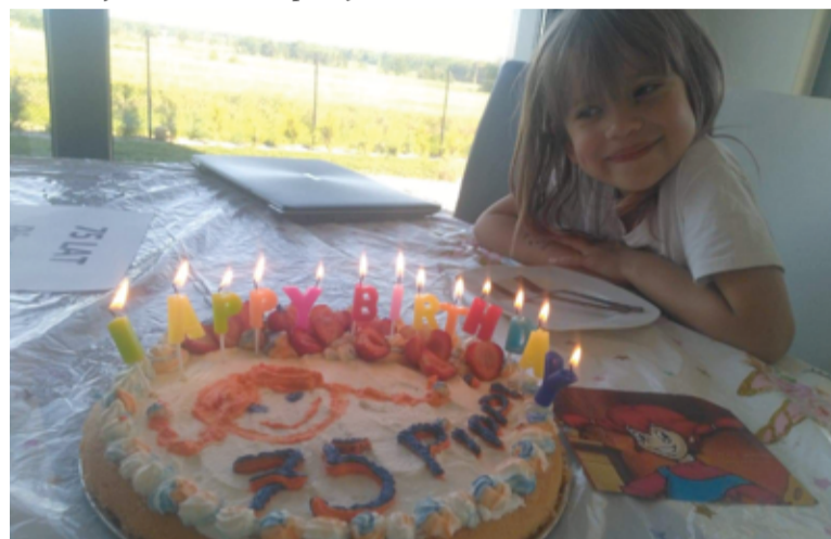
W tym roku, w niecodzienny sposób, urodziny patronki szkoły świętowała SP Zastruże.