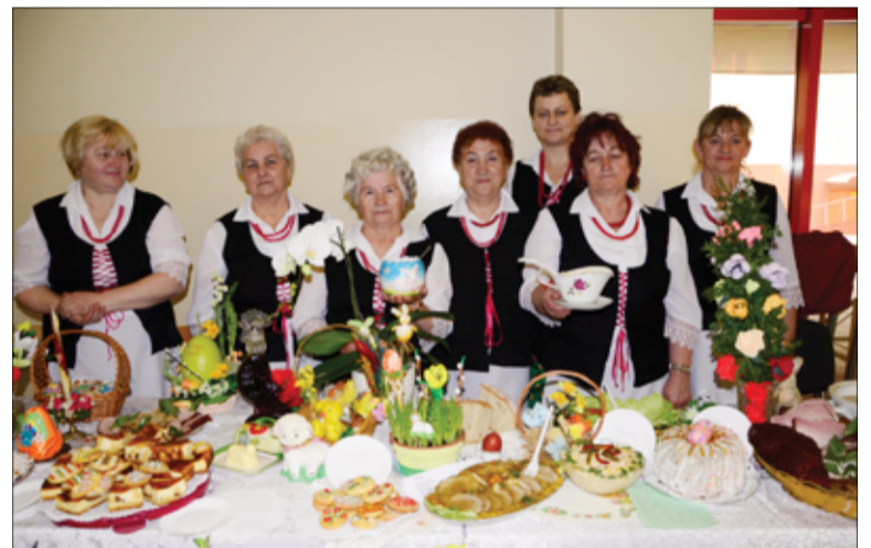
Koła Gospodyń Wiejskich funkcjonujące na terenie gminy Żarów również mogą ubiegać się o wsparcie finansowe na swoją działalność. Na zdjęciu panie z KGW Imbramowice.

By sięgnąć po wsparcie z ARiMR, które jest finansowane z budżetu państwa, koło musi być zarejestrowane w Krajowym Rejestrze Kół Gospodyń Wiejskich. Teraz figuruje w nim 9124 organizacji tego typu. Najwięcej w województwach wielkopolskim – 1380 kół, lubelskim – 1182 i mazowieckim – 1173. Wysokość pomocy dla koła uzależniona jest od liczby jego członków. I wynosi: 3 tys. zł – dla koła liczącego nie więcej niż 30 członków, 4 tys. zł – jeśli koło liczy od 31 do 75 członków i 5 tys. zł – w przypadku, gdy koło tworzy ponad 75 osób. Koła gospodyń wiejskich, które chcą działać w oparciu o ustawę nadającą im osobowość prawną, umożliwiającą prowadzenie działalności gospodarczej i dostęp do państwowych dotacji, mogą powstawać nie tylko na wsiach. Mogą być one tworzo-