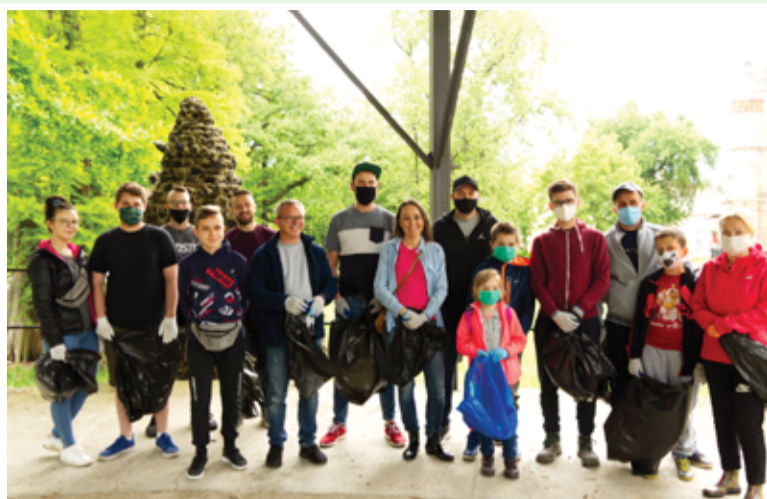
Wspólne zdjęcie uczestników akcji „Tylko liście mogą leżeć w parku”.