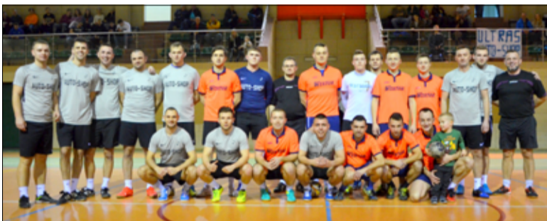
Wektor Świdnica – AUTO SHOP Żarów finalistami Żarowskiej Ligi Futsalu Electrolux Cup

AUTO-SHOP Żarów po raz pierwszy sięgnął po tytuł mistrza Żarowskiej Ligi Futsalu Electrolux Cup. O zwycięstwie zdecydował dopiero konkurs rzutów karnych. Piłkarze okazali się lepsi od