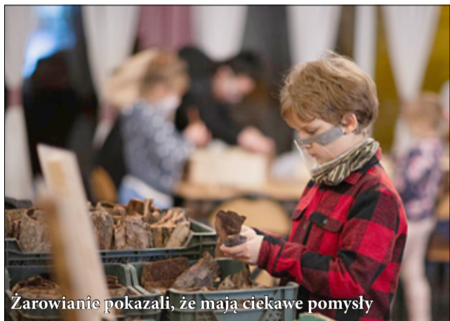
Żarowianie pokazali, że mają ciekawe pomysły

do wspólnego tworzenia kultury. Mówiąc krótko, udało się! Dzięki dofinansowaniu, jakie GCKiS otrzymało ze środków Narodowego Centrum Kultury w ramach programu Dom