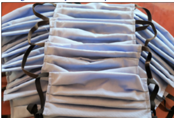
Seniorzy gminy Żarów w wieku powyżej 60 roku życia otrzymali bezpłatnie maseczki ochronne. Zakup maseczek został sfinansowany ze środków pochodzących z budżetu gminy oraz ze środków przekazanych przez radnych Rady Miejskiej w Żarowie.