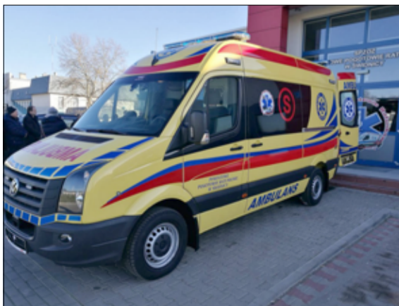
Burmistrz Leszek Michalak podjął decyzję w 2020r. o przekazaniu z budżetu gminy Żarów pomocy finansowej w wysokości 10.000 złotych na zakup najbardziej potrzebnych środków ochrony osobistej dla ratowników medycznych pogotowia w Świdnicy.