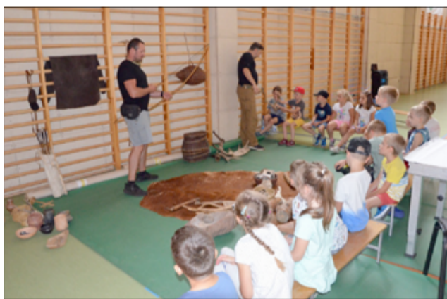
GCKiS było także organizatorem wakacyjnych półkolonii dla najmłodszych mieszkańców

Nasi animatorzy pojawili się w wielu miejscach na terenie gminy Żarów. Pozwolił im odkryć wiele zapomnianych gier i zabaw. GCKiS na dużą skalę zorganizowało