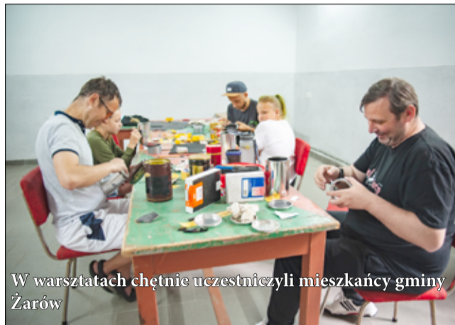
W warsztatach chętnie uczestniczyli mieszkańcy gminy Żarów

Pod takim hasłem zespół Gminnego Centrum Kultury i Sportu w Żarowie przystąpił do realizacji projektu, którego celem było zaproszenie mieszkańców gminy