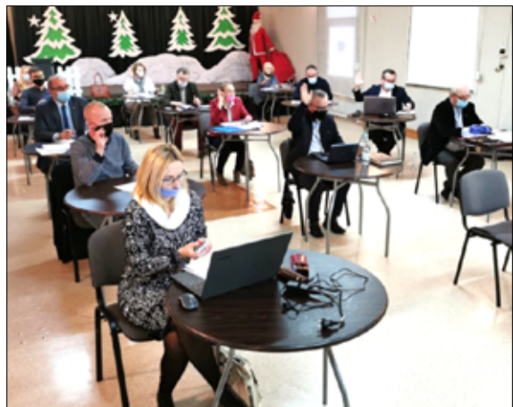
To jedno z najważniejszych posiedzeń w ciągu roku, na którym radni decydują o uchwaleniu budżetu na nowy rok.

Radni Rady Miejskiej przyjęli go jednogłośnie, choć podczas posiedzenia nie brakowało dyskusji nad omawianym projektem uchwały