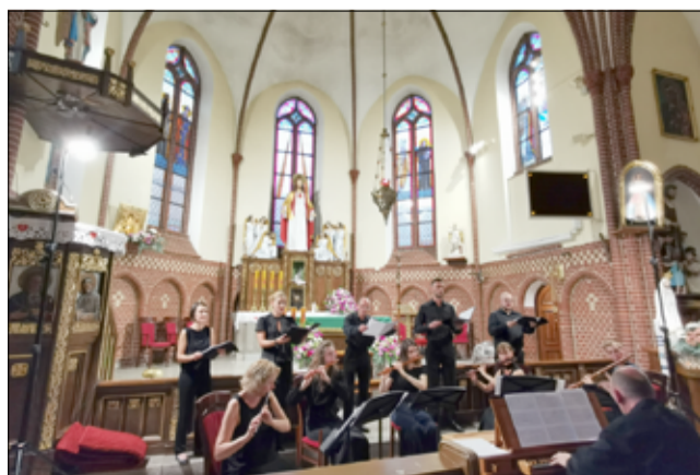
Letnie koncerty w ramach Festiwalu w 2020 r. odbyły się w Kościołach w Żarowie, Pożarzysku oraz Zastrużu

Po raz kolejny zagościł w naszej gminie. Melomani mogli uczestniczyć w trzech koncertach Żarowie, Zastrużu i Pożarzysku. Letnie koncerty w ramach