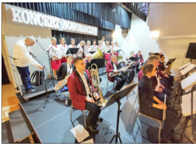
Kolędy i pastorałki zaprezentowali podczas koncertu Krukowanie i Żarowska Orkiestra Dęta

Mimo złego czasu dla teatrów działał i wystawiał spektakle, kiedy obostrzenia jeszcze na to pozwalały. Na początku roku udało nam się zorga-