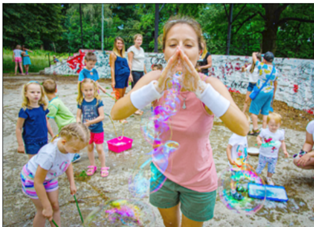
Wakacyjne projekty GCKiS

Wakacje to był dla Gminnego Centrum Kultury i Sportu bardzo intensywny okres. Po raz pierwszy zorganizowaliśmy akcję Lato przy trzepaku.