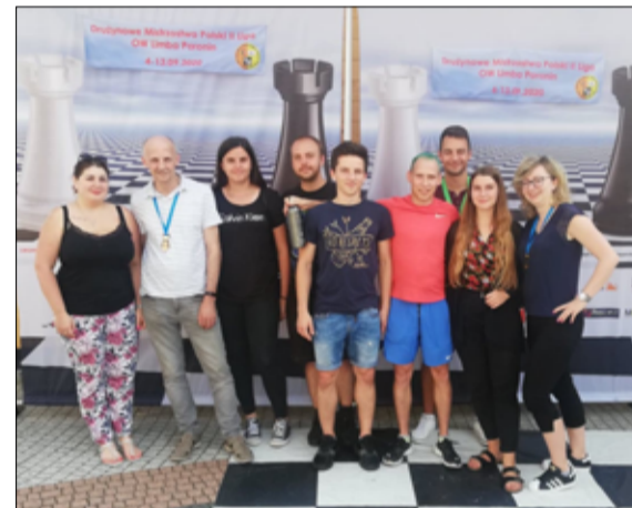
Czwarty raz z rzędu Goniec Żarów wywalczył utrzymanie w II Lidze szachowej