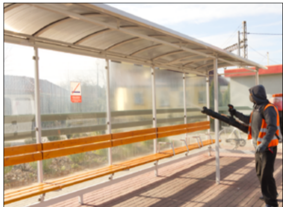
Na polecenie Burmistrza Miasta Żarów strażacy z jednostek Ochotniczej Straży Pożarnej w Mrowinach oraz Żarowie i pracownicy żarowskiej Spółdzielni Socjalnej „Raz Dwa Trzy” włączyli się w akcję dezynfekowania przystanków autobusowych, wiat oraz koszy ulicznych.