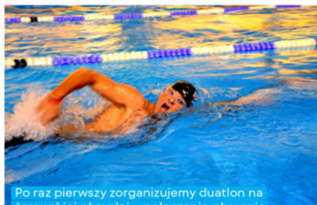
Po raz pierwszy zorganizujemy duatlon na żarowskiej pływalni – połączenie pływania i jazdy na rowerze. Obecność obowiązkowa!