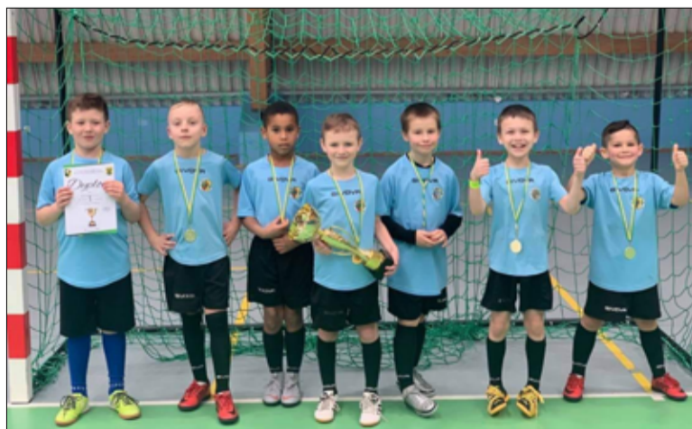
Turniej rocznika 2014 zakończył się zwycięstwem Silesii Żarów.

W Złotorzy do rywalizacji przystąpili piłkarze z rocznika 2014. W fazie grupowej przyszło się zmierzyć reprezentantom żarowskiego klubu z trzema drużynami: Silesia Żarów – Lotnik Jeżów Sudecki 1:0 (bramka: Janes), Silesia Żarów – Górnik Złotorzja 3:3 (bramki: Janes, Wołkanowski, Legiejew), Silesia Żarów – FA Chojnów 14:0 (bramki: Garbacz 4, Wojda 3, Legiejew 3, Janes 2, Sobel). W półfinale żarowianie odnoszą zwycięstwo 3:2 nad Zagłębiem Lubin (bramki: Sobel, Wołkanowski, Janes). Finałowe starcie z FA Legnica zakończyło się wygraną 3:0 (bramki: Sobel, Wołkanowski, samob.). Tym samym mali piłkarze unieśli w górę Puchar Burmistrza Złotorzy za zwycięstwo w całym turnieju. Skład: Antoni Wojda, Jakub Wołkanowski, Mikołaj Garbacz, Antoni Marciniak, Wojciech Legiejew, Jan Janes, Gracjan Sobel. Tydzień później na parkiecie hali sportowej w Jaworze zobaczyliśmy zawodników z rocznika 2011. Piłkarze od samego początku ry-