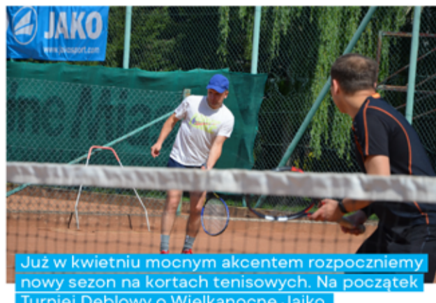
Już w kwietniu mocnym akcentem rozpoczniemy nowy sezon na kortach tenisowych. Na początek Turniej Deblowy o Wielkanocne Jajko.

Właśnie mija 10 lat od powstania klubu cyklistów Old-Spokes, działającego w ramach Gminnego Centrum Kultury i Sportu w Żarowie. Rower kręci i my to lubimy! Nasz jubileusz zorganizujemy we wrześniu.