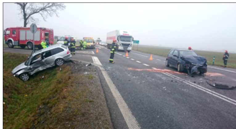
Kierowcy nie owijają w bawełnę i nazywają to miejsce skrzyżowaniem śmierci. Włączenie się do ruchu z drogi powiatowej graniczy z cudem. Wiele osób, zniecierpliwionych długim oczekiwaniem, decyduje się na ryzykowne manewry.