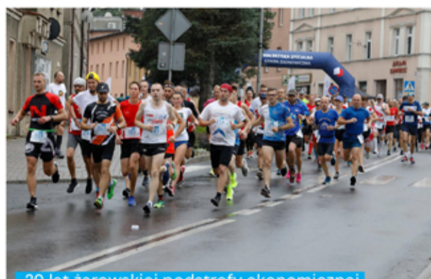
20 lat żarowskiej podstrefy ekonomicznej uczymy 6. Żarowskimi Biegami Strefowymi.

Z wielką przyjemnością zaprosimy dorosłych fanów dwóch kółek na rajd rowerowy. Okazja nietuzinkowa!