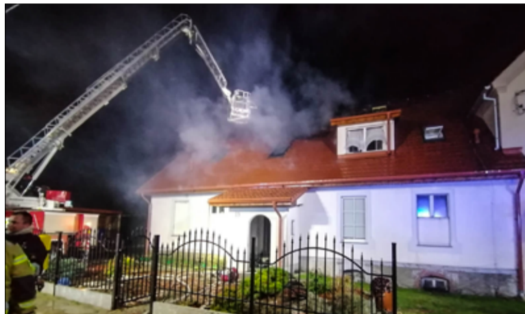
W akcję niesienia pomocy dla pogorzalców z Czernicy aktywnie włączyli się samorządowcy i mieszkańcy gminy Dobromierz. Mieszkańcy gminy Żarów również mogą włączyć się w pomoc dla poszkodowanych rodzin.

liwość dobrych ludzi, którzy wyciągają swoją pomocną dłoń w stronę tych najbardziej potrzebujących. Mieszkańcy gminy Żarów wielokrotnie udowodniali, że mają wielkie serca.