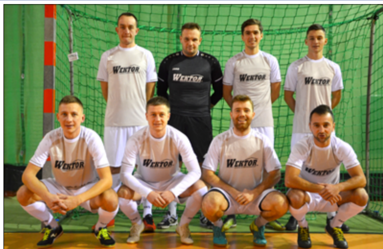
Wektor Świdnica zwycięzcą 13. edycji Electrolux Cup

I tak, po raz piąty w historii rozgrywek triumfują piłkarze Wektor Świdnica. Tym samym świdniccy zawodnicy są pierwszą drużyną, której ta sztuka udało się pięciokrotnie. Wyprzedzili w tej klasyfikacji KKZ Zaskoczonych Żarów. Wektor nie miał sobie równych, odnosząc komplet zwycięstw. Podium pierwszej Ligi Electrolux Cup uzupełnili Cannabis oraz beniaminek Wierzbianka Wierzbna. Sensacyjnie na ostatnim miejscu sezonu zakończył ubiegłoroczny triumfator AUTO-SHOP Żarów. Dla żarowian oznacza to, iż w kolejnej edycji rozgrywek będą występować w II lidze Electrolux Cup. Jeśli już mowa o drugoligowcach, to tytuł mistrzowski i awans dla debiutujących piłkarzy Zebra Team. To nie koniec emocji związanych z Żarowską Ligą Futsal Electrolux Cup. O ile sytuacja epidemiologicz-