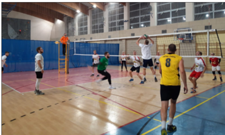
Każdego roku wspieramy kluby sportowe w ich działaniach, niezależnie od ich wielkości czy rodzaju prowadzonej aktywności.