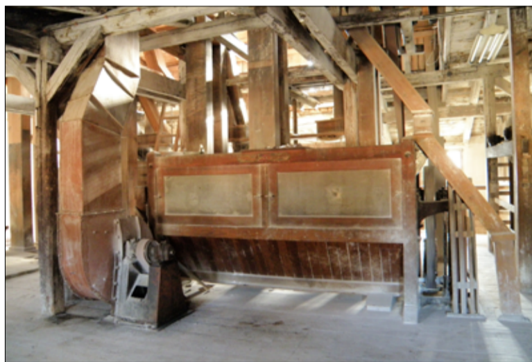
Wystarczy wejść do środka – to miejsce ma poprostu swój urok i klimat.