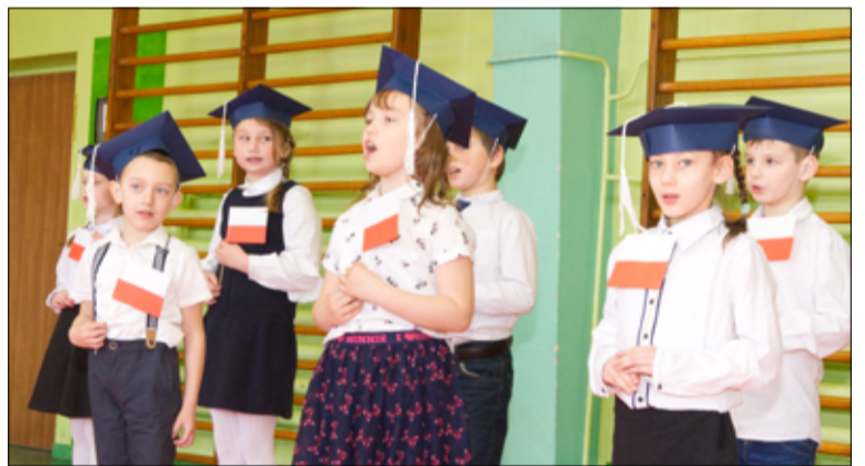
Najważniejszym momentem uroczystości było złożenie przez dzieci ślubowania oraz pasowanie, którego dokonała dyrektor szkoły.

do grona naszej szkolnej społeczności. Życzymy najmłodszym uczniom powodzenia na nowej drodze edukacji. Wierzymy, że w naszej szkole odnajdziecie bezpieczną i twórczą przestrzeń do rozwijania swoich pasji i talentów. Samych sukcesów w nauce i niech zdo-