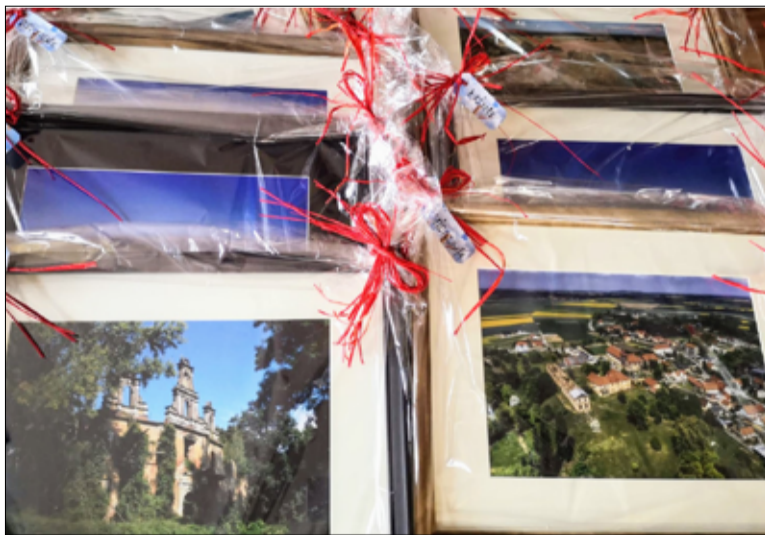
Podarunki dla sołtysów przygotowali pracownicy Referatu Rozwoju Urzędu Miejskiego w Żarowie.

sku, Pyszczyń, Siedlimowicach, Wierzbnej i Zastrużu, funkcję sołtysa pełnią mężczyźni. W Dniu Sołtysa wszyscy gospodarze wsi