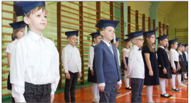
Mimo małej tremy nasi najmłodszy uczniowie zaprezentowali zdobyte umiejętności, zdając pierwszy egzamin na ucznia.

Uczniowie pierwszych klas Szkoły Podstawowej im. Jana Brzechwy w Żarowie są już pełnoprawnymi uczniami.