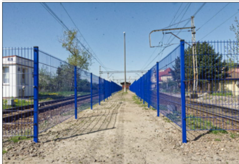
Tymczasowa droga dojścia do peronu została wyznaczona przez PKP. Podróżni również z niej korzystają.

je w spójną całość tak, aby powstał zadowalający efekt końcowy! Tworzenie pięknych rzeczy to wielka frajda. Daje poczucie satysfakcji i pozwala oderwać się od codziennych obowiązków. Jeżeli chcecie przynieść własne elementy pomożemy Wam wkomponować je w wianek. Za interesowanych prosimy o wcześniejszą rezerwację – czytamy na FB Gminnego Centrum Kultury i Sportu w Żarowie. Ilość miejsc ograniczona, termin: 11 czerwca 2021r., godzina: 17.30, miejsce: I p. GCKiS, koszt: 15 złotych. Zapisy i informacje pod nr tel: 531 269 750. Zapewniamy: warsztaty pod okiem instruktora, wszelkie potrzebne materiały, kreatywnie spędzony czas w dobrym towarzystwie.