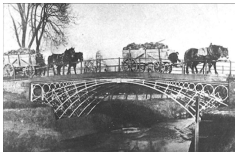
W tym roku mija 225 lat od powstania na Śląsku drogowego mostu na rzece Strzegomka.