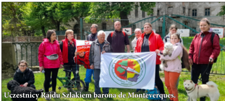
Uczestnicy Rajdu Szlakiem barona de Monteverques.

W sobotę, 22 maja grupa żarowskich turystów wyruszyła w pieszą wędrówkę, której celem była miejscowość Domanice i tamtejszy zamek.