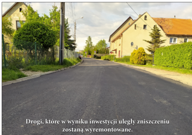
Drogi, które w wyniku inwestycji uległy zniszczeniu zostaną wyremontowane.

Odtworzenie nawierzchni drogowych, regulacja urządzeń kanalizacyjnych na sieciach wodociągowych i uporządkowanie całego terenu to jeden z ostatnich etapów tej inwestycji. Niedogodności drogo-