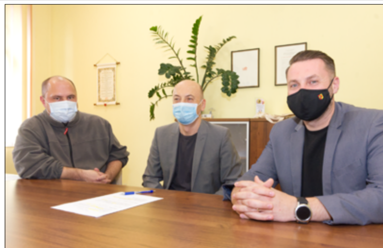
W najbliższych dniach podpisana zostanie umowa o kontynuowaniu współpracy z Politechniką Opolską.