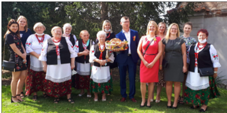
Troszczą się o zwyczaje, wspierają różne inicjatywy i współorganizują wydarzenia. Na zdjęciu członkinie i członkowie KGW Imbramowice.

Koło Gospodyń Wiejskich w Imbramowicach otrzymało dotację z Urzędu Marszałkowskiego Województwa Dolnośląskiego na realizację projektu „Znajdź Swoją Pasję – Kreatywne warsztaty dla dzieci i młodzieży – najmłodszych mieszkańców naszej wsi”.