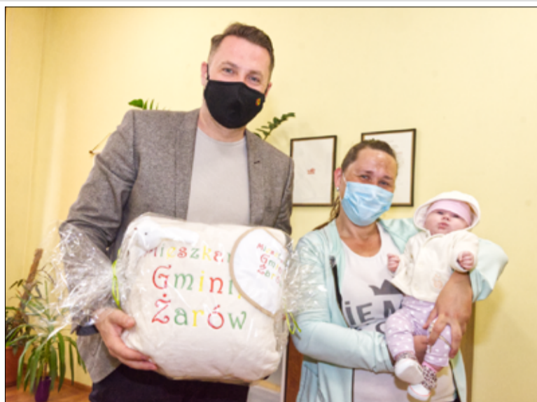
Aby otrzymać „Pakiet powitalny” wystarczy być szczęśliwym rodzicem maluszka, który urodził się w roku 2021, mieszkańcem naszej gminy oraz złożyć w Urzędzie Miejskim w Żarowie poprawnie wypełniony wniosek.