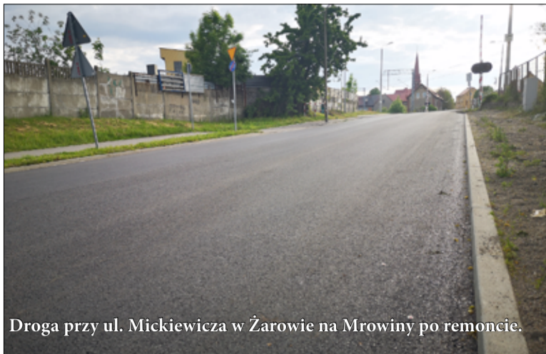
Droga przy ul. Mickiewicza w Żarowie na Mrowiny po remoncie.

– Trwają naprawy dróg na terenie naszej gminy. Ubytki powstałe na nawierzchniach drogowych łatają metodą natrysku grysu z emulsją asfaltową. Prace ruszyły kilka dni temu, a remonty przy kolejnych drogach będą wykonywane sukcesywnie.