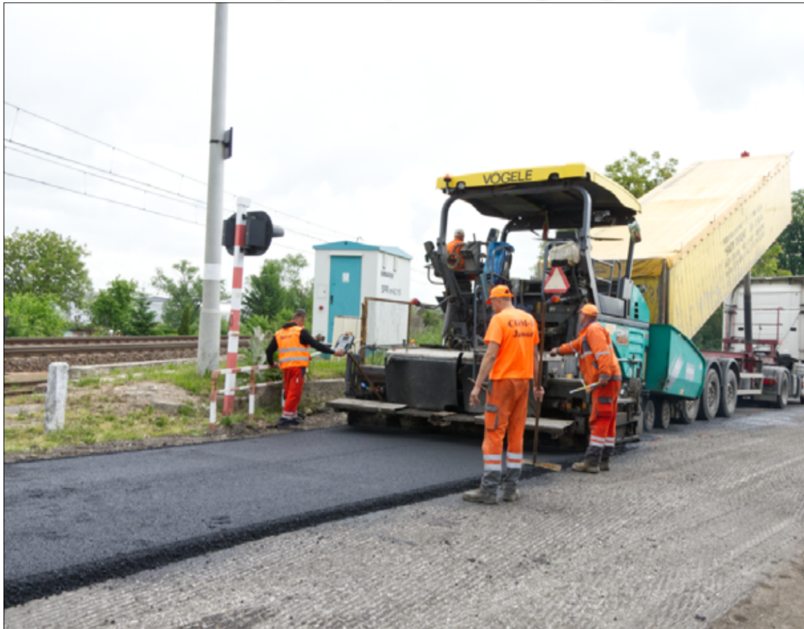
Zniszczony odcinek drogi z Żarowa w kierunku Mrowin został zmodernizowany. więcej na stronie 3.