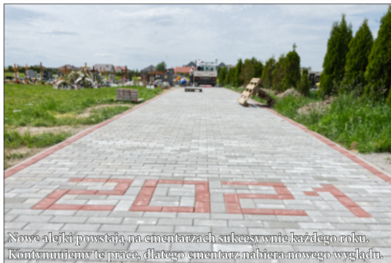
Nowe alejki powstają na cmentarzach sukcesywnie każdego roku. Kontynuujemy te prace, dlatego cmentarz nabiera nowego wyglądu.

Trwa budowa kolejnych alejek na cmentarzu komunalnym w Żarowie.