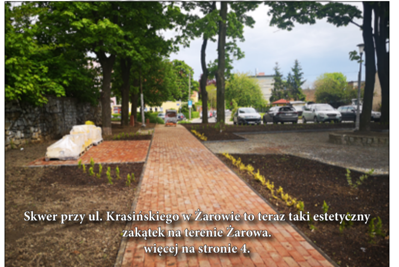
Skwer przy ul. Krasieńskiego w Żarowie to teraz taki estetyczny zakątek na terenie Żarowa. więcej na stronie 4.