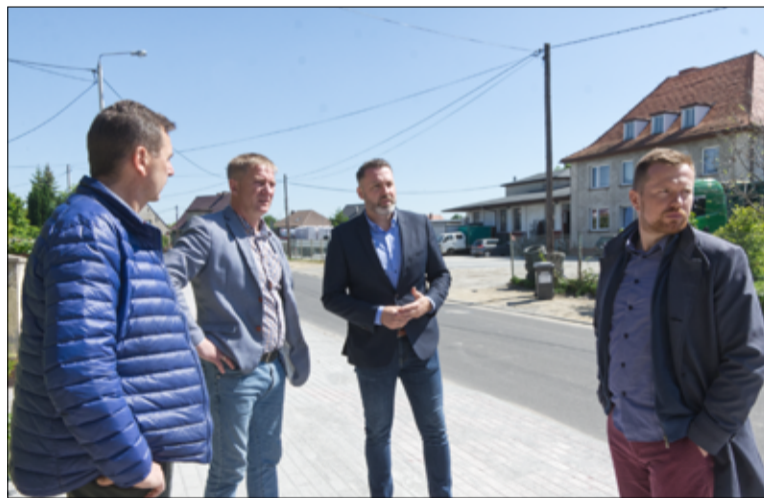
Ścieżka została oficjalnie odebrana i udostępniona naszym mieszkańcom.

Koszt budowy ścieżki pieszo-rowerowej to kwota ponad 400 tysięcy złotych. Inwestycja została sfinansowana z dodat-