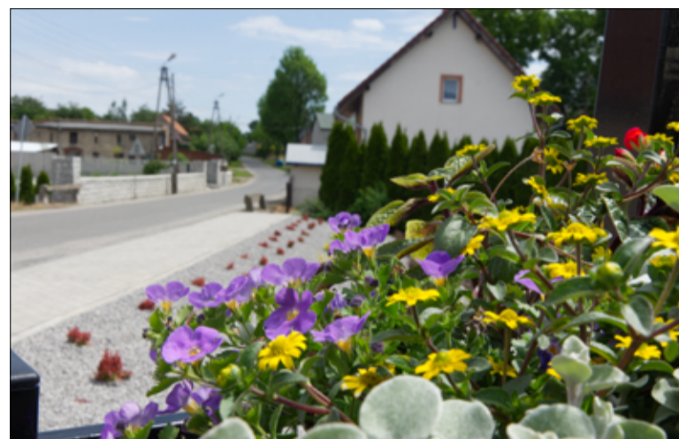
Przy skwerze postawiono donice z wiosennymi nasadzeniami kwiatów.

racyjnym całą zagospodarowaną przestrzeń. Efekt końcowy robi wrażenie. Serdeczne podziękowania dla mieszkań-