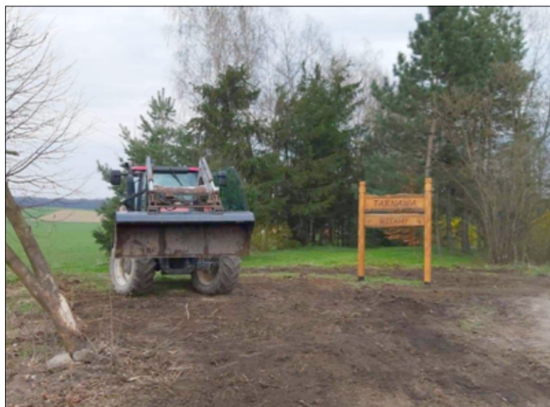
Prace społeczne realizowane były także na terenie Tarnawy.

– Nasze wsie z roku na rok stają się piękniejsze. To dzięki wspólnej pracy udaje się zreali-