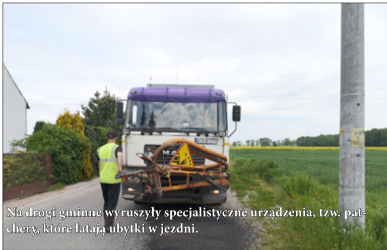
Na drogi gminne wyruszyły specjalistyczne urządzenia, tzw. patchery, które łatają ubytki w jezdni.