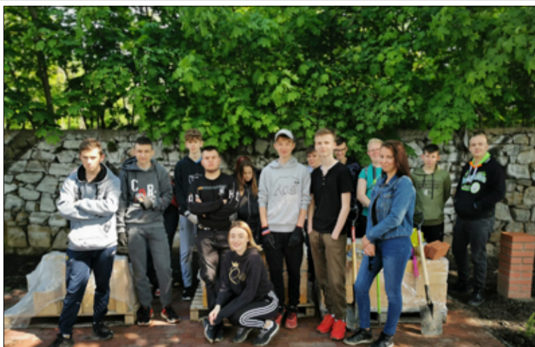
W akcję sadzenia nowych nasadzeń zaangażowali się także uczniowie Zespołu Szkół w Żarowie.

– Uczniowie naszej szkoły wzięli udział w ekologicznej akcji, która prowadzona jest na skwerze przy ul. Krasińskiego w Żarowie. Młodzież z dużym poświęceniem wyko-