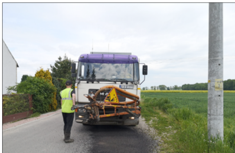
Dzięki nowym inwestycjom ulica Słowiańska zyskała nowy wizerunek.

kowych pieniędzy, które gmina Żarów otrzymała z Rządowego Funduszu Inwestycji Lokalnych w ramach środków Funduszu