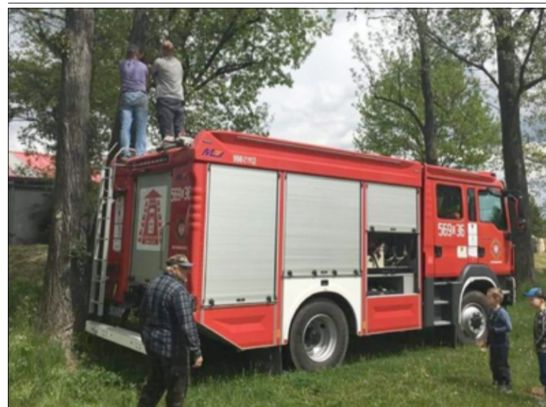
Budki lęgowe dla ptaków strażacy ulokowali na drzewach.

zować tak wiele. Gratulujemy sołtys Imbramowic i Tarnawy oraz zaangażowanym mieszkańcom udanych społecznych projektów. Cieszymy się, że mieszkańcy dbają o swoje