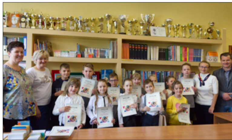
Laureaci V Konkursu Pięknego Czytania wraz z organizatorami.

Szkoła Podstawowa im. Jana Brzechwy w Żarowie wybierała mistrzów pięknego czytania.