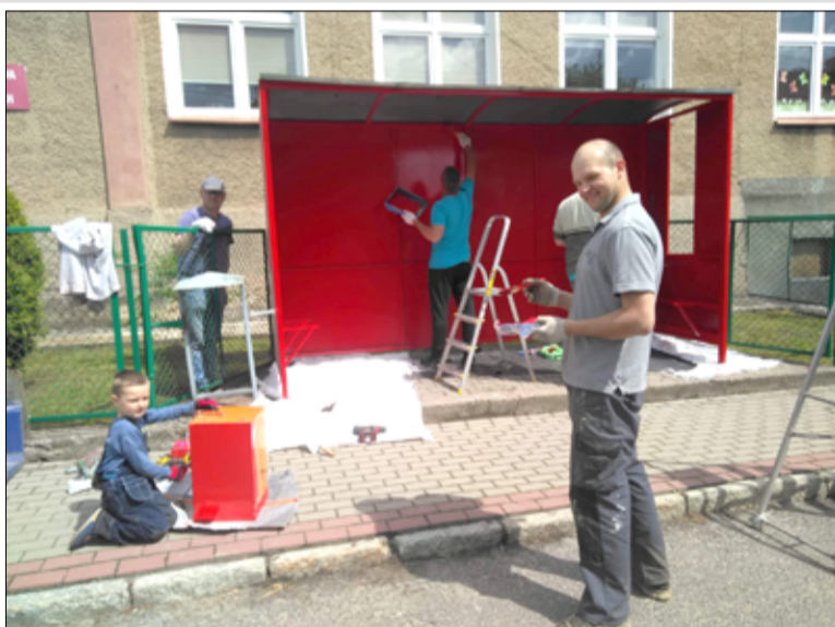
Odmalowany przystanek autobusowy w Imbramowicach.

Są zawsze chętni do pomocy i dbają o piękny wygląd miejsc, w których mieszkają. Mieszkańcy Imbramowic oraz Tarnawy wspólnie dbają o rozwój swoich małych społeczności lokalnych. W ramach przedsięwzięcia „Sprzątamy nasze sołectwo” mieszkańcy przeprowadzili akcję porządkowania swoich miejscowości. Wysprzątany został plac przed „arkadami”, miejsce za świetlicą wiejską i przy krzyżu pokutnym, ulica Rybacka w Imbramowicach i teren przy „witaczu” w Tarnawie. Ponadto, przy ul. Rybackiej zasiana została łąka kwietna oraz postawiono domki dla pożytecznych owadów. Gospodynie z Koła Gospodyń Wiejskich, oprócz zaangażowania w organizację warsztatów dla