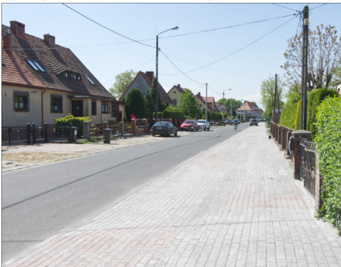
Mieszkańcy mogą korzystać z nowej nawierzchni ścieżki pieszo-rowerowej przy ul. Słowiańskiej w Żarowie. więcej na stronie 3.