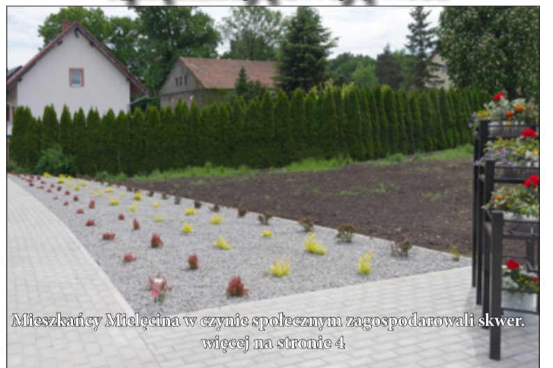
Mieszkańcy Mielecina w czynie społecznym zagospodarowali skwer. więcej na stronie 4