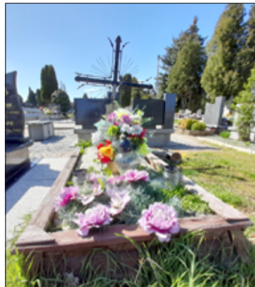
Miejsce spoczynku ś.p. Janiny, Bolesława i Barbary Kosteckich na cmentarzu w Żarowie.

zaplanowane działania związane z przywracaniem pamięci miejscem zlokalizowanym w swojej najbliższej okolicy. Kwota budżetu przeznaczona na realizację działań, po zapoznaniu się z wnioskami, została zwiększona przez